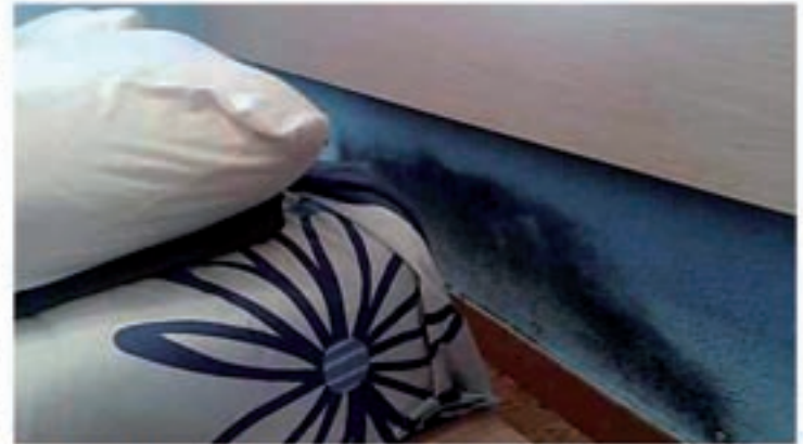
Problemas de humedad por capilaridad

Se han realizado estudios científicos sobre adolescentes que sufren afecciones respiratorias, dando como resultado un 83% de asma, bronquitis asmáticas y bronquitis crónicas y un 87% de rinitis crónicas, que alcanzan a jóvenes que viven en habitaciones demasiado húmedas. De un 20 a un 30% de nosotros sufrimos alergias respiratorias, ¡dos veces más que hace 20 años!. Edouard Drouhet,