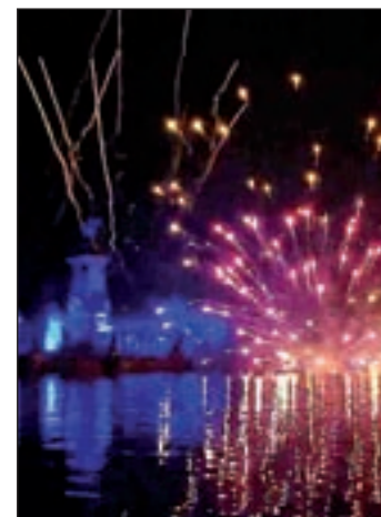
El espectáculo en El Retiro

Entre ellas, destacan el espectáculo piromusical en el parque de El Retiro (sábado y domingo, 22:30 horas), los conciertos de música clásica en el Templo de Debod, (de sábado a lunes, 20:30 horas) o el espectáculo 'Para bailar salsa' de la Plaza Sánchez Bustillo, junto al Museo Reina Sofía (el sábado, 19 horas).