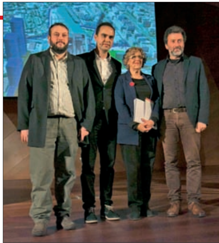
Presentación de Puerta Norte

remodelación de la estación de Chamartín, que pretenden iniciar a finales de 2017, siempre que haya un acuerdo con el Ministerio de Fomento. En torno a ella se establecería un Centro de Negocios ligado a las Cuatro Torres, que podría albergar nuevos rascacielos. También se incluye en esta primera fase la mejora del nudo Norte. La alcaldesa, Manuela Carmena, explicó que estas actuaciones se financiarán "con las plusvalías de los aprovechamientos urbanísticos, por lo que no tendrán ningún coste para las arcas municipales". En la parte norte de la M-30, el objetivo será crear nuevas conexiones tanto para el tráfico rodado como para los peatones