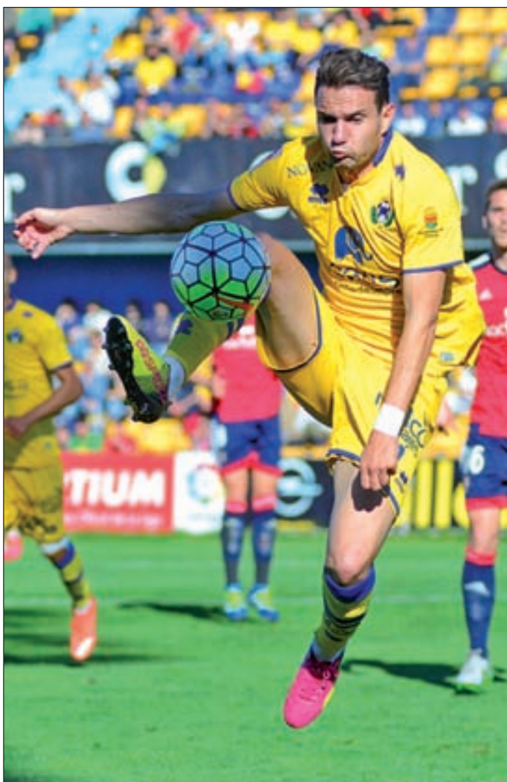
El Alcorcón, en uno de sus encuentros

Las localidades podrán ser adquiridas, en venta anticipada, tanto en las taquillas del Estadio Municipal de Santo Domingo, como en la Sede Social del club.