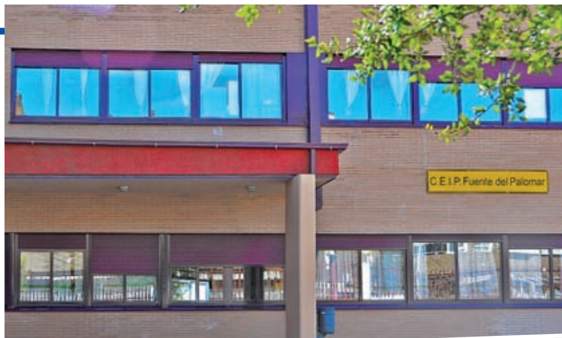
CEIP Fuente del Palomar

desde que, sin responder a criterios pedagógicos ni administrativos, la Dirección de Área Territorial lanza su oferta de plazas en Educación Infantil (3 años), reduciéndolas en estos centros que deberían tener un número suficiente como para completar línea 2, para dos aulas. Esto ya predispone de alguna forma a los padres, y por tanto, facilita la una posible supresión de aulas”, ha incidido. No obstante, los centros afectados, el Federico García Lorca, Fernando de los Ríos, Bellas Vistas, Clara Campoamor, Jesús Valera, Joaquín Costa y Claudio Sánchez Albornoz, han recibido más solicitudes de las inicialmente previstas por la dirección. Por