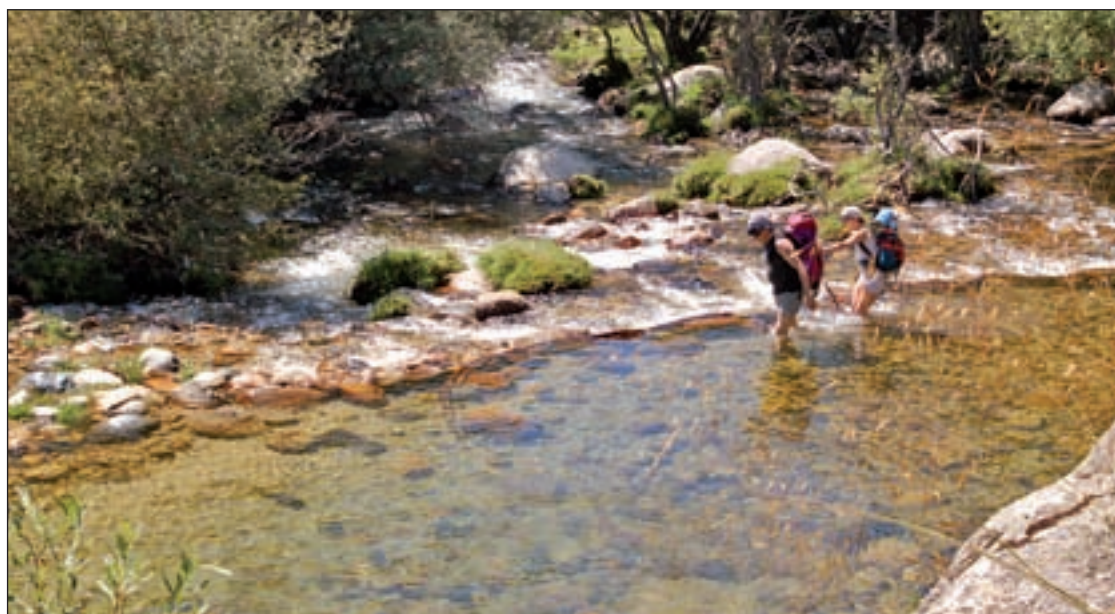
Garganta en la zona de La Pedriza