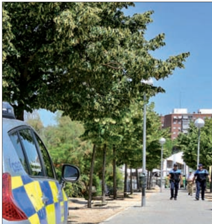
Agentes de la Policía Local patrullando

La Policía Local de Alcorcón intensificó la vigilancia peatonal en la zona Centro, llegando a realizar hasta 98 presencias preventivas durante el mes de abril, con dos agentes en cada salida. Se trata de un operativo puntual integrado dentro de las actuaciones habituales que el efectivo de Proximidad realiza en el municipio. En este caso, responde a una demanda vecinal. "Ésta viene motivada por el hecho de que muchas de esas calles son peatonales y de difícil acceso para los agentes que usan los vehículos oficiales. Tras 20 días de aumentar la vigilancia a pie en la zona, unas 100 horas de servicio, podemos afirmar que no ha habido ninguna incidencia reseñable y que no existen problemas de seguridad", ha explicado a GENTE el jefe de la Policía Local, Eduardo de María. Plazas, parques y zonas de recreo infantil del centro de la ciudad, especialmente en el perímetro que forman las avenidas de Leganés, Móstoles, Oeste y Alcalde de José Aranda, fueron las zonas que recibieron mayor atención. En esta línea, De María ha deta-