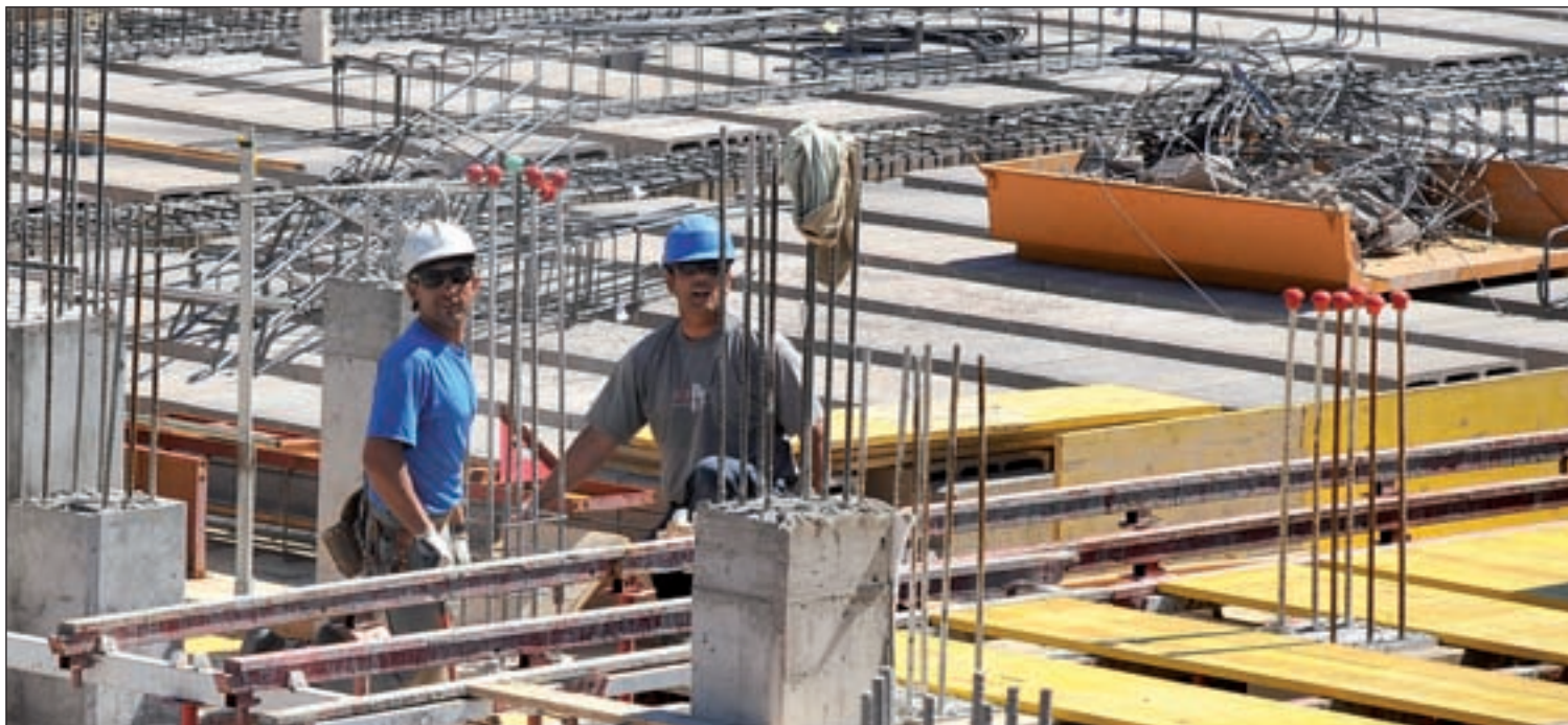
Trabajadores de la construcción en la Comunidad de Madrid GENTE