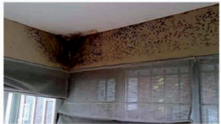
Problemas de humedad por condensación