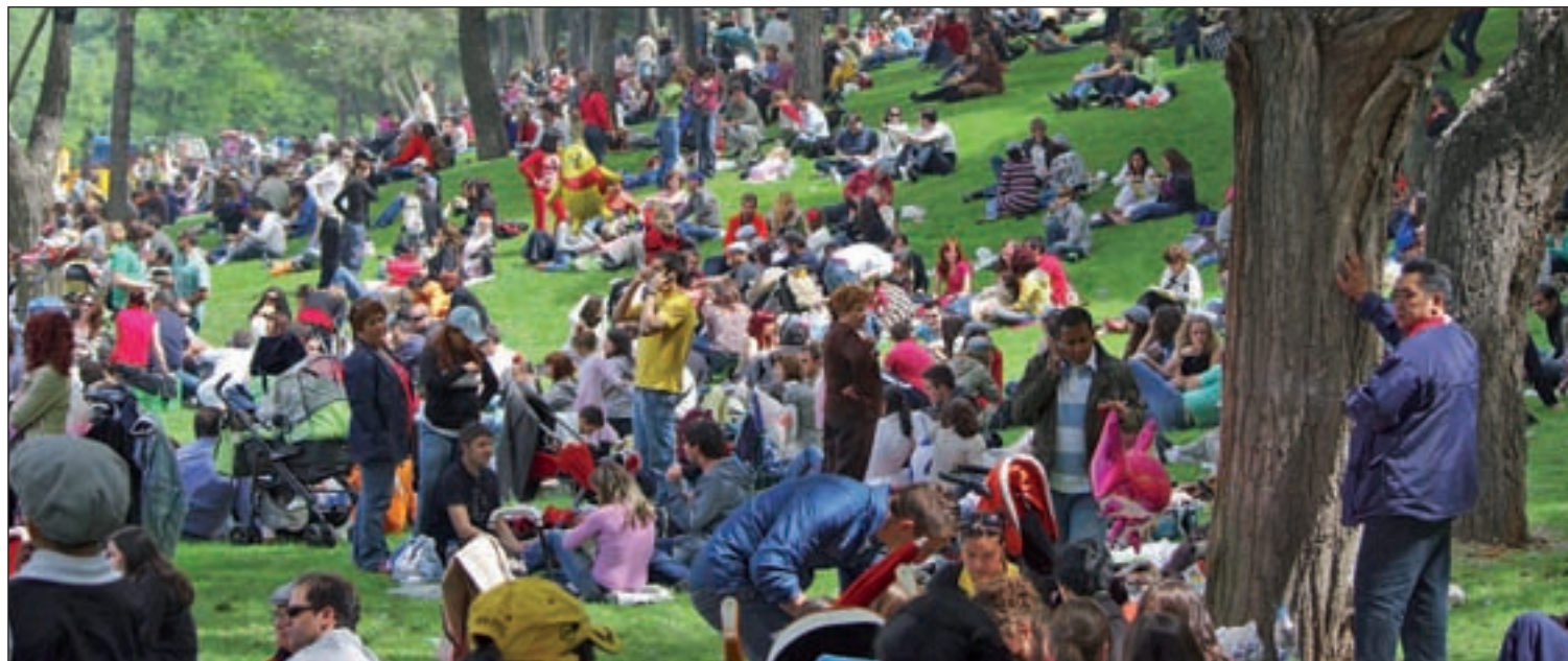
La Pradera, situada entre los paseos de la Ermita del Santo y del Quince de Mayo, volverá a ser el lugar de reunión y esparcimiento