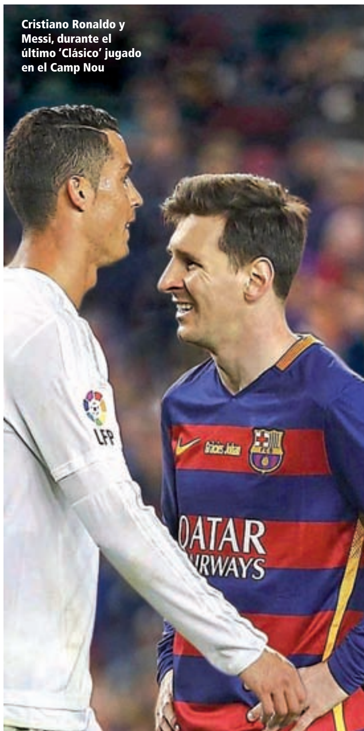
Cristiano Ronaldo y Messi, durante el último 'Clásico' jugado en el Camp Nou