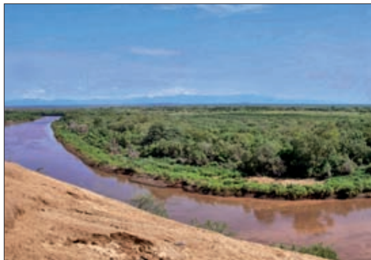
Una de las imágenes de la exposición

Mayo es el mes de las exposiciones en Alcorcón. 'Más allá de la curva del Omo' es el sugerente título de una muestra que acoge el Centro Cultural Margarita Burón. Se trata de fotografías de la artista Luz Montero y piezas de cerámica de los distintos integrantes del colectivo Alcorcón Alfarero. Ambos intentan recoger de algún modo, las tierras del Omo a lo largo de Etiopía y las mujeres mursi. "Con esa medida de su belleza que aporta el plato que llevan colgado de la boca, viajarán hasta el espacio cultural para acercarnos a esta zona del planeta y a sus habitantes indígenas", han explicado desde el centro. Por otro lado, es-