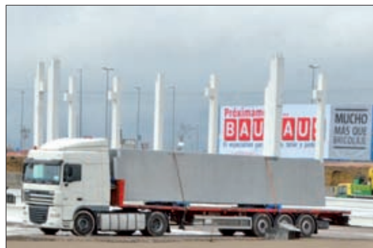
El espacio del PP8 donde se situará el local de bricolaje

Finalmente, el jefe de Policía ha recordado que el municipio tiene 170 agentes de proximidad que patrullan a pie, en bicicleta, moto y coche, además de la Oficina Móvil de Atención al ciudadano, "que diariamente velan por la seguridad de los vecinos".