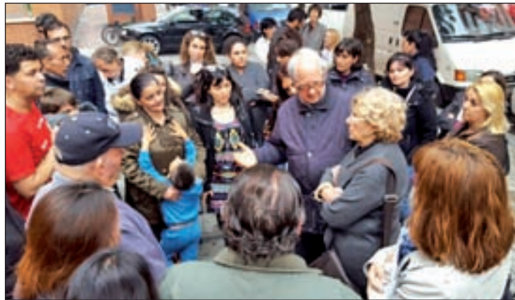
La regidora conversó con varios vecinos del distrito

La regidora visitó el Centro de Mayores Zofío, el Centro Cultural Meseta de Orcasitas, la asociación vecinal del mismo nombre y la zona de La Perla, y mantuvo un encuentro abierto con vecinos en el Albergue San Fermín. En el transcurso del debate, Carmena