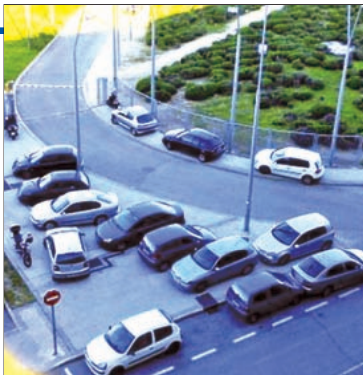
Varios coches sobre las aceras en este barrio de Usera

Esta circunstancia ha propiciado la reacción de la ciudadanía, que, a través de la Asociación Barrio San Fermín, ha puesto en marcha una campaña para que los vecinos reclamen al Consistorio la declaración del barrio como Zona Reservada a sus Residentes durante eventos como el open. Los