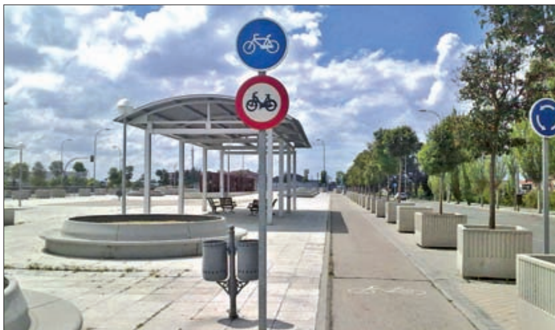
La vía urbana que discurre por encima de las vías del tren y que une Villaverde Alto con el Bajo

Los tres partidos de la oposición coincidieron en el mismo diagnóstico. Están a favor del fomento del uso peatonal de espacios y del deporte, pero consideran que la Gran Vía de Villaverde no está actualmente preparada para acoger iniciativas de este tipo y que precisa una reforma. "Lo que hay que hacer es una acondicionamiento previo, una reforma de verdad. Esperaremos al estu-