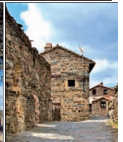
DE ARRIBA A ABAJO: En la primera imagen, el monasterio de San Lorenzo de El Escorial, ubicado a los pies de la sierra de Guadarrama; en la segunda, el Palacio Real de Aranjuez, un emblema de la localidad; abajo a la izquierda, Nuevo Baztán; y a la derecha, los edificios característicos de Patones.