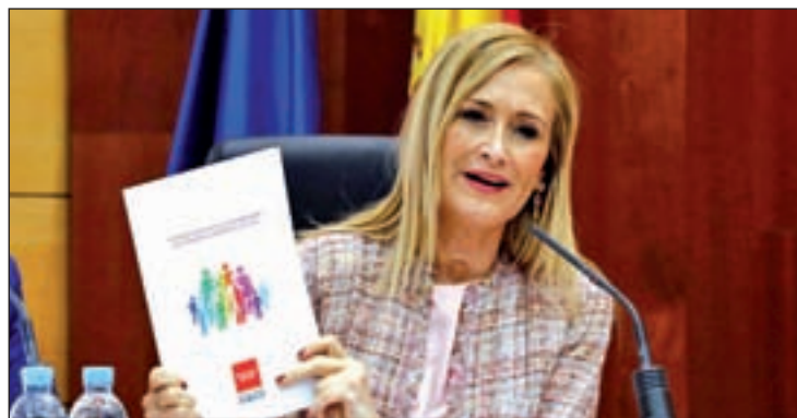
Cifuentes, durante la presentación del plan

presentó esta semana la presidenta regional, Cristina Cifuentes, tras el Consejo de Gobierno. "Es uno de nuestros grandes compromisos electorales y queríamos dejar claro el compromiso del Gobierno en el apoyo de la familia", señaló Cifuentes, que pretende "proteger esta institución".