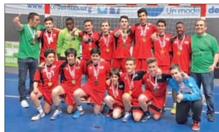
Foto de los campeones

BALONMANO CAMPEÓN EN LA CATEGORÍA INFANTIL