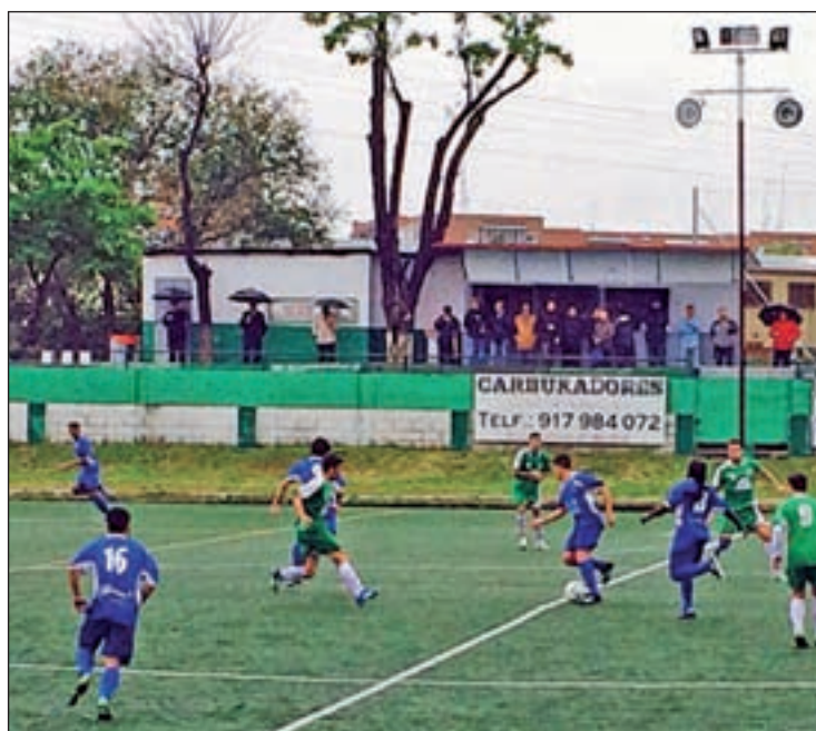
El Montijo arrancó un empate en Villaverde CD PUERTA BONITA