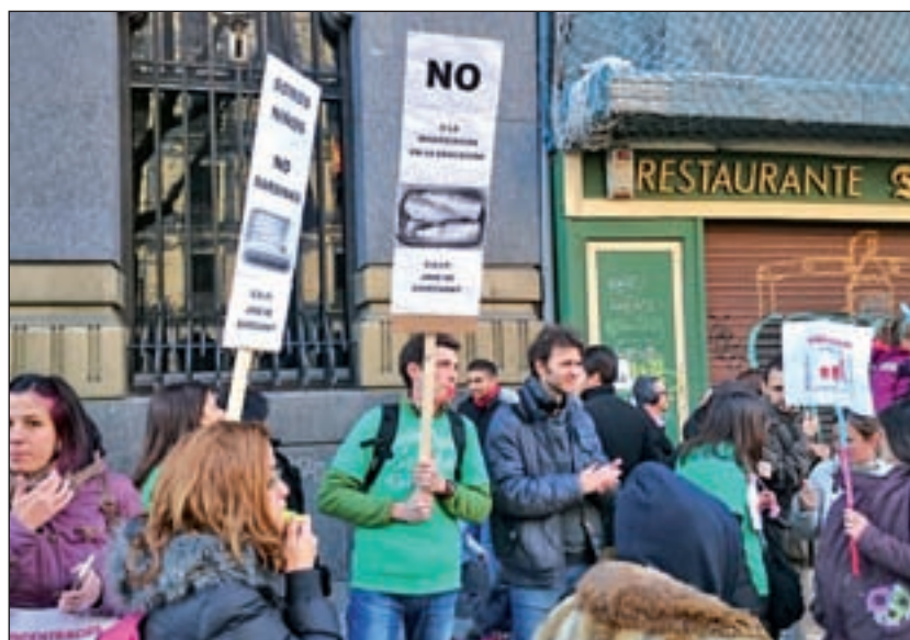
Una de las protestas de los padres del José de Echegaray

Colectivos ciudadanos y AMPAS califican la situación de “in-