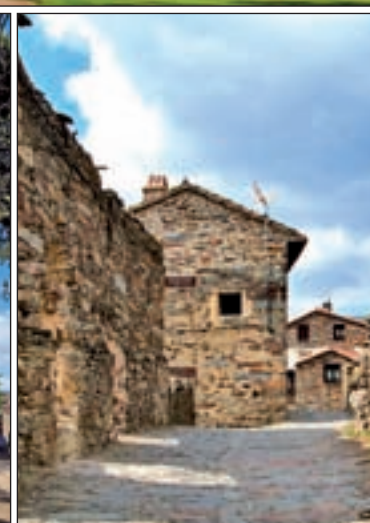
DE ARRIBA A ABAJO: En la primera imagen, el monasterio de San Lorenzo de El Escorial, ubicado a los pies de la sierra de Guadarrama; en la segunda, el Palacio Real de Aranjuez, un emblema de la localidad; abajo a la izquierda, Nuevo Baztán; y a la derecha, los edificios característicos de Patones.