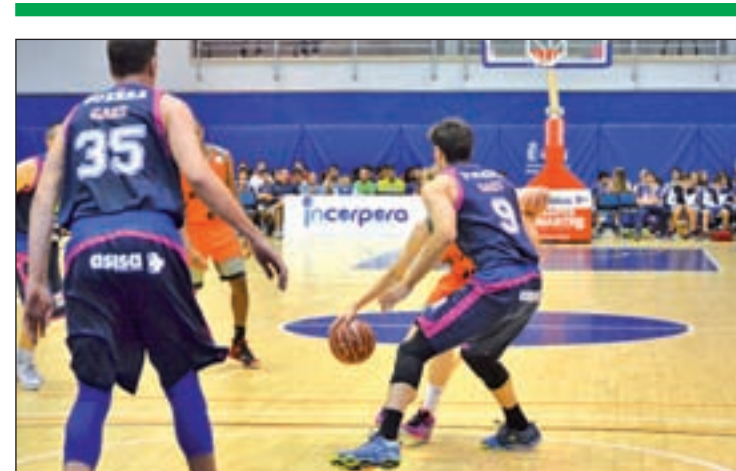
Los colegiales siguen con su mala racha