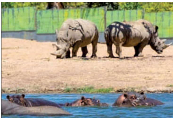
SAFARI MADRID: Rinocerontes, jirafas, elefantes, hipopotamos, cebras, bisontes, osos negros, papiones, leones, tigres y un largo etcétera. Africa queda muy lejos, pero a tan solo 50 Km. de Madrid se pueden observar animales salvajes en libertad desde el coche (siempre que no sea descapotable).

Pero, si lo tuyo no es lo salvaje, más clásica será una visita a El Escorial. Declarado Patrimonio de la Humanidad, el monasterio tardó 22 años en construirse. Incluso podrás sentarte en la roca que mandó construir Felipe II para contemplar las obras. En la misma línea está Aranjuez, declara-