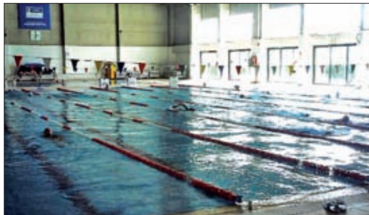
El centro situado en la calle de Reguera de Tomateros