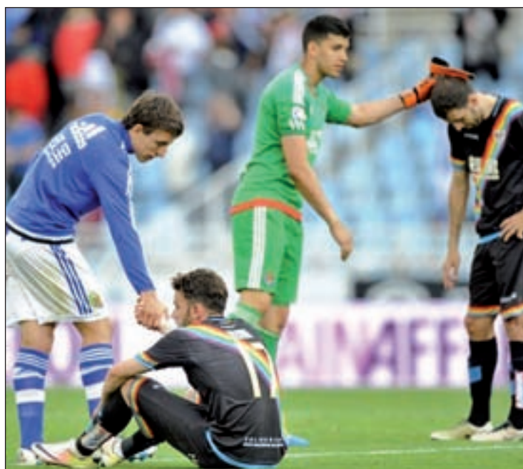
Los franjirrojos se llevaron un duro revés en Anoeta

Por tanto, y a pesar de haber estado muchas semanas fuera de los puestos de peligro, el Rayo llega a esta última fecha necesitado de una carambola para certificar su permanencia en la máxima ca-