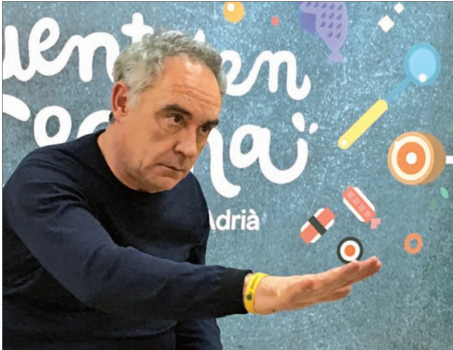
LILIANA PELLICER / GENTE