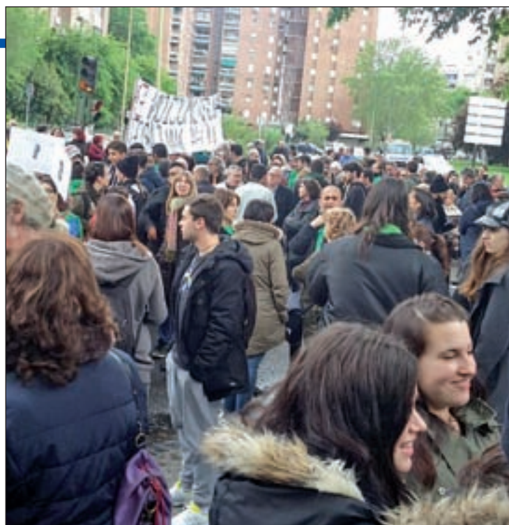
La concentración en Moratalaz, en la plaza del Encuentro

Por su parte, la comunidad educativa del Francisco de Goya (Ciudad Lineal) ha comenzado a movilizarse para defender el ciclo de Electrónica. Esta semana ha organizado diferentes actos en favor de la Escuela Pública. Por último, en el Vallecas I (Puente de Vallecas) las movilizaciones quieren evitar el final de la FP en el IES de la avenida de la Albufera.