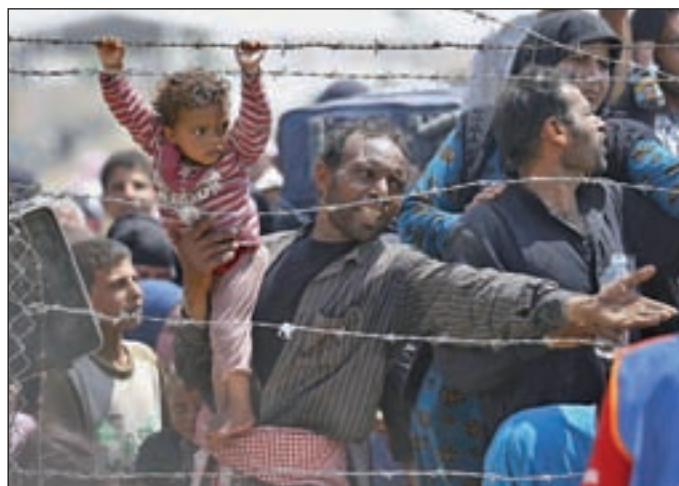
Imagen de la frontera de Siria con Turquía

EL SUCESO SE PRODUJO EN LA FRONTERA DE SIRIA