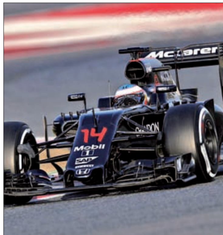
Alonso, durante un test de la pasada pretemporada

En el plano estrictamente deportivo, los representantes españoles han sido noticia en los últimos días por aspectos diferentes. Fernando Alonso ha confirmado que su monoplaça, el MP4-31, contará con importantes mejoras de cara a este Gran Premio de España, unas novedades que se centran sobre todo en el chasis: "Como siempre, la fiabilidad es la principal prioridad, pero espero que las mejoras en el chasis que vamos a probar el viernes nos ayuden a seguir empujando carrera a carrera y nos permitan seguir peleando arriba con nuestros rivales de la zona media", aseguró el asturiano. Eso sí, respecto a sus objetivos se muestra prudente, comenzando por las sesiones de clasificación del sábado 14: "Entrar en la Q3 no va a ser nada sencillo en este circuito, pero, con el apoyo de la afición española, ese tiene que ser nuestro objetivo". Sobre las claves que pueden defi-