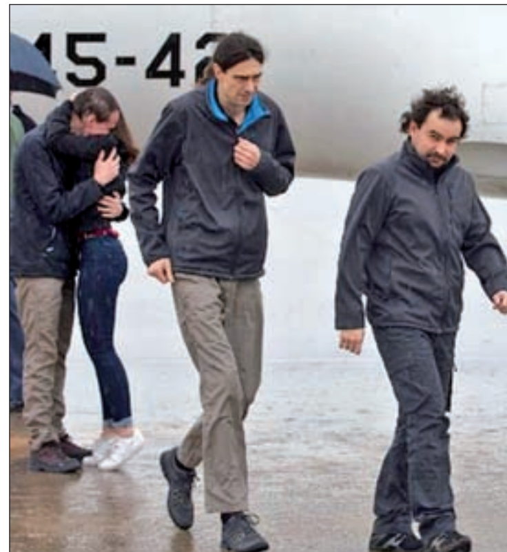
Los periodistas secuestrados a su llegada a Barajas

“La vida te cambia casi en cuestión de horas. Después de estar en Siria casi 10 meses, ahora