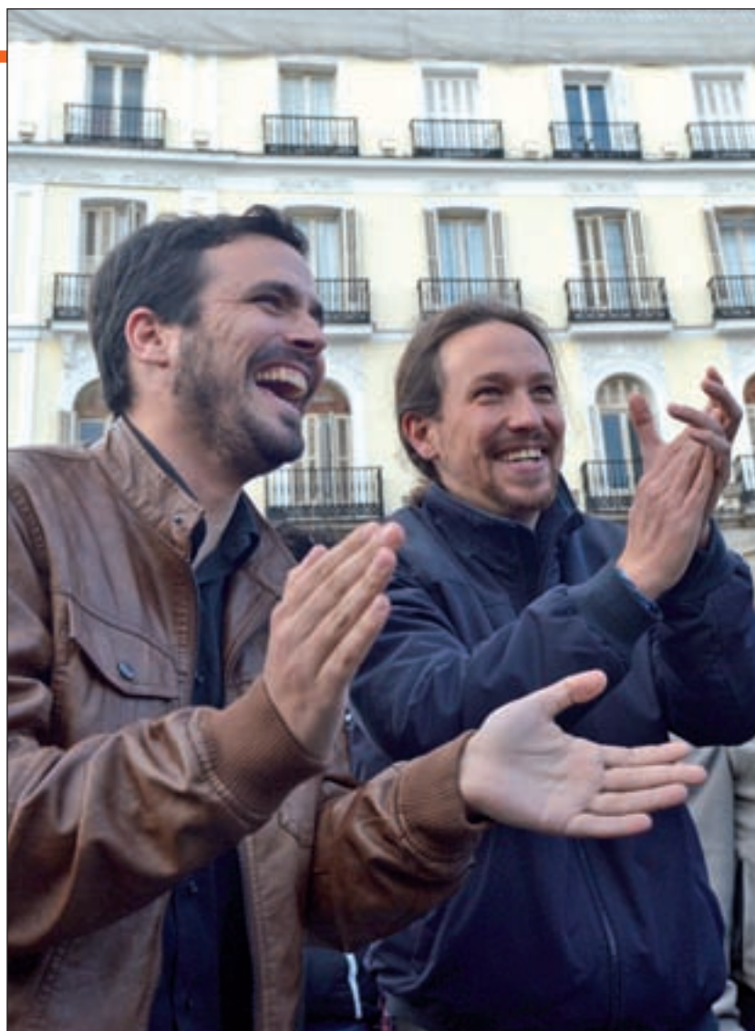
Alberto Garzón y Pablo Iglesias anunciaron el acuerdo

Si se repitieran los resultados del 20-D, la nueva coalición contarían con 14 asientos más en el Congreso de los Diputados al arrebatar 7 al PP, 4 a Ciudadanos, 2 al PSOE y 1 al PNV. Con este nuevo escenario la situación política sería muy similar a la actual, aunque Podemos y sus confluencias se habrían quedado a tan sólo