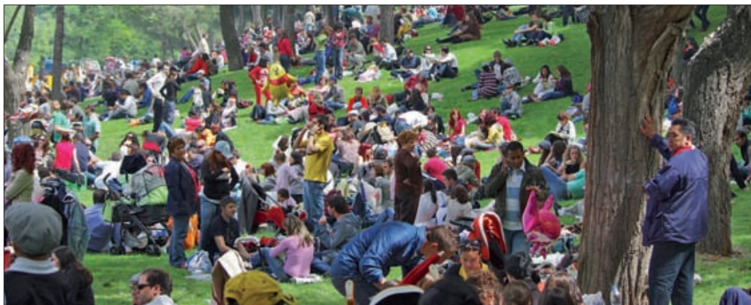
La Pradera, situada entre los paseos de la Ermita del Santo y del Quince de Mayo, volverá a ser el lugar de reunión y esparcimiento