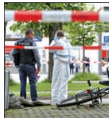
Imagen del cordón policial

ladas a un hombre dentro del tren, que se encontraba parado, y luego atacó a dos ciclistas que estaban esperando en el andén, según las primeras conclusiones de la Policía, que estableció que “la estación es el lugar de un crimen y, por lo tanto, deber ser analizada”, declararon.