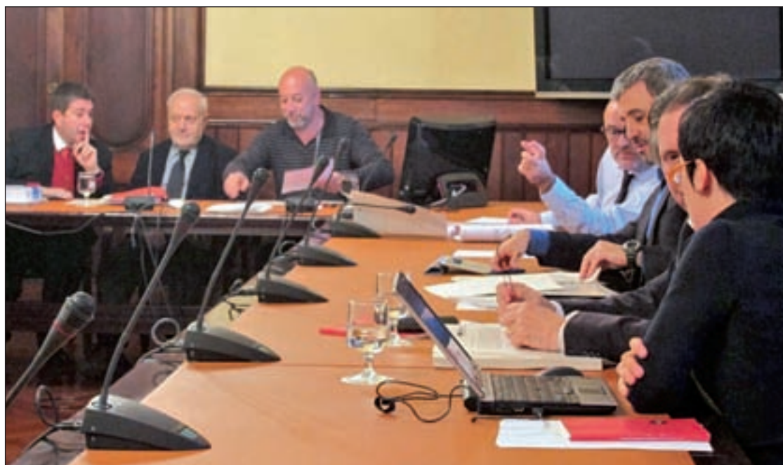
Imagen de la reunión entre los representantes de los partidos políticos

Durante el encuentro, los representantes coincidieron en que el fracaso de los políticos no debe correr a cuenta de los bolsillos de los españoles. Pero las discrepancias entre los grupos llegan a determinar de qué forma se realizará esta rebaja ya que partidos como Podemos y C's apuestan por rebajar el tope de gasto al que