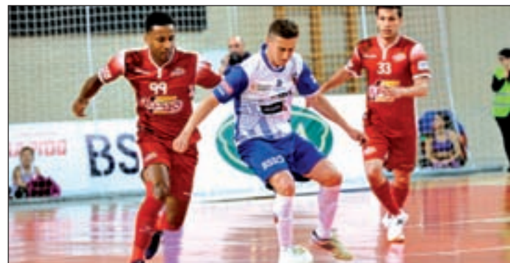
ElPozo, uno de los equipos en clara mejoría

Otro histórico de la competición, ElPozo Murcia, se verá las caras con el Magna Gurpea Navarra con la moral reforzada tras conquistar la Copa del Rey. El otro cruce será Aspil Vidal Ribera Navarra-Palma Futsal.