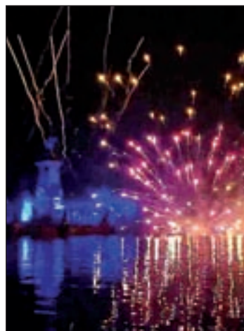
El espectáculo en El Retiro

Entre ellas, destacan el espectáculo piromusical en el parque de El Retiro (sábado y domingo, 22:30 horas), los conciertos de música clásica en el Templo de Debod, (de sábado a lunes, 20:30 horas) o el espectáculo 'Para bailar salsa' de la Plaza Sánchez Bustillo, junto al Museo Reina Sofía (el sábado, 19 horas).