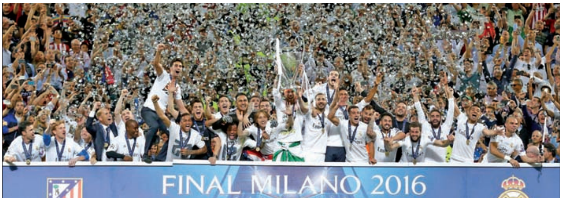
Sergio Ramos fue el encargado de recoger el ansiado trofeo de manos del presidente de la UEFA