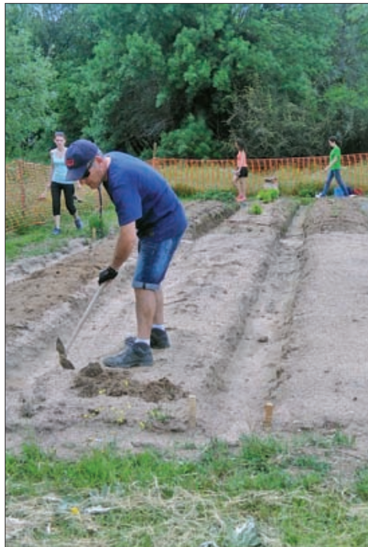
CADA VEZ SON MÁS las personas que se deciden a cultivar una explotación agrícola autónoma basada en la utilización sostenible de los recursos naturales a nuestra disposición. Un sector primario libre de productos químicos

5: Se trata también de uno de los perfiles con mayor demanda en la actualidad. Destacan, por ejemplo, los ingenieros de parques eólicos, ingenieros superiores de plantas termosolares y otros de alta cualificación y tecnológicos.