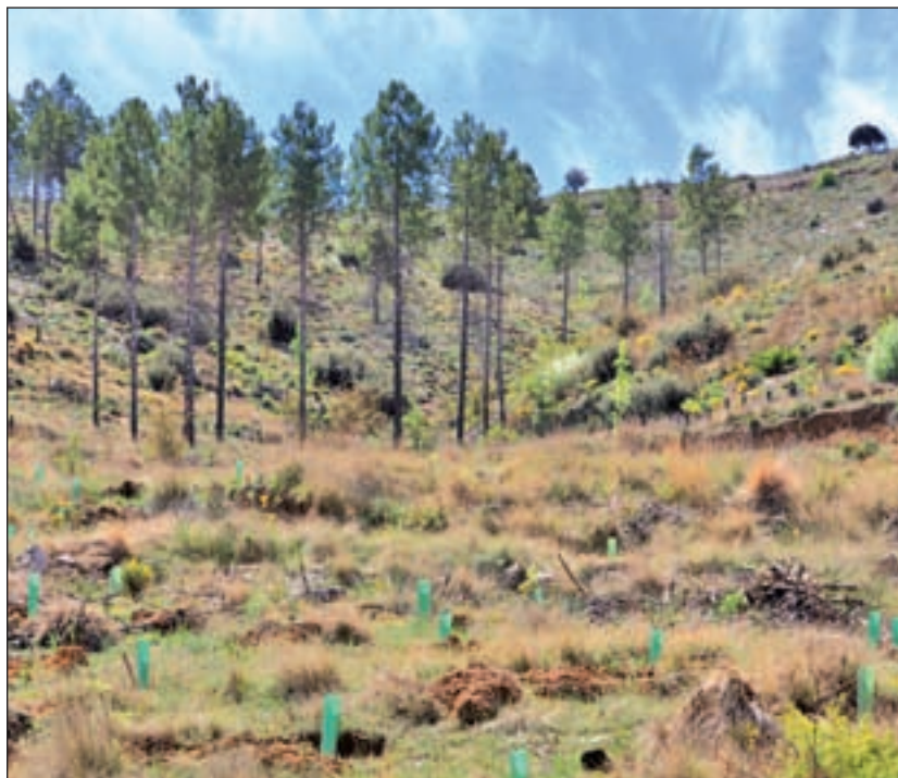
Coca-Cola desarrolla programas de recuperación de espacios naturales

Estos programas dedican recursos con el fin de proteger entornos de gran valor ecológico como pueden ser el Parque Nacional de las Tablas de Daimiel, de la mano de WWF, el manantial de Fuenmayor, en colaboración con Fundación Ecodes, la desembocadura del Río Guadalhorce, donde trabaja con la Universidad de