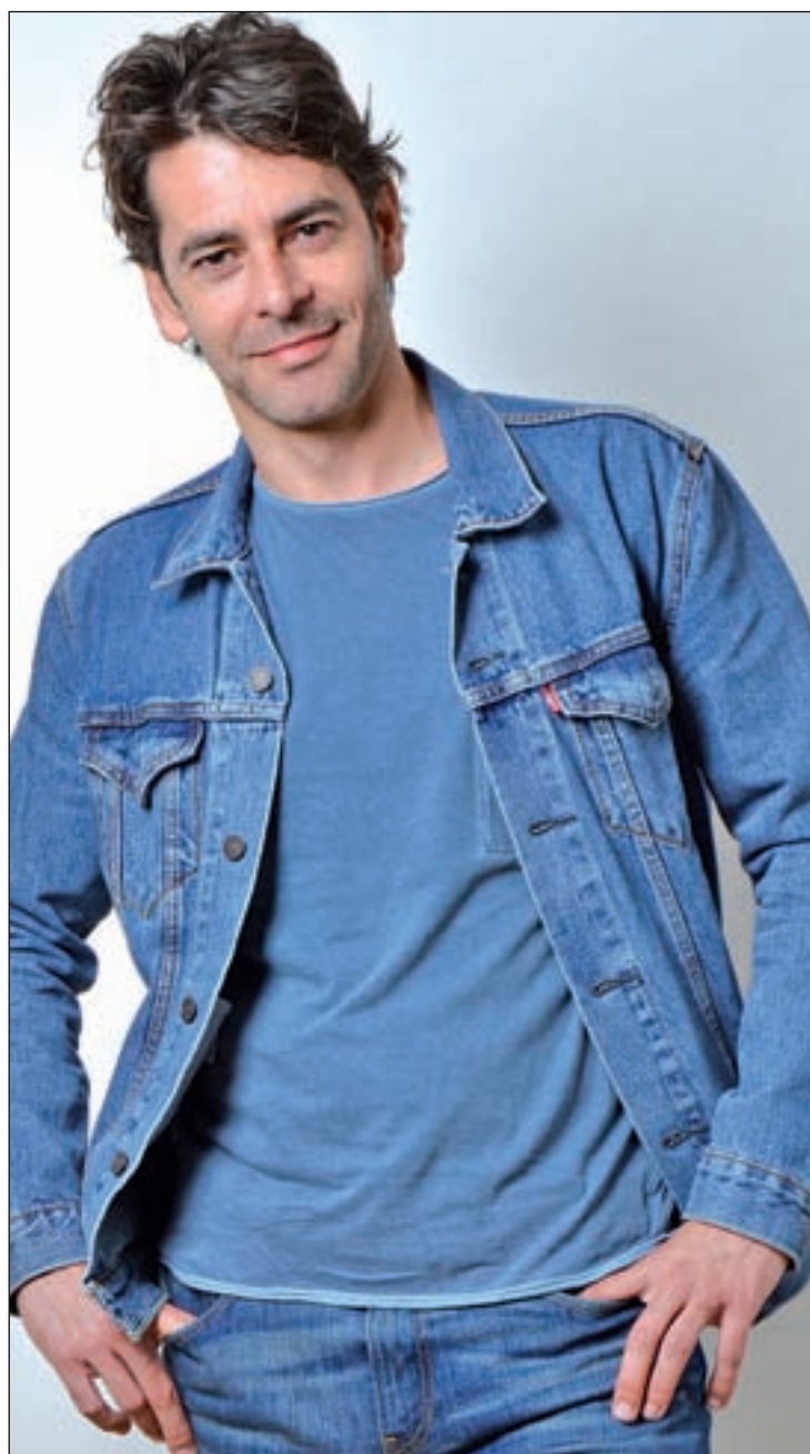
CHEMA MARTINEZ / GENTE

¿Cómo ha sido trabajar de nuevo con Fele Martínez y, por primera