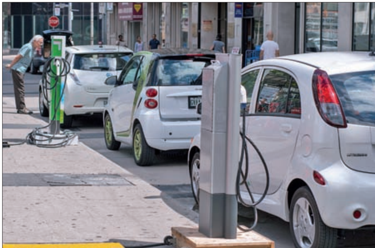
El uso del coche eléctrico no acaba de despegar

A pesar de estar registrando un crecimiento menor de lo espera-