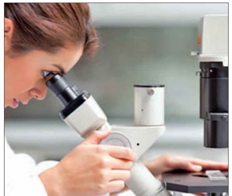
La UNED cuenta en este curso con 3.020 alumnos en el Grado

La Vicedecana de Ciencias Ambientales ha señalado a GENTE como uno de los incentivos de esta carrera el "amplio espectro" de posibilidades, que pueden ir desde trabajar como educador ambiental, a la economía ambiental o la investigación.