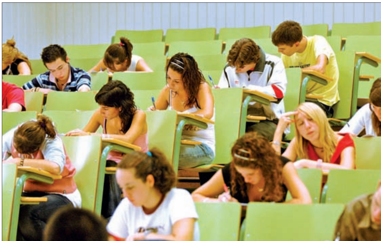
Jóvenes estudiantes enfrentándose a los exámenes de acceso a la universidad GENTE

La Prueba de Acceso a la Universidad (PAU) se despide este curso para dar paso a partir del año que viene a una reválida que será obligatoria para poder obtener el título de Bachillerato PÁG. 2