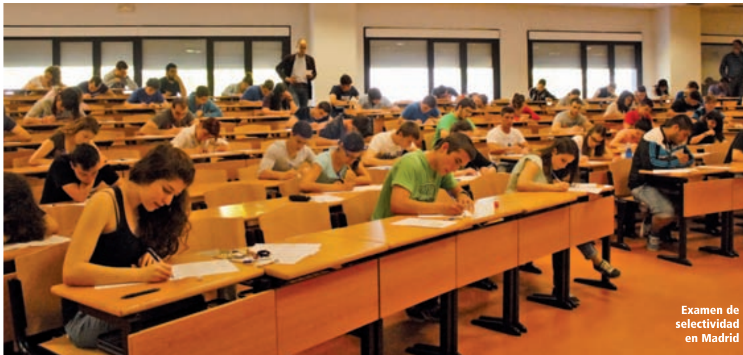
Examen de selectividad en Madrid