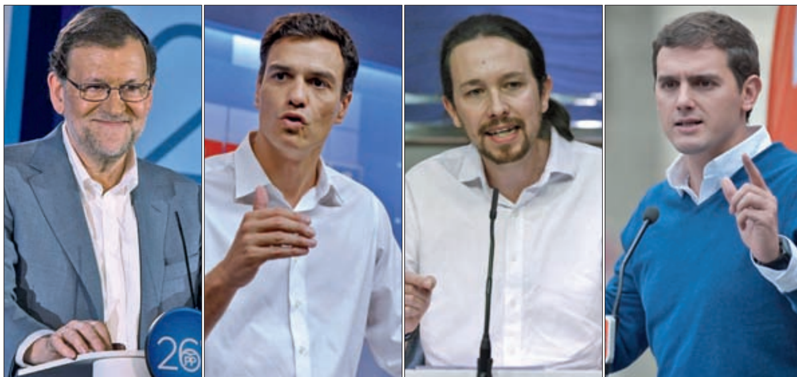
Mariano Rajoy, Pedro Sánchez, Pablo Iglesias y Albert Rivera