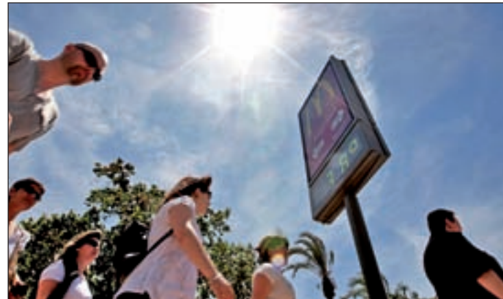
Hará más calor en la zona central, el sureste y el Mediterráneo

Esta región también está marcada por su sequedad, que estará