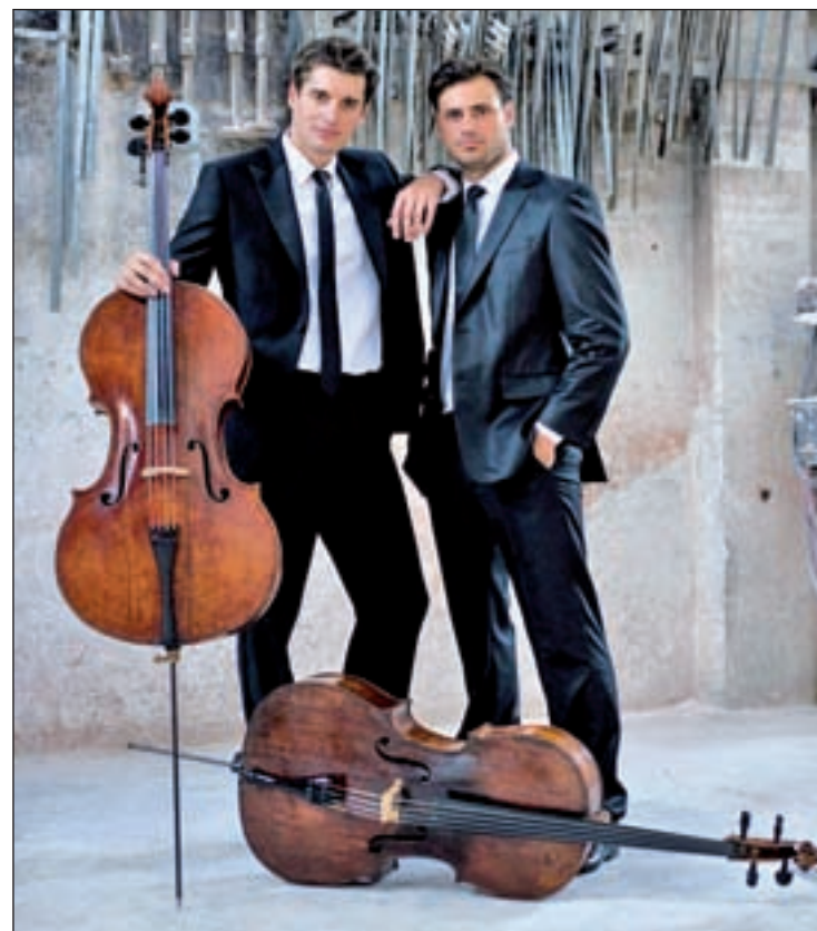
El turno para 2Cellos será el día 9 de julio

'Noches del Botánico' forma parte del acuerdo con la Universidad Complutense de Madrid para el fomento y desarrollo de actividades culturales e incluye además una interacción con la Escuela de Verano de la UCM que, según los organizadores de esta cita musical, se presentará al público el próximo 4 de julio.