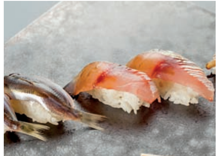
El sushi es el plato más conocido de la gastronomía japonesa