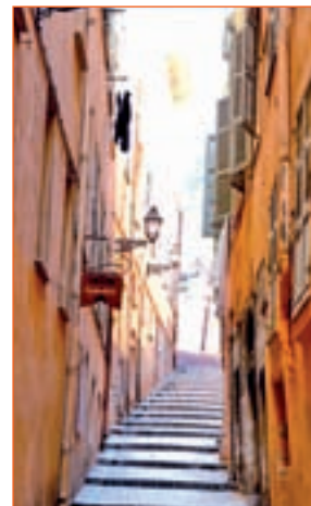
PARA PASEAR: Por sus calles, por sus parques y jardines o por la playa. Niza es una ciudad que enamora.

Es la capital de la Costa Azul. La mejor forma de conocer Niza es perderse por la belleza de sus callejuelas y 'piazzettas', en las playas bañadas de luz o a la sombra de las 300 hectáreas de parques y jardines. La arquitectura, la pintura, la música o el cine se dan la mano en emplazamientos como el viejo Niza, embajador de la arquitectura Sarda, los palacios y castillos de estilo barroco y la concentración de museos y galerías de arte. Además, los casi 365 días al año de sol acompañan para pasar una jornada en cualquiera de sus 15 playas privadas o de sus 20 públicas. Disfrutar de la 'Cocina nizarda', en la que predominan las verduras y la dieta mediterránea, es otra obligación que se puede subsanar en restaurantes como La Rustide, La Cambuse o Pasion'elle.