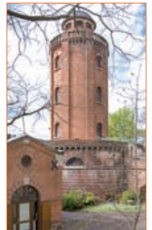
FOTOGRAFÍA: Aprovecha tu visita para ir a esta galería fundada en 1974 por el fotógrafo de Toulouse Jean Dieuzaide.

Contrastes. Eso es lo que vamos a encontrar en Toulouse, una ciudad moderna de arquitectura medieval que, además, es la sede europea del sector aeroespacial. Pasear por el río Garonne es un buen plan antes de visitar el órgano de tubos más bello de Francia, que está en la Basílica de Saint Sernin. Otra de las cosas que no puedes dejar de ver es la sociedad literaria más antigua del mundo occidental, la Academie des Jeux Floraux. Y, si una de tus aficiones es ponerte detrás del objetivo, la Galerie du Chateau d'eau es el primer museo de fotografía del mundo. En la Place du Capitole, una parada imprescindible, vivirás una experiencia única en cualquiera de los bares y restaurantes que la rodean. Además, este sitio por la noche es un espectáculo de luz.