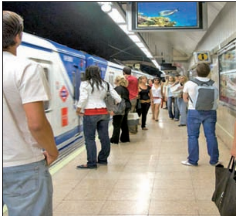
Metro de Madrid GENTE

La principal reivindicación del Colectivo de Maquinistas es "finalizar la jornada laboral diaria en el lugar donde se inicia o, al menos, que se compute el tiempo de retorno al lugar de entrada como tiempo de trabajo y no co-