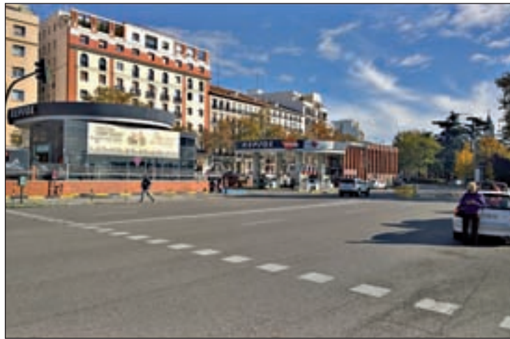
La concesión de la gasolinera de Atocha terminó el pasado día 9

En concreto, según el concejal del distrito Nacho Murgui, los 2.200 metros cuadrados podrían