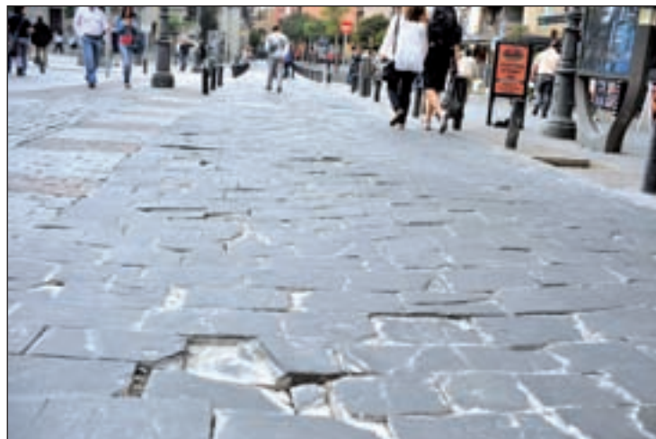
Un bache en una calle del centro de Madrid

A esto se suman actuaciones en 90 paradas de la EMT en Moncloa-Aravaca, Hortaleza, San Blas, Fuencarral-El Pardo, Chamartín, Arganzuela, Chamberí, Tetuán, Usera, Carabanchel, Puente de Vallecas y Villaverde; y la renovación, a lo largo de tres años, del pavimento del Anillo Ciclista a su paso por Fuencarral-El Pardo, Moncloa-Aravaca, Latina, Carabanchel, Usera, Puente de Vallecas, Moratalaz, Hortaleza y San