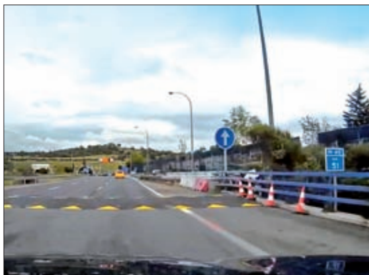
Badén de la M-40

Un obstáculo que desaparecerá dentro de seis semanas, según confirmaron fuentes ministeriales a este periódico. El pasado domingo comenzó la última fase de los trabajos, que consisten en la