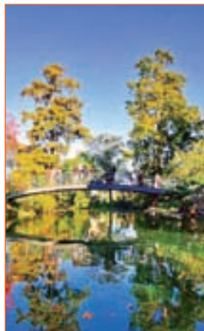
JARDINES PÚBLICOS: Cuentan con la distinción de 'Jardin Remarquable de France' como unos de los más destacados.

Su estadio, el Matmut Atlantique, es el recinto para eventos más grande de la costa atlántica. Pero, más allá del momento futbolero, Burdeos fue declarada Patrimonio Mundial de la UNESCO en 2007. Sus más de 350 monumentos históricos avalan este título y bien merecen un paseo por la Ciudad Rosa, apodada así por el color dominante de sus edificios antiguos, hechos con ladrillos caravista. Burdeos también cuenta con el espejo de agua más grande del mundo, situado frente a la Plaza de la Bolsa, una obra que alterna efectos extraordinarios de espejo y niebla. Asimismo, destacan sus Jardines Públicos, que están rodeados del Museo de Historia Natural, un antiguo Jardín Botánico y un bar-restaurant con encanto, L'Orangerie.