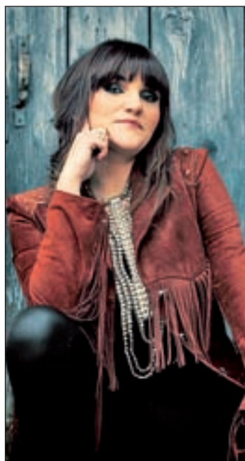
Rozalén estará el 30 de junio

Un nuevo concepto de festival que reunirá en el cartel a una amplia mezcla de generaciones y estilos de música, entre los que no faltarán el pop, el jazz, la música brasileña o la electrónica y el flamenco. Todo, con el objetivo de ofrecer al público de la capital un dosis refrescante de música que atenúe el calor de las noches veraniegas de Madrid.