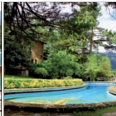
De izquierda a derecha y de arriba abajo: Ávila, Barcelona, Sevilla, Badajoz y Vizcaya

que ha querido poner en primer plano los elementos más tradicionales de la zona. El color blanco, los tejados a dos aguas, las tejas árabes o las balconadas sencillas de hierro entrelazan su arquitec-