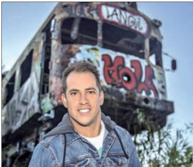
El cantante Juan Manuel Montilla, 'El Langui'