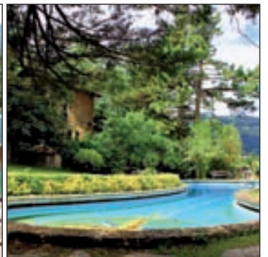
De izquierda a derecha y de arriba abajo: Ávila, Barcelona, Sevilla, Badajoz y Vizcaya

que ha querido poner en primer plano los elementos más tradicionales de la zona. El color blanco, los tejados a dos aguas, las tejas árabes o las balconadas sencillas de hierro entrelazan su arquitec-