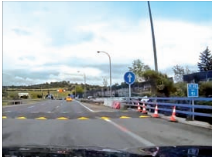
Badén de la M-40

Un obstáculo que desaparecerá dentro de seis semanas, según confirmaron fuentes ministeriales a este periódico. El pasado domingo comenzó la última fase de los trabajos, que consisten en la