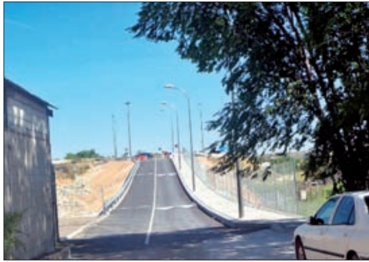
El nuevo tramo de vía recién inaugurado

El pasado 2 de junio, el Ayuntamiento recibió de forma