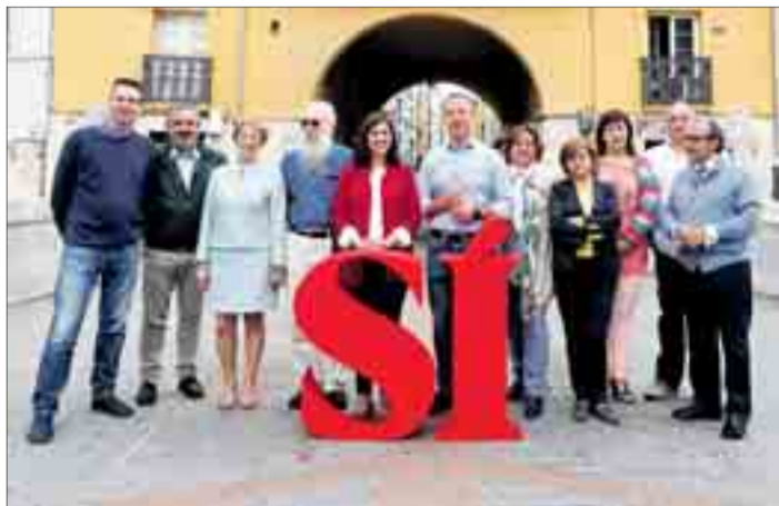
La presentación de las candidaturas y su programa se realizó el lunes 6.