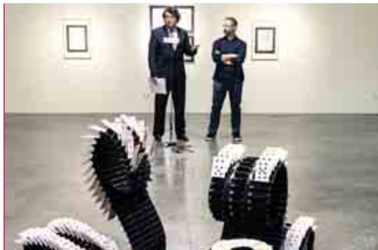
La exposición se inauguró el jueves día 9 y puede visitarse hasta el 10 de julio.