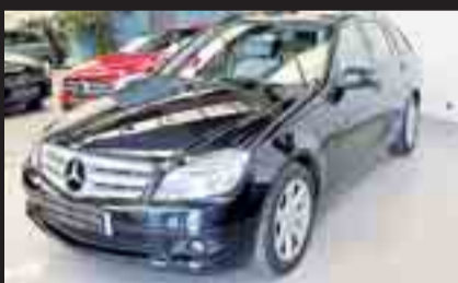
MERCEDES-BENZ CLASE C ESTATE 200 CDI Año 2011. 136 cv. Diésel. Control de crucero. 12 meses de garantía.