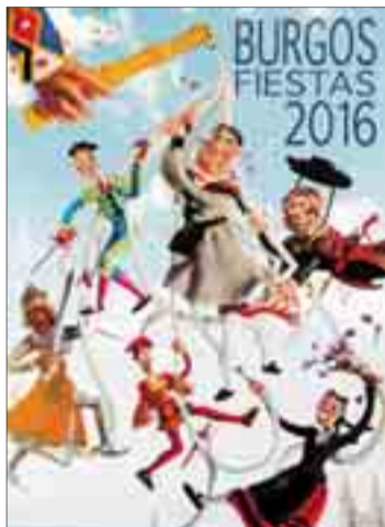
El viernes 24 se inauguran las fiestas.

Los fuegos artificiales estarán a cargo de la compañía 'Pirotecnia Xaraiva', ya que en vez de realizarse un concurso como en otras edi-