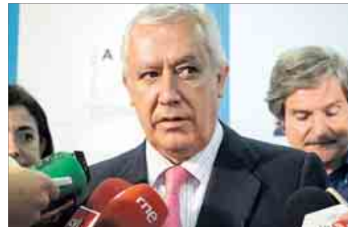
Arenas participó en la sede del PP en un acto sobre buenas prácticas en municipios.

Arenas declaró que piensan que van a “obtener un resultado mejor” que el 20D y para ello, van a desarrollar “una campaña en positivo” y “a favor del valor del voto útil”. Desde su punto de vista, “nos estamos jugando por lo menos un par de décadas y nosotros tenemos que gastar muy poco tiempo en descalificar a nadie”.