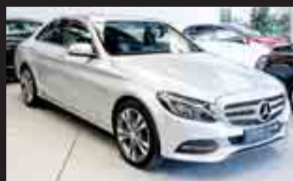
MERCEDES-BENZ CLASE C BERLINA 220 BlueTEC / Avantgarde. Año 2015. 170 cv. Diésel. Automático. Agility y Dynamic Select. Asistente aparcamiento y luz carretera adaptable plus. Llantas 18". 2 años de garantía.