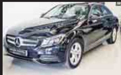
MERCEDES-BENZ CLASE C 220 Bluetec Avantgarde. Año 2015. 170 cv. Navegador. Parktronic. Faros inteligentes led. Automático. 2 años de garantía.