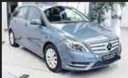
MERCEDES-BENZ CLASE B 200 CDI Año 2011. 136 cv. Diésel. Xenon. USB. MP3. 2 años de garantía.