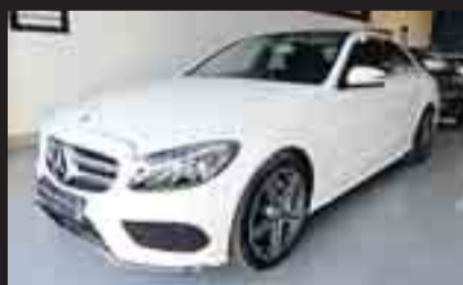
MERCEDES-BENZ CLASE C BERLINA 220 BLUETEC AMG. Año 2015. 170 cv. Automático. Techo panorámico. Tempomat. Navegador. Faros led. Asistente aparcamiento. Paquete deportivo AMG. 2 años de garantía.