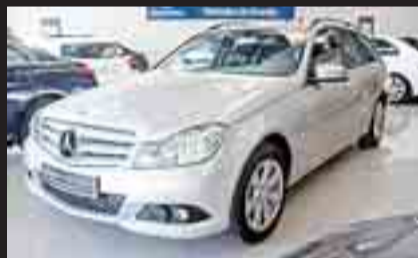
MERCEDES-BENZ CLASE C ESTATE 200 CDI Año 2013. Diésel. 136 cv. Parktronic. Navegador. Control de crucero. 2 años de garantía.