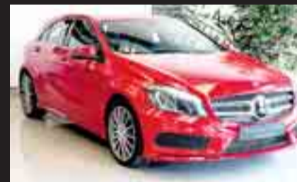
MERCEDES-BENZ CLASE A 180 CDI BlueEfficiency AMG Sport. Año 2015. 109 cv. Automático. Tempomat. Paquete deportivo AMG. Xenon. 2 años de garantía.