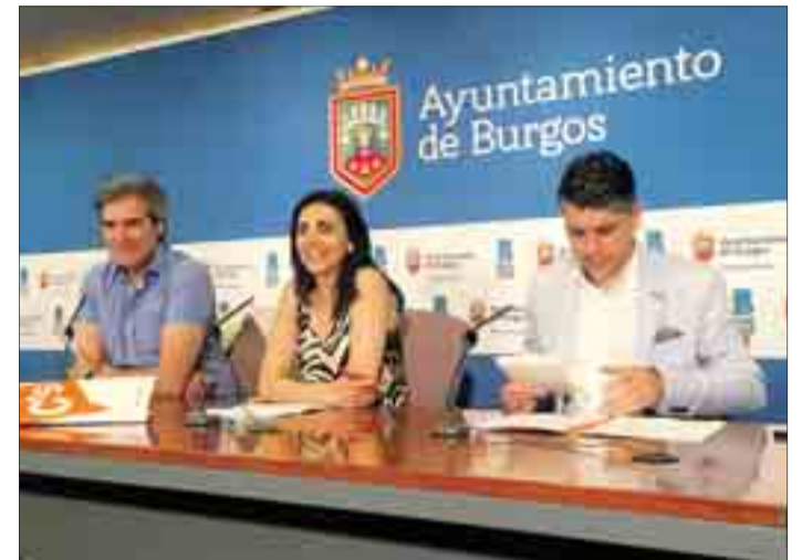
Los tres concejales de C's valoraron el primer año de legislatura.