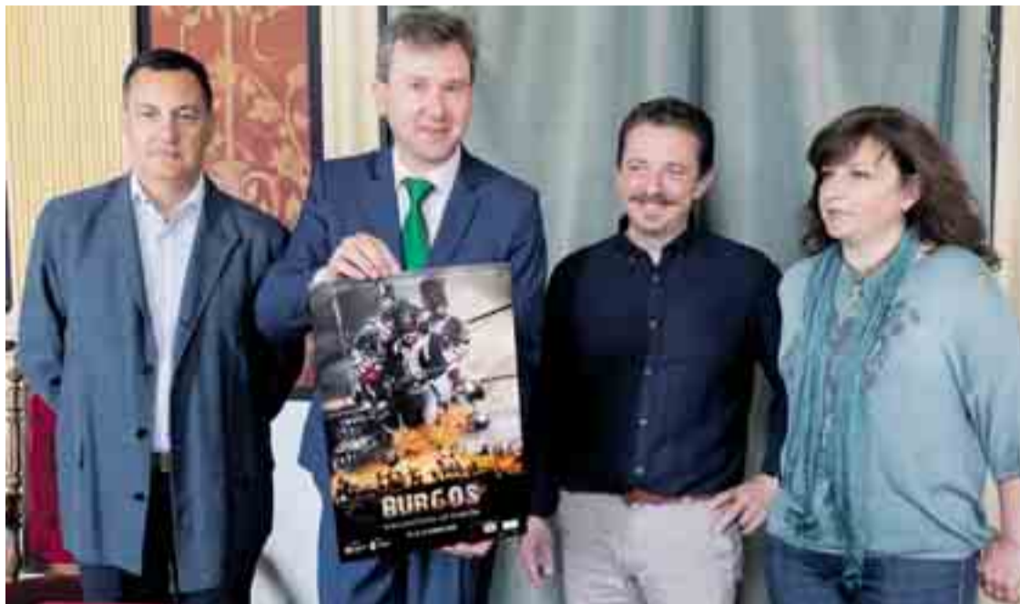
Presentación del evento 'Wellington Ad Portas', que se comenzó a organizar en septiembre del año pasado.