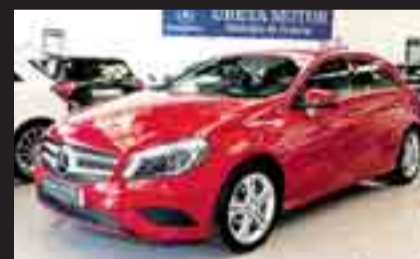
MERCEDES-BENZ CLASE A 180 CDI BlueEfficiency Urban. Año 2015. 109 cv. Automático. Xenón. 7 velocidades. 2 años de garantía.