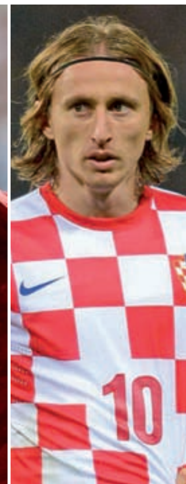
PELIGROS CONOCIDOS: Arda Turan y Luka Modric, dos futbolistas con una notable trayectoria en la Liga, marcarán el camino de España en la ronda inicial. Rakitic, Kovacic, Mandzukic, Plasil o Nuri Sahin son otros nombres familiares.