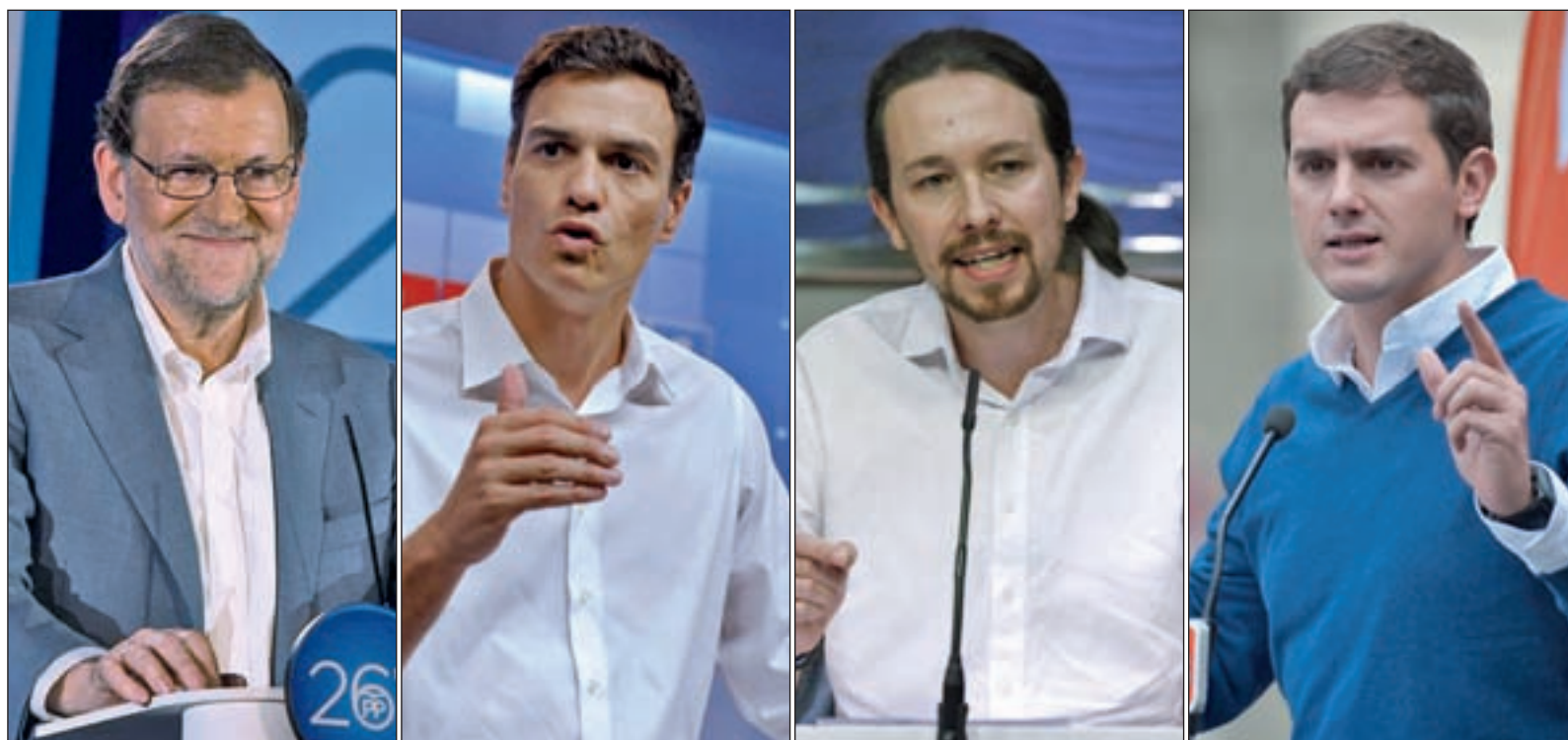
Mariano Rajoy, Pedro Sánchez, Pablo Iglesias y Albert Rivera