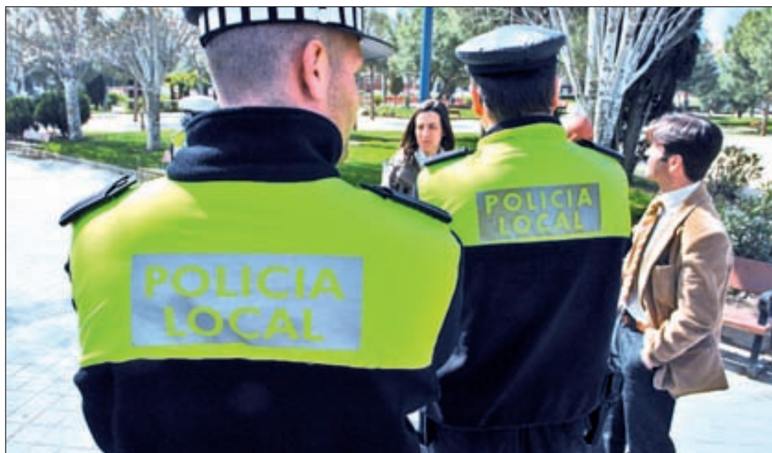
La estación que menos robos registra es el otoño

Así, en Tarragona es un 65,72% más probable que una vivienda su-