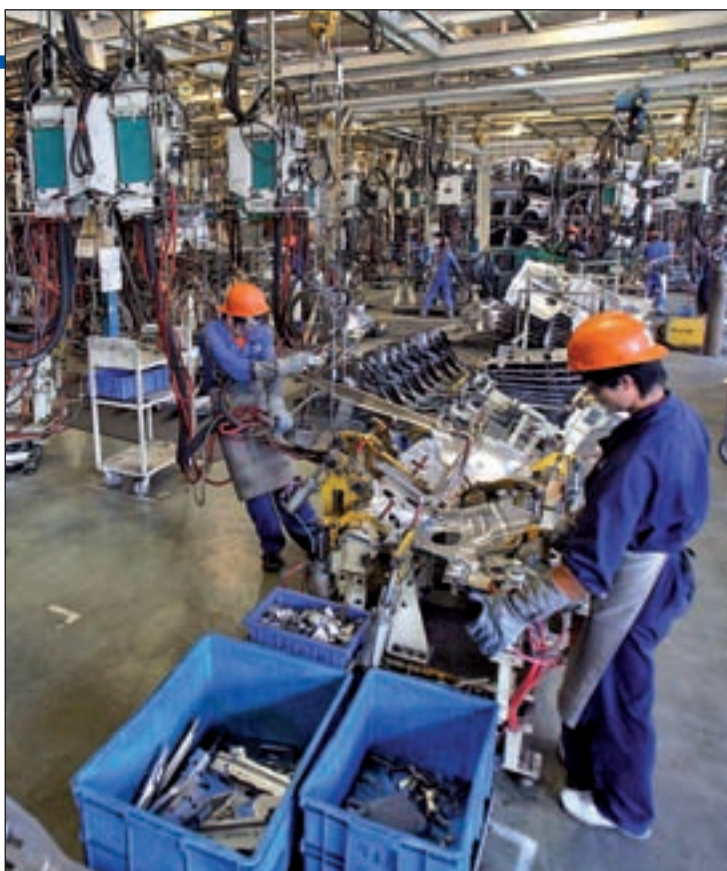
El pago de impuestos equivale a nueve años más de vida laboral

Con estas cifras, el informe asegura que España tiene una carga tributaria sobre el empleo superior a la media de la OCDE.