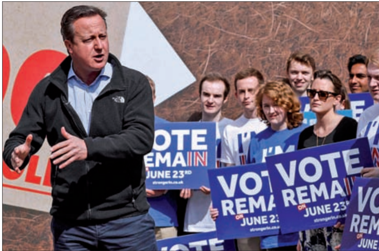
Los británicos votarán el próximo 23 de junio

A pesar de la existencia de vínculos entre ambas naciones, se desconoce la profundidad del impacto de la decisión de los británicos. Según la Organización para la Cooperación y el Desarrollo Económico