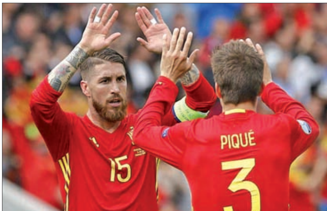
Gerard Piqué celebra junto a sus compañeros el gol anotado ante los checos

La derrota sufrida ante Croacia complica sobremanera la clasificación de Turquía, que apenas puso en aprietos al equipo balcánico y acabó cediendo en el marcador por culpa de un gol de Luka Modric. Otro de los futbolistas que actúan en la Liga española, Arda Turan, no tuvo su mejor tarde y tanto su seleccionador, Fatih Terim, como la hinchada otomana, siempre caliente, esperan que el crack del Barcelona saque su mejor versión ante España, sobre