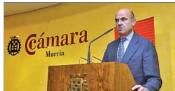
Luis de Guindos, ministro de Economía en funciones

El ministro de Economía en funciones, Luis de Guindos, estimó que los precios cerrarán en negativo en 2016, con lo que el indicador sumará tres ejercicios consecutivos en tasas negativas, y destacó que un IPC en negativo supone un aumento de la capacidad adquisitiva de las familias y mejora la competitividad.