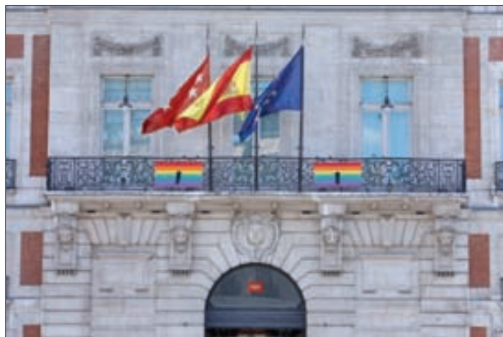
LUTO EN ESPAÑA: Ayuntamientos y comunidades realizaron minutos de silencio en memoria de las víctimas. Además, COLEGAS-Confederación LGBT Española condenó el tiroteo y se concentró frente a la Embajada de EEUU.

Pocas horas después del atentado, la propia organización terrorista reivindicó el ataque. "Uno de