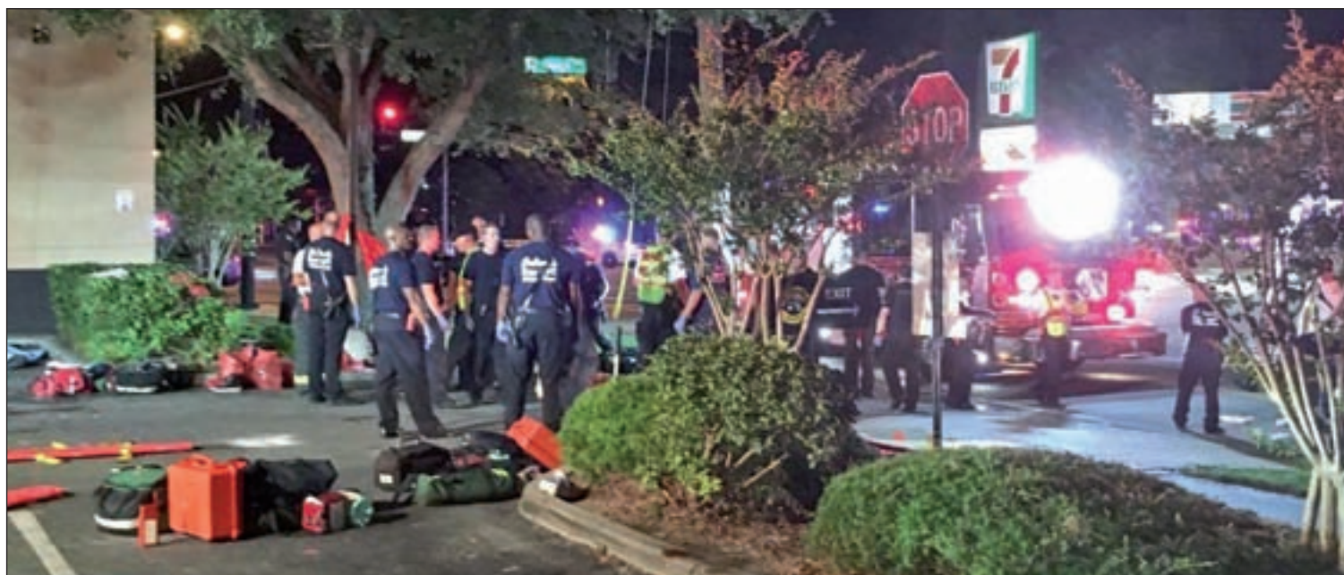
El atentado se llevó a cabo en el club nocturno Pulse

Una de las principales preocupaciones de los servicios de seguridad es la figura del 'foreign fighter', es decir, personas radicalizadas que han abandonado sus países de origen y se han desplazado a lugares en conflicto como Siria o Irak para hacer la yihad.