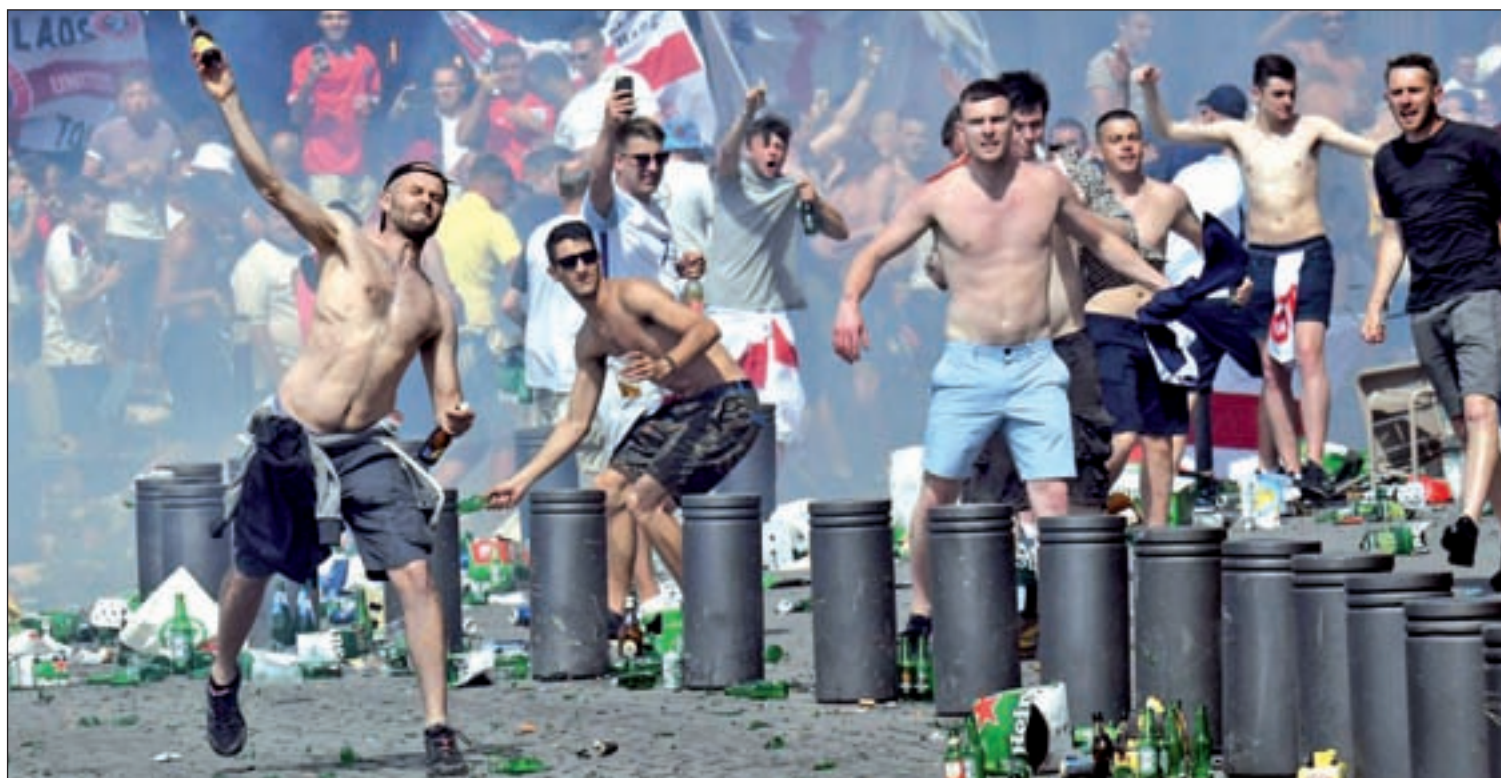
Imagen de los enfrentamientos entre radicales ingleses y rusos en las calles de Marsella