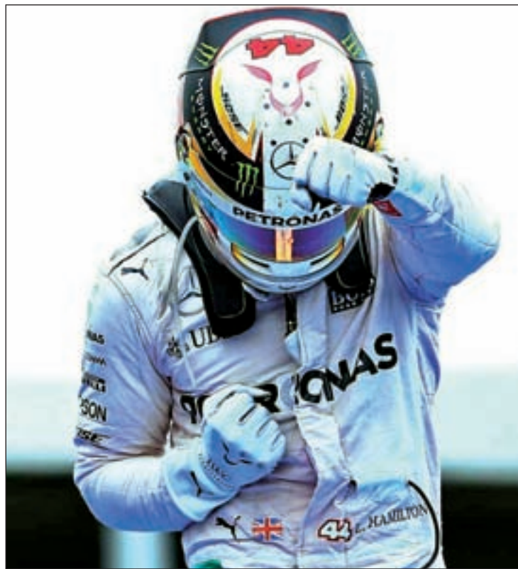
Hamilton homenajeó a Muhammad Ali

En lo que respecta a los pilotos españoles, las sensaciones son opuestas. Carlos Sainz volvió a despejar las dudas con una exhi-