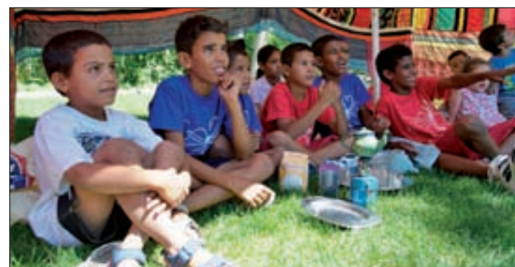
Unos niños pertenecientes al programa 'Vacaciones en paz'

jarán a Andalucía; 14, a Aragón; 253 a Asturias; 95 a Baleares; 55 a Cantabria; 220 a Castilla y León; 320 a Castilla-La Mancha; 450 a Cataluña; 207 a Canarias; 210 a Extremadura; 280 a Galicia; 115 a Navarra; 38 a La Rioja; 240 a Madrid; 100 a Murcia; 362 al País Vasco; y 249 a Valencia.