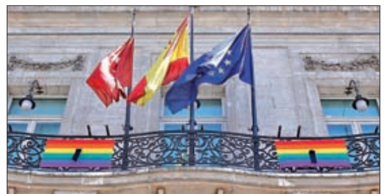
Bandera arcoiris en la sede de la Comunidad

día después de que el ataque tuviera lugar. Esta acción se unió al minuto de silencio que se guardó el pasado lunes a mediodía en la Puerta del Sol y en el que el consejero de Presidencia, Ángel Garrido, mostró su “repulsa por este atentado con tintes de odio homófobos y fundamentalistas”.