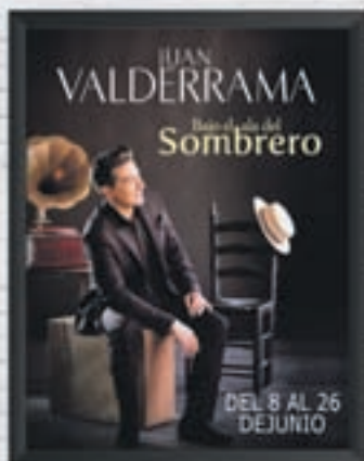
TEATRO BELLAS ARTES