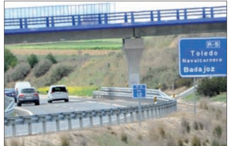
Autopista de peaje Radial 5 a su paso por Móstoles

La confirmación del auto del juez Vaquer significaría también la extinción de los contratos de los 120 trabajadores con los que ac-