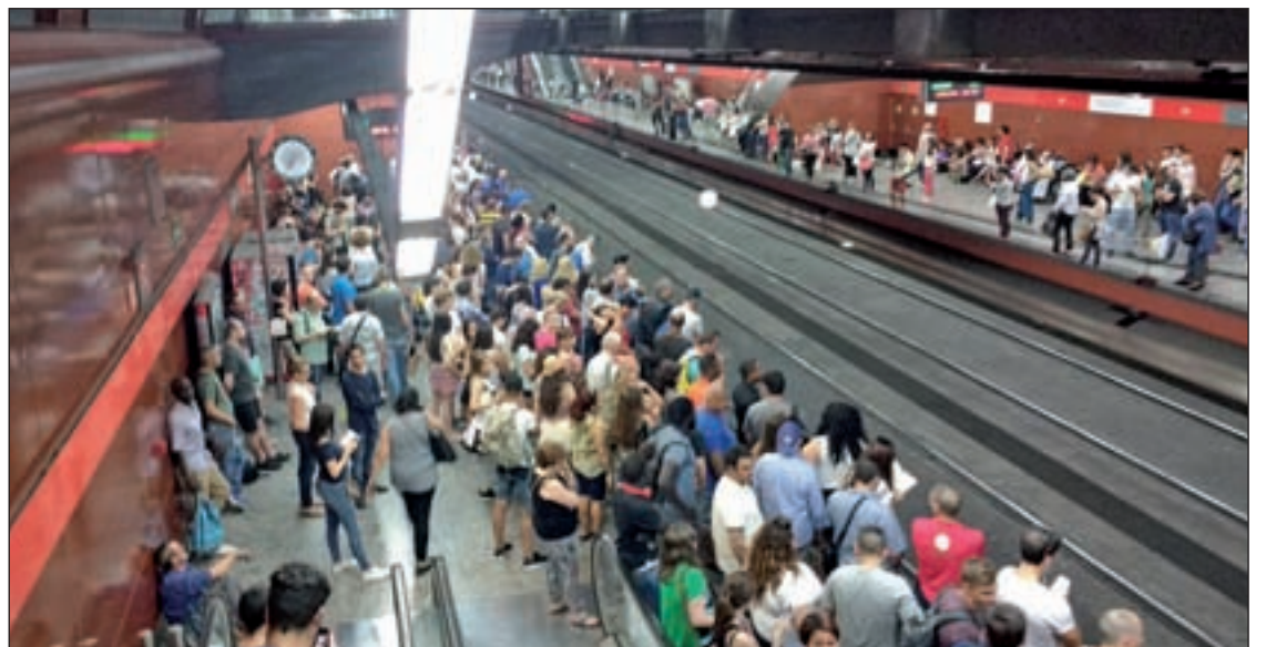
Andenes de Cercanías en Sol durante una de las jornadas de huelga

Menos halagüeñas son las previsiones en el conflicto que mantienen los conductores del suburbano madrileño con Metro. Este