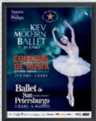
TEATRO DE LA LUZ PHILIPS