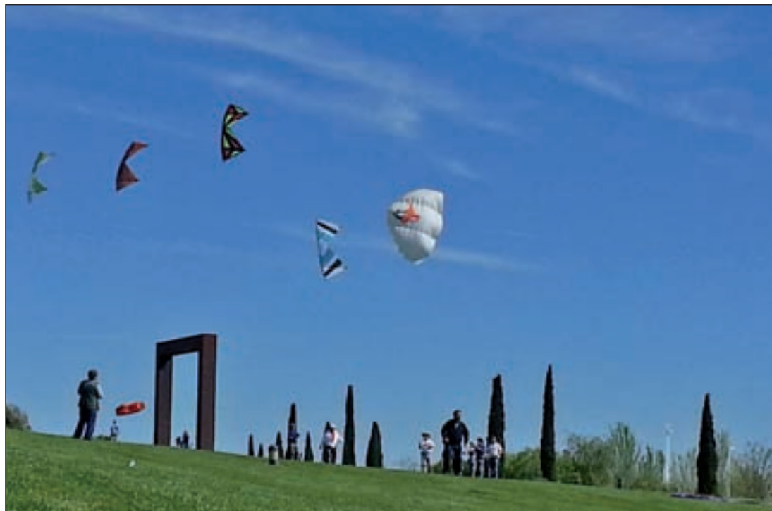
El Parque Juan Carlos I albergará un taller de vuelo de cometas