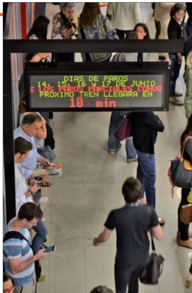
Huelga de Metro esta semana en Madrid

El Ayuntamiento de Madrid, con el que la Comunidad mantiene un acuerdo a la hora de prestar los servicios alternativos a la obra, señaló nada más conocer el aplazamiento que "disponemos de todos los dispositivos de Movilidad ya preparados y la planificación diseñada no va a variar significati-