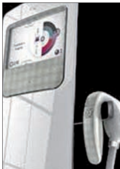
Máquina del tratamiento