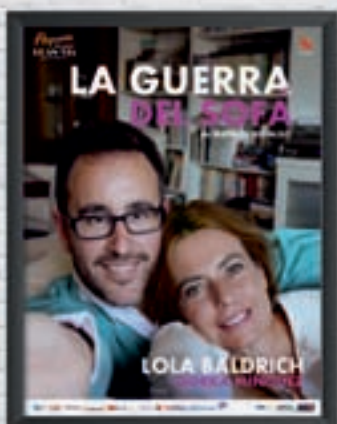
PEQUEÑO TEATRO GRAN VÍA