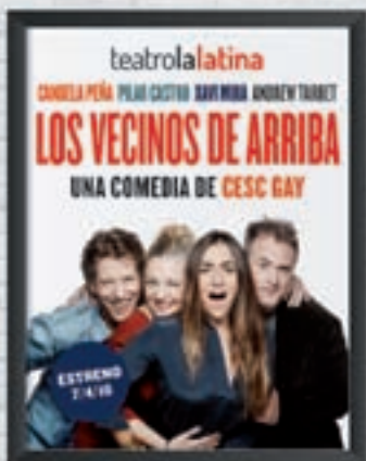
TEATRO LA LATINA