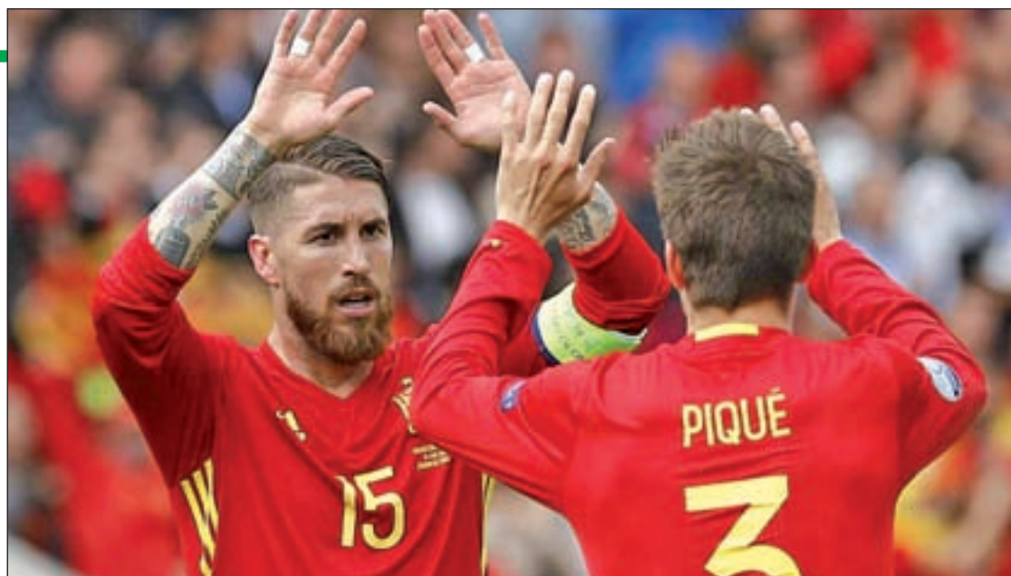
Gerard Piqué celebra junto a sus compañeros el gol anotado ante los checos

Volviendo al momento de forma de la selección española, una de las mejores noticias que dejó el estreno ante República Checa es que, al margen de la clarividencia que