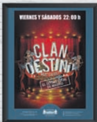
GRAN TEATRO PRÍNCIPE PÍO