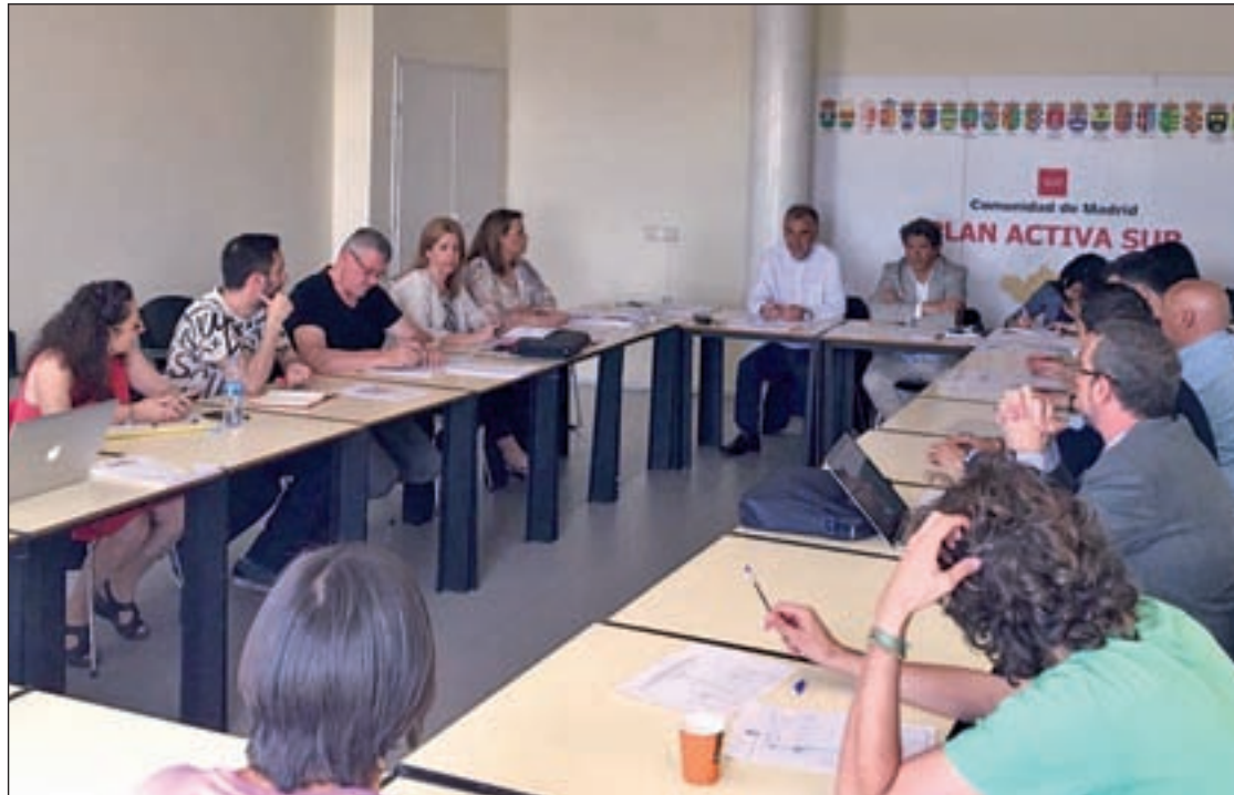
Última reunión del Plan Activa en Alcorcón GENTE

En cuanto al gasto del Plan en 2016, unos 115 millones, se dedicará a la segunda fase de ampliación del Parque Empresarial La Carpetania, ubicado en Getafe. También se han puesto en mar-