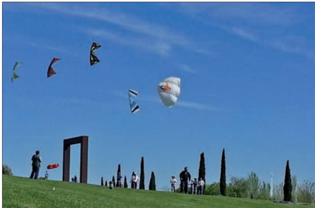
El Parque Juan Carlos I albergará un taller de vuelo de cometas