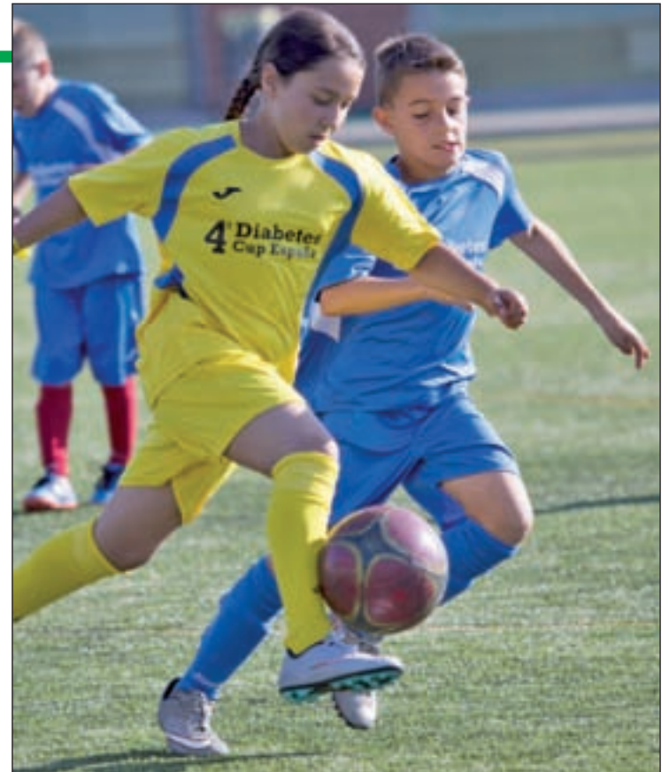
Imagen de uno de los partidos de la pasada edición