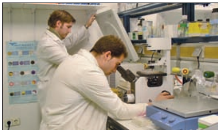
Investigadores en la Comunidad de Madrid

Hay tres tipos de ayudas. La primera de ellas contará con un presupuesto de 5,2 millones de euros