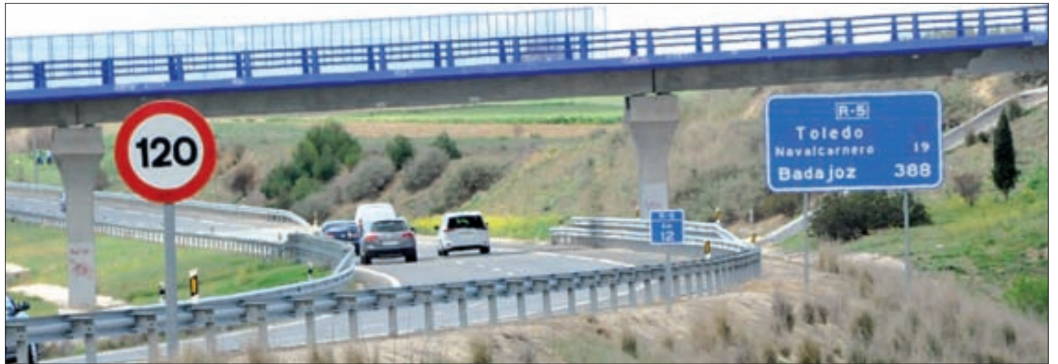
Autopista de peaje Radial 5 a su paso por Móstoles

Por otra parte, la región ha financiado en los mercados el 100% de la deuda autorizada por el Consejo de Ministros, la mayor parte para hacer frente a amortizaciones que vencen este año. Entre las operaciones realizadas destaca, por su plazo, una colocación privada de 60 millones de euros a 50 años, un plazo nunca alcanzado por una comunidad autónoma, así como una emisión pública de 700 millones a bonos a cinco años con el interés más bajo de su historia para un bono de esas características (0,727%).