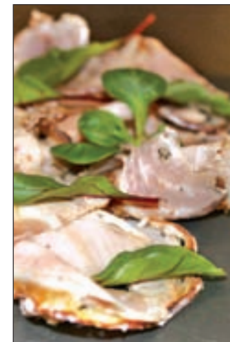
Fiambre típico italiano

Y es que nuestra región ofrece una variedad extensa de platos típicos españoles, pero si hay un plato que destaca por encima de todos es la paella, la receta más identificativa e internacionalmente conocida de la cocina española. Sin embargo, si hay que buscar el secreto para que quede perfecta, nadie sabrá encontrarlo. Unos dirán que está en el arroz. Otros, que la clave es utilizar un buen recipiente. Muchos defenderán que la diferencia la marca un buen sofrito, o que el resto de ingredientes le darán el toque final. Pero si algo hace perfecta a una paella es la compañía, y esta ruta es el mejor momento para disfrutarla.