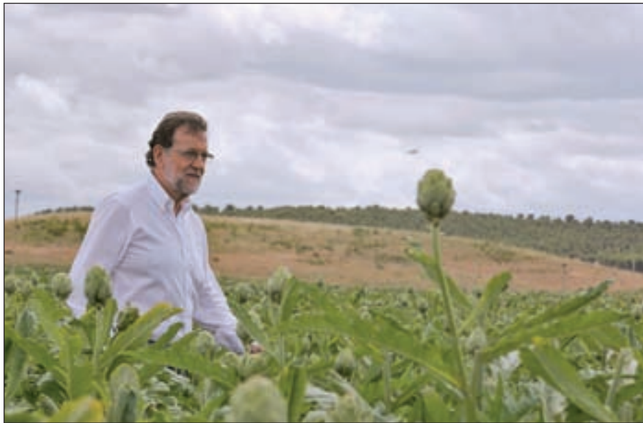
APUESTA POR EL MUNDO RURAL El PP ha optado para esta campaña electoral por los pueblos frente a las ciudades. Por ello, Mariano Rajoy sólo programó dos grandes mítines e hizo visitas a zonas rurales y provincias pequeñas.