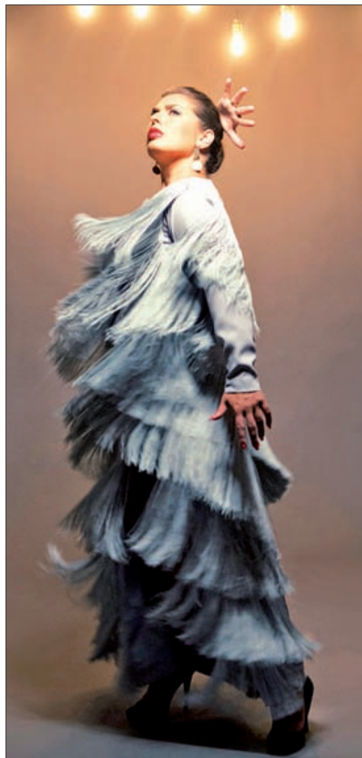
Pastora Galván actuará en los Teatros del Canal el 2 de julio

Las imágenes de Paco Gómez, una de las figuras más importantes del arte español, a mediados de los años sesenta, han servido de inspiración y están presentes en esta IX edición del Festival Suma Flamenca.