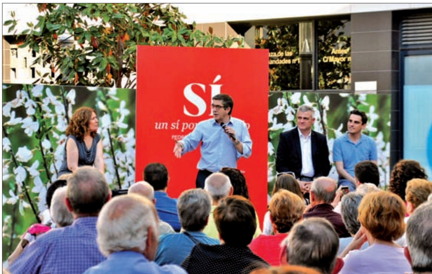
El candidato al Congreso de los Diputados, Patxi López, fue uno de los rostros políticos que hizo precampaña en Alcorcón

El día 26 se celebran las segundas generales en seis meses, después de la incapacidad de los partidos para lograr acuerdos y con la única novedad de la alianza entre IU y Podemos PÁGS. 2, 4 Y 10