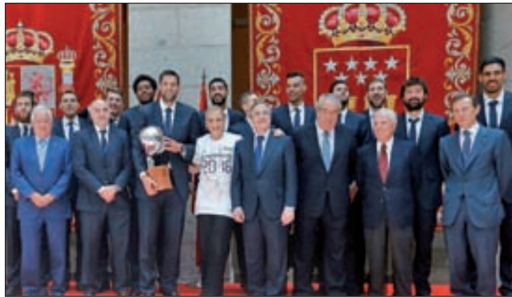
La plantilla blanca, durante la recepción en el Gobierno regional

No hizo falta esperar al quinto encuentro de la serie con el Barcelona Lassa, ya que el cuadro blanco culminó su particular remontada tras arrebatar al equipo azulgrana el factor cancha. Si el marcador del primer partido (100-99) cayó del lado azulgrana, desde ese momento el Real Ma-