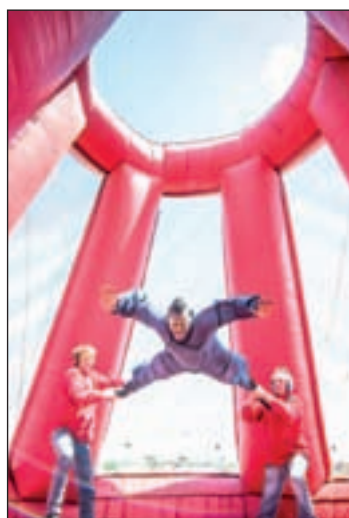
Una de las actividades de ocio

El balance no pudo ser más positivo, ya que más de 17.000 personas se dieron cita en el mítico trazado para sentir de cerca toda la emoción de una propuesta que ofrecía actividades para todos los públicos. Cabe destacar que todas ellas han tenido una excelente acogida, tanto en las pruebas de conducción de vehículos