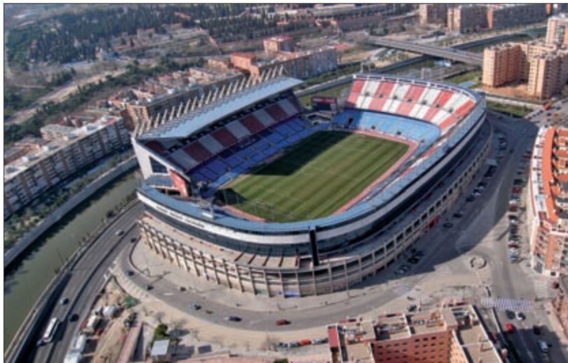
Una imagen aérea del ámbito de actuación, situado en el distrito de Arganzuela

La modificación más importante con respecto a la actuación aprobada por el Gobierno de Ana Botella y paralizada en los tribunales por diferentes recursos, es la reducción de la edificabilidad, de 2.000 a 1.200 viviendas, un 10% de las cuales tendrán algún grado de protección. Los edificios pasarán a las 8 plantas de altura media en vez de las 20 que contemplaba el anterior plan. Además,