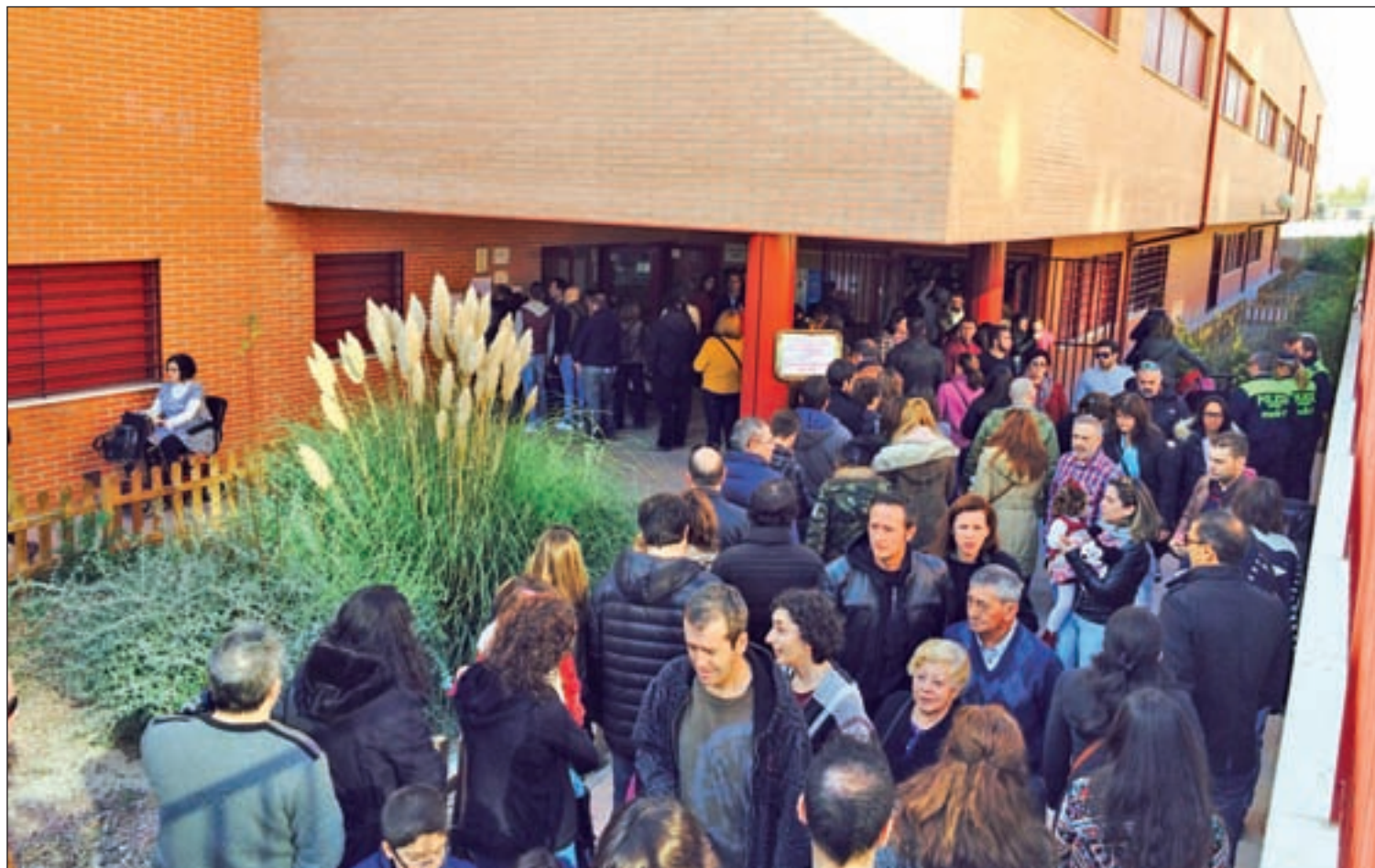
Las elecciones se celebran este domingo

El día 26 se celebran las segundas generales en seis meses, después de la incapacidad de los partidos para lograr acuerdos y con la única novedad de la alianza entre IU y Podemos PÁGS. 2 Y 4