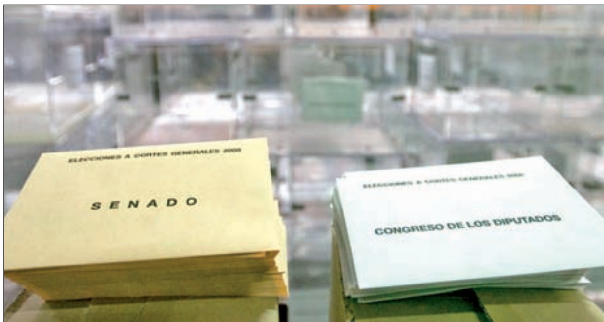
Los electores votarán para el Congreso de los Diputados y para el Senado el próximo domingo