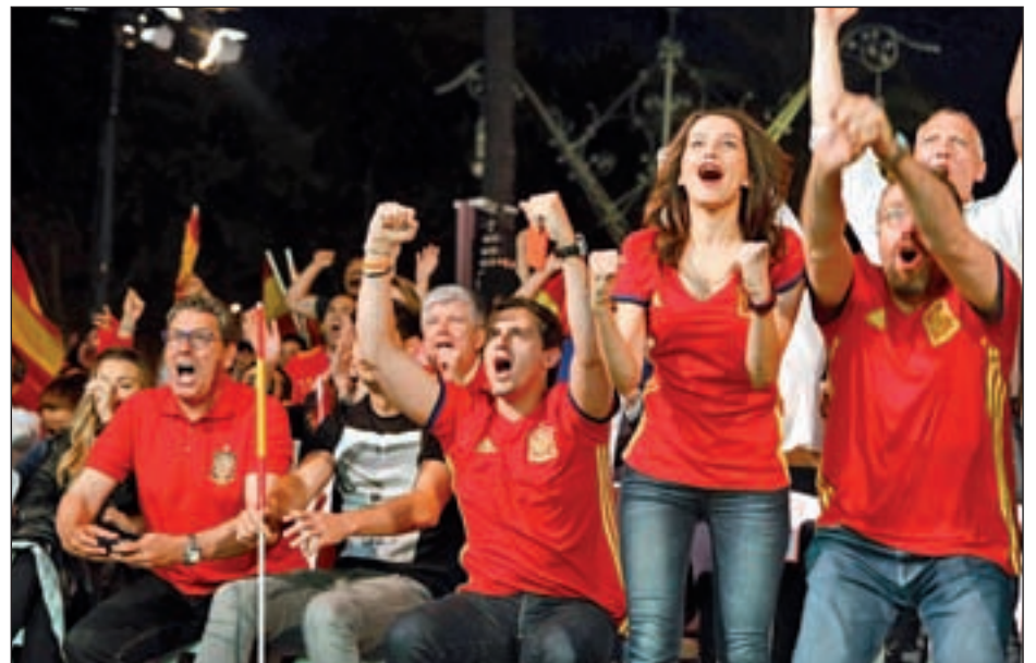
DE LO AUTONÓMICO A LO GENERAL Que Ciudadanos es un partido nacional ya es algo aceptado, sin embargo Albert Rivera no pierde ocasión de remarcar su postura antinacionalista, viendo en una plaza de Barcelona un partido de la selección española de la Eurocopa.