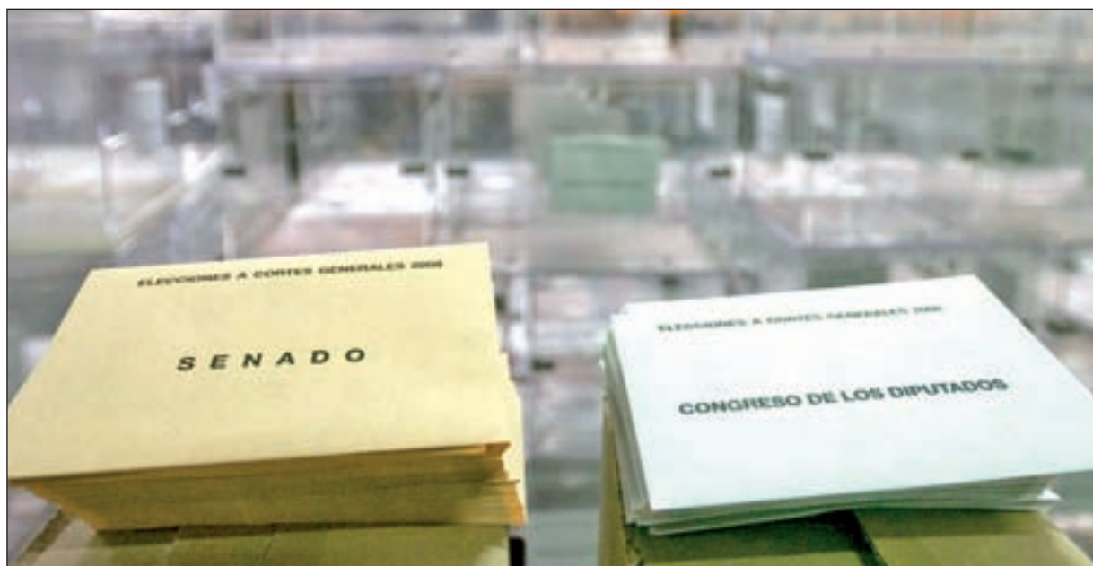
Los electores votarán para el Congreso de los Diputados y para el Senado el próximo domingo