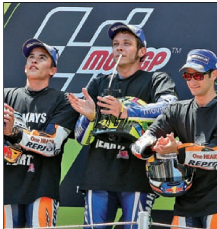
Márquez, Rossi y Pedrosa rindieron homenaje al fallecido Salom

Entrando en el plano estrictamente deportivo, Márquez aventaja en diez puntos a Lorenzo, aunque tampoco conviene perder de vista al italiano Valentino Rossi, tercero en la general, con 103 puntos, 22 menos que el líder. Teniendo en cuenta que los tres candidatos han obtenido el mis-