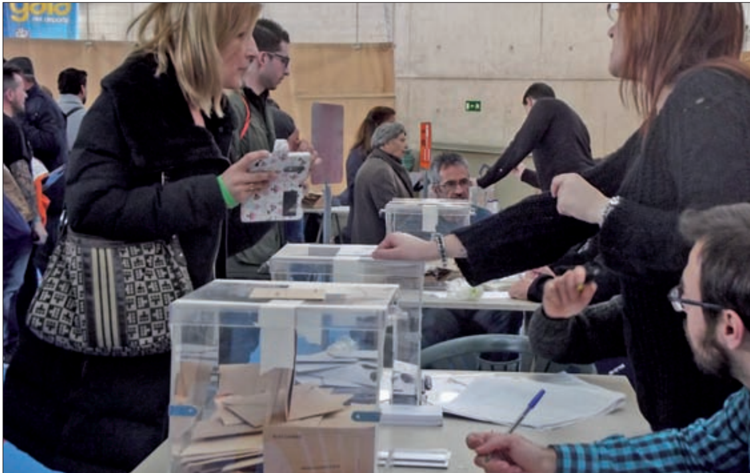
Las elecciones generales se celebran el próximo domingo

Más de 36 millones de personas están llamadas a las urnas en unos comicios que se repiten por primera vez • La única novedad reside en la posible caída del PSOE frente a Unidos Podemos PÁGS. 2-5