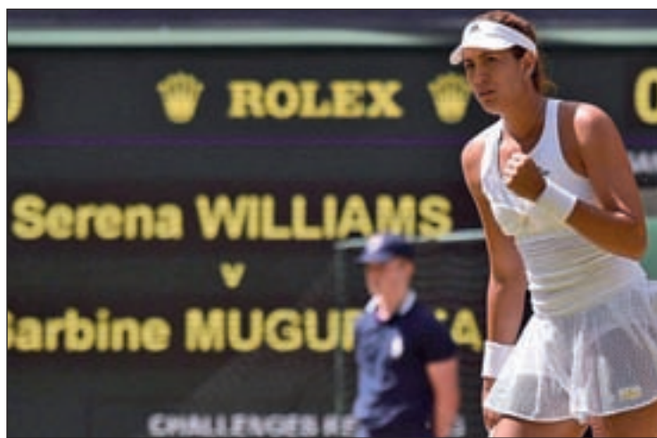
Garbiñe Muguruza intentará repetir éxito en Wimbledon