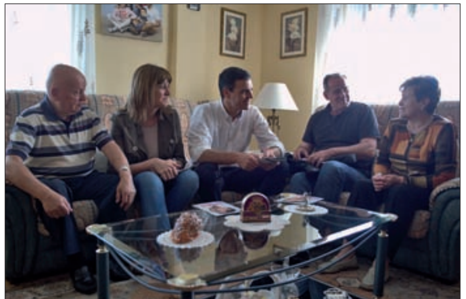
PUERTA A PUERTA El secretario general del PSOE se ha decantado por el 'cara a cara' con los ciudadanos y ha participado en diferentes actos de entrega de propaganda electoral puerta a puerta, aprovechando para relacionarse con los ciudadanos.