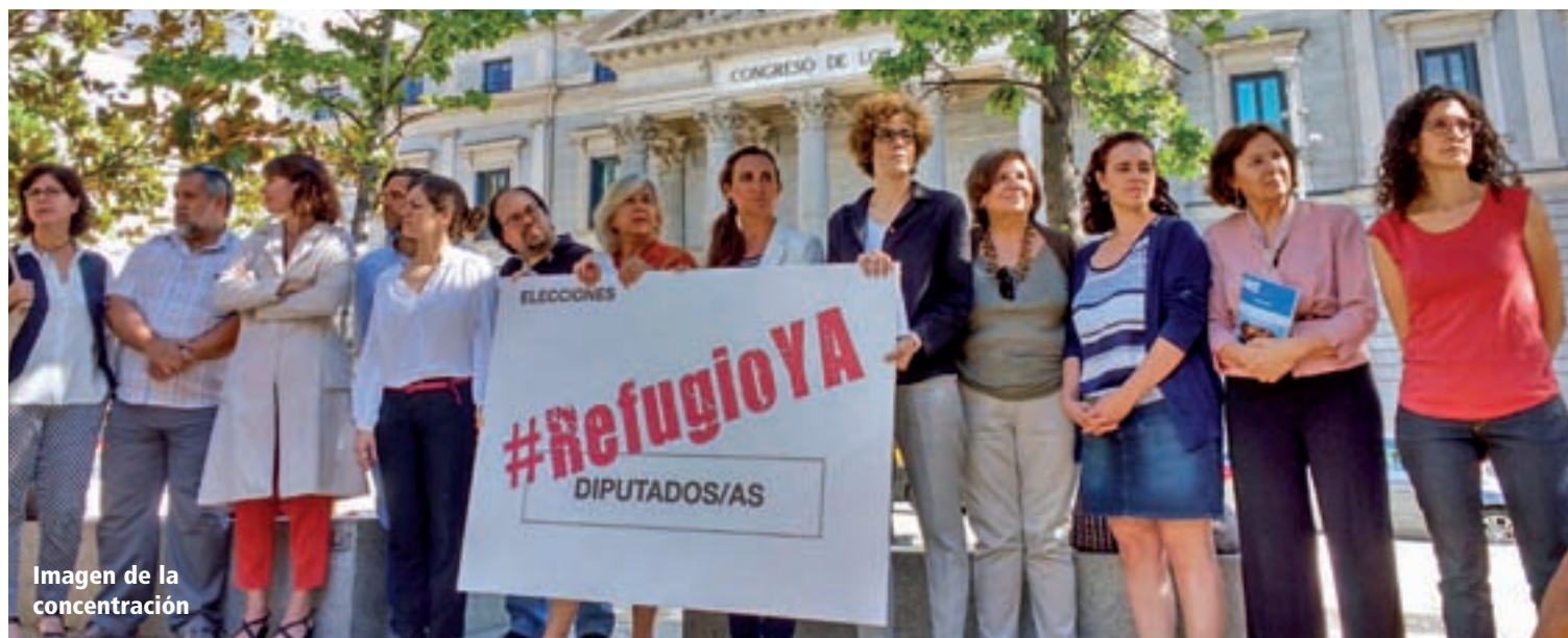
Imagen de la concentración

El segundo grupo en que más creció fue el de mobiliario, equipamiento y otros gastos de la vivienda, que registró una tasa anual del 5,9% debido a la subida de todos sus componentes.