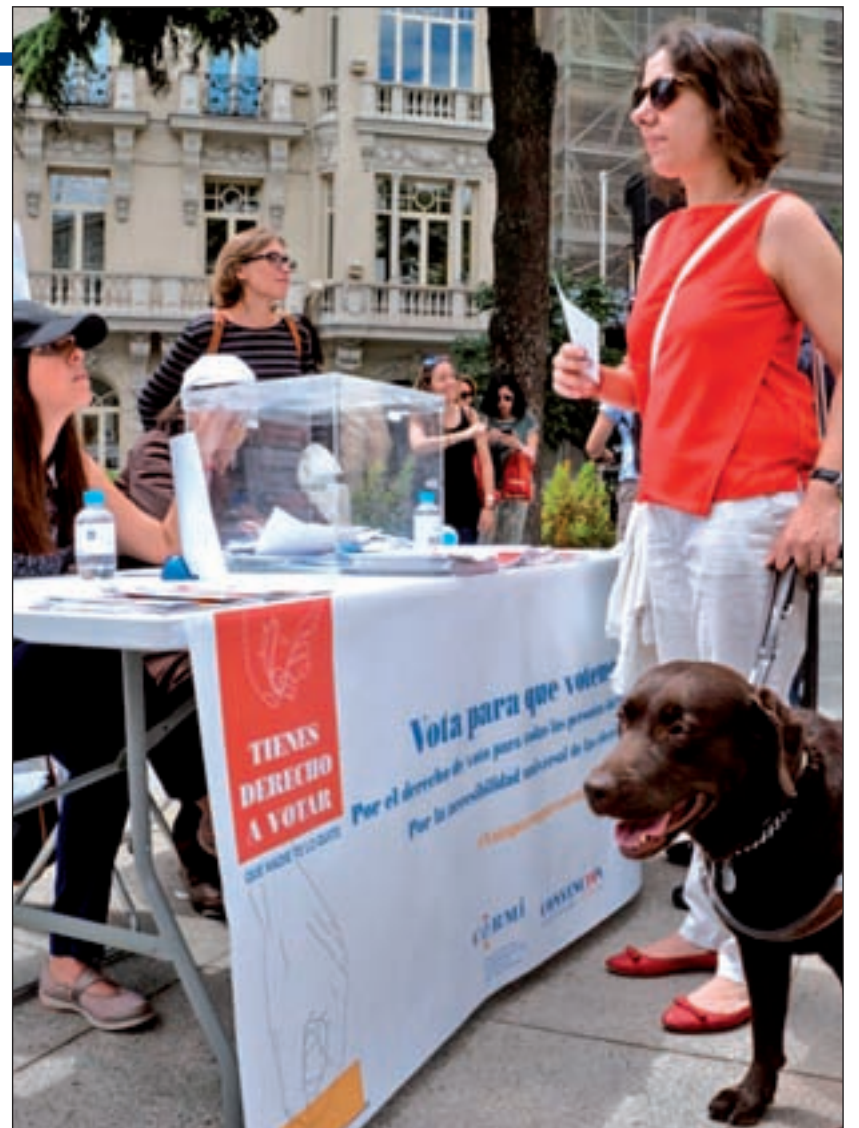
Diferentes colectivos protestaron a las puertas del Congreso

Sin embargo, quizá ésta sea la última vez que se den estas limitaciones ya que representantes de