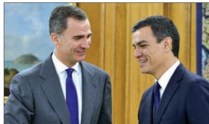
El rey Felipe VI junto a Pedro Sánchez

Felipe VI firmó dicho decreto después de la fallida investidura del candidato socialista, Pedro Sánchez, como presidente del Gobierno de España, único que