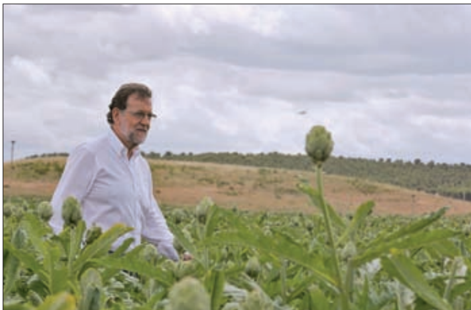
APUESTA POR EL MUNDO RURAL El PP ha optado para esta campaña electoral por los pueblos frente a las ciudades. Por ello, Mariano Rajoy sólo programó dos grandes mítines e hizo visitas a zonas rurales y provincias pequeñas.