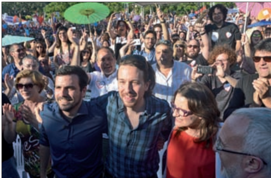
LA UNIÓN HACE LA FUERZA A pesar de que Izquierda Unida y Podemos han realizado campañas independientes con el objetivo de no diluir sus 'marcas', ha habido distintas oportunidades de escenificar su unión y sintonía, que marcarán los resultados el próximo 26-J.