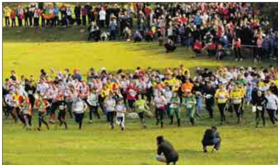
Las carreras se desarrollan en espacios naturales, por lo que llevan implícito respeto al medio ambiente.

Burgos suma 50 federados en este deporte, mientras que en España son 6.000