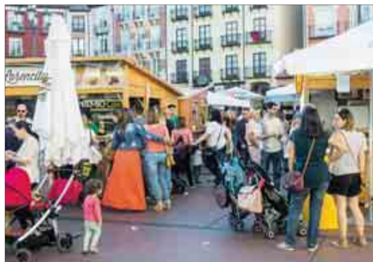
Imagina reclama baños móviles en las zonas de la Feria de Tapas.