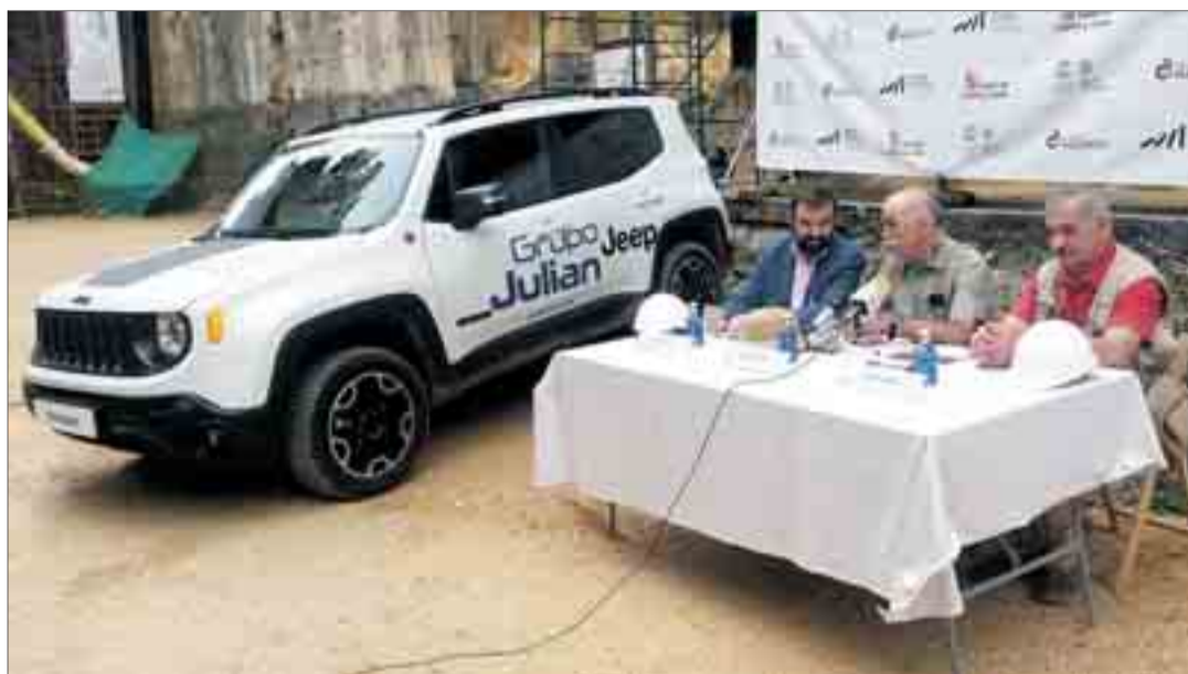
La firma del convenio de colaboración se celebró en los yacimientos de Atapuerca.