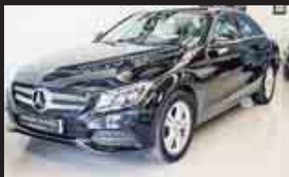
MERCEDES-BENZ C220 CDI Avangarde Año 2015. 170 cv. Cambio automático 7G. Faros LED inteligentes. Parktronic. Navegador. Asistente aparcamiento activo. 24 meses de GARANTÍA.