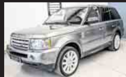
RANGE ROVER 3.6TDV8 SPORT Año 2009. Libro de Revisiones. Xenon. Navegador. Cuero. 12 meses de GARANTÍA.