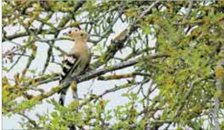
La abubilla es una de las aves que conviven en el Cinturón Verde de Burgos.

Aprender a reconocer las aves más representativas de los diferentes hábitats que conforman el cinturón verde; conocer la gran diversidad de especies que conviven junto a nosotros, así como sus costumbres; saber identificar los diferentes rastros que dejan los mamíferos; y profundizar en el conocimiento de las diferentes especies de árboles, arbustos y plantas son los objetivos de los paseos-talleres de observación de aves e interpretación del entorno natural del cinturón verde, que se desarrollarán del 11 al 17 de julio en diferentes zonas del mismo. Concretamente en el bosque de Villafraja, en el humedal de Fuentes Blancas, en el pinar de Villalonquejar, en el entorno de la vía verde y Monte de la Abadesa, en el campo Lilaila, en el alto de Las Torrecillas y en El Castillo.