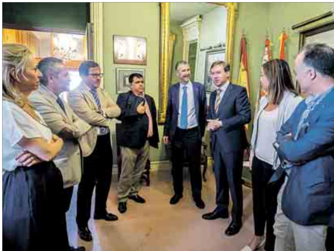
La reunión tuvo lugar el lunes 4 en el Ayuntamiento y ambos equipos ya están emplazados a una segunda en septiembre.