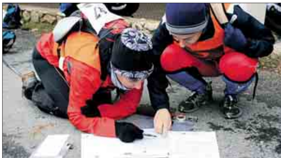
En el mapa solo se muestra dónde está el norte y el corredor debe orientarse gracias a la brújula.

la que participan 450 personas. A esto hay que añadir el Campeonato Escolar Provincial y el Regional, el Campeonato de España a nivel escolar y los universitarios de Castilla y León y España.