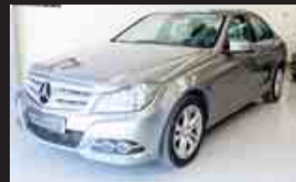
MERCEDES-BENZ C220 CDI Avangarde Año 2011. 170 cv. Navegador. Parktronic. Tempomat. 12 meses de GARANTÍA.