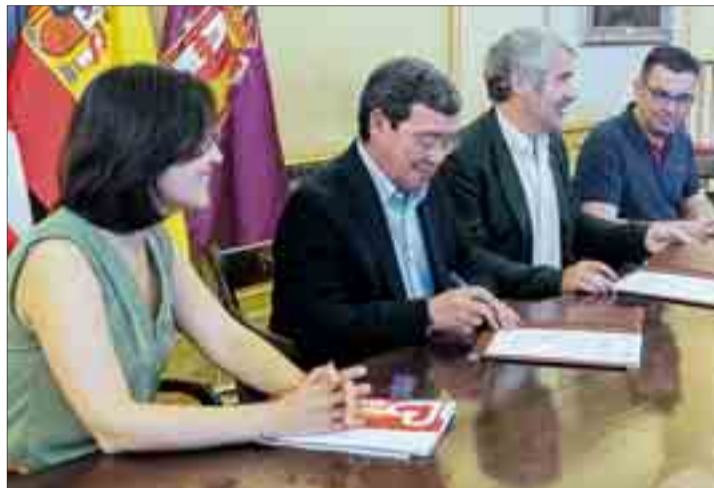
La firma del convenio entre ambas instituciones se celebró el lunes 4.