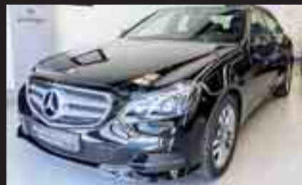
MERCEDES-BENZ E 220 CDI Avangarde Año 2015. 170 cv. Cambio automático 9G. Faros LED. Parktronic. Navegador. Asistente aparcamiento activo. 24 meses de GARANTÍA.