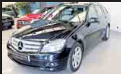
MERCEDES-BENZ C 200 CDI ESTATE Año 2011. 136 cv. Diésel. 12 meses de GARANTÍA.