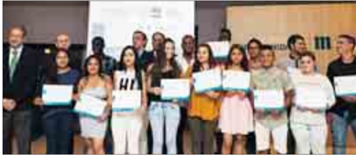
Alumnos de 'Creamos oportunidades de hostelería', en el acto de clausura.