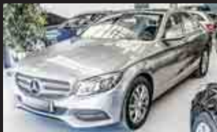
MERCEDES-BENZ C220 CDI Avangarde Año 2015. 170 cv. Cambio automático 7G. Faros LED inteligentes. Techo Panorámico. Navegador. Asistente aparcamiento activo. 24 meses de GARANTÍA.