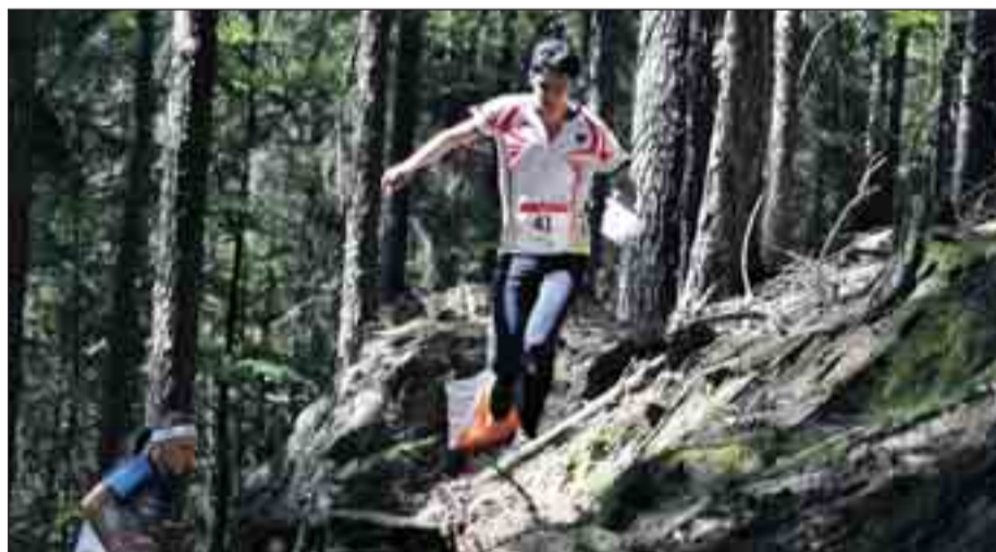
El participante tiene que escoger qué tipo de itinerario recorre en función del relieve y otros elementos.