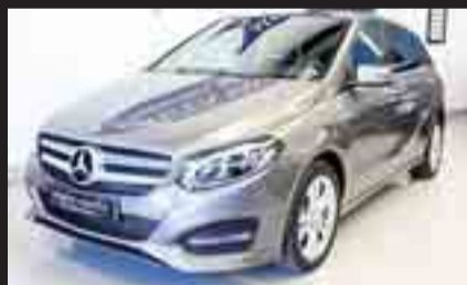
MERCEDES-BENZ B 180 CDI Urban Año 2015. Diésel. Cambio automático 7G. Tempomat. Techo Panorámico. 24 meses de GARANTÍA.