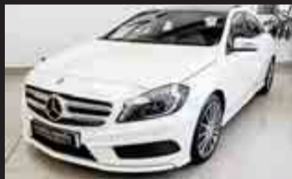
MERCEDES-BENZ A 180 CDI AMG Año 2015. Diésel. Cambio automático 7G. Xenón. Faros inteligentes. Tempomat. Techo Panorámico. 24 meses de GARANTÍA.