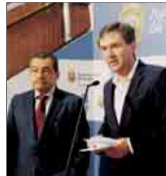
Gutiérrez y Lacalle anunciaron en rueda de prensa que Burgos acogerá en 2020 el Congreso Nacional de Urología.

Lacalle recordó que si Burgos se ha posicionado en los últimos años como referente en actividad