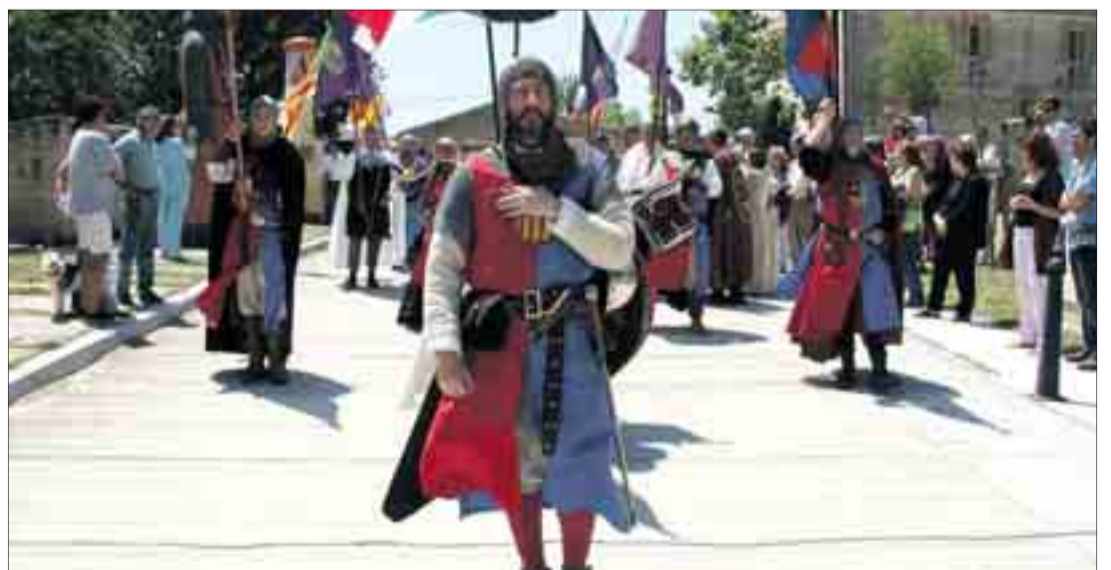
Un año más, no faltarán los desfiles en el homenaje que Vivar del Cid rendirá a su vecino más ilustre, el Cid Campeador.

El acto más significativo tendrá lugar el domingo día 17 después de la tradicional misa en la iglesia de San Miguel y consiste en la en-