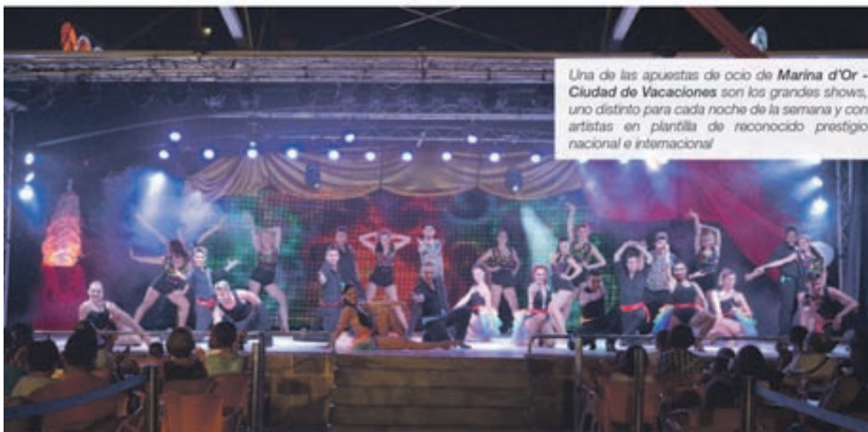
Una de las apuestas de ocio de Marina d'Or - Ciudad de Vacaciones son los grandes shows, uno distinto para cada noche de la semana y con artistas en plantilla de reconocido prestigio nacional e internacional