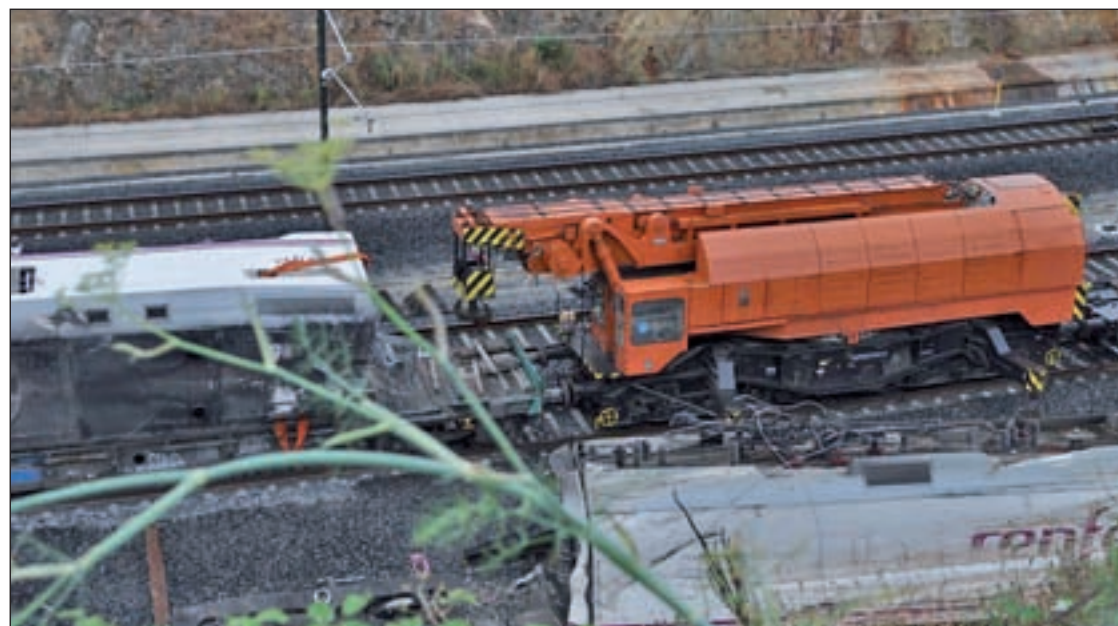
Imagen del accidente en la curva de A grandeira