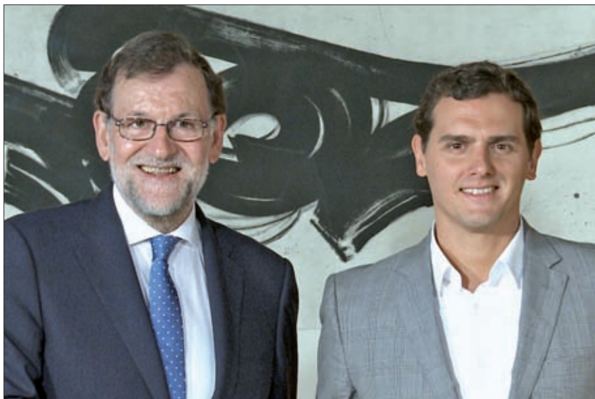
El líder del PP se reunió con el presidente de Ciudadanos el pasado martes