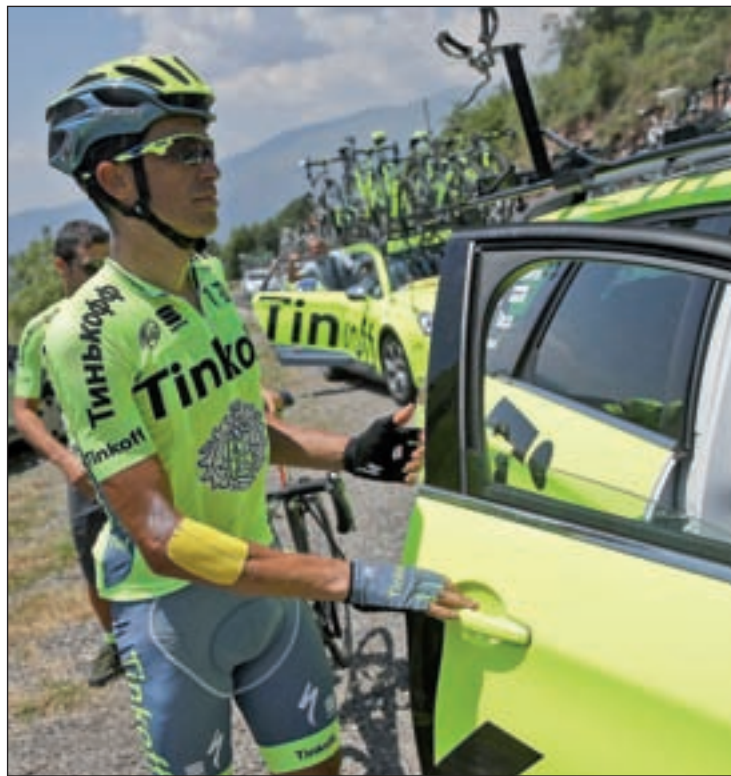
Contador, en el momento del abandono

Por su parte, el ciclista de Pinto fue mucho más tajante. "Los Juegos Olímpicos están prácticamente descartados, ya que no llegaría en condiciones óptimas. Por eso, ahora estoy centrado en recuperarme y en la Vuelta a España", comentó, al mismo tiempo que se mostró apesadumbrado