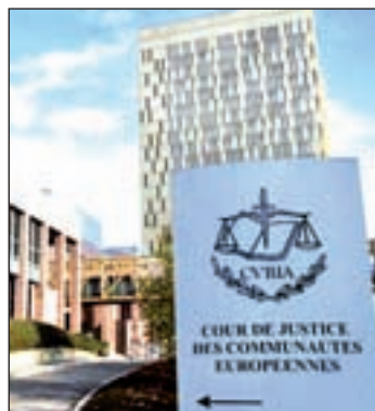
Tribunal de Justicia europeo

La opinión del abogado general no es vinculante para el Tribunal, que dictará sentencia antes de finales de año, pero en la mayoría de los casos sus conclusiones coinciden con el fallo.