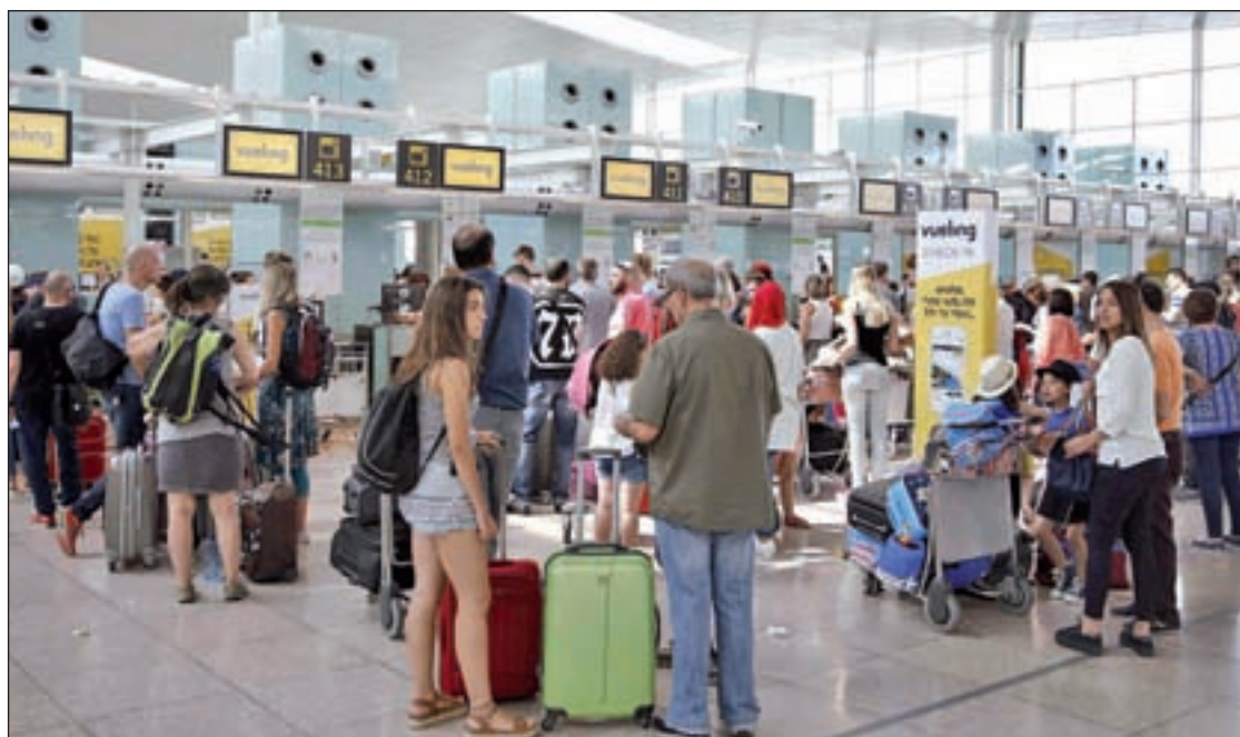
El objetivo es evitar situaciones como la de Vueling

Tras el caos producido por los retrasos y cancelaciones sufridos por los clientes de Vueling en medio de la temporada de verano, el Ministerio de Fomento ha instado a las aerolíneas a que se anticipen a las incidencias, haciendo hincapié en la necesidad de contar con un plan operativo que permita una rápida respuesta ante los problemas, durante una reunión entre el departamento de Ana Pastor y el sector.