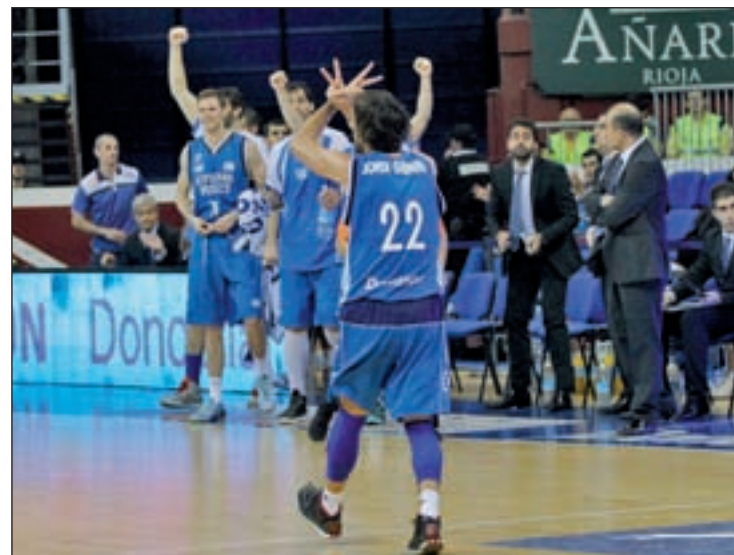
El futuro del Gipuzkoa Basket sigue en entredicho

me adapto muy bien, quizás porque tiene muchas curvas de izquierdas, un poco como en el dirt-track", comentó en las declaraciones facilitadas por el equipo. El catalán avisó que la meteorología puede jugar un "papel importante" como ya lo ha hecho en ocasiones anteriores. "Es otro cir-