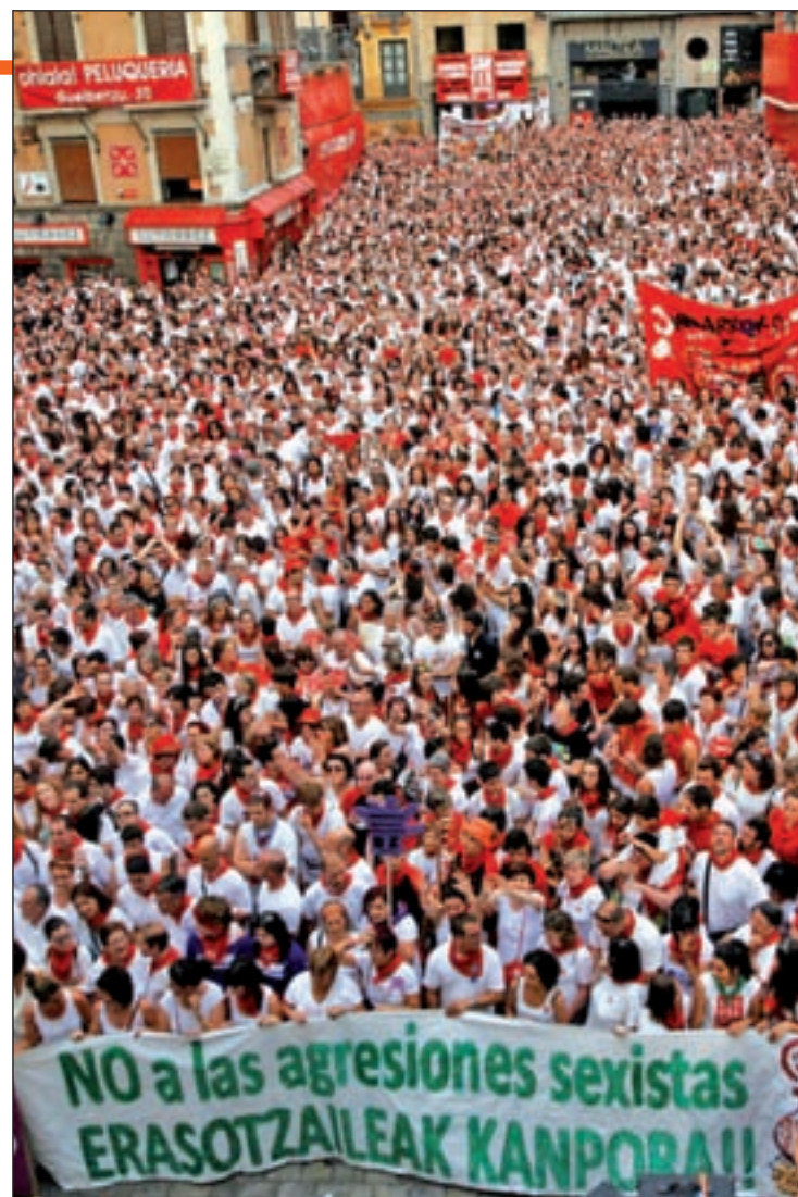
Manifestación en Pamplona tras las agresiones de este año

A pesar de estos consejos, hay que tener claro que el foco de la lucha contra este tipo de violencia contra la mujer no debe ponerse en las víctimas, sino en los agresores. “La solución pasa por la educación, por enseñar a los jóvenes que tienen que respetar la libertad de las mujeres y que, cuando una mujer dice no, es un no, no un tal vez ni no un quizá. Un no. La solución no es educarnos a nosotras en que a determinadas horas hay que coger un taxi. Es enseñar a los jóvenes que no deben violar”, explicó la presidenta de la