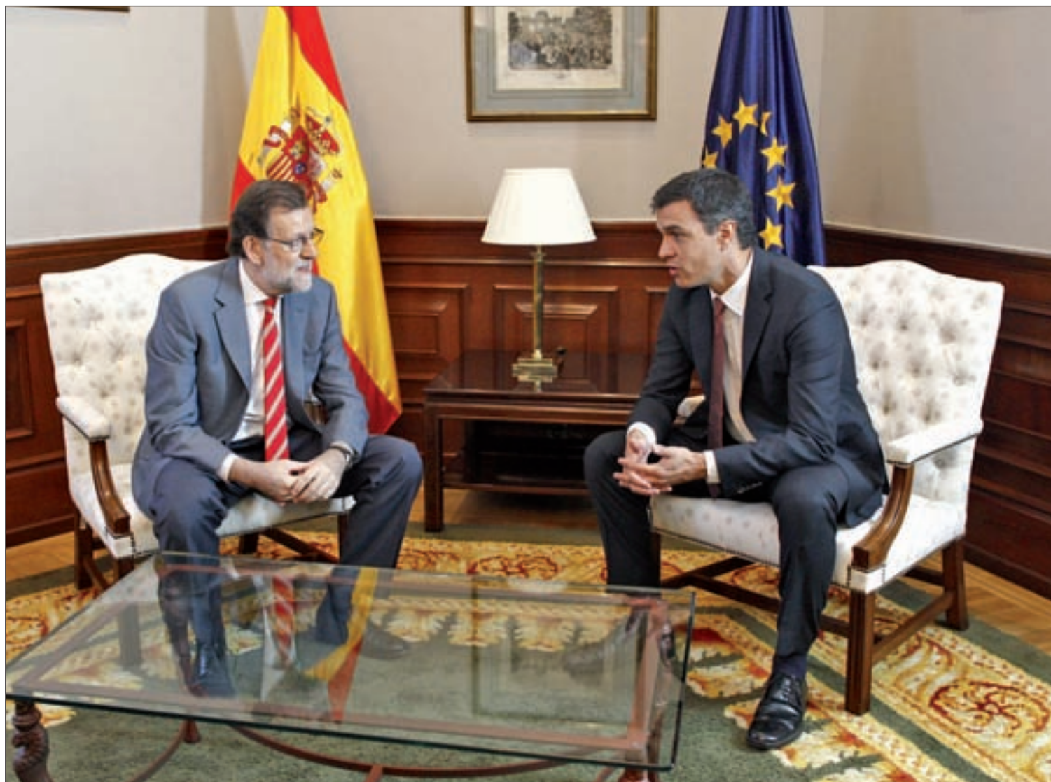
Mariano Rajoy se reunió con Pedro Sánchez el pasado miércoles

El presidente del PP no se presentará a la votación si no cuenta con los apoyos necesarios. Ciudadanos se abstendrá sin condiciones para permitir un gobierno en minoría PÁG. 6