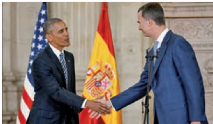
Obama durante su encuentro con el Rey

En este breve periodo de tiempo, Obama se reunió en La Moncloa con el presidente del Gobierno, Mariano Rajoy. Durante la reunión ambos mandatarios se intercambiaron presentes. Rajoy regaló al presidente americano un jamón, mientras que este le correspondió con una caja de cristal que llevaba grabado el escudo de los Estados Unidos.