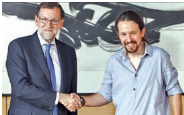
REUNIÓN CON IGLESIAS Mariano Rajoy constató las diferencias ideológicas entre PP y Podemos, pero agradeció su "disposición al diálogo", después de la reunión que mantuvieron el pasado martes.

El presidente del Gobierno en funciones, Mariano Rajoy, concluyó su ronda de contactos con los partidos con representación parlamentaria sin alcanzar los apoyos suficientes para gobernar, por lo que anunció que podría no acudir a la sesión de investidura si supiera que no puede ganar. Por el momento, mientras PSOE y Podemos se mantuvieron en su voto en contra, Ciudadanos anunció que se abstendrá en la segunda votación para favorecer la creación de un Ejecutivo en minoría.