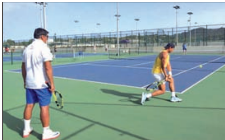
El jugador manacorí en las pistas de su fundación

Más allá de ser un torneo especial, por historia y por el hecho de