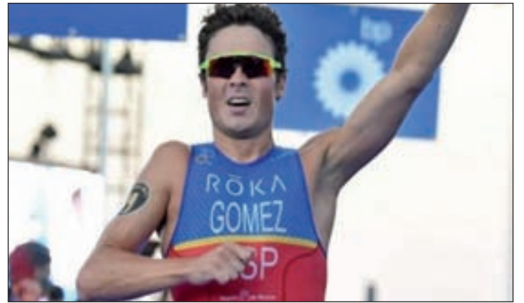
Javier Gómez Noya

Hay muchos países luchando por esos primeros puestos, pero nada es imposible. De hecho, en las últimas pruebas hemos conseguido medalla y estar entre los tres mejores equipos del mundo. La clave es poder repetirlo ese día en concreto en Rio. Esa será la mayor dificultad.