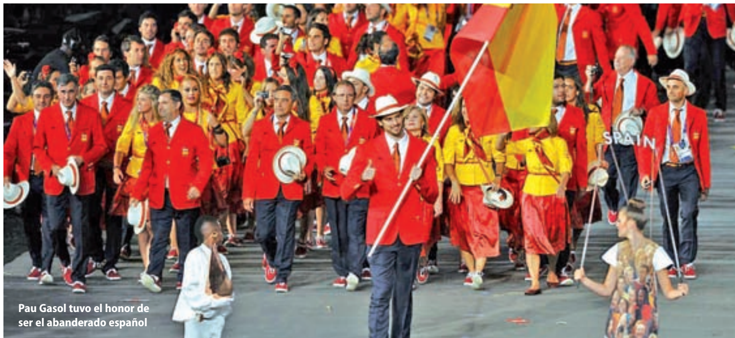
Pau Gasol tuvo el honor de ser el abanderado español