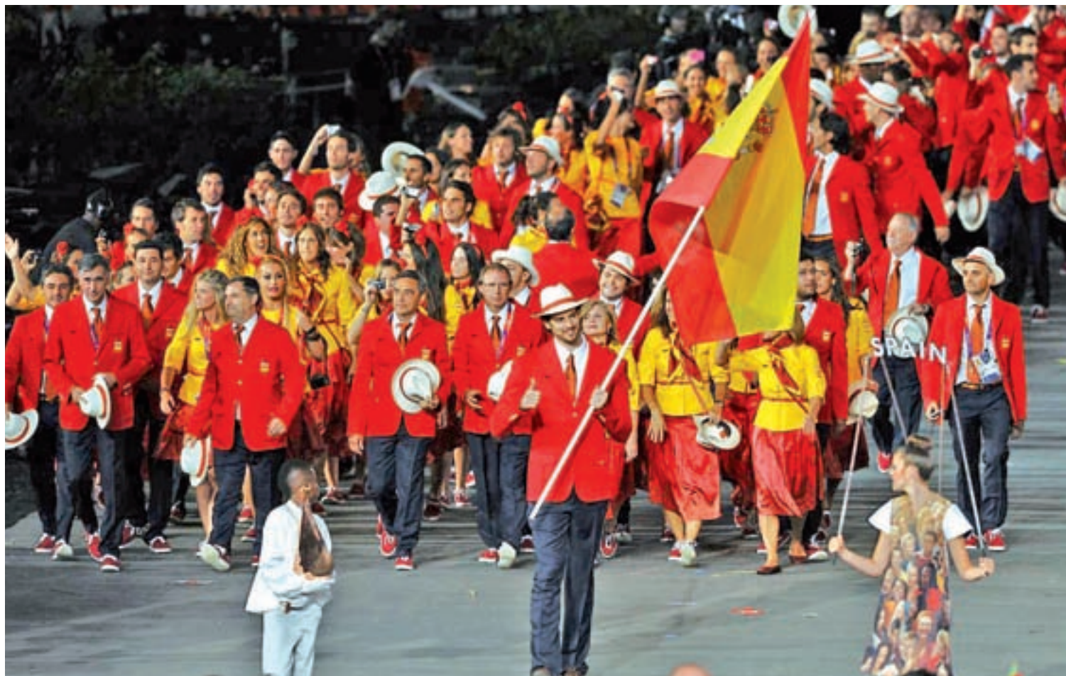
Pau Gasol tuvo el honor de ser el abanderado español en los anteriores Juegos de Londres