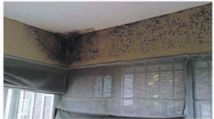
Problemas de humedad por condensación

jefe de micología en el instituto de la Salud Pública Louis Pasteur, explica este aumento por nuestro modo de vida: "Vivimos más en el interior, en casa o en el despacho. Desde los años 60, tendemos a un exceso de aislamiento para no dejar escapar el calor y además no se airea suficientemente".