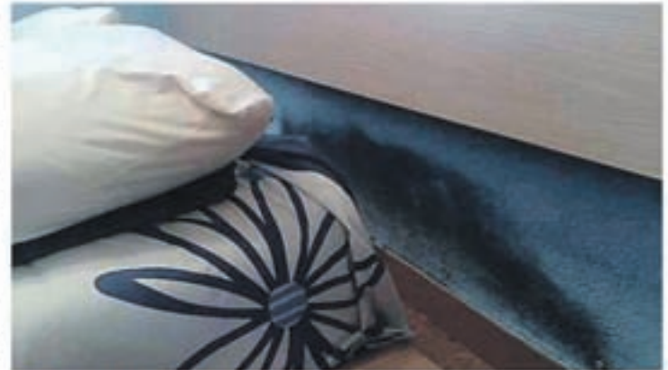
Problemas de humedad por capilaridad

Se han realizado estudios científicos sobre adolescentes que sufren afecciones respiratorias, dando como resultado un 83% de asma, bronquitis asmáticas y bronquitis crónicas y un 87% de rinitis crónicas, que alcanzan a jóvenes que viven en habitaciones demasiado húmedas. De un 20 a un 30% de nosotros sufrimos alergias respiratorias, ¡dos veces más que hace 20 años!. Edouard Drouhet,