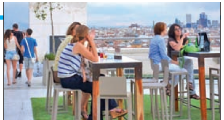
Terraza del Círculo de Bellas Artes

gares de altura (Círculo de Bellas Artes) y las entrañables terrazas de barrio, como La Cruz Blanca de Vallecas. Todas pugnarán por hacerse con el favor del gran público.