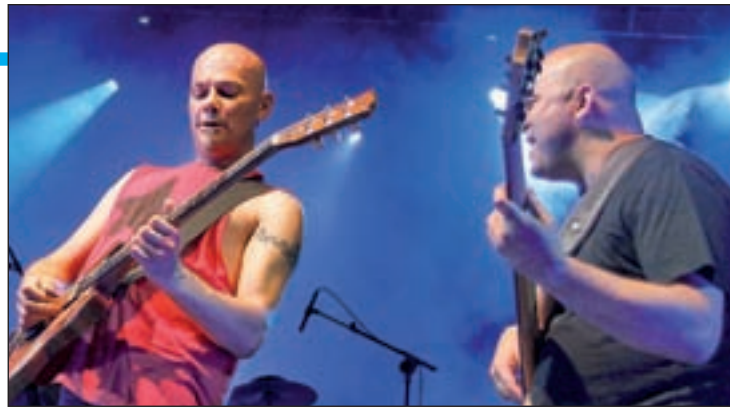
Celtas Cortos estará en Pinto

Los sonidos románticos del cantante gaditano Manu Carrasco inundarán el escenario el lunes 22 por un precio de 20 euros cada entrada, mientras que el violinista libanés de origen armenio y nacionalidad española Ara Malikian protagonizará un cambio