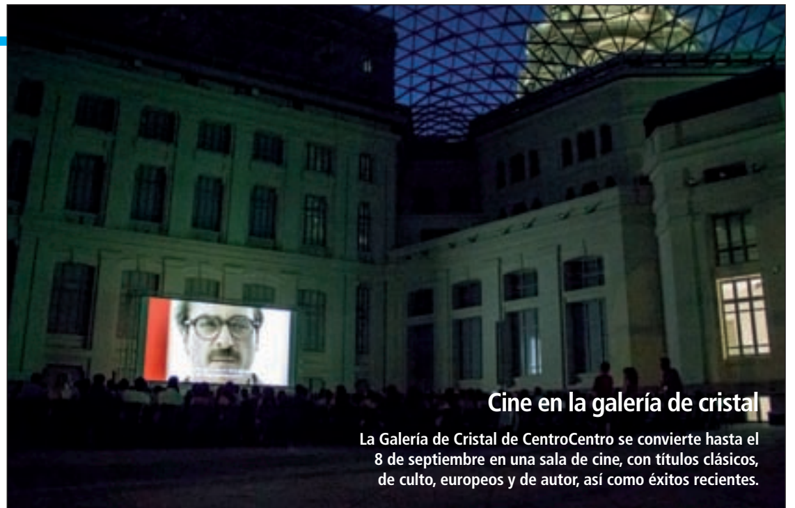
Cine en la galería de cristal

Otra alternativa en la capital es la Terraza de la Casa Encendida, que se transformará en 'La Terraza Magnética', con una programación de películas y conciertos que, según fuentes de la organización, crearán un "campo magnético" al