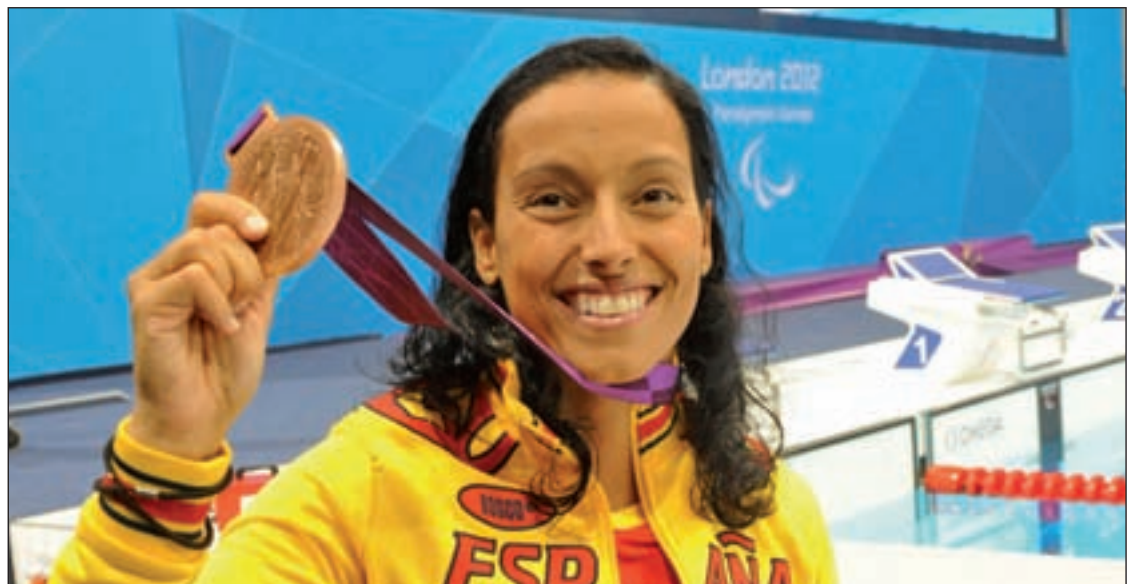
Teresa Perales, la gran referencia de la delegación española