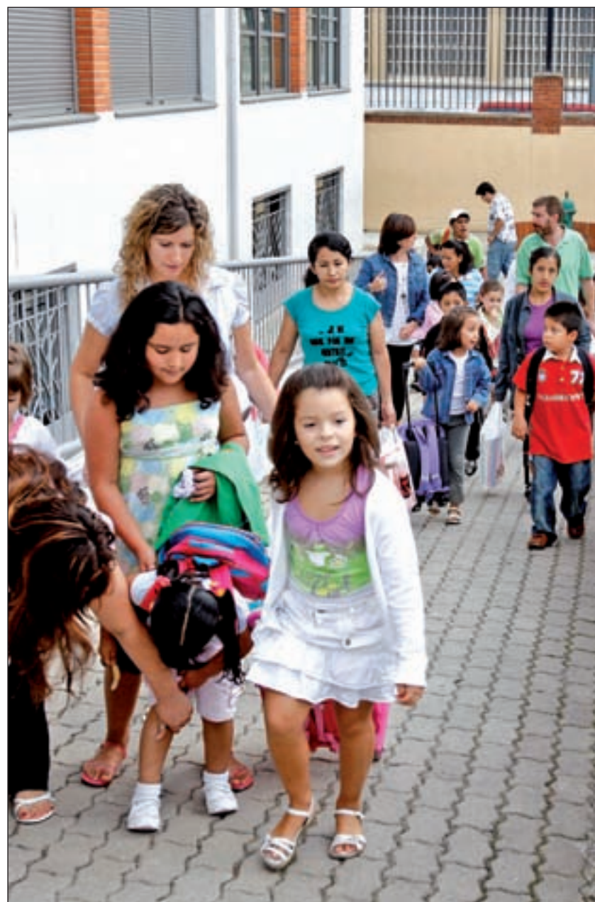
Los niños volverán la semana que viene a las aulas

Más allá de las complicaciones horarias, este tipo de clases suponen un gasto que se suma a los que las familias han de afrontar en la 'vuelta al cole'. La cuota mensual de las actividades varía entre los 10 y los 40 euros de me-