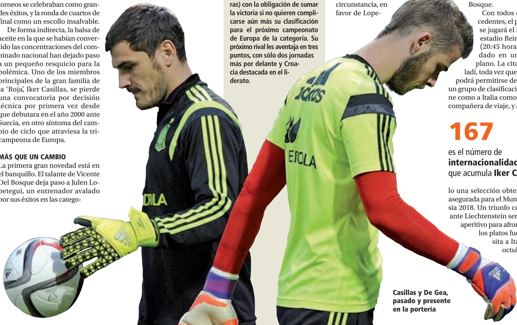
Casillas y De Gea, pasado y presente en la portería

lo una selección obtendrá plaza asegurada para el Mundial de Rusia 2018. Un triunfo convincente ante Liechtenstein sería el mejor aperitivo para afrontar uno de los platos fuertes: la visita a Italia el 6 de octubre.