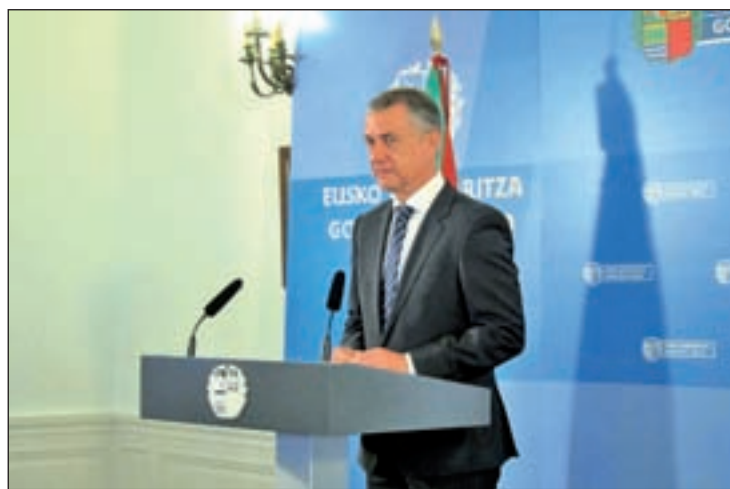
El lehendakari Íñigo Urkullu

A esto se une otro dato importante. En el caso de que los nacionalistas vascos necesitaran un pacto con el PP para conservar el poder en su territorio, los populares podrían exigir el voto de los cinco diputados del PNV en el