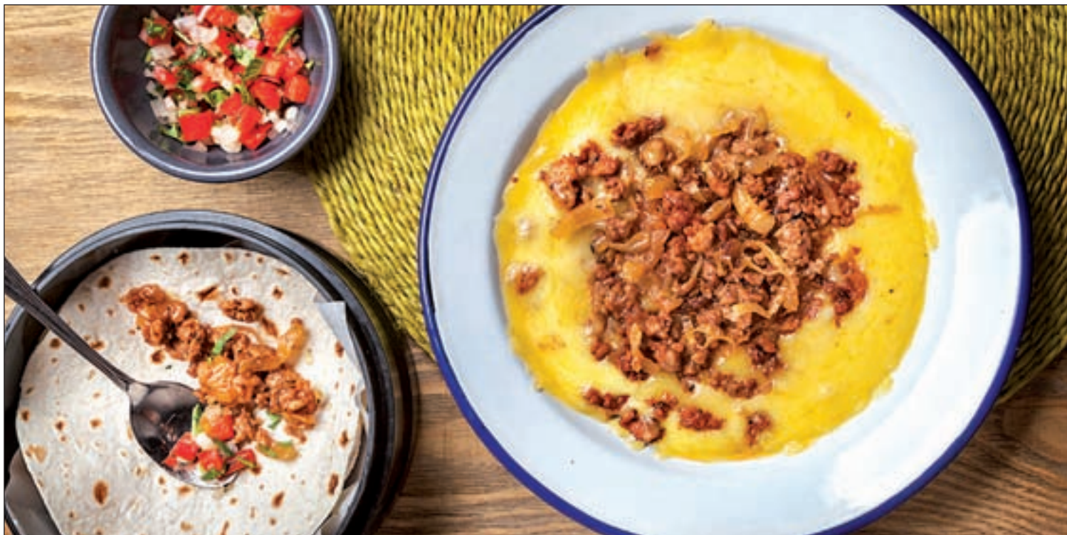
La Chelinda incorporará la enchilada de mole poblano, una receta ancestral