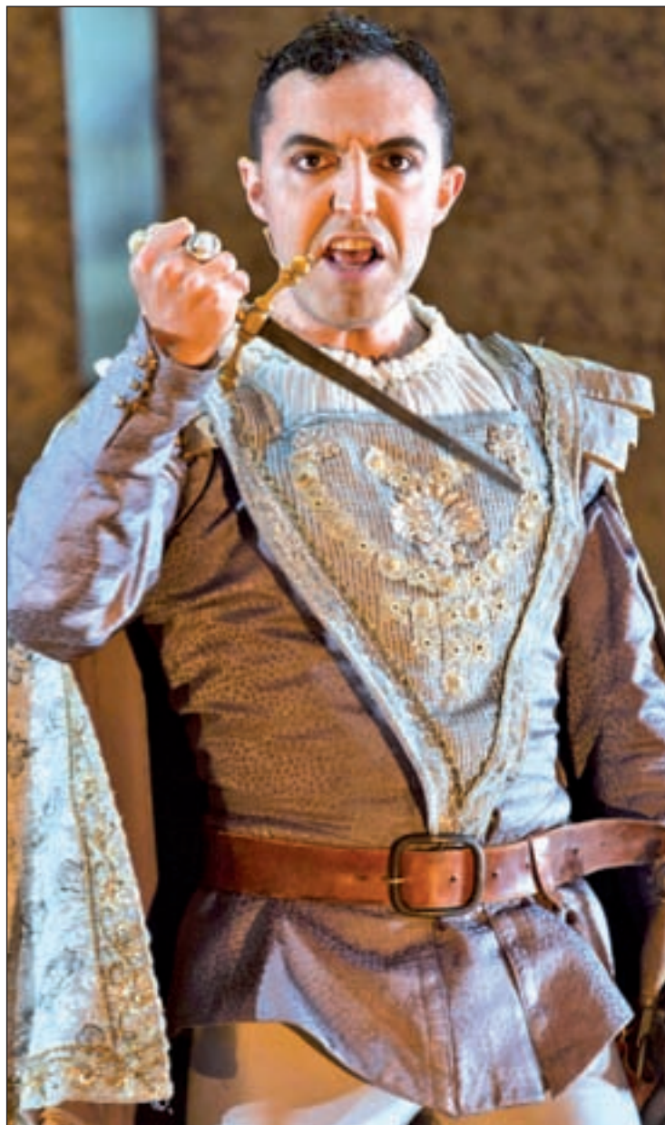
Puesta en escena de 'La venganza de Don Mendo'