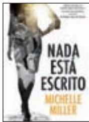
Nada está escrito MICHELLE MILLER PLAZA&JANÉS

Septiembre es sinónimo de la vuelta a la rutina, pero también trae consigo novedades para que el camino no se haga cuesta arriba