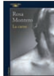
La carne ROSA MONTERO ALFAGUARA

Un libro para descubrir si el amor verdadero es capaz de sobrevivir al paso del tiempo.