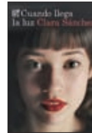
Cuando llega la luz CLARA SÁNCHEZ DESTINO