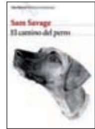
El camino del perro SAM SAVAGE SEIX BARRAL

Viejos recuerdos que dan lugar a una novela llena de humor y con un final inesperado.