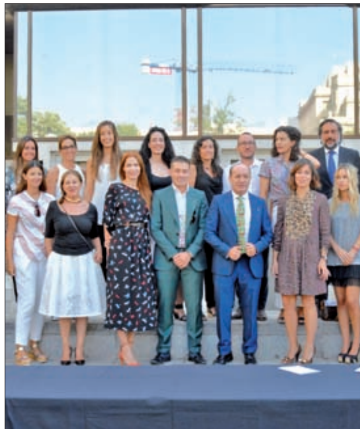
Diseñadores y patrocinadores de MFSHOW CHEMA MARTÍNEZ/GENTE

para comprar de Madrid, con esas peculiaridades que marcan la diferencia entre unas y otras; sus atractivos y sus eventos. Entre otras, la web destaca Salesas Village o la Zona Jorge Juan, con su Mercado de las Flores o la Noche de San Jorge Juan.