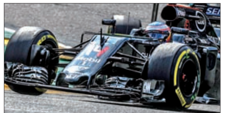
El piloto asturiano firmó una gran remontada en Bélgica

mo tiempo que asegura que su bólido peleará con los de Ferrari y los de Force India en breve, aunque en el seno de McLaren avisan de que será un duro fin de semana. Por su parte, Carlos Sainz tiene una nueva ocasión de reivindicarse tras el inoportuno abandono en Spa.