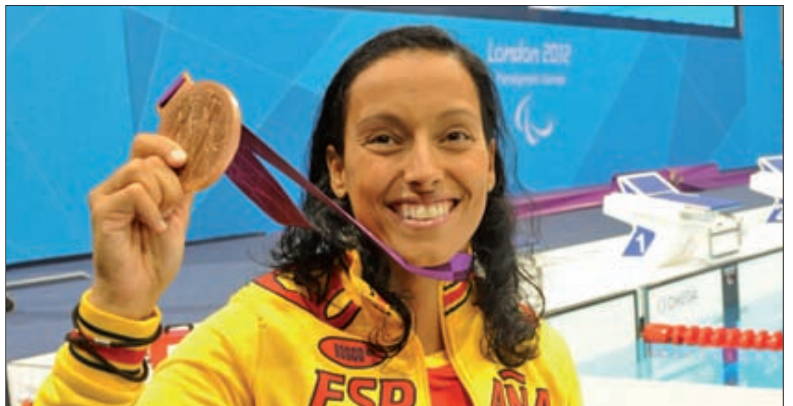
Teresa Perales, la gran referencia de la delegación española