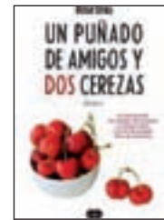
Un puñado de amigos y dos cerezas ROSA GRAU SUMA DE LETRAS

Sobre el papel, la prueba de que nunca puedes huir ni olvidar el pasado, porque este siempre te encuentra.