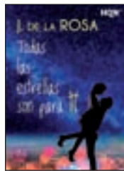
Todas las estrellas son para ti J. DE LA ROSA HARLEQUÍN

Esta es la historia de una rivalidad olvidada en la ciudad que fue el centro del arte.