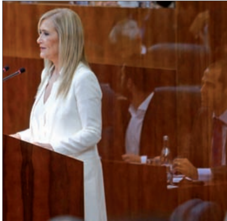
Cristina Cifuentes, durante su discurso en la Asamblea

Otra de las pretensiones iniciales es la de modificar el calendario escolar para que los exámenes de recuperación, que ahora se realizan en el mes de septiembre, pasen a hacerse en junio. Algo que ya se hace en otras comunidades autónomas en la actualidad y en la universidades adscritas al Plan Bolonia. Cifuentes también anun-