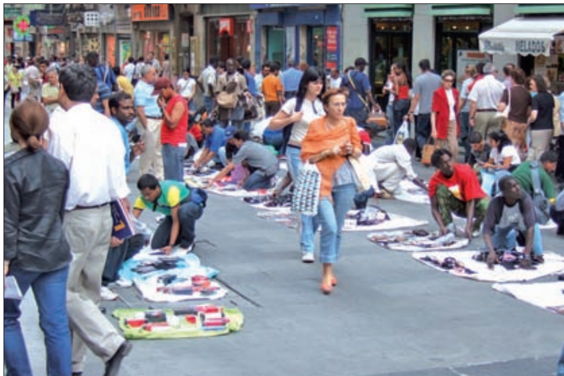
Los manteros son habituales en las calles del centro de Madrid

A pesar de que este mismo lunes el Consistorio aseguró que este ámbito punitivo se retrasaba, la misma alcaldesa, Manuela Carmena, confirmó dos días después que el plan "sigue en vigor y ya se está desarrollando". "Se van a llevar a cabo los dos planes ya que no se puede permitir que haya una impunidad para los manteros", afirmó la regidora.