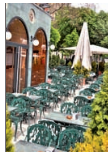
Una terraza de la capital

del plan destacan la creación de un carnet de ciudadanía madrileña que dé acceso a los recursos municipales, una ampliación y refuerzo con nuevas funciones de la Oficina de Atención a la Población Migrante o la puesta en marcha de alternativas sociolaborales. Por el momento, ya se está trabajando en espacio de diálogo con las asociaciones de manteros, de comerciantes y responsables de las Juntas de distrito.