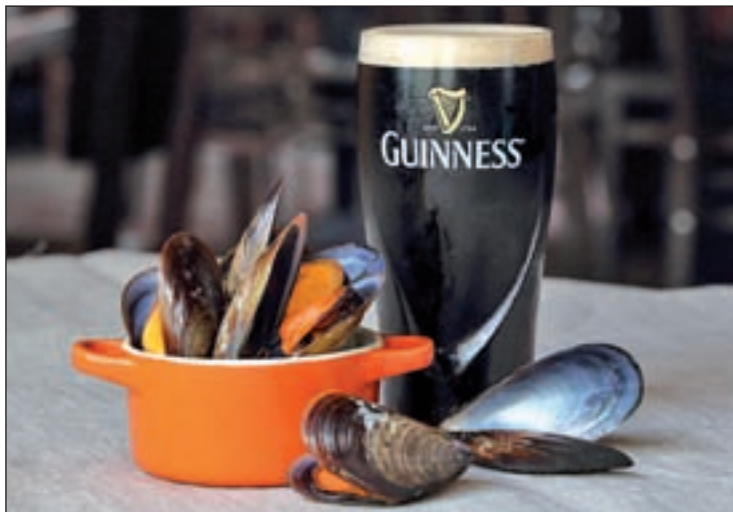
Mejillones y Guinness, un maridaje con sabor irlandés

A. B. Molly Malone, la heroína dlinesa protagonista del himno no oficial de Irlanda, es uno de los grandes iconos del país celta. Leyenda o realidad, la que fuera vendedora de moluscos cuenta incluso con su propia estatua en las calles de Dublín. Para celebrar su día, el 15 de septiembre, por cada Guinness que se consuma en un Official Irish Pub, habrá mejillones gratis para acompañar la cerveza.