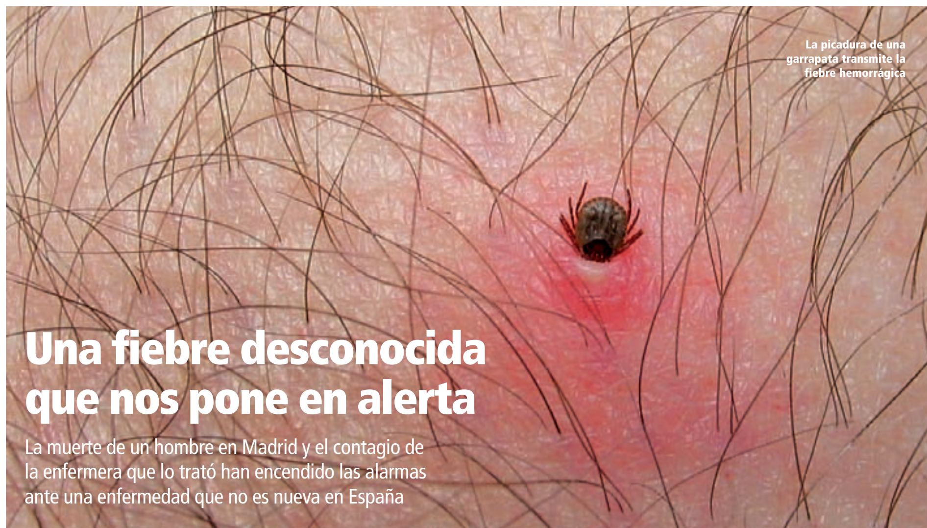
La picadura de una garrapata transmite la fiebre hemorrágica