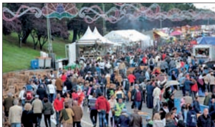
Edición anterior de las fiestas

Por su parte, el lunes 12 comenzará, en el centro deportivo integrado Arganzuela, un ciclo de cine dedicado a la comedia. No será la única cita con la gran pantalla, ya que el día 16 Cinarrío (Cine de Barrio) exhibirá cortometrajes, seguidos de charla-coloquio sobre consumo responsable en Legazpi (detrás del antiguo Mercado de Frutas a las 20 horas).