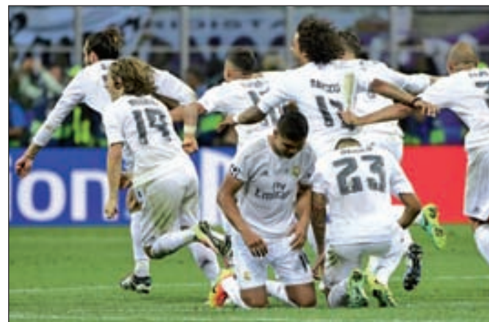
El Madrid defiende la corona conquistada en Milán