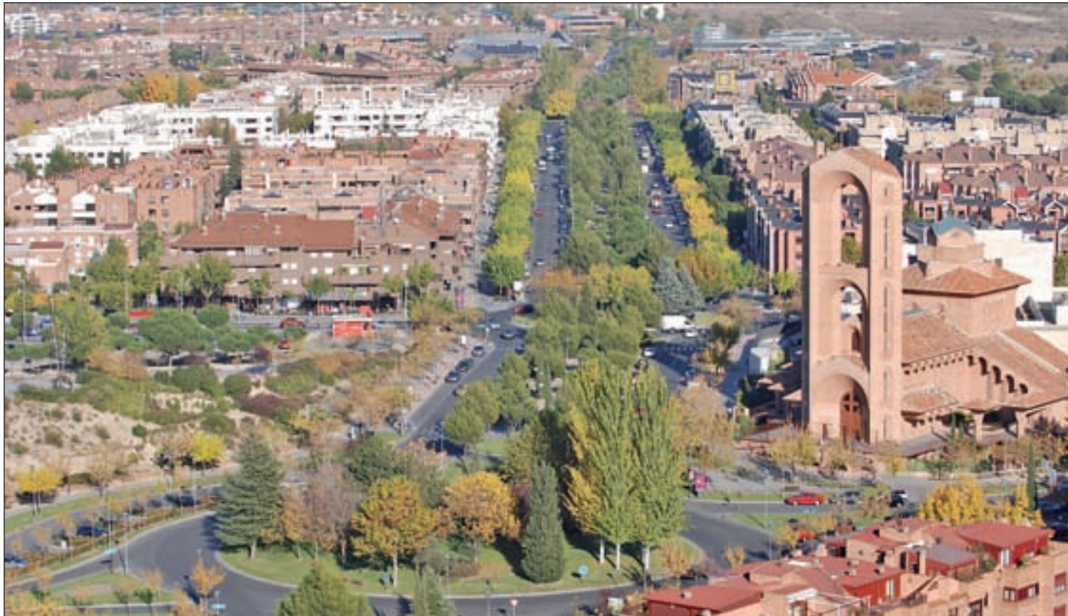
Pozuelo de Alarcón lidera el ranking presentado por la Agencia Tributaria