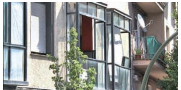
Despacho de abogados en el que se produjeron tres muertes

Uno de los hechos que contribuyeron a que Madrid haya experimentado este incremento es el suceso que se vivió el pasado 22 de junio, cuando tres personas fueron asesinadas en un despacho de abogados del distrito de Usera, presuntamente por un ajuste de cuentas.