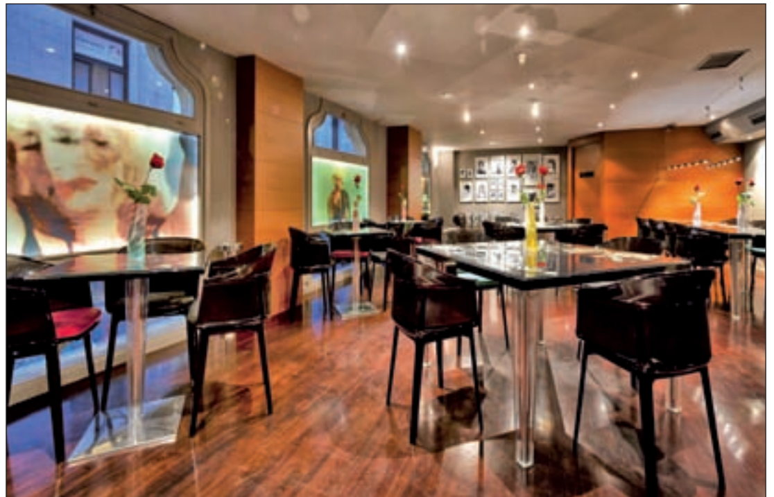
El Hotel Villa Real es uno de los que participa en esta iniciativa

A. B. Gira de Mercaderes es una feria itinerante de diseño que durante siete sábados (17 y 24 de septiembre y todos los de octubre) dará color y ambiente a las plazas colindantes al mercado de Las Águilas (Aluche) y al de Prosperidad. Nuevos diseñadores españoles se unirán a juegos y talleres para toda la familia para dinamizar dichos espacios.