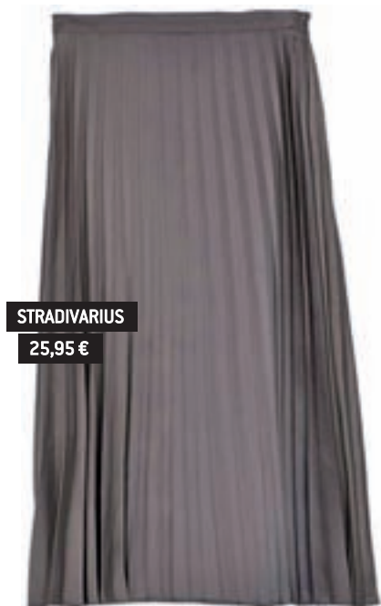
STRADIVARIUS 25,95 €

Faldas, pantalones y camisas plisadas ya se empezaron a ver la temporada anterior.