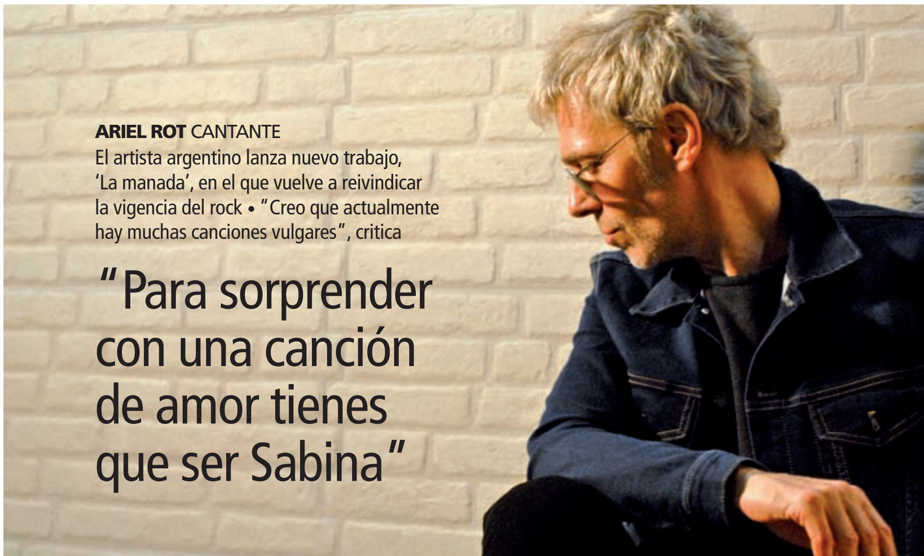
CHEMA MARTÍNEZ / GENTE