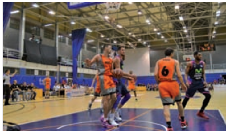
El Montakit durante el Circuito Movistar GENTE

El conjunto sevillano viaja hasta Fuenlabrada para poner a prueba el nuevo proyecto del Montakit. En el banquillo visitante se podrá ver de nuevo al extécnico naranja Zan Tabak, que diri-