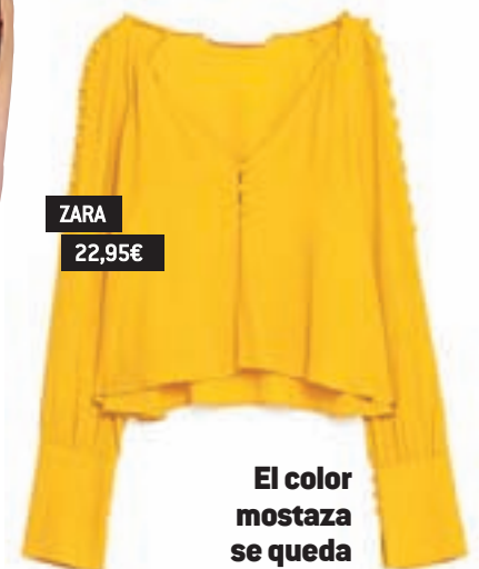
ZARA 22,95 €

Es una de las tendencias estrella para este otoño/invierno. Verás esta tela en camisetas, vestidos, monos, bolsos, americanas e incluso en calzado.