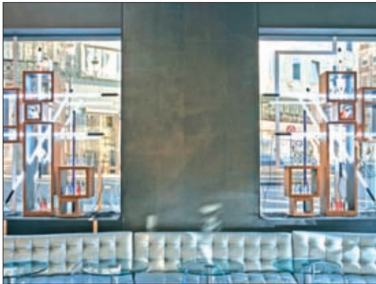
Las obras se pueden ver desde dentro y desde fuera del Hotel Urban