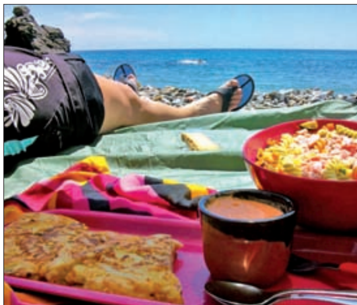
Los días de vacaciones quedaron atrás

Con respecto al año pasado, se da la circunstancia de que un 24% de los habitantes de la Comunidad de Madrid reconoce que se gastó más dinero este verano que durante la época estival de 2015. Un 47% asegura que destinó la misma cantidad y un 29% señala