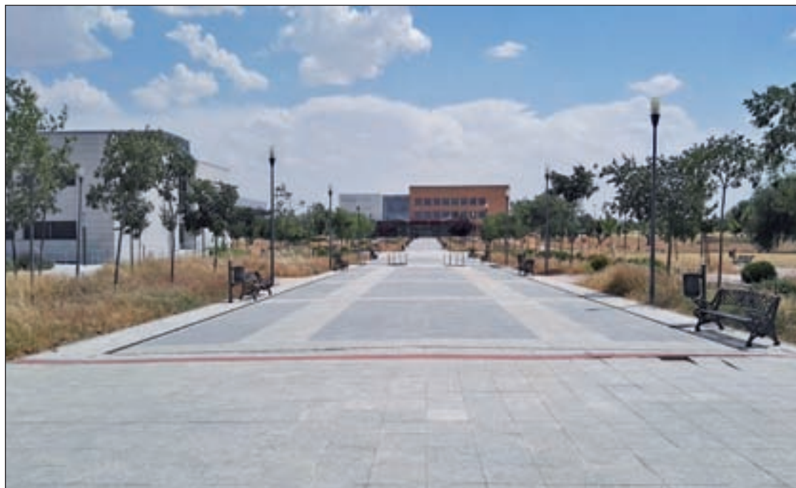
Campus de Fuenlabrada de la URJC.

El regidor ha adelantado esta semana que el periodo de presentación de solicitudes se hará en torno a los meses de octubre y noviembre, con el objetivo de que sea en 2017 cuando se abonen las ayudas. "Si no, es muy difícil saber cuáles son las necesidades de los estudiantes, a que universidad