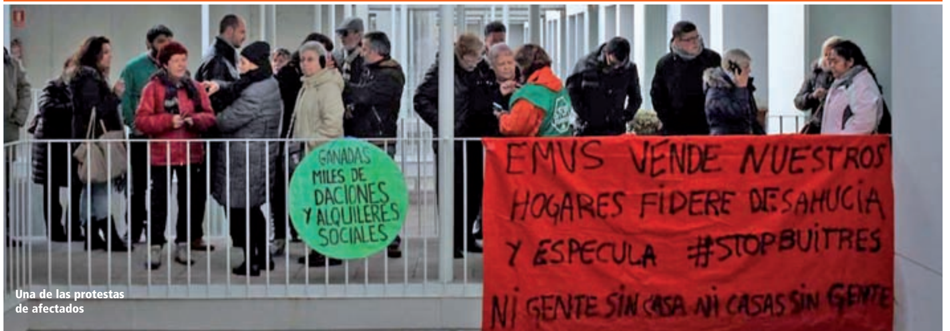
Una de las protestas de afectados