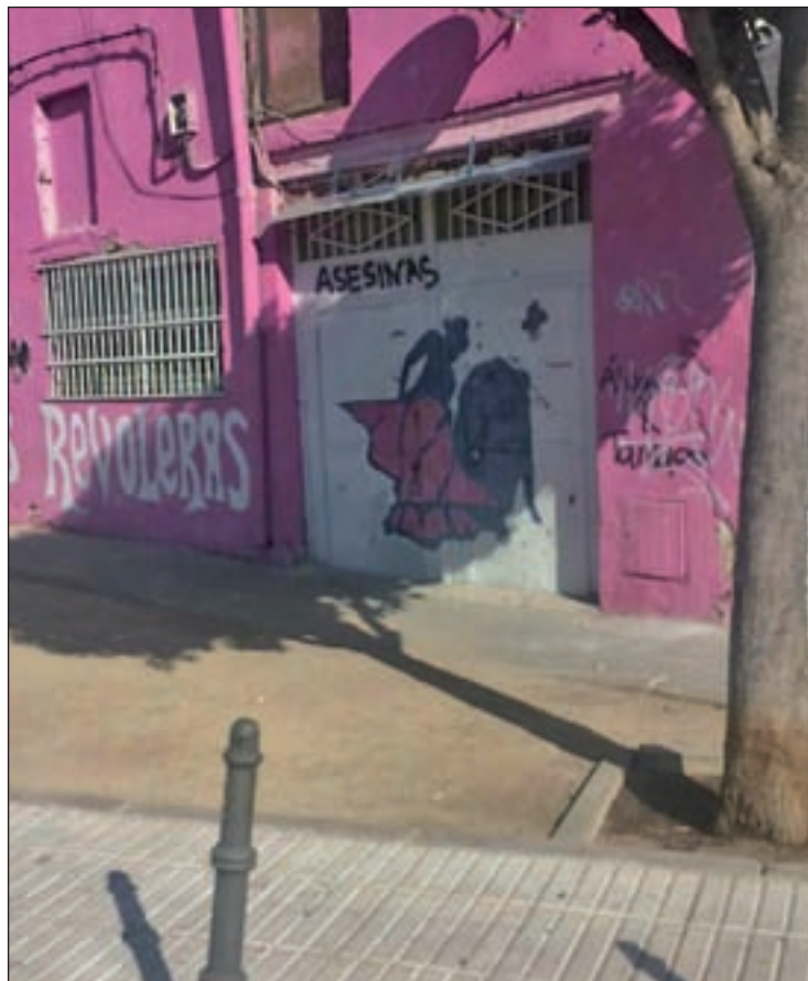
Pintadas en la peña Las Revolveras GENTE

MANIFESTACIÓN PRO TAURINA Las pintadas aparecían el mismo día para el que estaba convocada