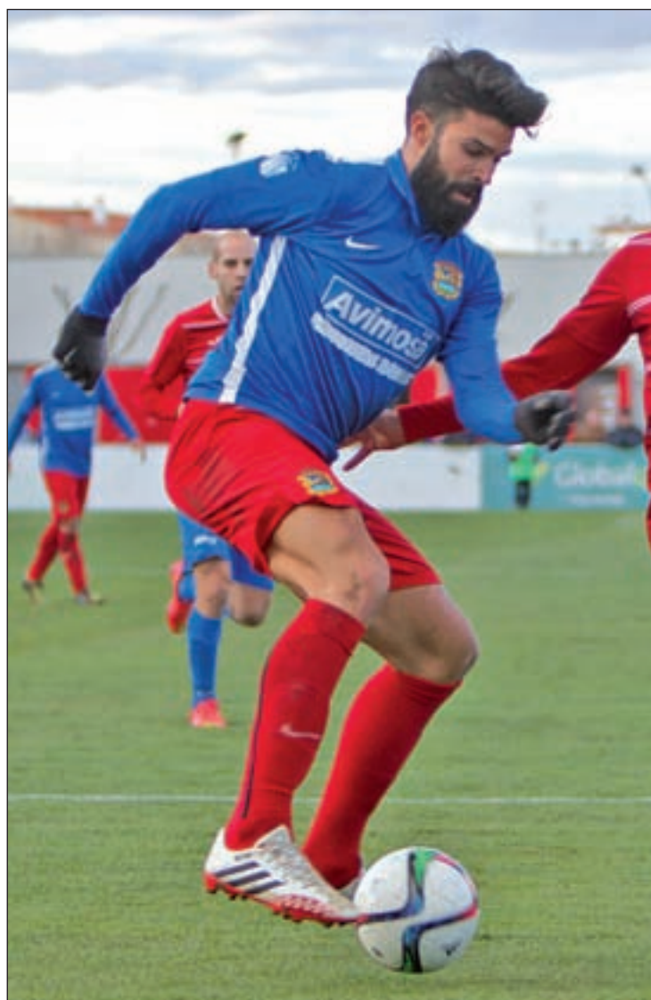
El CF Fuenlabrada, durante un encuentro