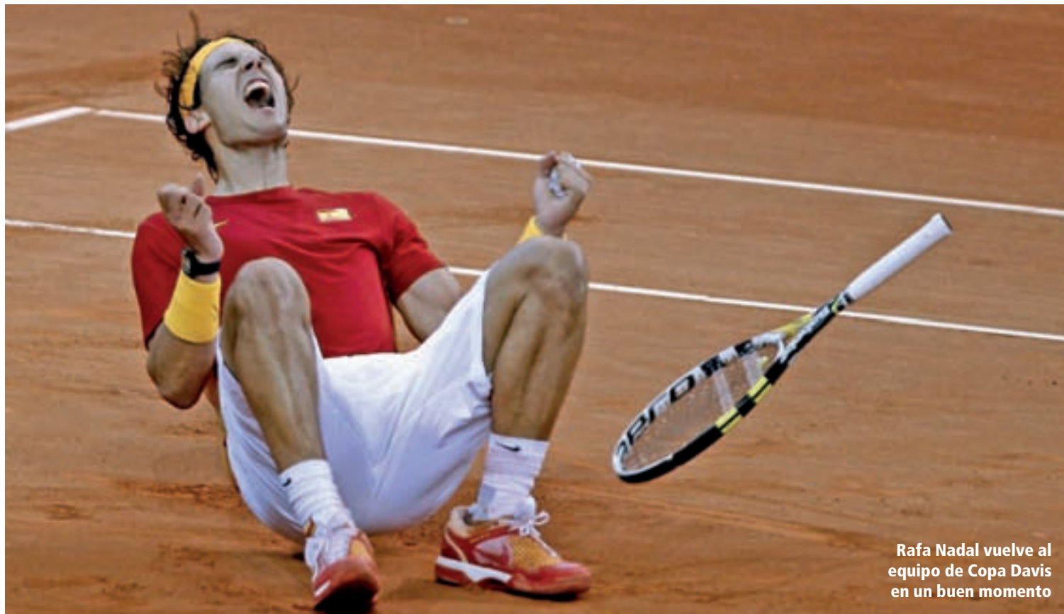
Rafa Nadal vuelve al equipo de Copa Davis en un buen momento