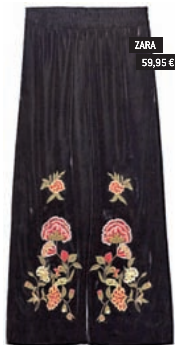
ZARA 59,95 €

Puedes cogérsela prestada a tu chico o a tu padre, pero también la encontrarás en la sección femenina.