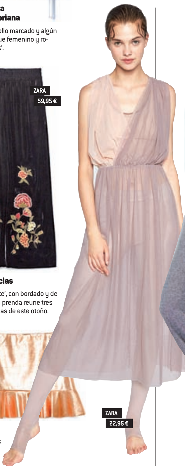
ZARA 22,95 €

El lúrex, los tonos plateados y los tejidos metalizados estaban reservados para la noche, y ahora pasan al día.