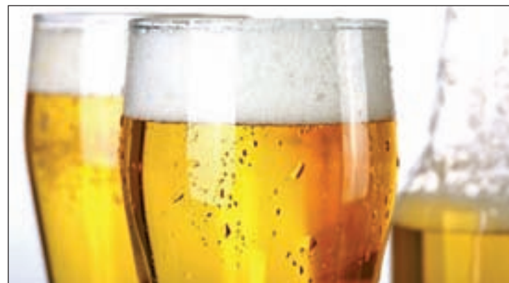
El 47,8% de los españoles se fija en que la caña esté fría

Intensa, ligera, suave, madura... Pocos son los que saben diferenciarlas.