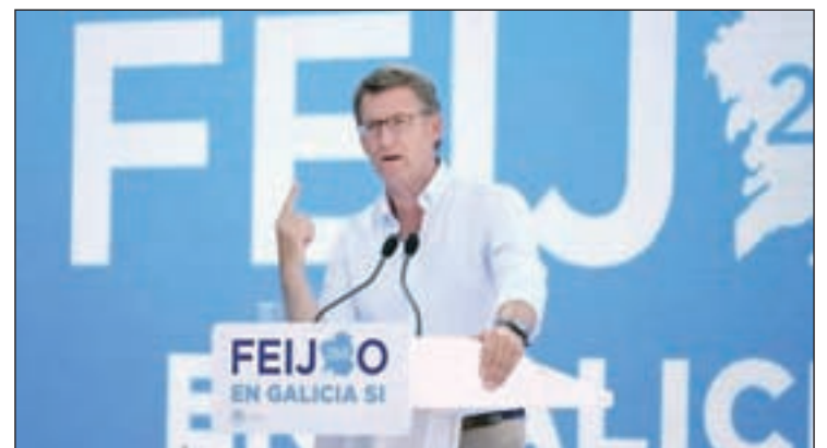
Alberto Núñez Feijóo, en un acto de campaña

El vencedor en el caso del País Vasco sería Íñigo Urkullu, ya que el PNV ganaría al lograr 27 ó 28 escaños, de forma que obtendría el mismo resultado o un escaño más que en los anteriores comicios. EH Bildu conseguiría 16 parlamentarios, cinco menos que en 2012, y sería la segunda fuerza en porcentaje de voto. Elkarrekin Podemos, que entraría en el Parla-