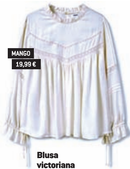
MANGO 19,99 €