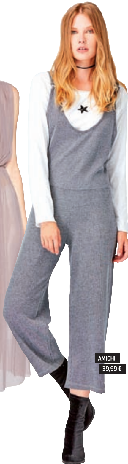
AMICHI 39,99 €

Prendas de tul, tonos maquillaje, bodys y bailarinas con lazos: las prendas del ballet salen a la calle. Eso sí, combínalas con algo más desenfadado.