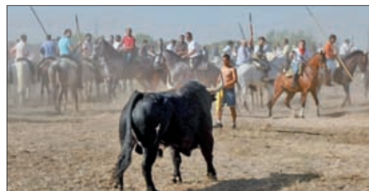
La Junta de Castilla y León prohibió en mayo la muerte del animal

Lanzas simuladas, pancartas y proclamas contra el decreto portaron los vecinos antes de la suelta de 'Pelado', ejemplar de 670 kilos de la ganadería de Jaralata.