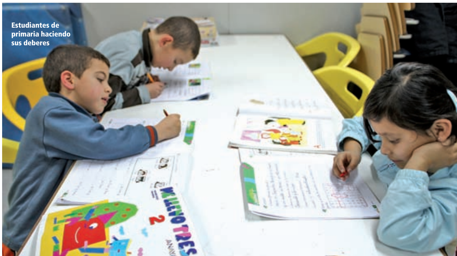
Estudiantes de primaria haciendo sus deberes