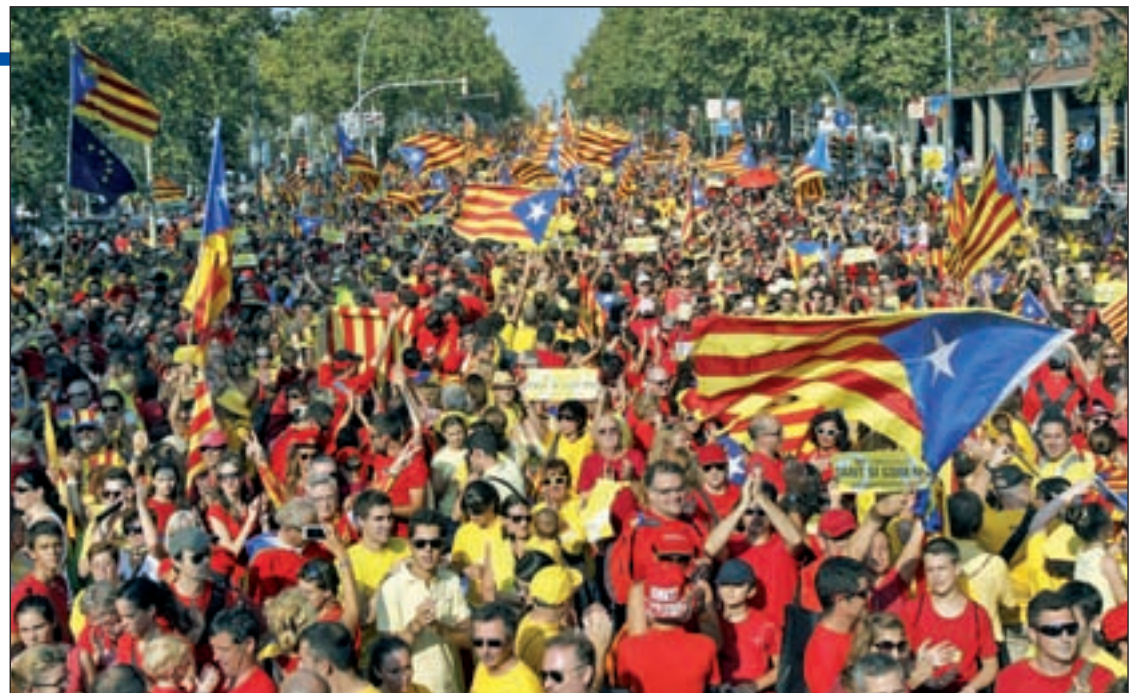
Un momento de la Diada en Barcelona

La tensión entre el Gobierno catalán y el nacional aumentó con estas declaraciones. "Una consulta pactada no existe en nuestro ordenamiento jurídico. La clave está en la soberanía nacional, que