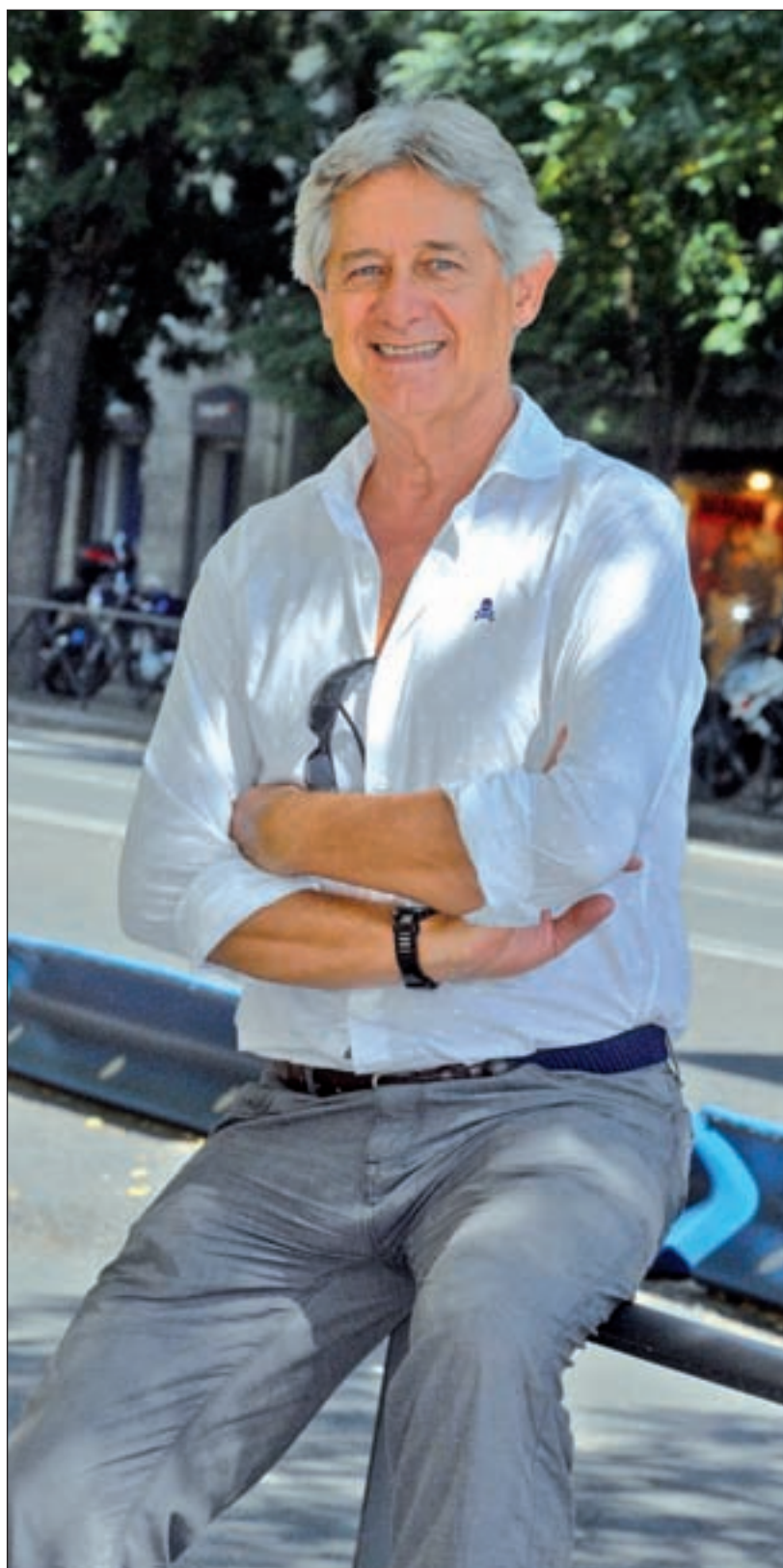
CHEMA MARTÍNEZ / GENTE

Sí, hay miedo siempre. Primero porque yo soy de la capital y conoz-