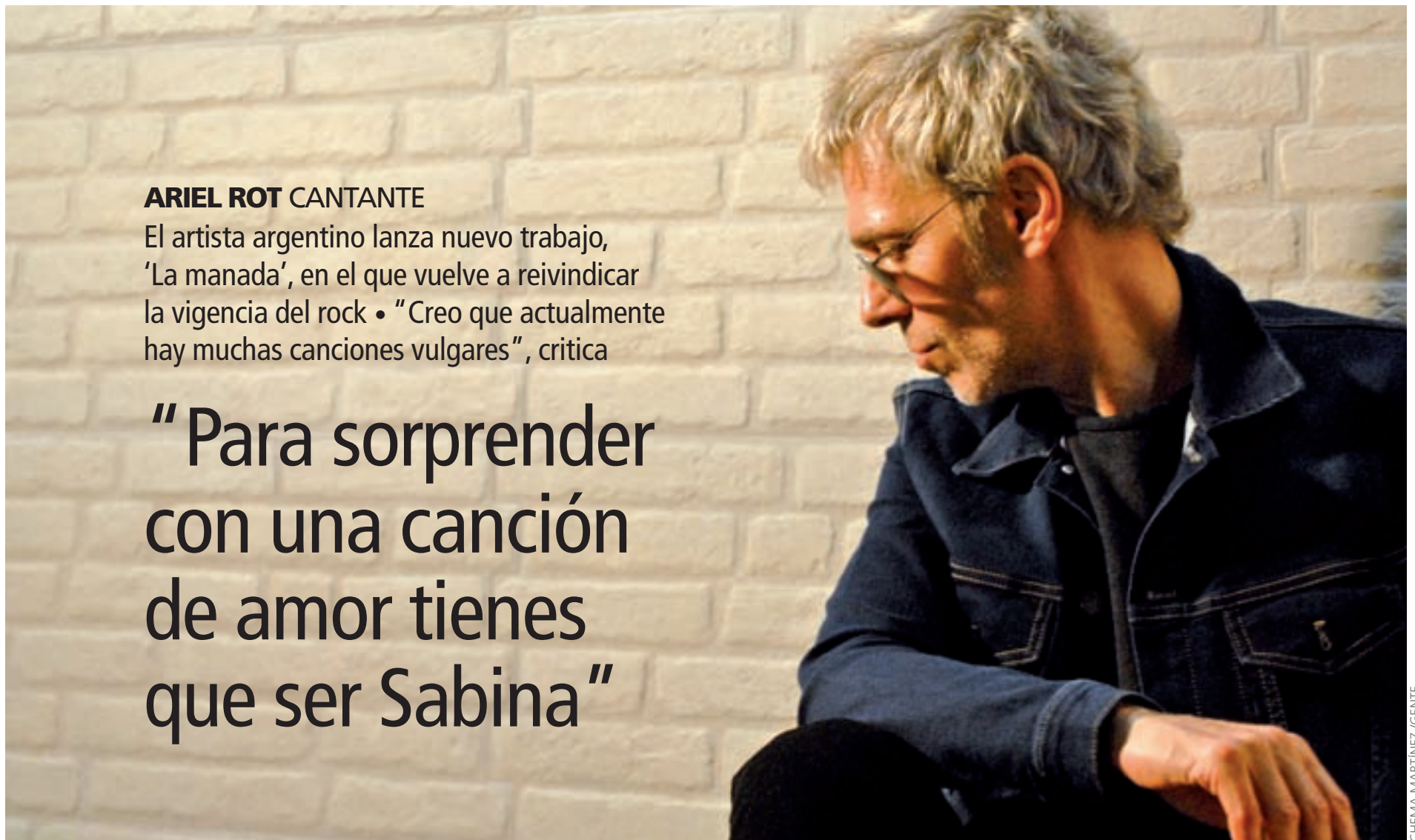
CHEMA MARTÍNEZ / GENTE