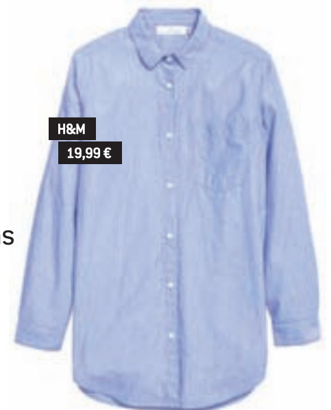
H&M 19,99 €

Con encaje, cuello marcado y algún lazo, da un toque femenino y romántico al 'look'.