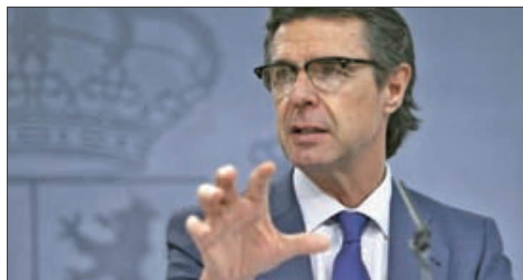
CASO SORIA Luis de Guindos defendió en el Congreso que José Manuel Soria era el candidato "más adecuado" para el cargo de director ejecutivo del Banco Mundial, y explicó que fue una decisión de "carácter discrecional" y "técnico", pero en "ningún caso" un nombramiento político.

Esta situación ha provocado que peligre el acuerdo alcanzado