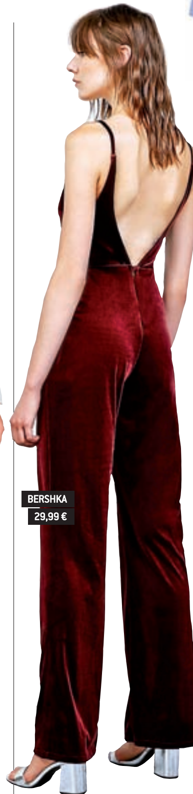
BERSHKA 29,99 €

Como si fuera el uniforme del colegio, se llevan los vestidos tipo pichi y los petos. Busca prendas más 'sport' para el día y opciones de vestir para la noche.