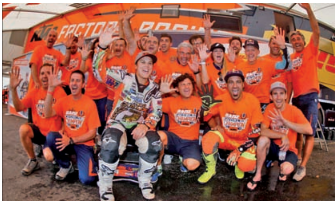
Laia Sanz sigue marcando la pauta en enduro

El plusmarquista nacional de 100 y 200 metros sufrió un accidente de tráfico durante la madrugada del domingo 4 al lunes 5 de septiembre en la carretera A-6 de Madrid que le obligó a pasar por el quirófano. Además, tanto el velocista como su familia se han mostrado agradecidos a los trabajadores del hospital madrileño, y han confesado estar "muy emocionados" por las "numerosas muestras de apoyo llegadas".