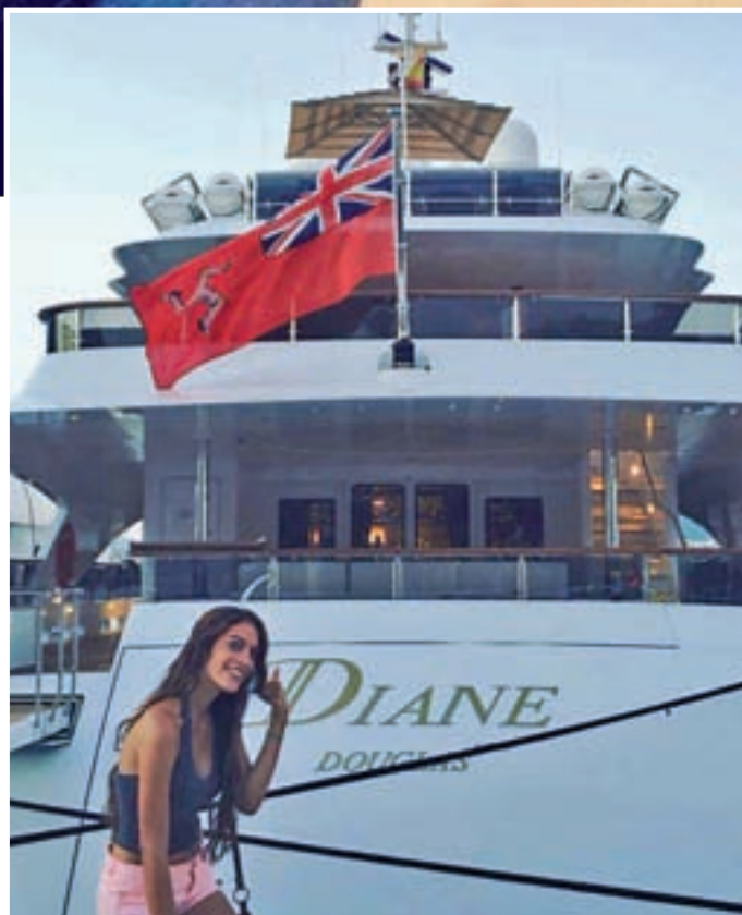
VACACIONES: Una de las cosas que más ha facilitado la labor de difusión son las numerosas fotos en redes sociales que tiene la joven, lo que ha puesto de manifiesto de forma masiva el estilo y vida y las costumbres de la chica de Pozuelo de Alarcón.