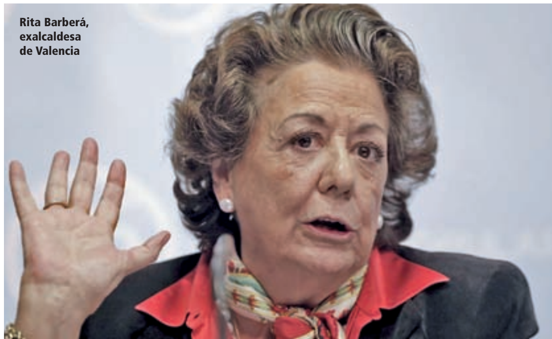
Rita Barberá, exalcaldesa de Valencia

PSOE, Podemos y Ciudadanos han coincidido en pedir la dimisión de Rita Barberá y los 'popula-