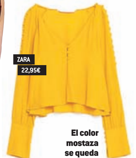
ZARA 22,95 €

Es una de las tendencias estrella para este otoño/invierno. Verás esta tela en camisetas, vestidos, monos, bolsos, americanas e incluso en calzado.