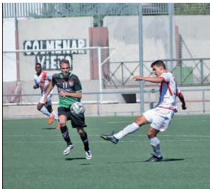
La A.D. Colmenar viajará este domingo al campo del Moratalaz