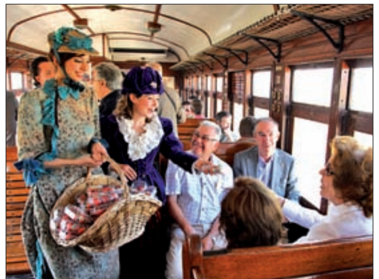
Pasajeros a bordo del tren con destino Aranjuez

Además de la tradicional ruta con visita guiada al Palacio Real de Aranjuez y a los Jardines del Príncipe y de la Isla, para esta nueva temporada el viajero podrá