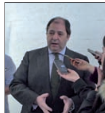
Antonio Béjar preside DCN

En relación a este conflicto, el ministro de Fomento en funcio-