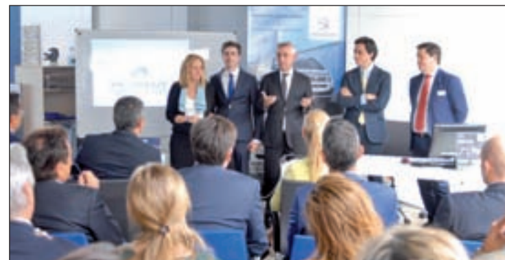
Presentación de los nuevos modelos comerciales de Peugeot

dades como el manos libres en la apertura de puertas y, además, cuenta con lo último en tecnología. Lo mismo que el modelo Traveller, dirigido al transporte de personas con un total de 9 plazas y un diseño en el que todo está hecho al detalle para aprovechar el máximo espacio posible.