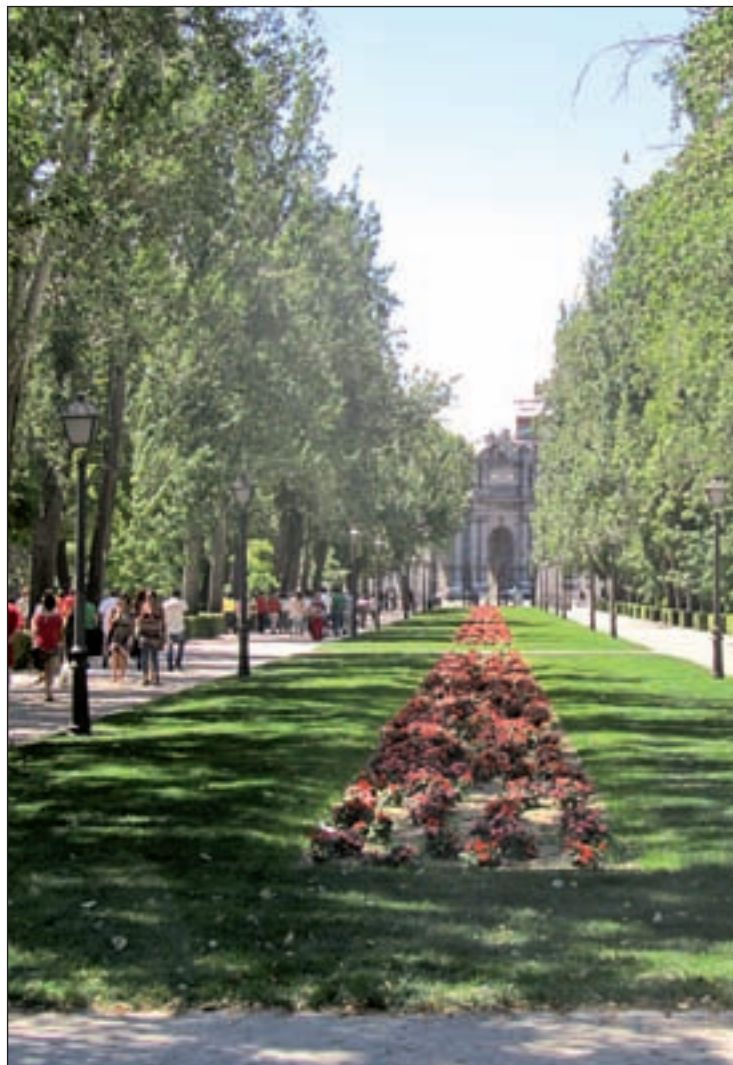
Los árboles de la avenida de Méjico, en El Retiro

DOS MILLONES DE UNIDADES Medio Ambiente realizará mediciones en 2.073.265 unidades. En una primera fase se llevará a cabo una revisión urgente con inspecciones en alrededor de