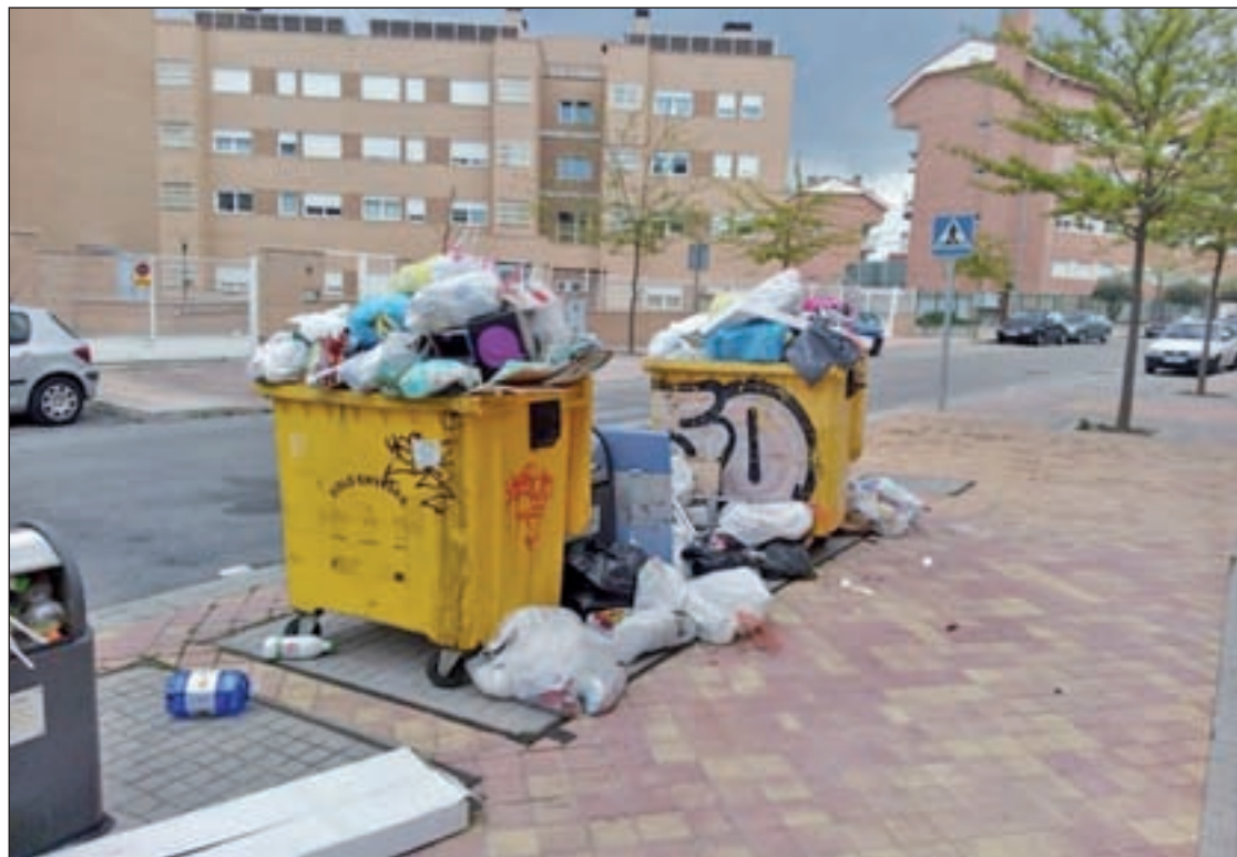
El funcionamiento de recogida de residuos se encuentra entre las quejas de la oposición

Este panorama también ha centrado la atención de Gane-