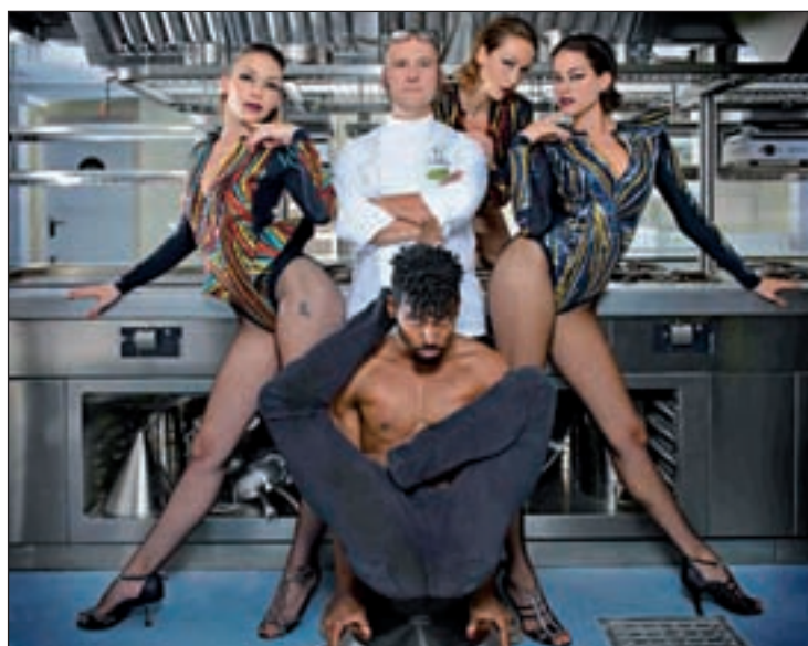
Yllana pondrá música y espectáculo con sus 'Pandora Nights'

Con la intención de convertirse en el nuevo templo gastronómico,