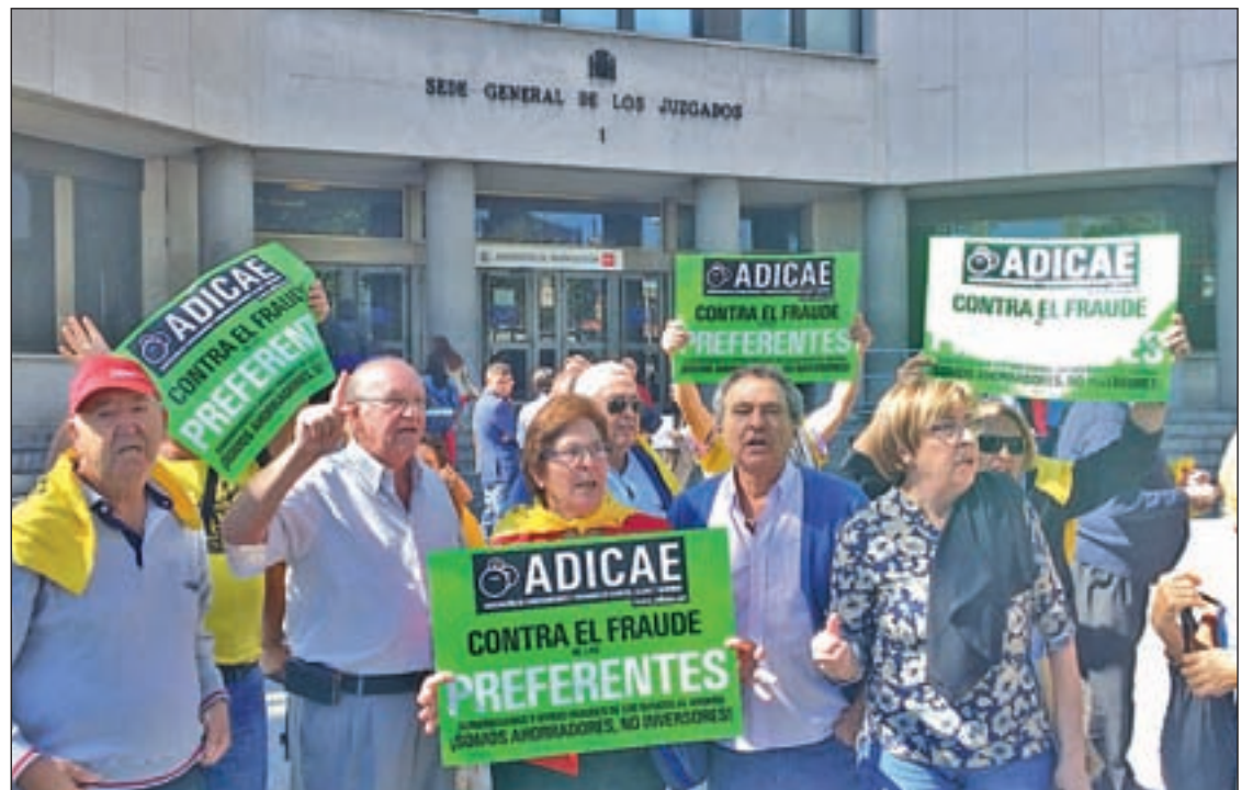
Varias personas afectadas se manifestaron ante los juzgados de Plaza de Castilla

García Villarrubia, afirmó que las prácticas realizadas no se pueden integrar en el marco de las condiciones generales del contrato, ya que, sostiene, no constituyen prácticas abusivas.