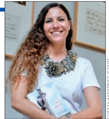
CHEMA MARTÍNEZ / GENTE

Al lector le deja un mensaje claro: “Se lo va a pasar muy bien. Es una novela amena”, finaliza.