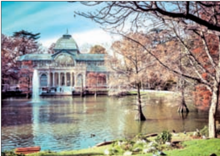
Parque de El retiro