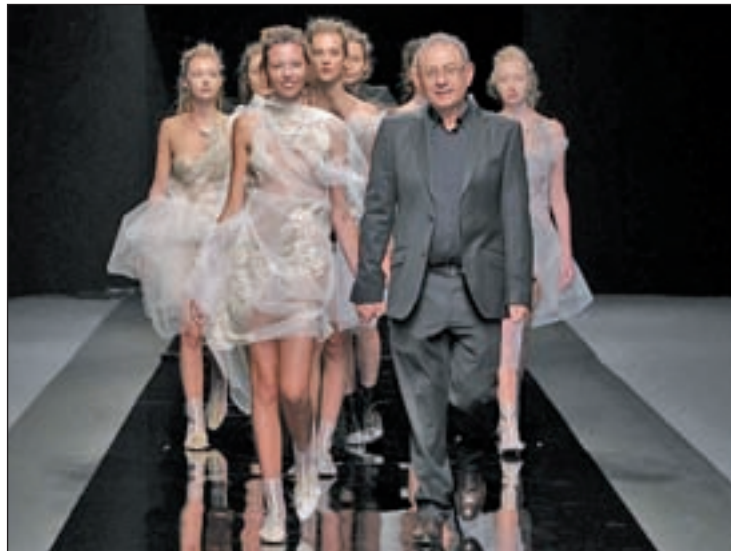
MFSHOW: El diseñador gallego cerró los desfiles de la pasarela alternativa de la capital, MFShow, que este año se ha celebrado en el Museo del Traje de Madrid. Presentó la colección para el actual otoño/invierno.

Quiero dejar claro que yo a Cibeles le debo mucho. Me siento muy vinculado con todo el equipo, pero hay un problema derivado de mi cambio de estrategia. Yo quería presentar la colección de la temporada actual y no la de la próxima primavera como hacen el resto de diseñadores en Cibeles, pero por respeto a lo que significa la dimensión de MBFWM me ha parecido mejor a priori planteármelo en una pasarela diferente donde no había ese tipo de compromiso. Espero y confío en que a partir de ahora haya muchos otros colegas que se den cuenta, porque el sentido común hace pensar que el