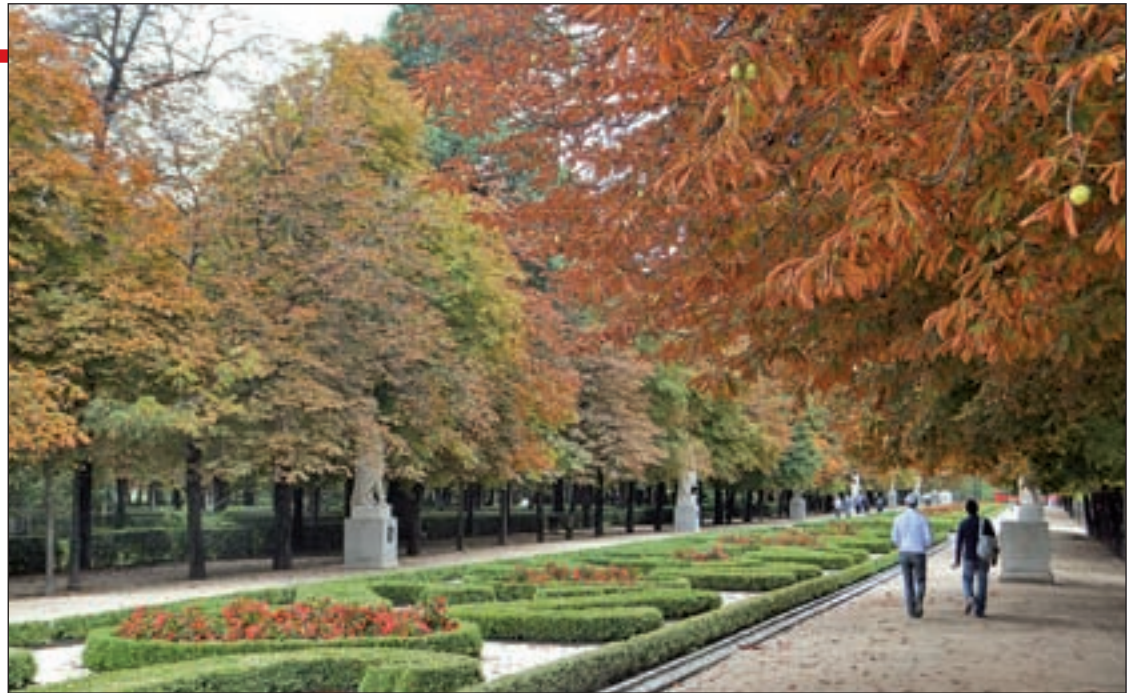
La temperatura de este otoño alcanzará valores superiores a la media