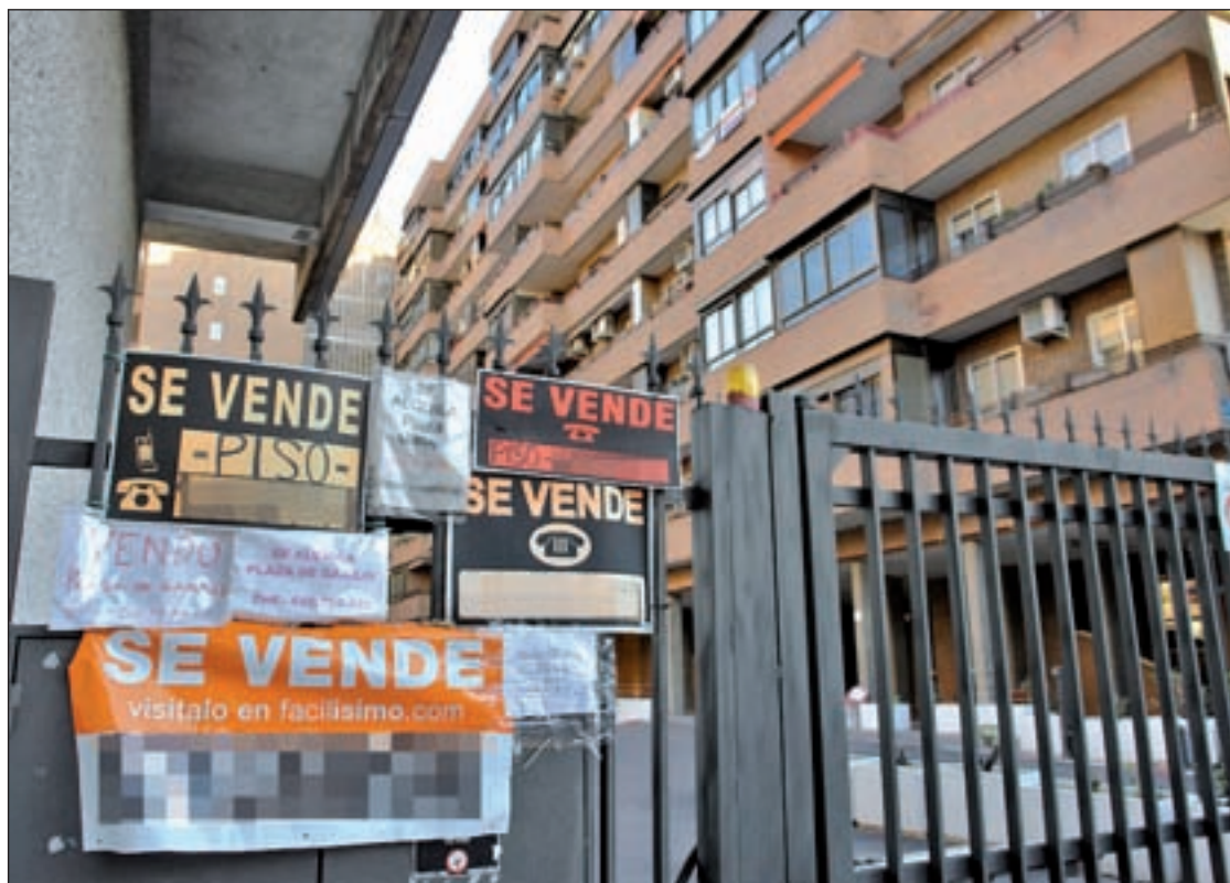
Pisos en venta en la Comunidad de Madrid GENTE

En cuanto al desglose por municipios, la región tiene a dos de las ciudades españolas con más de 25.000 habitantes en las que comprar una vivienda es más costoso. En la quinta posición del ranking nacional está la capital, con un coste del metro cuadrado de 2.591,70 euros. La séptima plaza