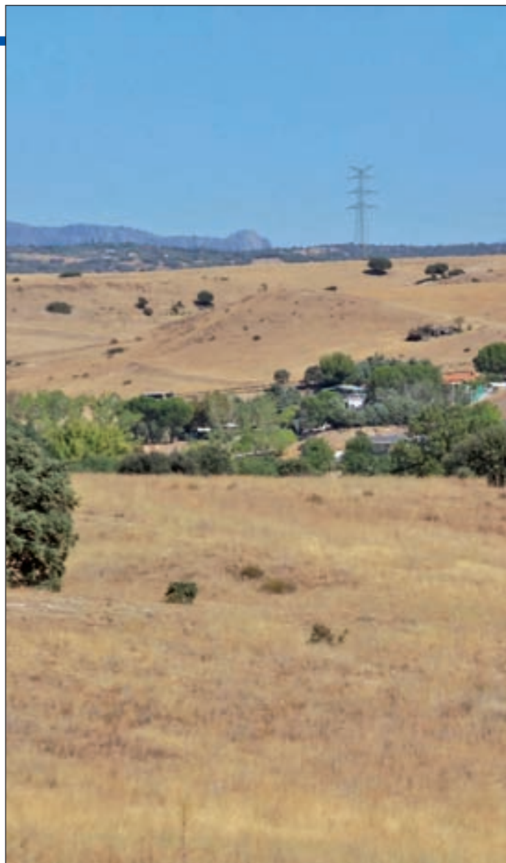
Finca El Tagarral

Estas respuestas no han convencido a la Comunidad, que a principios de mes presentaba es-