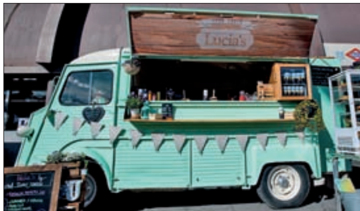
El mercado reunirá a una quincena de ‘foodtrucks’

Junto a una quincena de ‘foodtrucks’, que propondrán a los visitantes una variada oferta gastronómica sobre ruedas, este espacio contará con tres carpas. En una de ellas se situará la ‘Kitchen Academy’, un área infantil con ta-