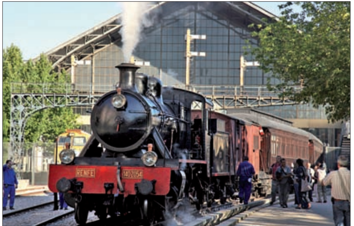
El Tren de la Fresa fue el primer ferrocarril de Madrid

A.B. Hasta el 25 de septiembre, Madrid Oktoberfest vuelve al Barclaycard Center. Como curiosidad, solamente las cervezas como Paulaner, que cumplen con el Reinheitsgebot, con un mínimo de aproximadamente 6% de alcohol y elaborada dentro de los límites de la ciudad de Múnich, pueden ser servidas en esta fiesta.