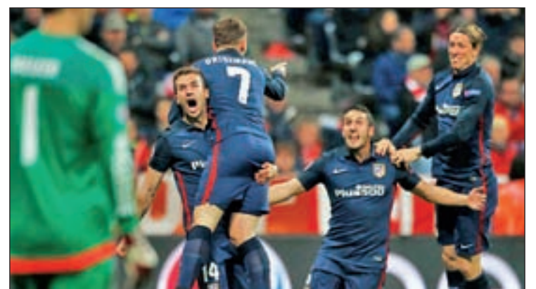
El Atlético sueña con ganar este título en su propia casa

ma que surgiera en su uso diario. La confianza de la directiva que preside Enrique Cerezo es tal que, según aseguran algunas fuentes, desde la UEFA les han hecho saber que el Atlético organizará una final de la Champions, siendo 2019 la primera fecha disponible, ya que ese honor correrá a cargo de Kiev justo un año antes.