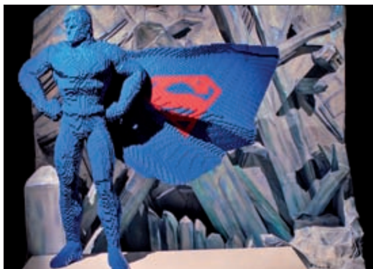
Superman hecho con LEGO