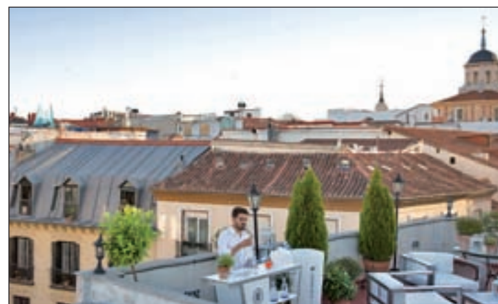
Las vistas de Madrid protagonizan esta cita

posiciones del Fernán Gómez todos los días de la semana, excepto el 24 y el 31 de diciembre. La entrada es gratuita para los menores de cuatro años y existen packs para que toda la familia disfrute de esta muestra.