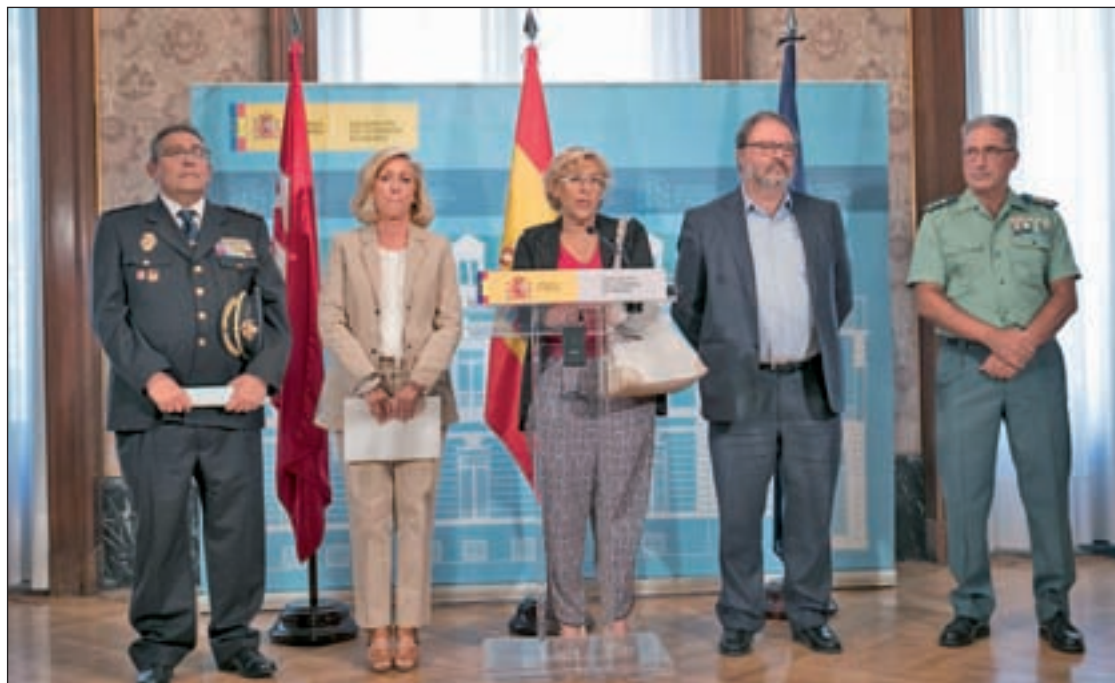
La rueda de prensa posterior al Consejo y Junta Local de Seguridad

Desde la Delegación del Gobierno y el Ayuntamiento de Madrid des-