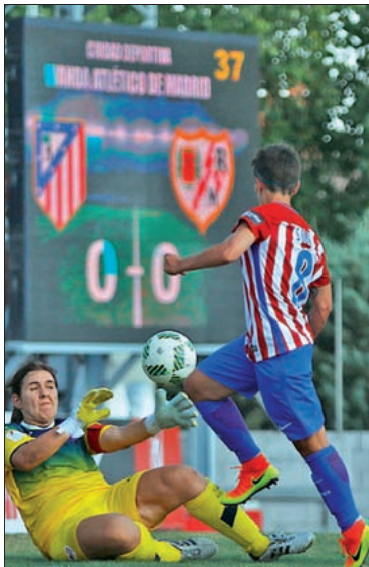
Imagen del partido entre Atlético y Rayo AT. FÉMINAS

sólo han jugado dos encuentros. El calendario deparó un comienzo duro ante rivales de la talla del Atlético de Madrid y el Levante, dos partidos que se cerraron con el mismo marcador: derrota por 2-0. A pesar de este balance, las sensaciones en el club franjirrojo no son malas y se espera que este fin de semana la racha toque a su fin. Para ello, el Rayo debe hacer valer su calidad en la visita al campo del Granadilla Egatesa, un conjunto que tampoco ha tenido un buen inicio, con un punto sobre seis posibles.