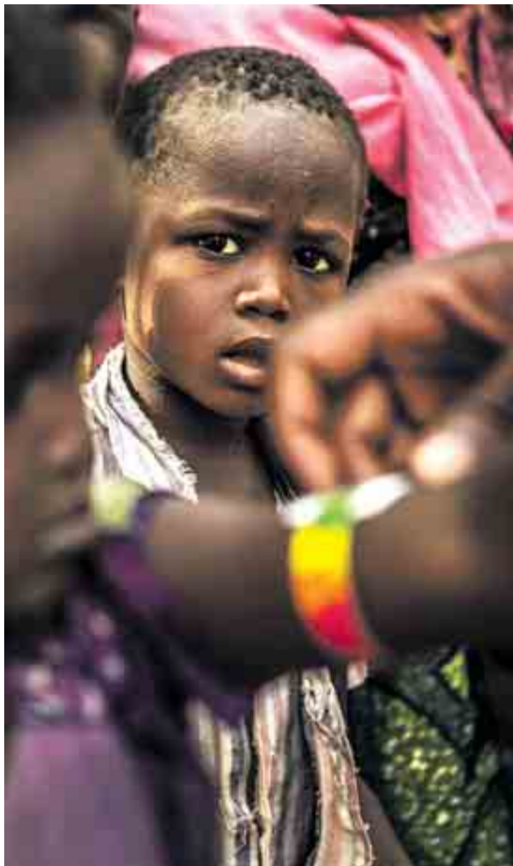
Las imágenes han sido tomadas en Palestina, Níger, Etiopía y Colombia.

Más de cuarenta imágenes del fotoperiodista y reportero Juan Carlos Tomasi, quien lleva veinte años retratando conflictos olvidados en el mundo, se disponen en la planta -1 del Museo de la Evolución (MEH) acompañadas de "historias de vida de las personas" de estos países. Así, han colaborado cuatro escritores que han viajado con Médicos Sin Fronteras a los países para "empapar-se del contexto y de sus protagonistas": Martín Caparrós, autor del conflicto palestino, documenta el día a día de territorios en los que "la normalidad es una violencia sorda que provoca graves consecuencias psicológicas y sociales en la población"; Santiago Roncagliolo, encargado de reflejar la situación en Níger, donde tal como indica la delegada de Médicos Sin Fronteras en Castilla y León, la tasa de desnutrición infantil "es una de las más altas de todo el mundo" y que cuando se une a la malaria da como re-