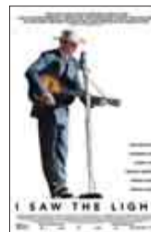
HANK WILLIAMS, UNA VOZ A LA DERIVA Dir. Marc Abraham. Int. Tom Hiddleston, Elizabeth Olsen. Biográfico / Música.