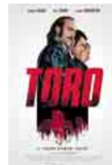
TORO Dir. Kike Maíllo. Int. Mario Casas, Luis Tosar. Thriller / Acción.

THE LADY IN THE VAN. Dir. Nicholas Hytner. Int. Maggie Smith, Alex Jennings. Drama.