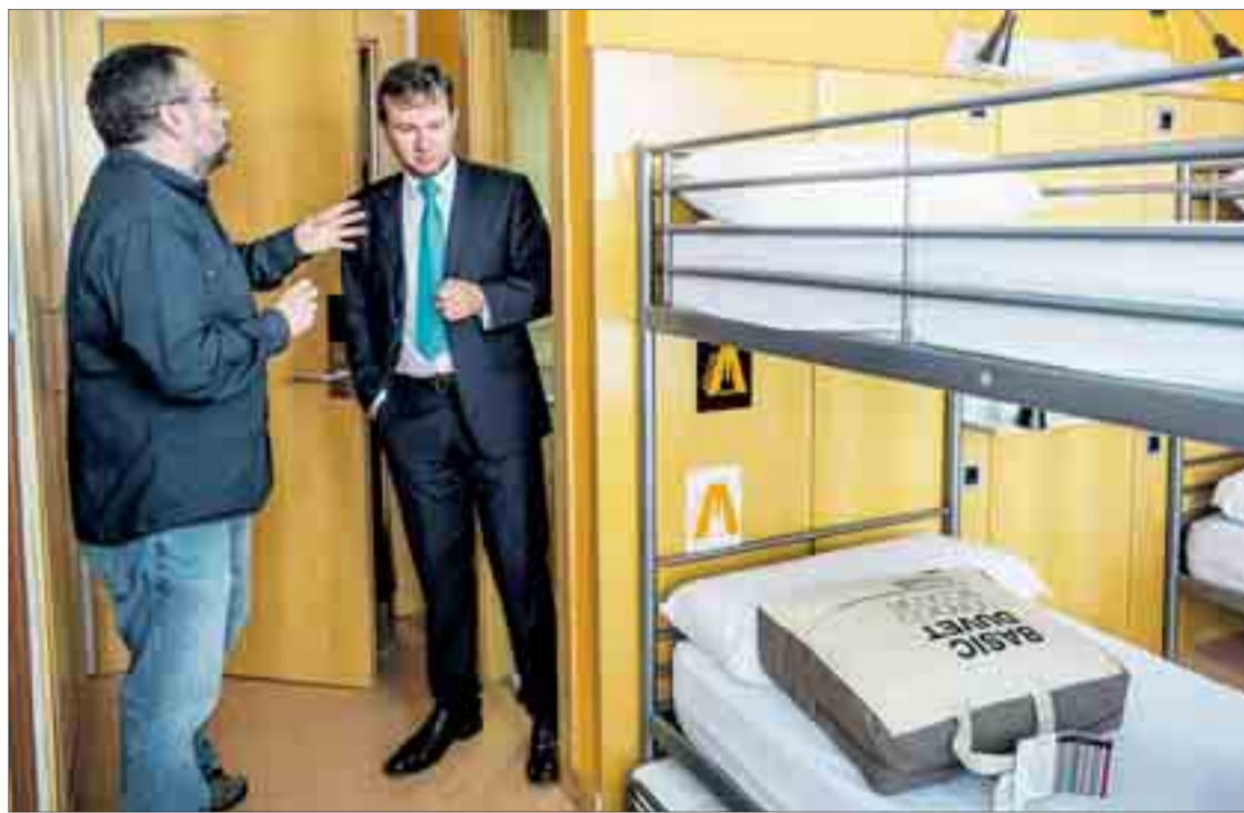
El alojamiento se ubica junto a la Estación de Autobuses, donde antes se levantaba el Hotel Conde de Miranda.

El regidor quiso unirse a esta idea, ya que, desde su punto de vista, el nuevo 'hostel', además de reforzar la actividad cultural y social, ya que también se desarrollarán actividades durante todo el año, supondrá un impulso económico. El alojamiento genera diez puestos de trabajo, matizó Lacalle, quien apostilló que "es tremendamente positivo hablar del empleo en estos momentos". Los precios, definidos por el regidor como "asequi-