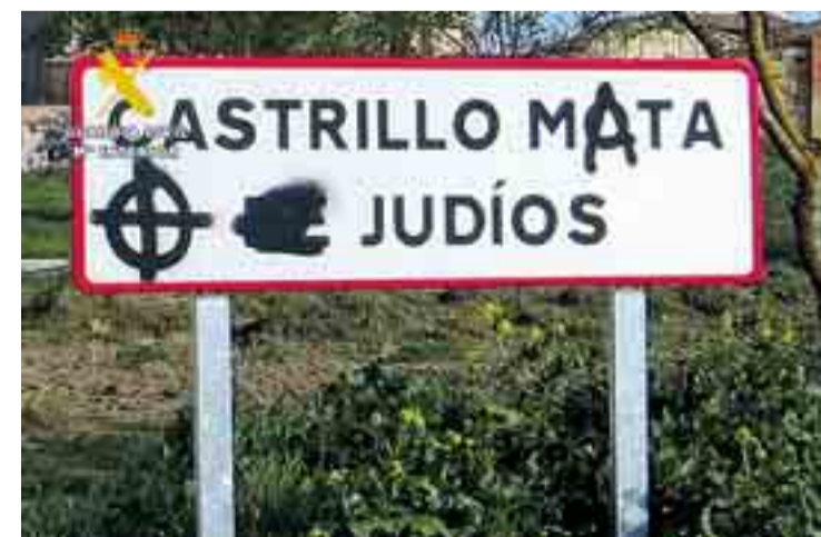
Las pintadas antisemitas aparecieron la noche del 1 de mayo.