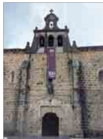
Fachada del convento de Santa Ana.