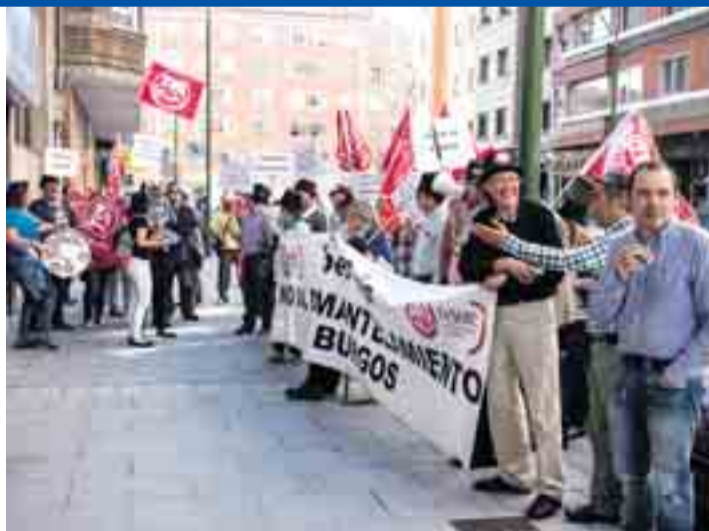
UGT-Ibercaja en Castilla y León convocó el día 21 una concentración en Burgos para mostrar al presidente y al consejero delegado su rechazo por los cierres de oficinas.

El consejero delegado de Ibercaja, Víctor Iglesias, consideró “un poco desproporcionadas” las críticas vertidas por UGT respecto a los ajustes realizados. “Estamos hablando de cuatro oficinas sobre un total de casi 80 en un momento en que el sector bancario, desde hace unos años, está ajustando su modelo de distribución, porque había una sobrecapacidad clara, teníamos más oficinas por habitante que muchos de los países europeos y digamos, que nos habíamos pasado de frenada. En