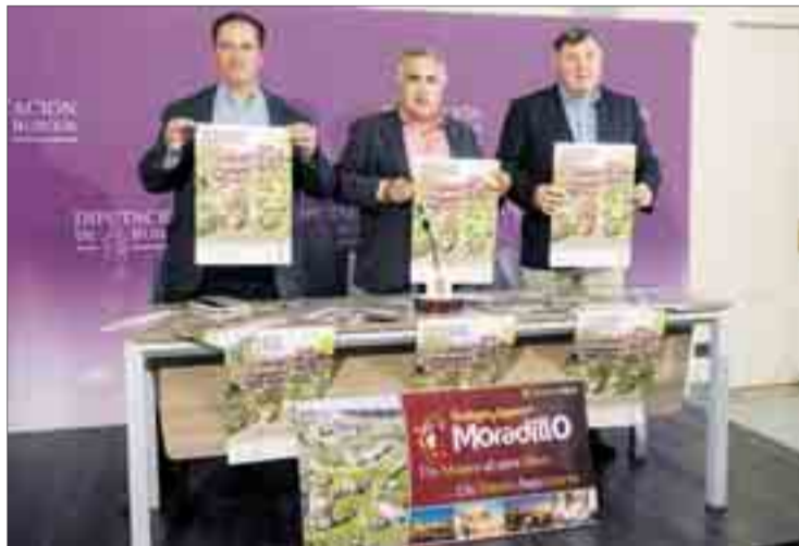
La presentación de la jornada festiva de la vendimia tuvo lugar el miércoles 21.

Si bien aseguró que “hay mucha ilusión” depositada en esta cosecha, no quiso adelantar los kilogramos que se prevé recoger. Cabe destacar que el año pasado se recolectaron 88 millones de kilogra-