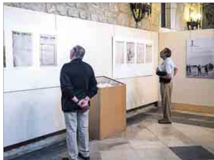
La exposición permanecerá abierta hasta el 2 de octubre en el Monasterio de San Juan

La asociación nació, "tal día como hoy, hace cien años", apostilló, con el mismo propósito con el que sigue hoy en día: defender la dignidad del periodismo. "De la primera entrevista que se le hizo al primer presidente, sin duda, ahora seguiríamos suscribiendo mu-