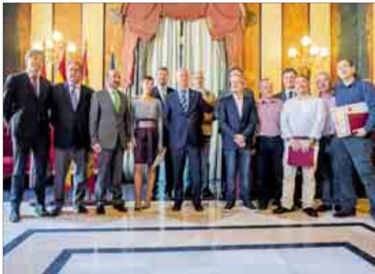
El Salón Rojo del Teatro Principal acogió el acto de celebración el jueves 22.

Concretamente, en relación a la plantilla encargada de la vigilancia, Antón indicó que la Relación de Puestos de Trabajo (RPT) señala que debería haber noventa funcionarios y ahora la institución dispone de ochenta.