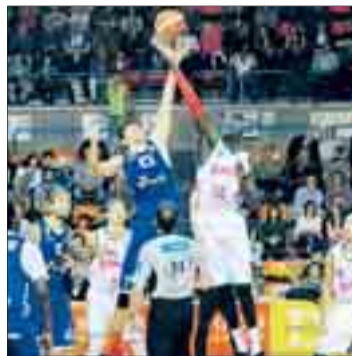
El CB Miraflores se impuso al Baskonia en un duelo disputado en El Plantío.

Por otro lado, el San Pablo Inmobiliaria se impuso en el primer