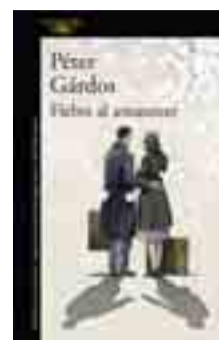
FIEBRE AL AMANECER Pétér Gárdos. Novela.