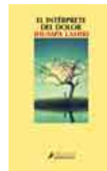
EL INTÉRPRETE DEL DOLOR Jhumpa Lahiri. Novela.