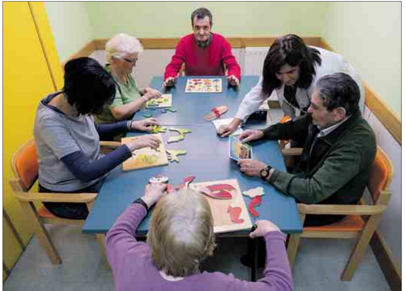
Esta imagen fue tomada el lunes 19 en el Centro de Día de la calle Loudun mientras los enfermos realizaban actividades de estimulación cognitiva.

Junto a los trabajadores está el papel del cuidador; ese familiar, o no, que convive con ellos y que los acompaña en su día a día. A ellos se dirige la campaña de sensibilización que se ha iniciado estas semanas con motivo del Día Mun-