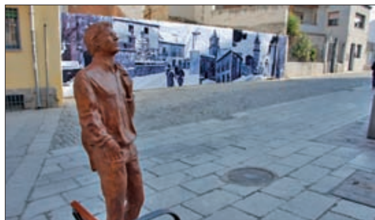
La actuación tendrá lugar en la Plaza de Luis Gutiérrez