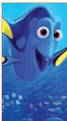
'Buscando a Dory'