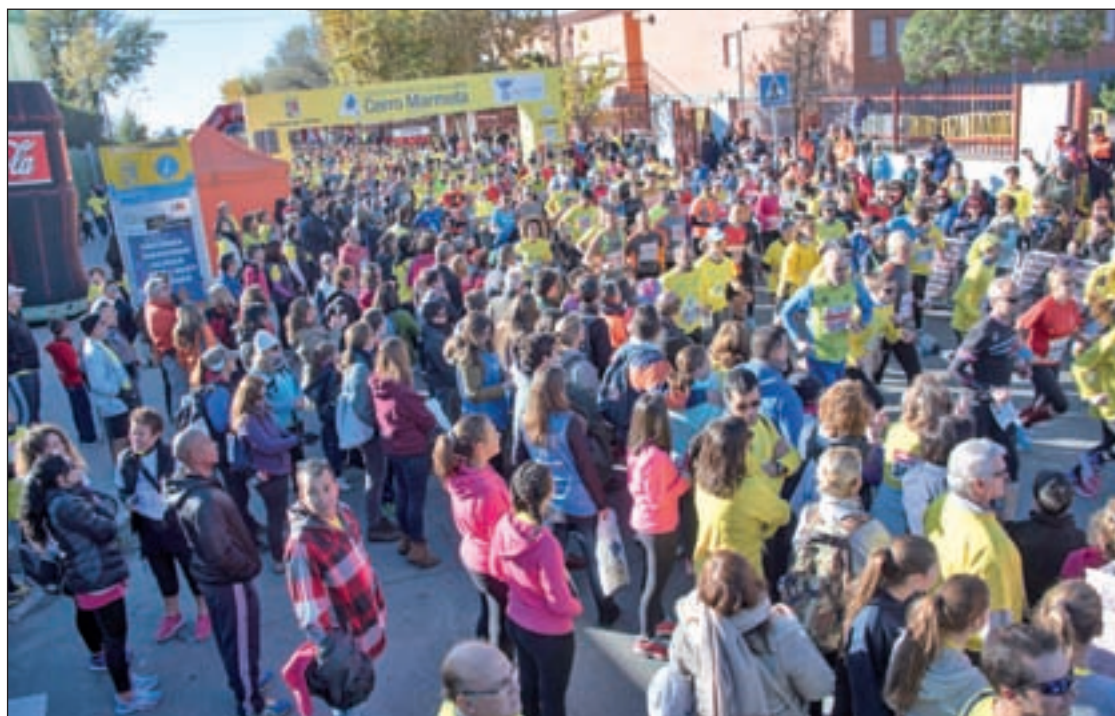
La carrera Cerro Marmota, en anteriores ediciones

El plazo para apuntarse a esta sexta edición permanecerá abierto hasta el próximo 17 de noviem-