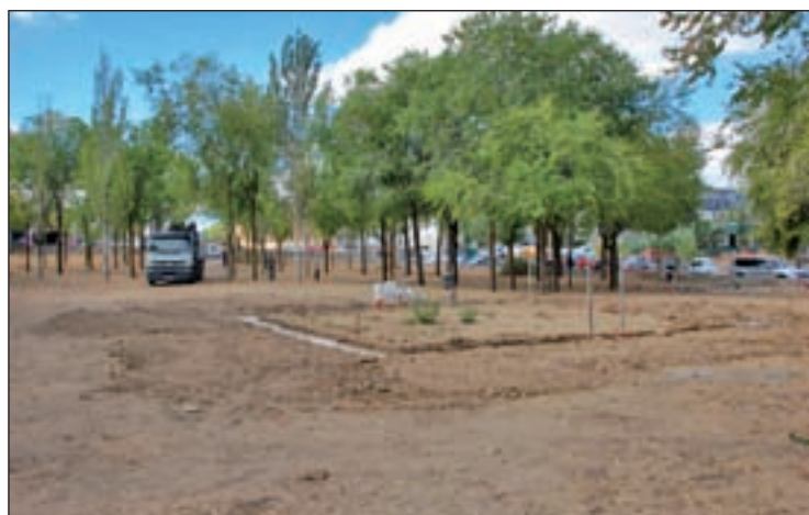
Trabajos en lo que será el nuevo espacio canino

CON UNA INVERSIÓN DE CERCA DE 55.000 EUROS