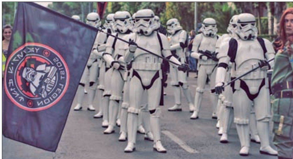
Habrà un desfile de actores representando los protagonistas de 'Star Wars'