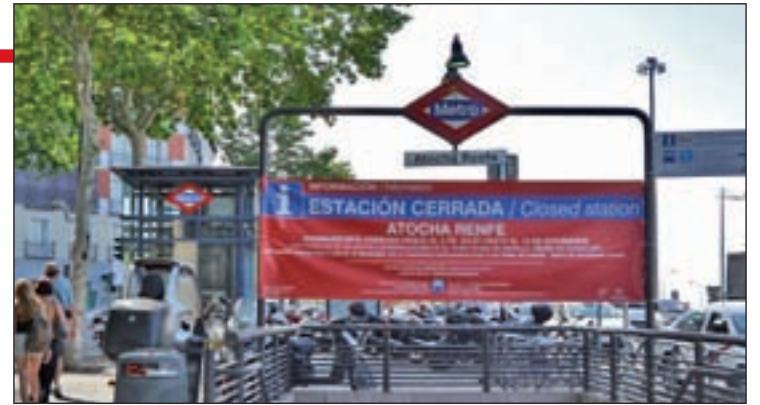
Estaciones cerradas de la Línea 1 de Metro

bio de la catenaria por motivos de seguridad son los principales objetivos de estas obras, en las que el Gobierno regional invertirá 72 millones de euros.