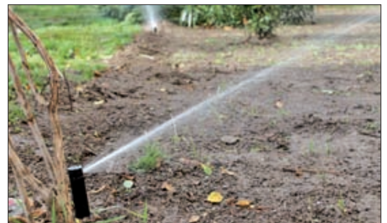
Los socialistas proponen un ahorro de 280.000 euros anuales

Esta acción supondría “un ahorro para las arcas municipales