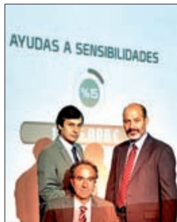
Una escena de la obra

Es la historia de cómo las élites que gobiernan saquean al país protagonizada por los actores