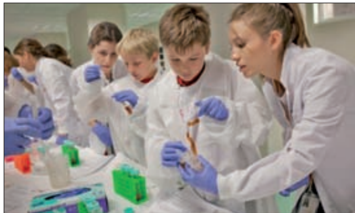
Los niños disfrutarán al mismo tiempo que aprenden

Entre las propuestas, una conferencia-taller sobre las moléculas que nos comemos; una cita con el Centro Nacional de Investigaciones Oncológicas en la que se conocerá su trabajo e incluso se harán experimentos con ADN; una charla sobre cómo funcionan las prótesis y órganos biónicos en la que se podrá interactuar con los mismos; la presentación de las biografías de las mujeres investigadoras africanas que participan en el programa 'Science by women' de la Fundación Mujeres por África; o una gran yincana