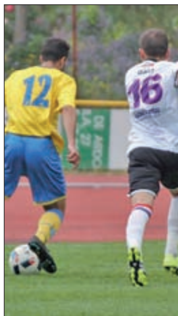
C.D.F. Tres Cantos