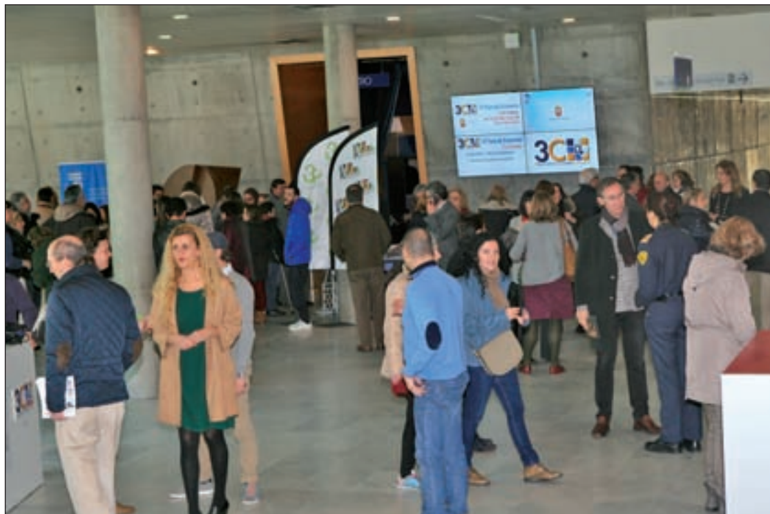
Foro de Economía de Tres Cantos, en ediciones anteriores