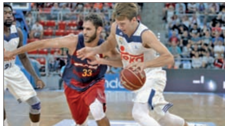
Luka Dončić, en la Supercopa de Vitoria

que cuenta en sus filas con estrellas de la talla de Russell Westbrook. En sus filas también está uno de sus fichajes de este año, Álex Abrines, quien tendrá la complicada papeleta de llenar el hueco dejado por Kevin Durant, todo un 'All-Star' que ha firmado por Golden State Warriors, subcampeones del año pasado.