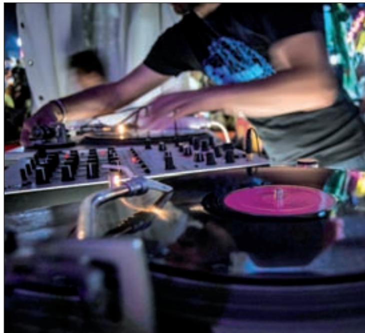
El Colectivo K, durante las Fiestas de Tres Cantos JOSE SANZ

Colectivo K surgió en el 2008 gracias al impulso de varios jóvenes tricantinos, que buscaban ofrecer una plataforma cultural para que todos los artistas del municipio se promocionaran a través de diferentes actividades culturales. "Al principio celebrábamos pequeñas fiestas que, con el tiempo, fueron creciendo hasta el punto