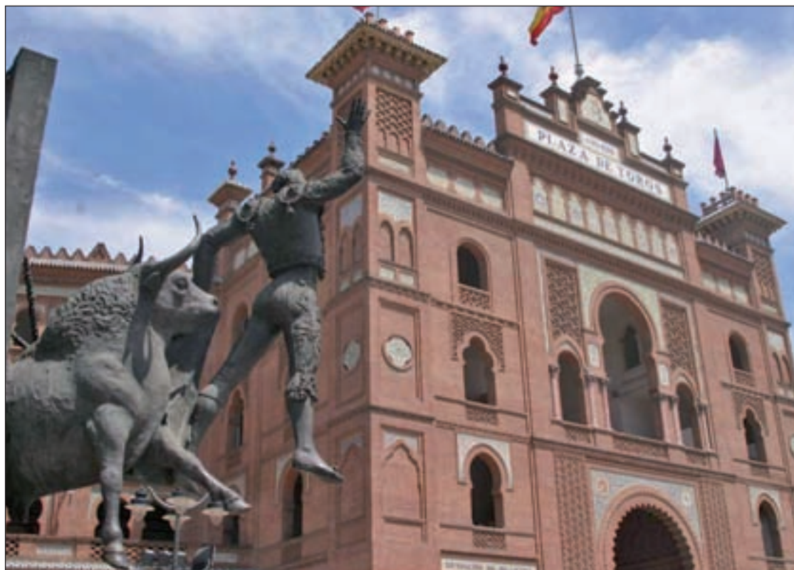
La Feria de Otoño de Madrid se desarrollará hasta el domingo 2 de octubre