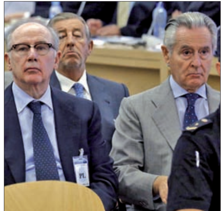
Miguel Blesa y Rodrigo Rato, sentados durante el juicio

Pese a que el magistrado instructor concluyó que existen indicios de que los altos cargos investigados destinaron a gastos personales más de quince millones de euros entre 1999 y 2012, sólo se juzgará la etapa posterior al año 2003, ya que la responsabilidad anterior por los gastos producidos ha prescrito y no puede ser juzgada. No obstante, desde el 2003 y hasta el 2012, el gasto con las 'tarjetas black' ascendió a doce millones de euros.