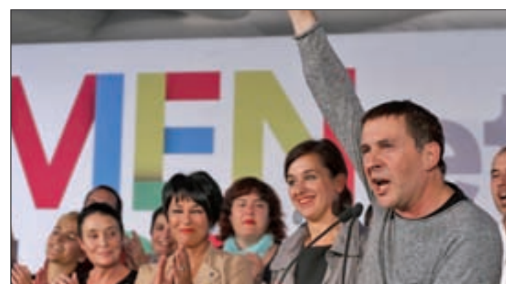
Arnaldo Otegi, en su intervención del pasado domingo

“El asalto a los cielos empieza desde hoy”, indicó un triunfalista Otegi durante la pasada noche electoral, en la que declaró: “Desde Madrid soñabais con el entierro de la izquierda independentista: aquí estamos”. Además, el portavoz de EH Bildu destacó que el resultado de su partido es “su suelo” y sólo les queda mejorar.