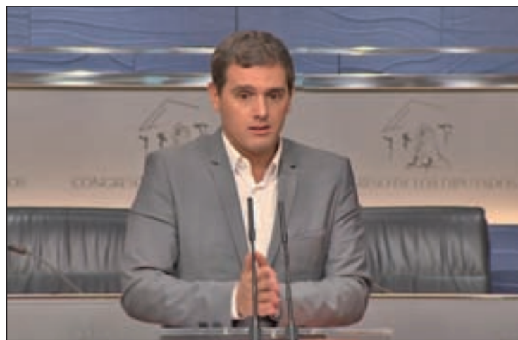
Albert Rivera, líder de Ciudadanos

Con estos resultados fue imposible para la dirección del partido no asumir que sus objetivos no se habían conseguido. Tras "un ciclo de un año y medio de éxitos"