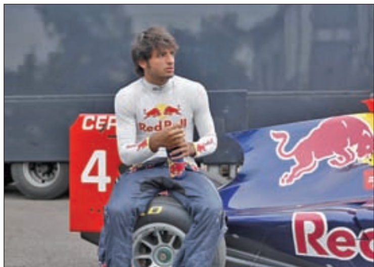
El futuro de Carlos Sainz, en el aire

A pesar de esto, el principal foco de interés estará en saber si Rosberg es capaz de aguantar el liderato, tras rebasar a Lewis Hamilton en Singapur. En estos momentos, les separan 8 puntos.