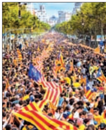
Manifestación de la Diada

Además, Puigdemont eleva el órdago del Gobierno catalán, ya que asegura que se celebrará el referéndum "cuente o no con el aval del Estado". El presidente de la Generalitat que la propuesta no