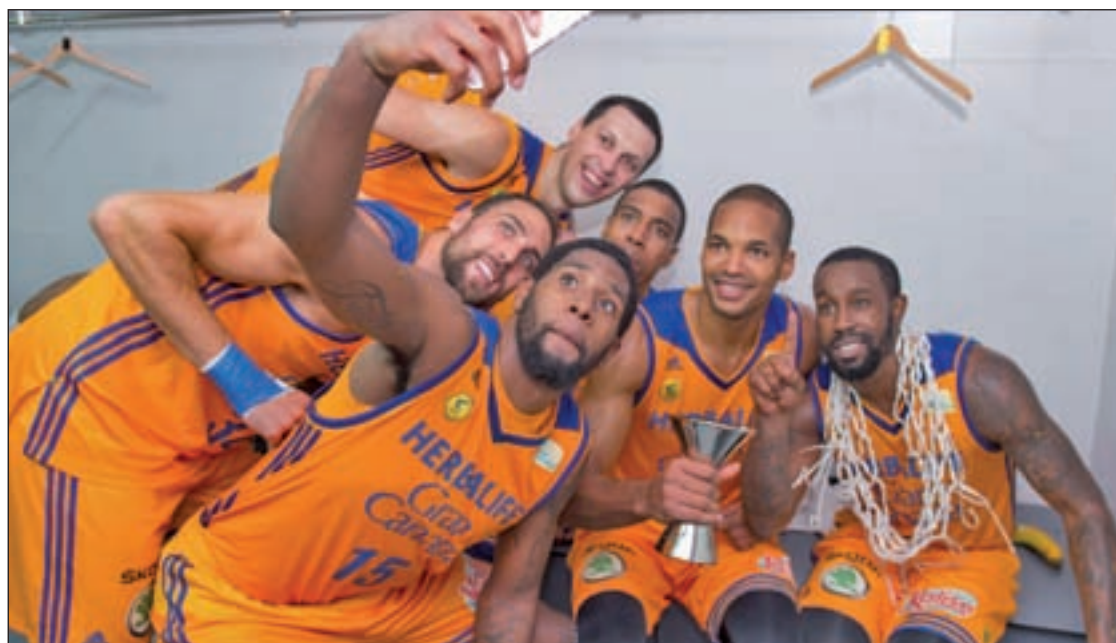
El Herbalife Gran Canaria hizo historia con la consecución de la Supercopa