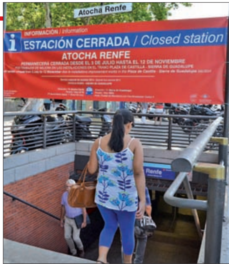
Estación de Metro de Atocha Renfe

Con esta reapertura, sólo queda pendiente el sector que transcurre entre Atocha Renfe y Cuatro Caminos, la parte más antigua de la línea más veterana del suburbano madrileño, que cuenta con nueve paradas: Atocha, Antón Martín, Sol, Gran Vía, Tribunal, Bilbao, Iglesia y Ríos Rosas. La vuelta completa a la normalidad está prevista para el 12 de no-