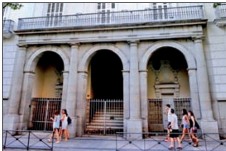
Fachada del palacete de Alberto Aguilera, 20

Por su parte, el Patio Maravillas criticó que el Ayuntamiento de Madrid no ha consultado entre el tejido social del distrito los usos del edificio que, comentan, podrían incluir desde un centro de salud, hasta servicios de atención a mayores. Lo cierto es que desde