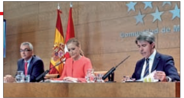
La Estrategia se aprobó en el último Consejo de Gobierno

ción), las personas de etnia gitana, los que no tienen hogar o los residentes en los núcleos chabolistas que aún sobreviven en la Comunidad.