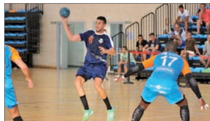
El BM Carabanchel vuelve a jugar como local

Además de contar con una potente plantilla, el cuadro canario tiene la obligación de sumar los