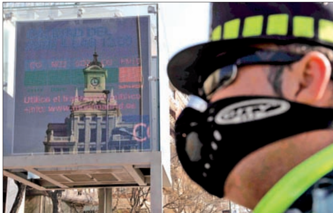
Las pantallas alertan sobre la calidad del aire

En teoría, el protocolo de medidas se activa de manera automática en el momento en el que dos estaciones pertenecientes a la misma zona de la ciudad registran una concentración de NO 2 superior a los 180 microgramos por metro cúbico, aunque esa puesta en marcha se puede retrasar si el parte que facilita la Agencia Española de Meteorología (AEMET) a los técnicos municipales indica que las condiciones