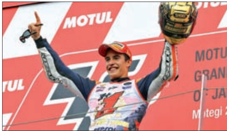
Márquez ya se proclamó campeón en Japón en el año 2014

Las combinaciones parten de una premisa fundamental, que el piloto de Cervera suba a lo más alto del podio. Si esta circunstancia no se diera, Márquez tendría