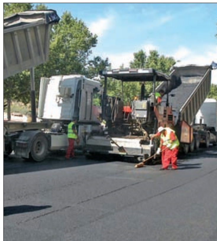
Trabajos de asfaltado en una calle de la ciudad