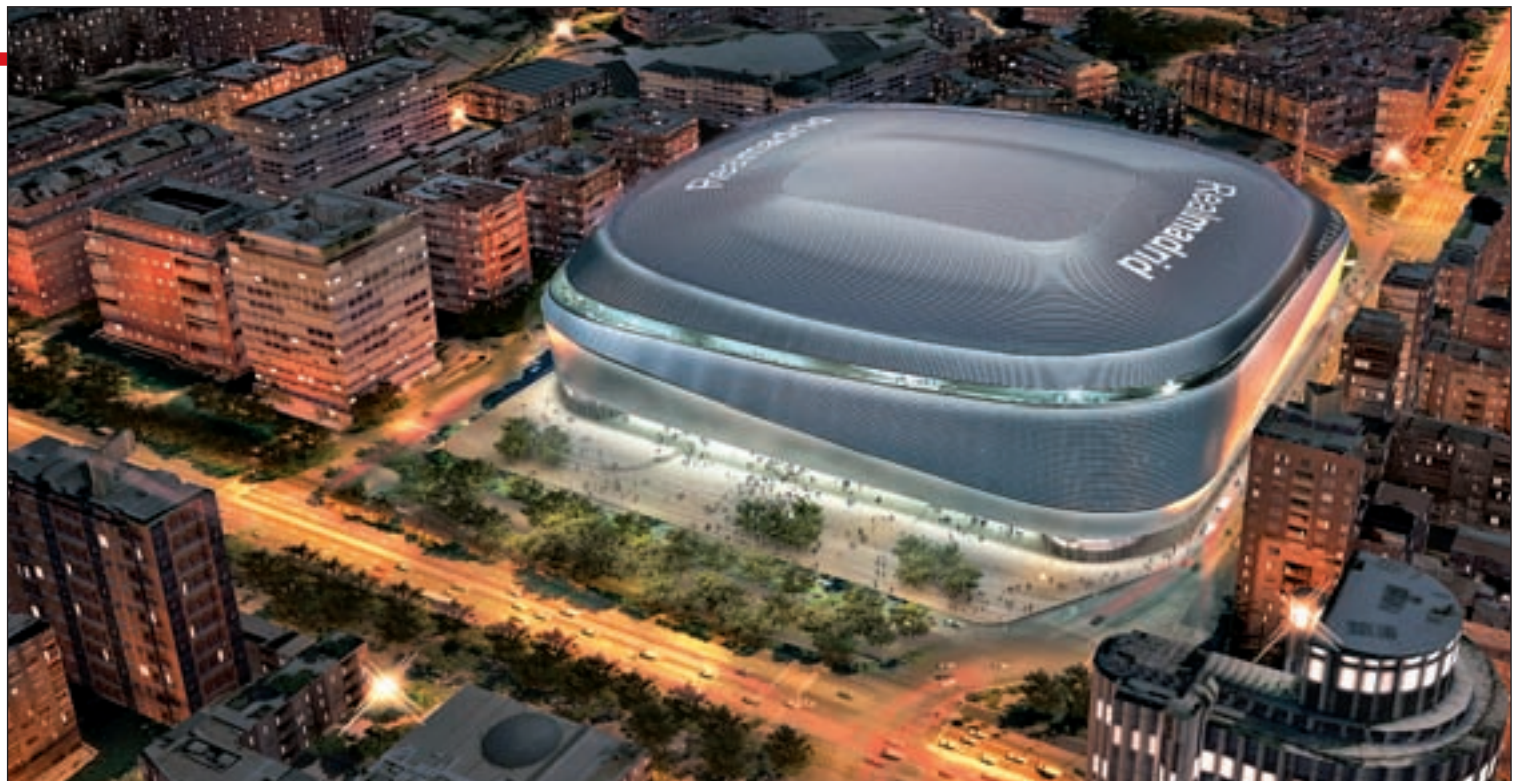
Vista aérea del nuevo estadio, en el que se distinguen la cubierta y la explanada peatonal de la fachada oeste

Además, este diseño tendrá un impacto en el urbanismo de la zona, al mejorar unos 15.000 metros cuadrados de espacio perimetral. En concreto, el Real Madrid planea derribar la 'Esquina del Bernabéu' y sustituirla por una plaza privada de uso público de 6.000 metros cuadrados en los Sagrados Corazones, así como transformar