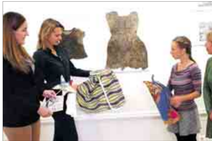
La exposición puede visitarse en el Teatro Principal hasta el 30 de octubre.