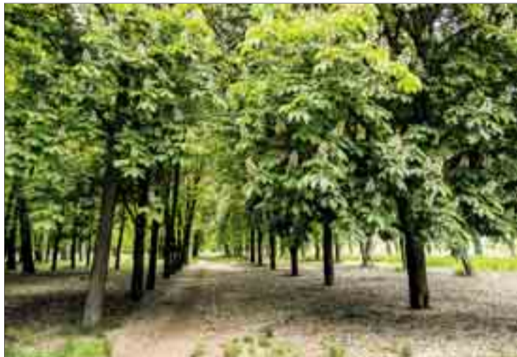
Conocer la flora de la ciudad y sus alrededores es uno de los objetivos del programa.

Concretamente, Santamaría detalló alguna de las actividades, como el taller de huellas y rastros en el Aula de Medio Ambiente de Fuentes Blancas, el festival de aves migratorias en el mismo lugar, el paseo y análisis de los riesgos geológicos en la zona sur de la ciudad,