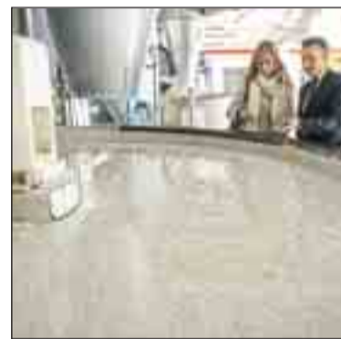
El papel de seguridad está compuesto por fibra de algodón porque presenta más resistencia mecánica y permite realizar la marca de agua, que es una deformación intencional, con una calidad muy alta.

pinas. Este país, al ser el "primer exportador" de abacá, exige que sus fabricantes de papel le añadan un porcentaje determinado procedente de allí. Otro caso es el dólar de Estados Unidos que sobre todo está fabricado con lino y por esa razón es más amarillento. Este material, señala Olmos, tiene "mayor duración" que el algodón, pero la calidad de la marca de agua por transparencia es muy inferior.