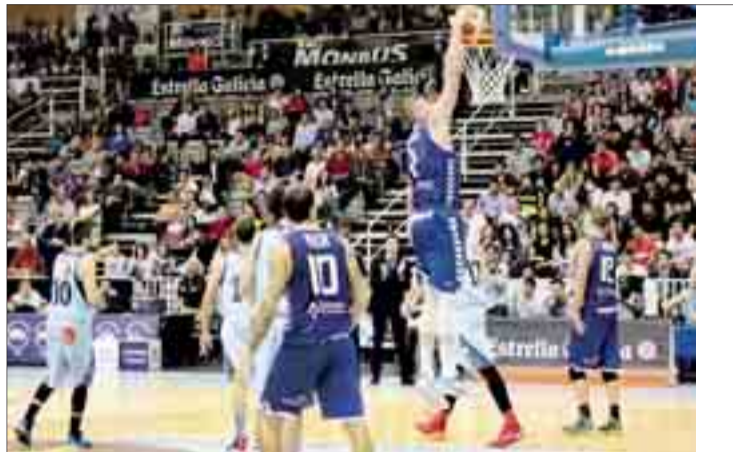
El San Pablo Inmobiliaria quiere inaugurar su casillero de victorias.

El conjunto azulón, tras un inicio de curso en el que las derrotas ante Actel Força Lleida y Cafés Candelas le han enviado a la parte baja de la tabla, debe dar un golpe de autoridad y mostrar su