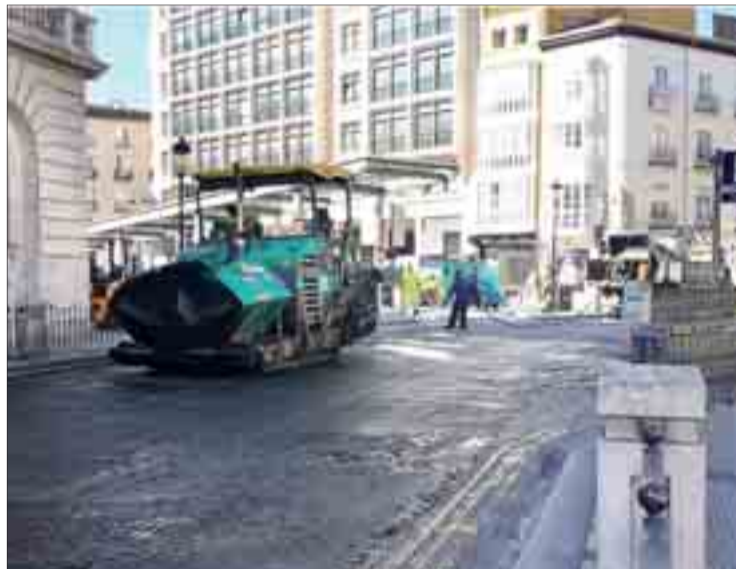
La campaña de asfaltado en el Centro Histórico ha sido uno de los proyectos y a ejecutado.