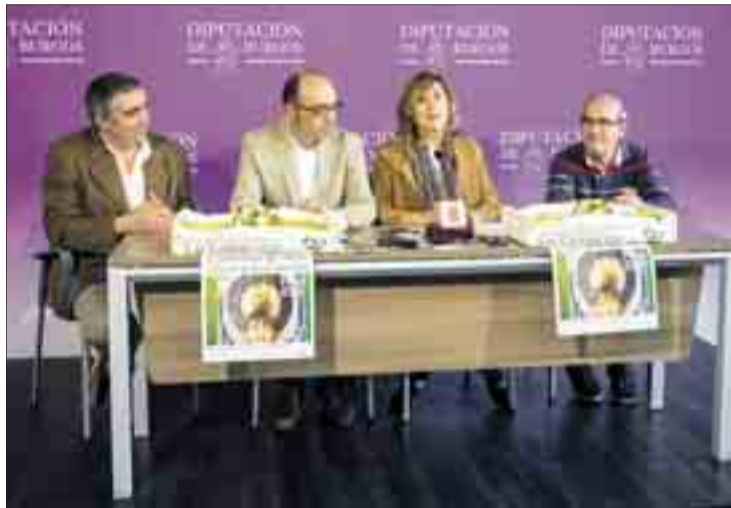
El pueblo de Cantabrana espera reunir entre 2.000 y 2.500 personas el domingo 16.

Los motivos, explicó el director técnico, han sido las condiciones climatológicas, caracterizadas por una "primavera lluviosa y fresca" y un verano seco, y el hecho de que el árbol de esta especie produce poca cantidad cuando ha generado mucho los años anteriores por una razón de "defensa natural". Por tanto, señaló, "se agotarán pronto".