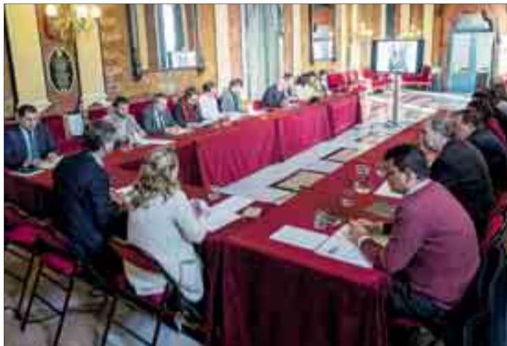
Reunión del Consejo Especial para la Custodia y Protección del Centro Histórico el día 11.