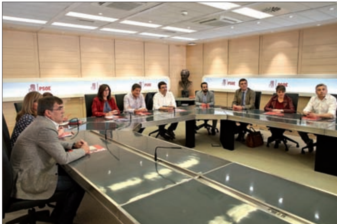
Reunión de la gestora del PSOE

En las últimas dos ocasiones en las que se ha celebrado el debate de investidura, ha conestado de dos partes: la intervención del aspirante a La Moncloa se ha realizado un día por la tarde y las réplicas de la oposición, así como la primera votación, en la que el