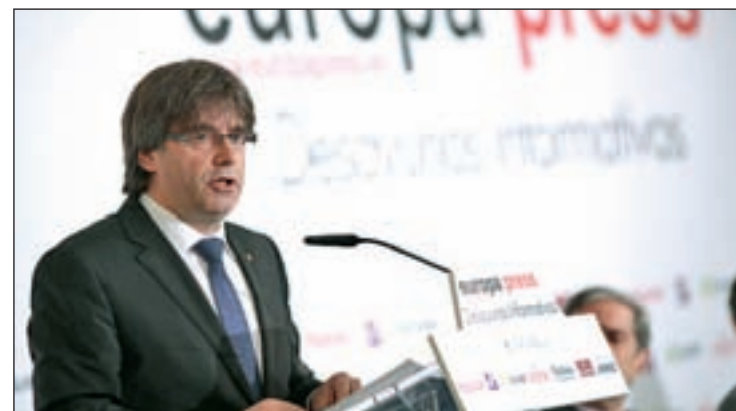
Carles Puigdemont, presidente de la Generalitat

En respuesta a esta propuesta, el ministro de Justicia en funciones, Rafael Catalá, aseguró que el Gobierno no aceptará su oferta, porque “ningún gobierno de España ni de ninguna parte del territorio debería atender una propuesta