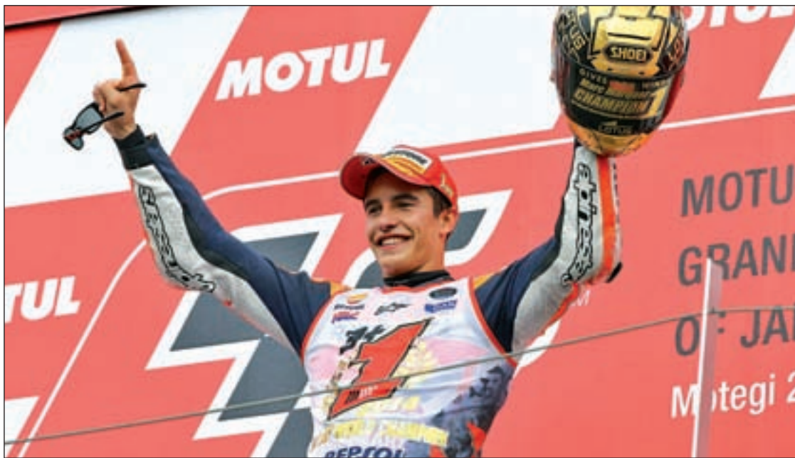
Márquez ya se proclamó campeón en Japón en el año 2014