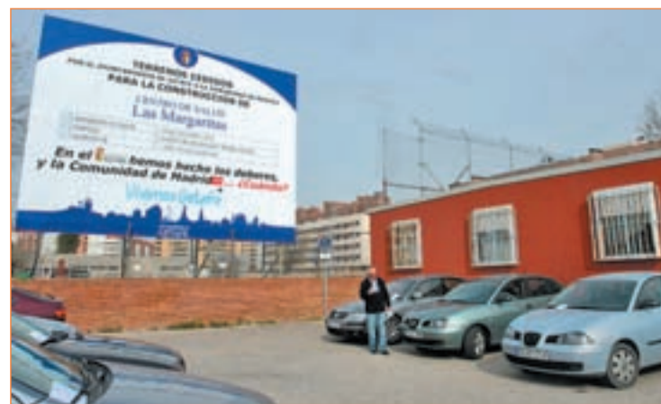
Cartel reivindicativo para la construcción de un centro de salud

años antes. "Ahora hemos tenido que hacer nosotros la primera escuela infantil y el primer colegio, sin tener competencias ni recursos económicos". En concreto pide centros de salud en El Bercial, Arroyo Culebro, Molinos y Buenavista. "Tenemos los mismos centros de salud y colegios que cuando la ciudad tenía 60.000 habitantes menos".