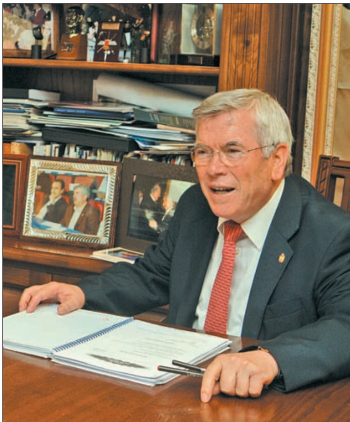
El alcalde y candidato a la reelección, Pedro Castro, en su despacho del Ayuntamiento

No te cansas si tienes ilusiones, apuestas, sueños que cumplir y compromisos con los ciudadanos. La gente tendría que conocer la realidad de Getafe. Desde las siete menos cuarto de la mañana estoy en los barrios hablando con la gente y adquiriendo compromisos que luego se convierten en realidades. Hace