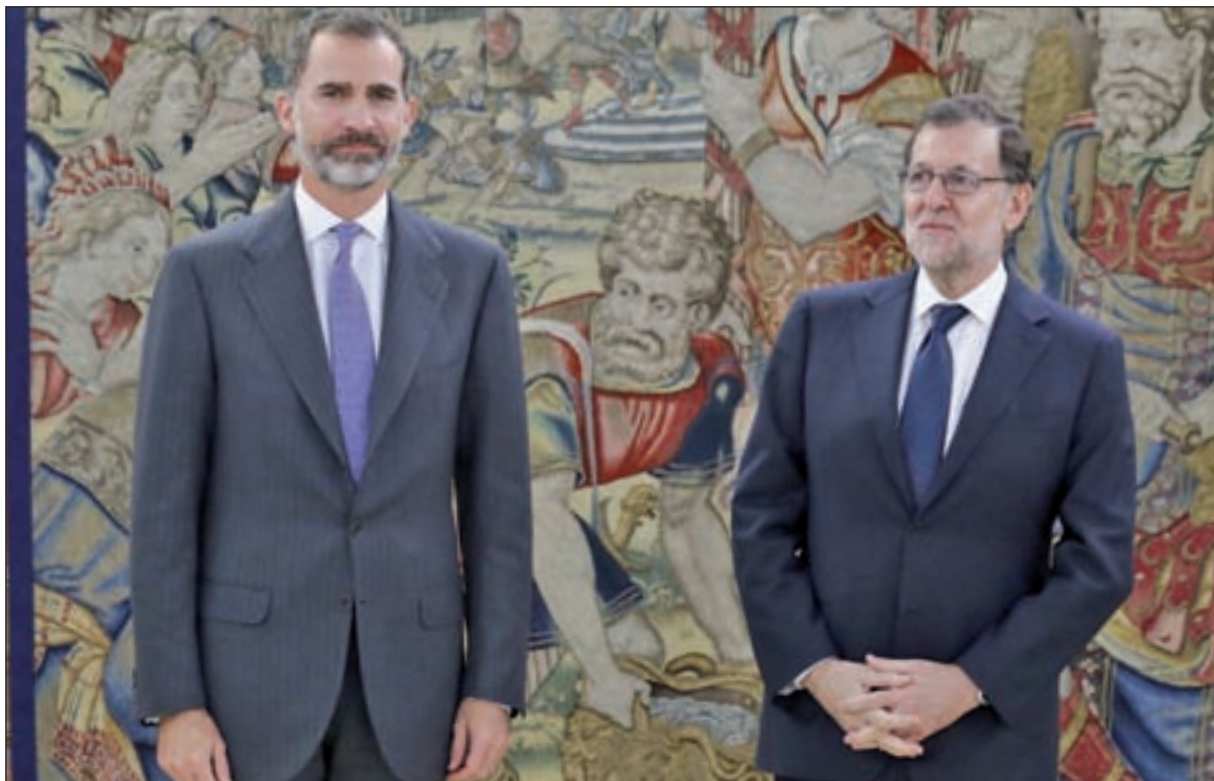
El Rey Felipe VI junto a Mariano Rajoy, durante su encuentro