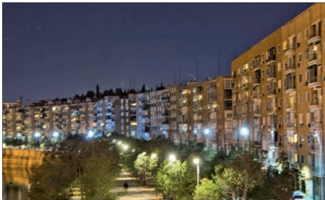
El domingo cambia la hora

Según un estudio realizado por la Comisión Europea y presentado al Parlamento en 1999, la medida tiene impactos "positivos" no sólo sobre el ahorro sino sobre