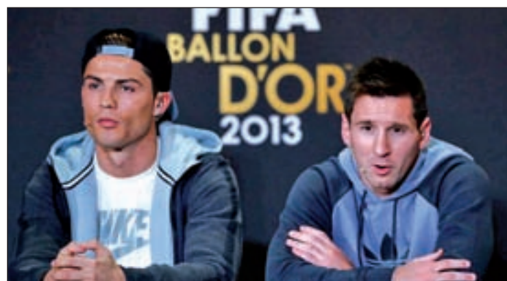
Messi y Ronaldo han copado los premios en los últimos años

UN LUSTRO de 'matrimonio' con el FIFA World Player