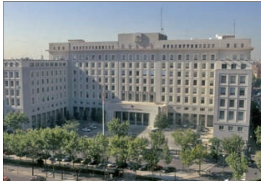
La sede del Ministerio de Defensa

sas consideraciones como el lugar del avistamiento, la fecha, el resumen de los hechos, conclusiones y la propuesta de clasificación o desclasificación del expediente,