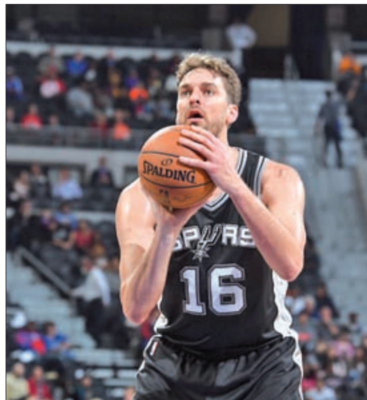
Pau Gasol inicia una nueva aventura en San Antonio

Al margen de las evoluciones de los jugadores que pueden defender los colores de la selección española, la atención estará puesta en saber qué equipo se hace con el preciado anillo de campeón. La defensa del título corresponde a Cleveland Cavaliers, un conjunto que el año pasado hizo añicos los pronósticos al imponerse en la fi-