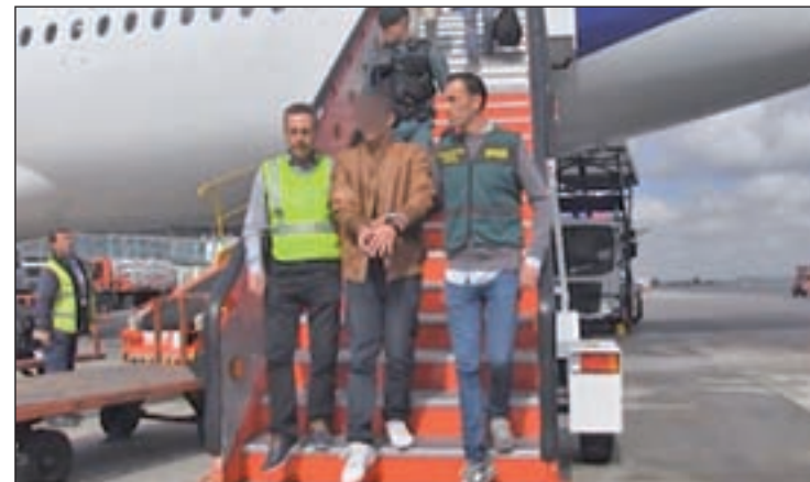
El presunto asesino se entregó a las autoridades