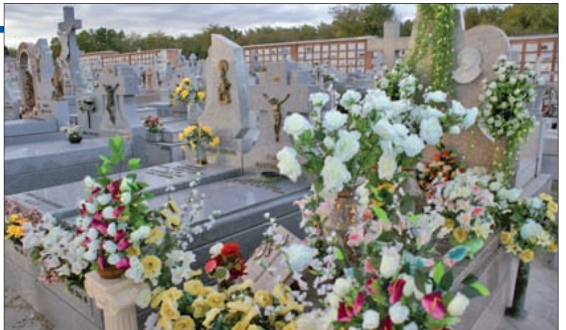
La Iglesia prefiere la sepultura en lugares sagrados como los cementerios

Sin embargo, se puntualiza que “sigue prefiriendo la sepultura de los cuerpos porque con ella se demuestra un mayor aprecio por los difuntos”. En todo caso,