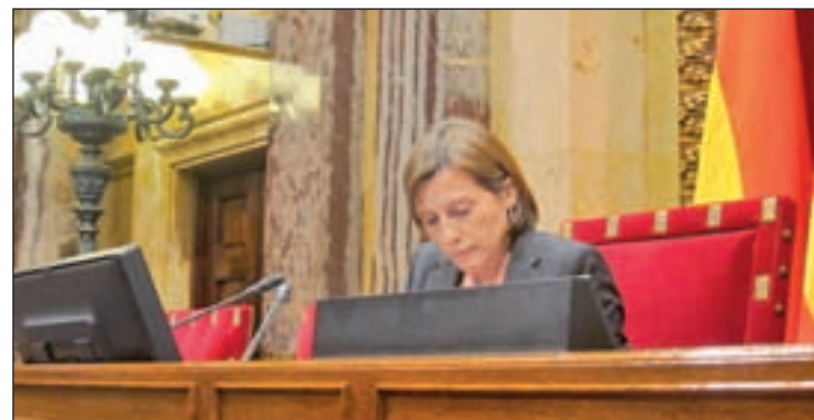
Carme Forcadell, presidenta del Parlament de Cataluña

go porque se limitó a cumplir con sus funciones y defendió “la soberanía del Parlament y el derecho de expresión de los diputados”. “Soy presidenta del Parlament porque me eligieron los diputados, y dejaré de serlo cuando los diputados elijan a otra persona”, concluyó.