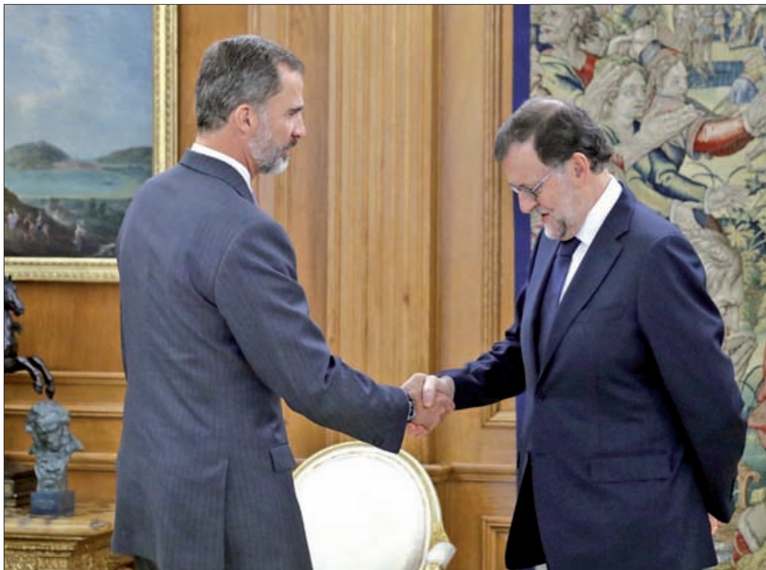
Mariano Rajoy saluda al Rey Felipe VI en su reciente encuentro

El líder del PP, Mariano Rajoy, será investido presidente del Gobierno este sábado, si se cumplen las previsiones, gracias a la abstención de los diputados socialistas en segunda votación PÁG. 2