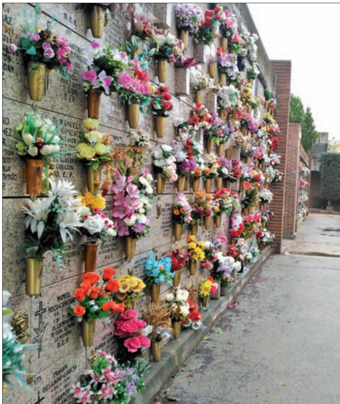
Una zona del cementerio de Alcorcón