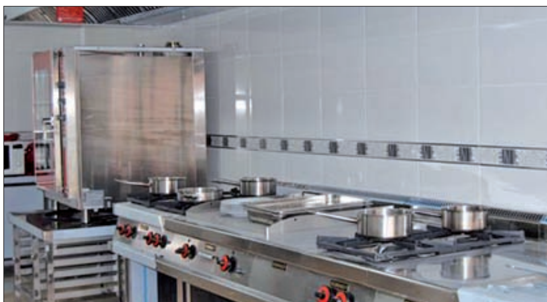
Cocina del nuevo centro

La investigación se inició a raíz de que los agentes tuviesen conocimiento de la existencia de un vehículo que presentaba indicios de haber sido sustraído y que se encontraba abandonado en el interior de un garaje en Alcorcón. Además, les resultaba sospechoso que el coche estuviese aparcado con el maletero completamente pegado a la pared para evitar su apertura y que desprendiese "un fuerte olor".