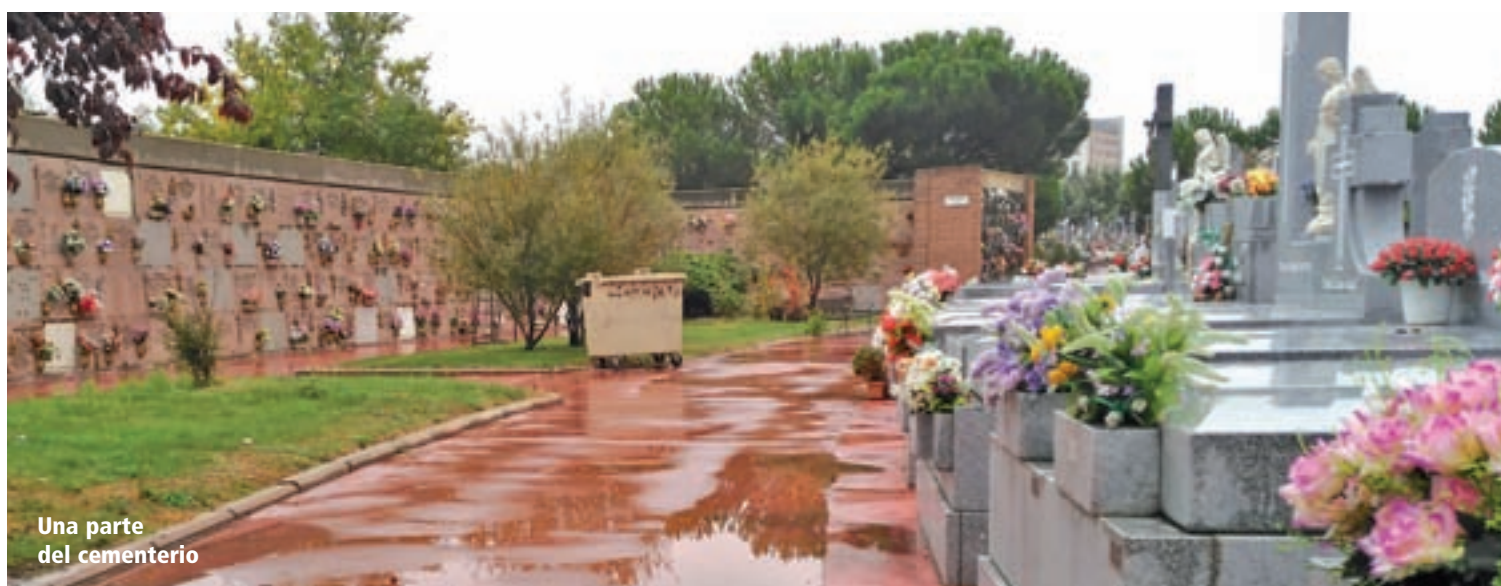
Una parte del cementerio