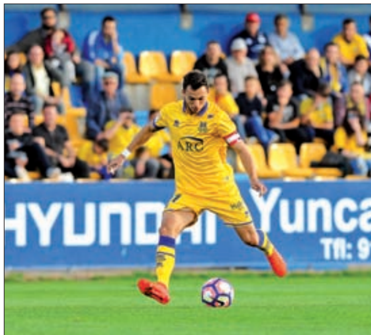
El Alcorcón, en uno de sus encuentros