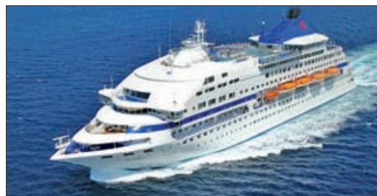
Madrid quiere atraer a los cruceristas

Fernández de Córdova se refirió en su intervención a las buenas conexiones de la capital con