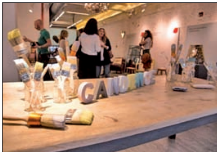
El espacio MOOD de Malasaña fue el lugar elegido

El último aspecto que destaca Mr Jeff en su estudio es el de la existencia de prendas rotas o descosidas, aunque ahora estos detalles precisamente estén de moda. Para la app de lavandería es una muestra de “falta de responsabilidad y de saber estar”. Para gustos, como siempre, los colores.