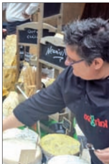
Jornada 'Q de Quesos'

Se trataba del prelude de la I Ruta de Tapas con Queso que se celebrará en la capital hasta el próximo 6 de noviembre. Los establecimientos hosteleros participantes (se pueden consultar en Qdequesos.com) ofrecerán tapas frías o calientes preparadas con queso y acompañadas con una cerveza AMBAR o una copa de vino a un precio de 4 euros.