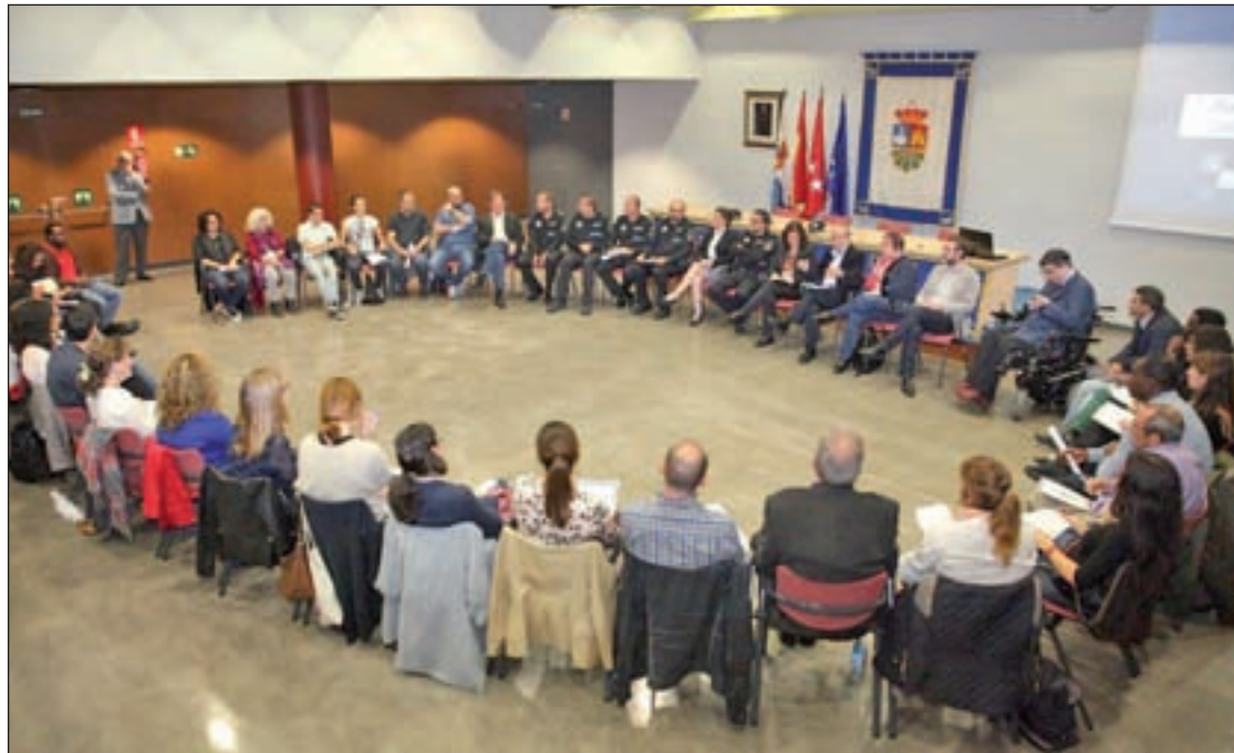
Presentación del Plan GENTE