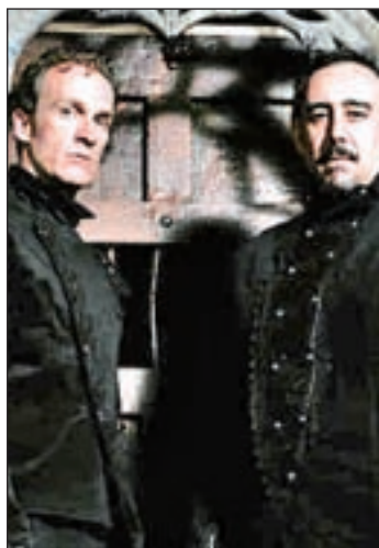
Vivirás una velada de terror

El escenario será el especializado teatro de 'La Caja del Terror' (Paseo de la Esperanza, 16 y 18, Madrid), que presume de ser el único de estas características en Europa.