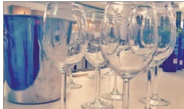
La I Semana de Vinos se celebrará hasta el 30 de octubre

Una mini hamburguesa de ternera del Bierzo con cebolla caramelizada, queso crema con orégano y patatas paja se encontrarán aquellos que se acerquen a Strawberry Fields, que lo podrán acompañar con el vino '2 de Mayo roble' también de la Bodega Jeromín, situada en el municipio de Villarejo de Salvanés y pertene-