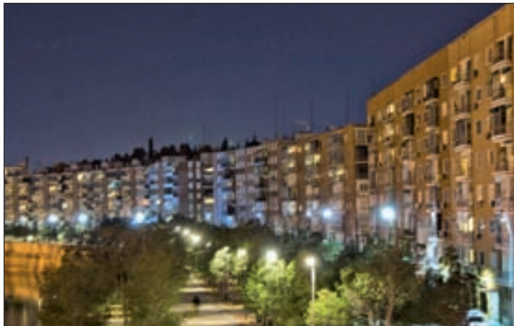
El domingo cambia la hora