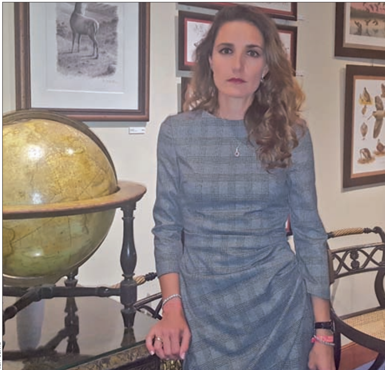
A.E. / GENTE