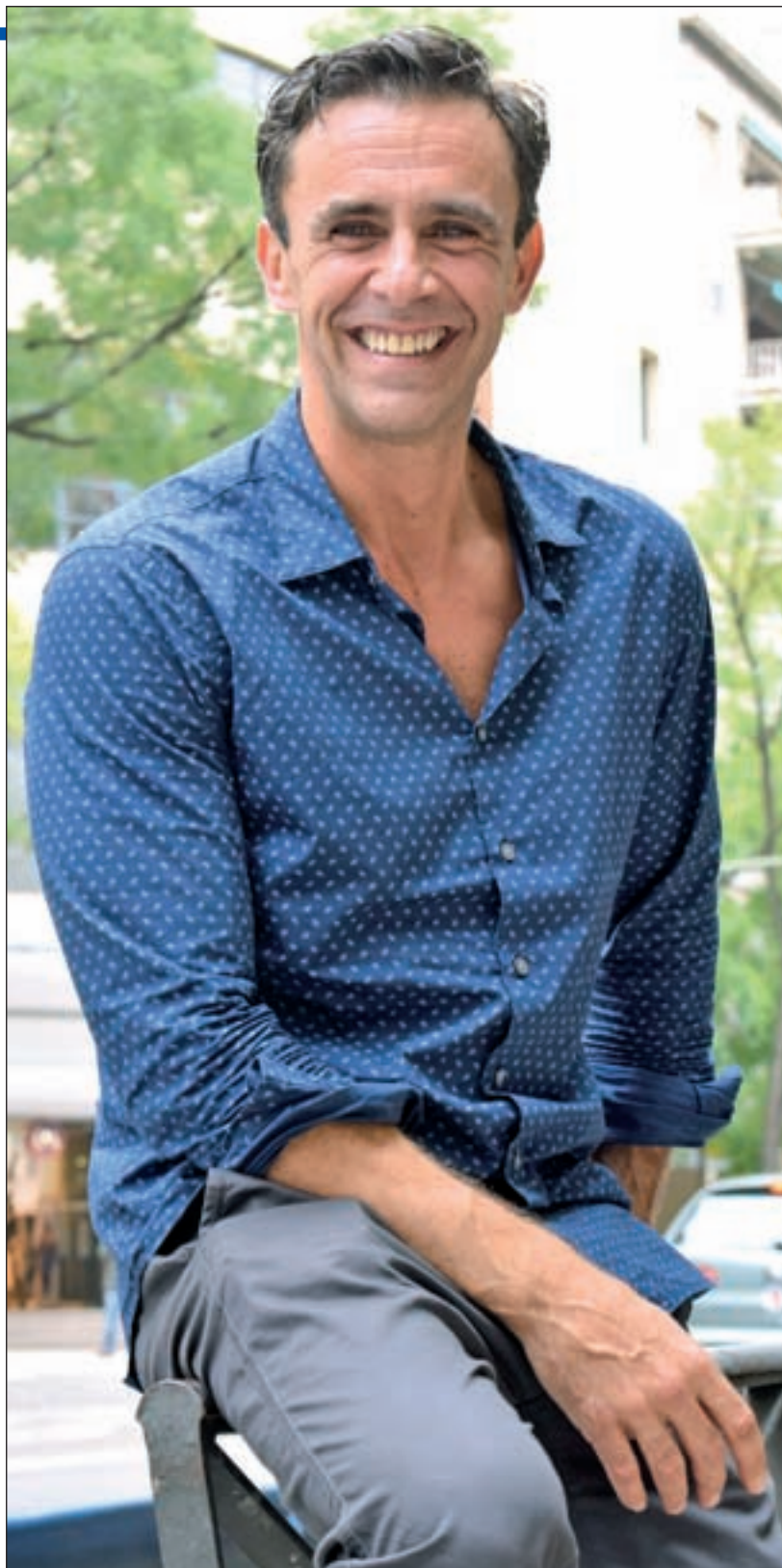
CHEMA MARTÍNEZ / GENTE

Sobre los debates políticos que prácticamente tienen el monopolio de las noches del fin de semana, Alonso Caparrós cree que "ya