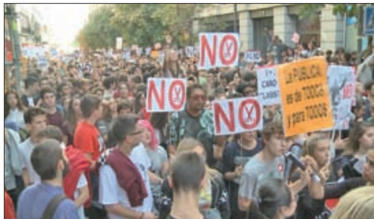
Manifestación en Madrid