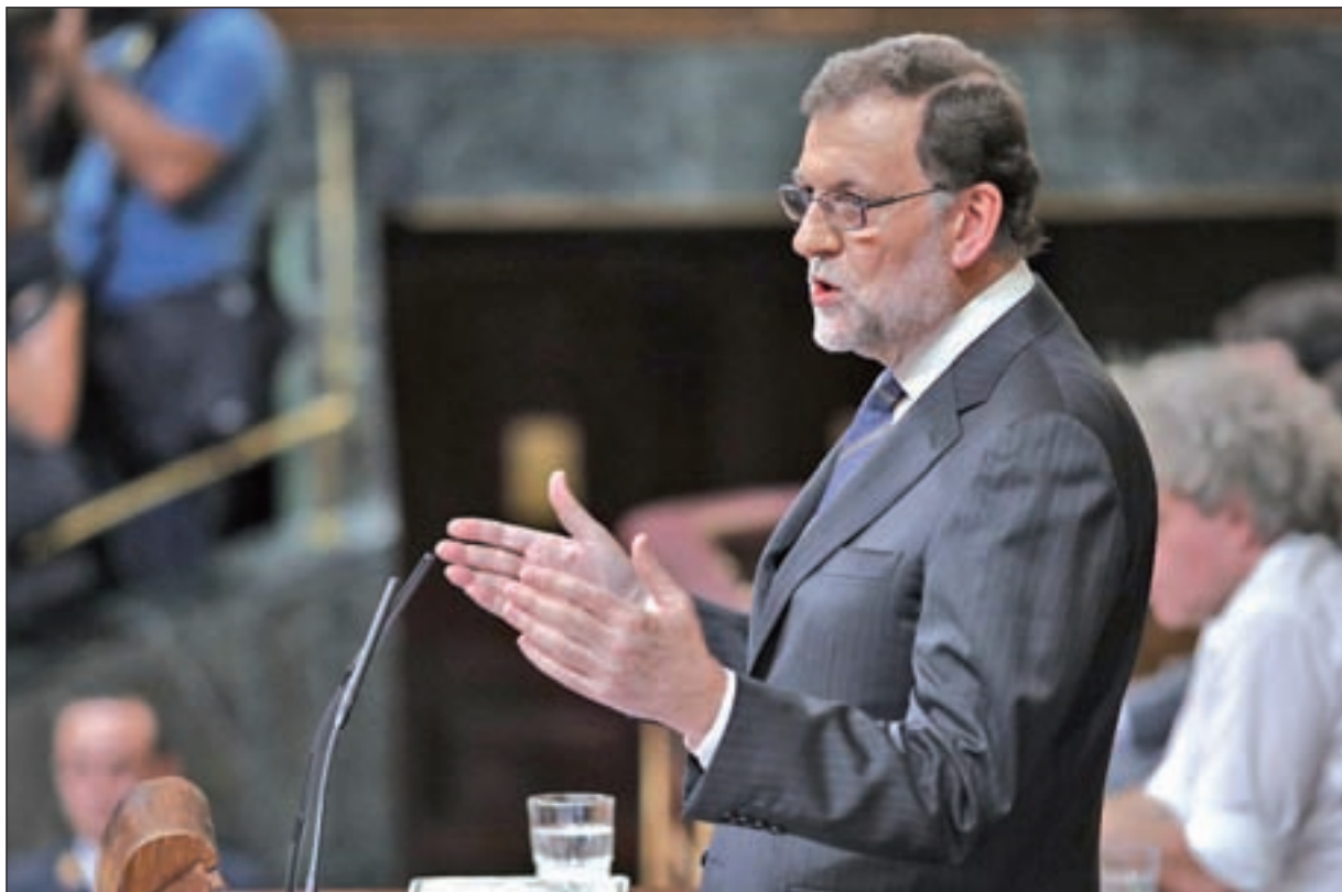
Mariano Rajoy, durante su intervención en el debate de investidura