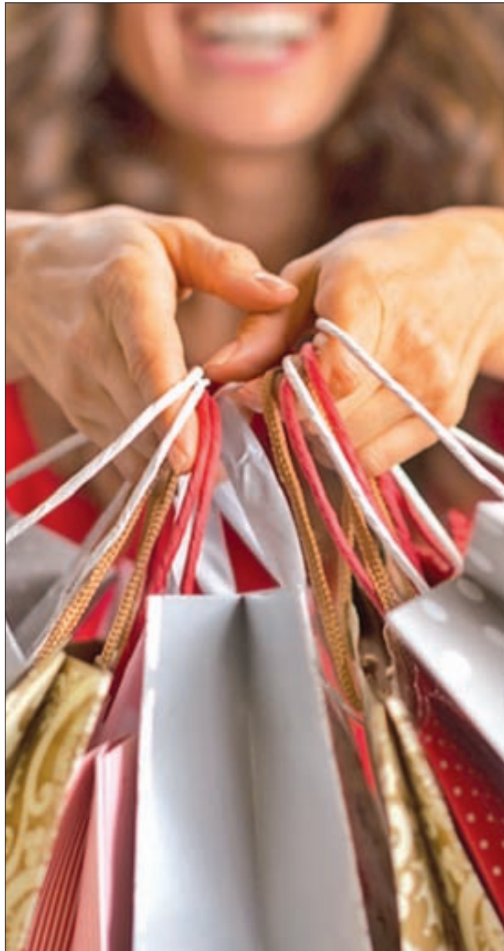
El aumento de las compras crea empleo

El documento de la compañía especializada en trabajo temporal señala que el comercio, la hostelería y el transporte y la logística serán los sectores que generarán más empleo. Dentro del primero de ellos destaca la vertiente 'online', en progresión constante, que ofrecerá en estas fechas oportunidades en puestos como empaquetadores, carretilleros, mozos de almacén, transportistas, teleoperadores y profesionales de atención al cliente, perfiles cada vez más demandados. Pero a pesar del auge del comercio electrónico, Randstad subraya que el tradicional seguirá siendo el principal impulsor del empleo en estas fechas. Supermercados y grandes superficies reforzarán sus plantillas ante el aumento de consumidores. Para ello buscarán dependientes, promotores, azafatos y perfiles comerciales, principalmente. La restauración también es una actividad esencial durante esta época, principalmente por los eventos sociales, como comidas y cenas, bien sean de empre-