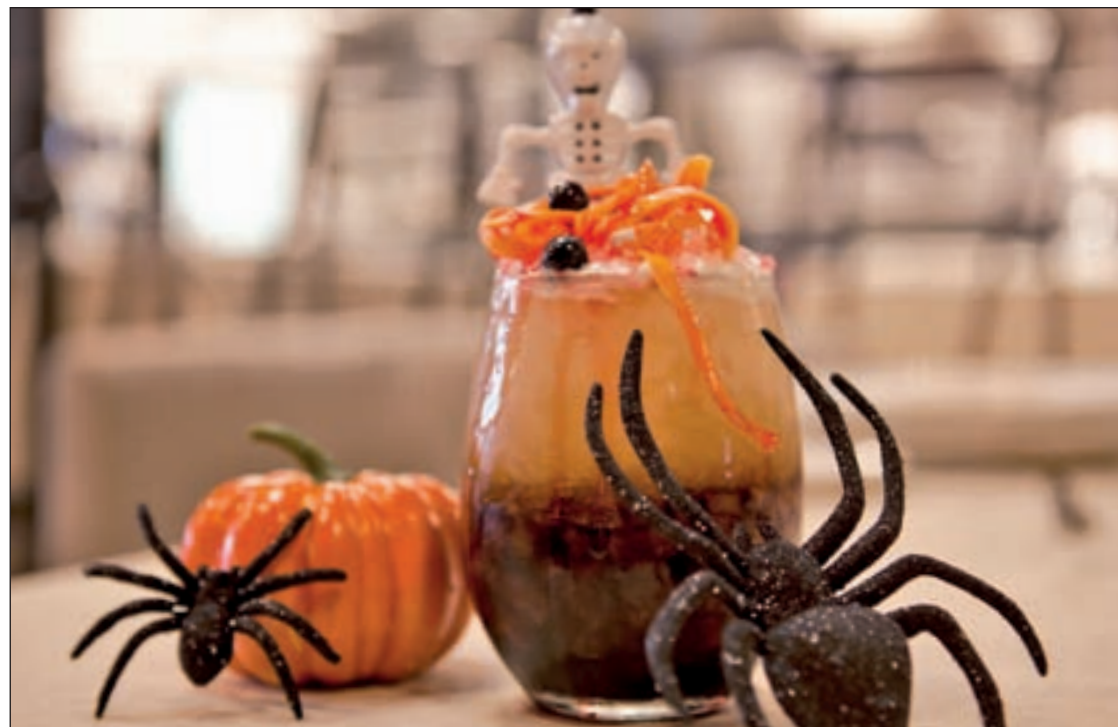
El Gran Duque de Sesto ofrecerá un menú especial

barrios de Palacio y Santiago. En ellas descubrirás los enigmas, leyendas y misterios de algunos de los edificios y monumentos más emblemáticos de la zona, además de aprender su rica historia. La visita, que tendrá lugar el 1 de noviembre, incluye entrada a la crip-