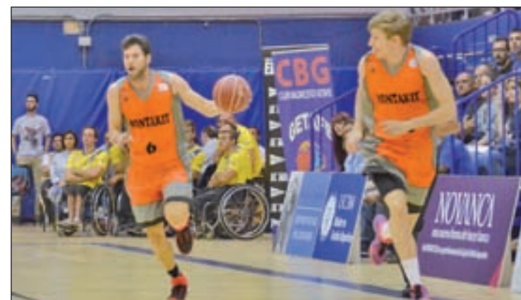
El Montakit, la pasada temporada

Lo que en un principio pareció ser un partido igualado entre dos equipos de la zona baja, se con-