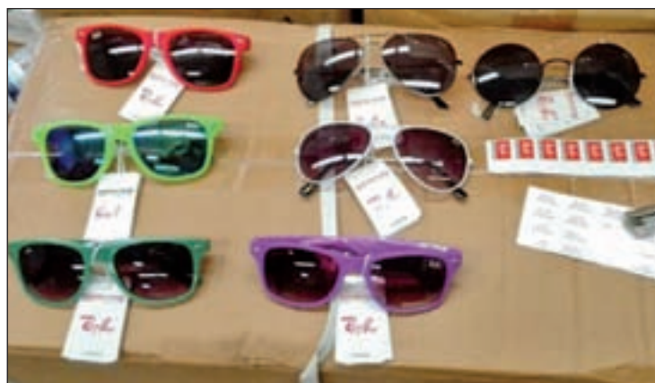
Gafas incautadas en la operación

Las autoridades francesas intervinieron 75.000 pares de gafas en el aeropuerto de París-Charles de Gaulle con destino a una empresa radicada en Fuenlabrada. Las víctimas de la falsificación también