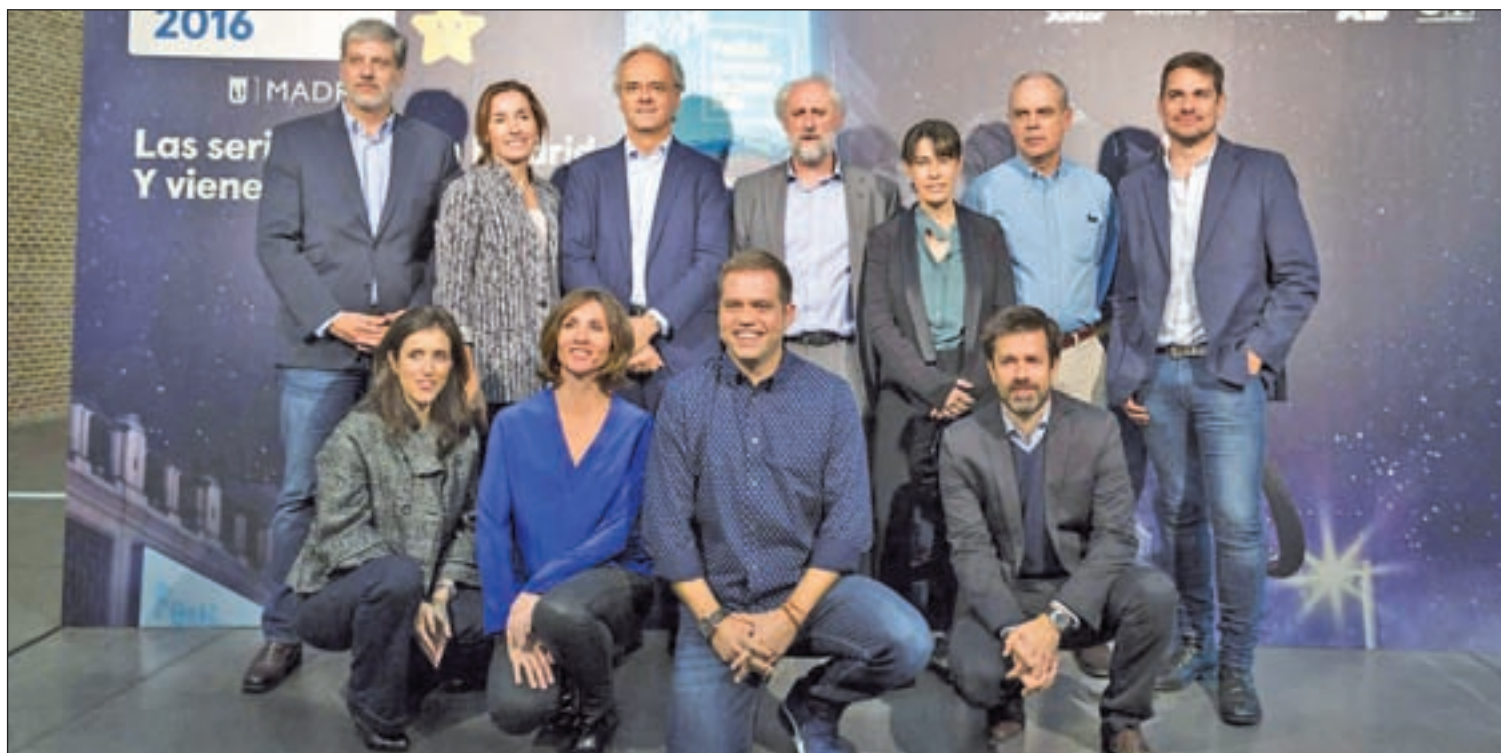
El festival se presentó en el Centro Cultural Conde Duque

El Teatro Circo Price acoge hasta el 5 de noviembre el montaje 'Beyond' de la compañía australiana Circa, dirigido a mayores de 14 años, que combina emociones y sentimientos con el circo más depurado. El espectáculo utiliza las técnicas más trabajadas del mundo del circo. 'Beyond' pasa del dinamismo de números de circo, como trapecio y mástil, a descaradas incursiones en la fuerza bruta con calidez, emoción y surrealismo.