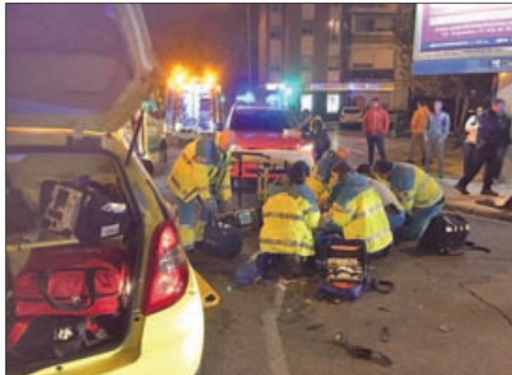
Accidente en el centro de Fuenlabrada GENTE

Según el portavoz de Emergencias 112 Comunidad de Madrid el joven transitaba ente el