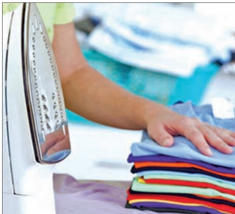
La plancha es una de las tareas que más quebraderos de cabeza provoca

Las prisas y la falta de atención a la hora de poner la lavadora pueden jugar también malas pa-