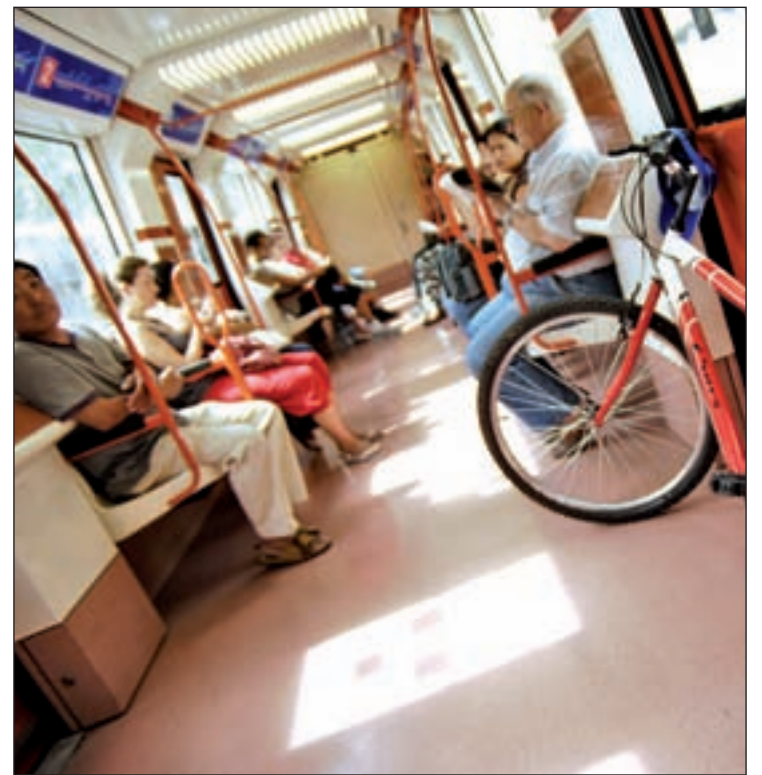
Tren circulando por la Línea 5 GENTE

La EMT recuerda a los usuarios que entre Campamento y Casa de Campo se pueden utilizar también las líneas convenciona-