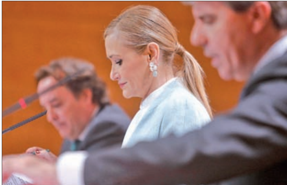
Cifuentes, en el centro, junto a Ángel Garrido (derecha) y Jaime González Taboada (izquierda)

Cifuentes justificó la necesidad de elaborar un nuevo documento en las demandas que han recibido por parte de los ayuntamientos. “Una de las quejas que nos han transmitido los alcaldes es que la tramitación de un Plan General de Ordenación Urbanística (PGOU) podía prolongarse entre 12 y 14 años hasta su aprobación inicial”, señaló la presidenta.