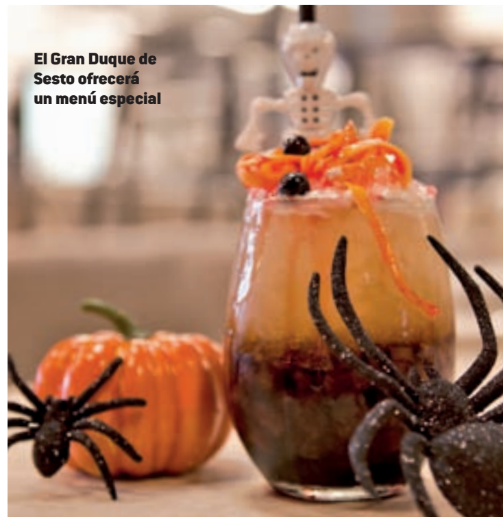
El Gran Duque de Sesto ofrecerá un menú especial

Halloween es una buena oportunidad para conocer el Pasaje del Terror del Parque de Atracciones