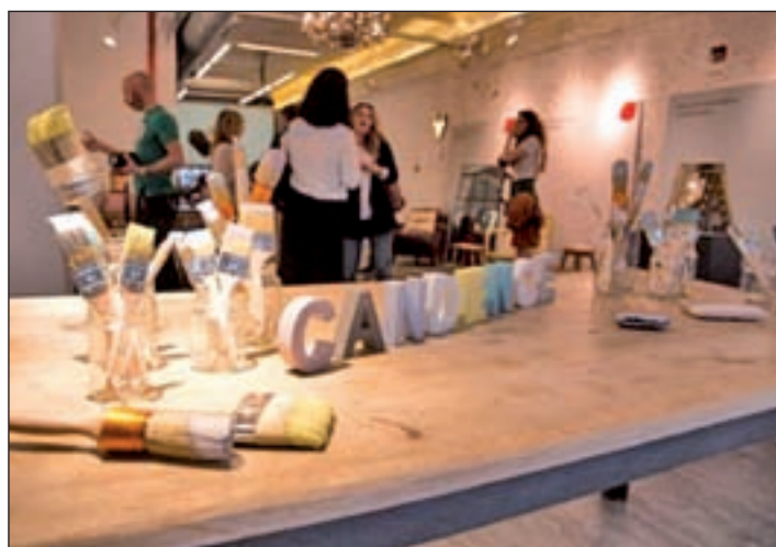
El espacio MOOD de Malasaña fue el lugar elegido

El último aspecto que destaca Mr Jeff en su estudio es el de la existencia de prendas rotas o descosidas, aunque ahora estos detalles precisamente estén de moda. Para la app de lavandería es una muestra de “falta de responsabilidad y de saber estar”. Para gustos, como siempre, los colores.