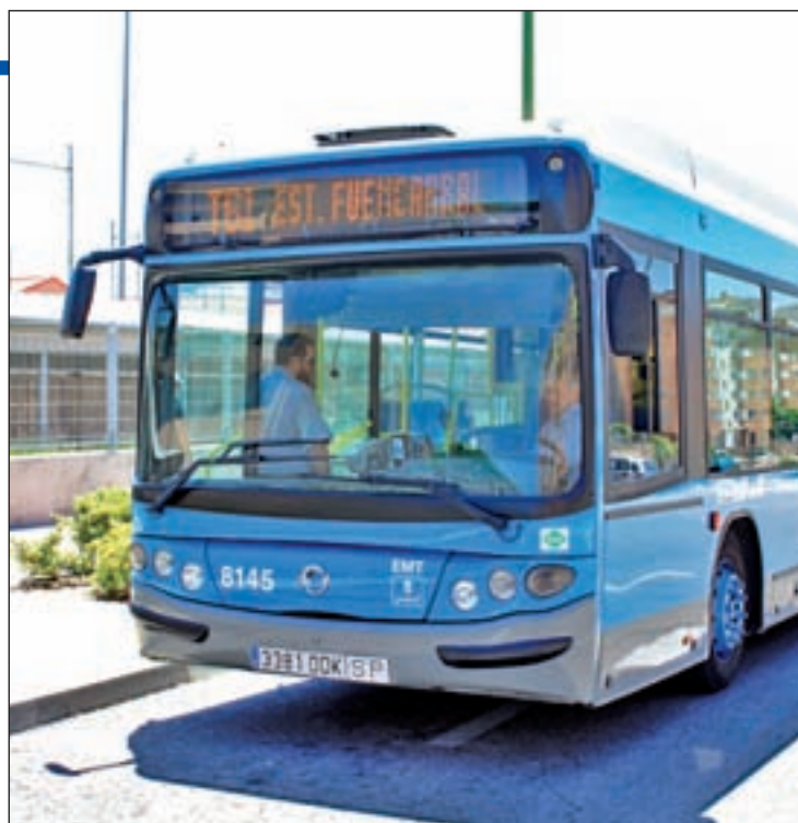
La línea T-61 que conecta Las Tablas con la estación de tren

Los residentes inciden en que, por otro lado, la EMT aprobó una mejora del servicio de la T-61, facilitando el acceso al Cercanías "principalmente, a los empleados de una empresa de comunicación situada en Las Tablas", subraya La Unión, para quien "existe un claro