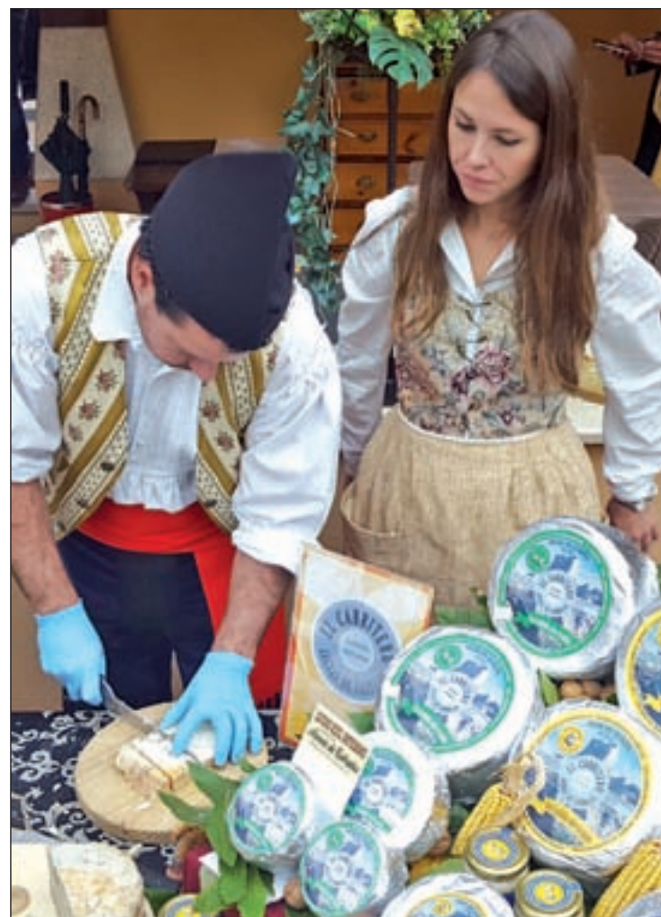
Participaron 24 queserías de todo el país