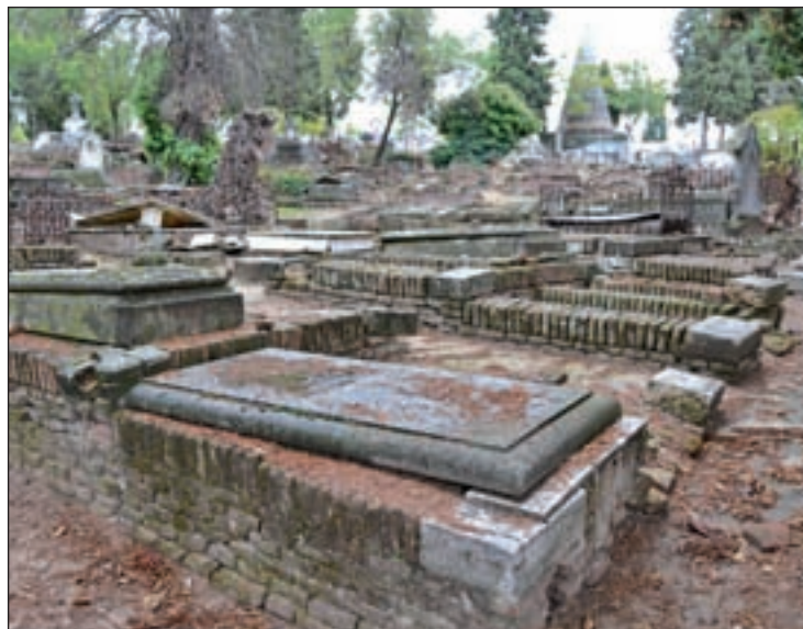
Estado de deterioro del cementerio de La Almudena