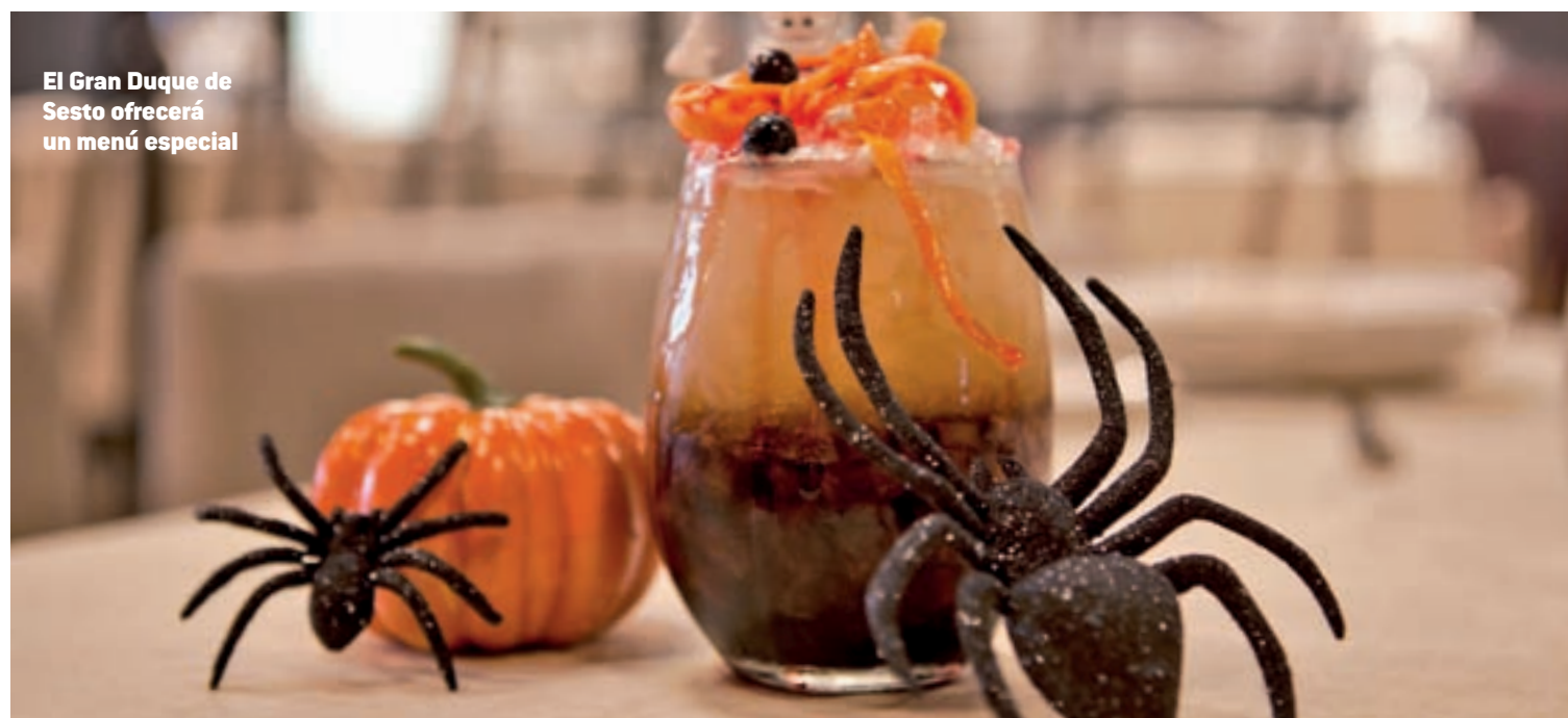
El Gran Duque de Sesto ofrecerá un menú especial

Como era de esperar, el 'payaso diabólico', que tantos problemas ha ocasionado ya en otros países de Europa y en Estados Unidos, es el disfraz de moda para este Halloween en nuestro país. En varias localidades y ciudades de España la Policía ha elaborado incluso guías y manuales para evitar que ocurra algún tipo de incidente en relación con la gente que disfrace de esta manera. El manual realizado recomienda distinguir cuándo se trata de una broma y cuándo se convierte en una amenaza.