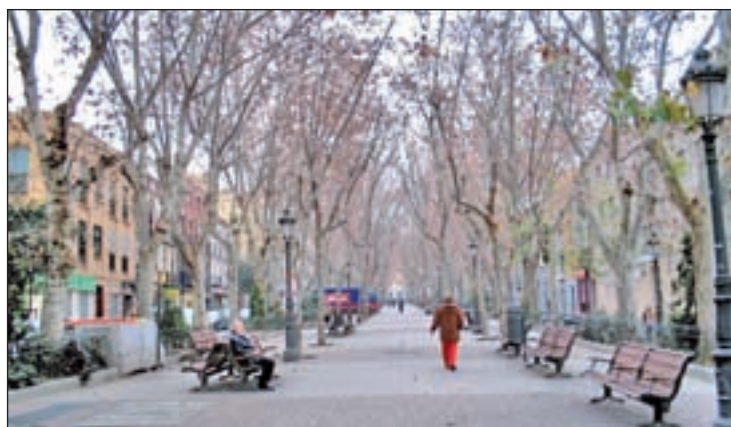
El bulevar de Peña Gorbea, una de las vías principales de Puente

Puente de Vallecas es el distrito que, en la actualidad, sufre mayores desequilibrios de la capital y Retiro el que tiene menos necesidades de actuación. Así lo aseguró la alcaldesa de Madrid, Manuela Carmena, el 25 de octubre en la sesión de dación de cuentas del Pleno de Cibeles. La regidora dijo que el Ayuntamiento de Madrid está evaluando la situación en cada zona a través de la elaboración