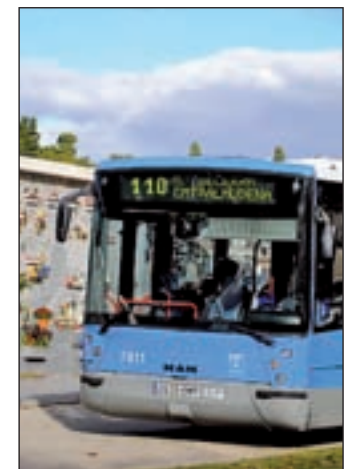
Autobús de la EMT

có el Consistorio con motivo de la remunicipalización de los servicios funerarios. Inicialmente está previsto que el plan completo se presente antes de final de año en la Comisión de Salud, Seguridad y Emergencias.