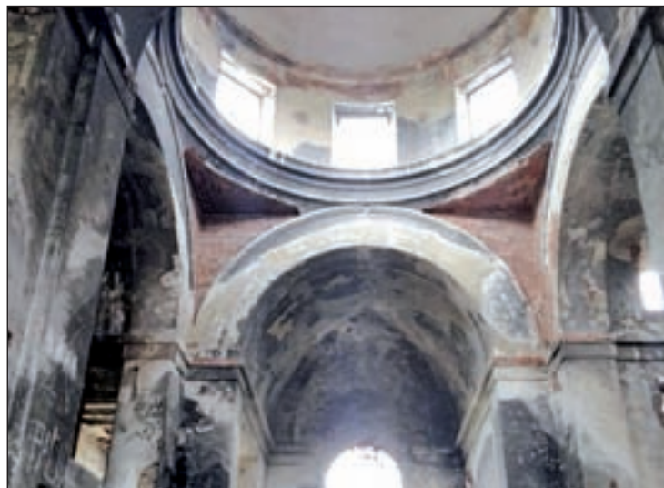
Estado actual del inmueble

De forma paralela, desde el propio distrito se llevarán a cabo el próximo mes de noviembre diferentes actuaciones para mejorar de forma transitoria la situación actual de la parcela y del cerramiento. El presupuesto será de 177.000 euros con cargo a las Inversiones Financieramente Sostenibles (IFS). Esta acción contempla la mejora del vallado, el desbroce del terreno y el acondicionamiento del interior del antiguo templo para que los operarios