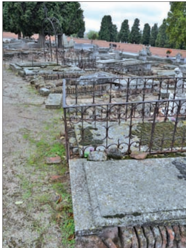
Estado de deterioro del cementerio de La Almudena

por el Ayuntamiento en diciembre del 2015, los camposantos madrileños necesitan obras por valor de 23,8 millones, que afectan a la urbanización interior (más de diez millones), muros perimetrales (más de dos millones),