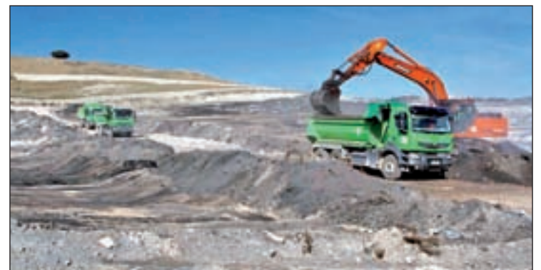
Trabajos de limpieza en el cementerio de neumáticos

Las cenizas serán transportadas por camiones con bañeras cerradas y depositadas en las instalaciones de los gestores de residuos Tradabe, del municipio madrileño de Valdilecha, y Renovés, del municipio toledano de Novés que, según subrayó Taboada, "reúnen todos los permisos".