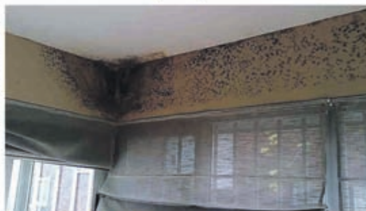
Problemas de humedad por condensación

jefe de micología en el instituto de la Salud Pública Louis Pasteur, explica este aumento por nuestro modo de vida: "Vivimos más en el interior, en casa o en el despacho. Desde los años 60, tendemos a un exceso de aislamiento para no dejar escapar el calor y además no se airea suficientemente".