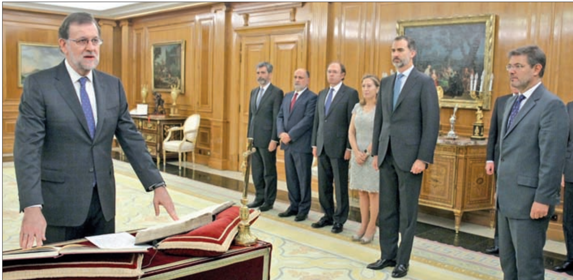
Mariano Rajoy jura su cargo como presidente del Gobierno en presencia del Rey Felipe VI

Mariano Rajoy fue investido presidente del Gobierno el pasado sábado gracias a la abstención de los socialistas • El líder del Ejecutivo se muestra dispuesto a hablar con el resto de formaciones, pero no a derribar "todo lo construido" PÁG. 2