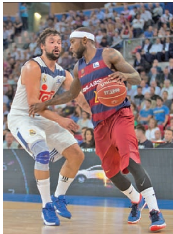
Rice tiene tomada la medida al equipo blanco

Con estos antecedentes, no es de extrañar que uno de los principales quebraderos de cabeza para Pablo Laso esté en descifrar el método con el que frenar al talentoso base de Richmond, especialmente cuando Bartzokas está teniendo serias complicaciones para dosificar a sus jugadores, tras unas semanas en las que los compromisos de la ACB y la Euroliga se han solapado. Para acabar de complicar la situación, jugadores como Koponen o Juan Carlos Navarro han tenido que pasar por la enfermería, aunque más preocupante es la baja de Pau Ribas. El escolta estará varios meses en el dique seco como consecuencia de la grave lesión sufrida ante el Estrella Roja.