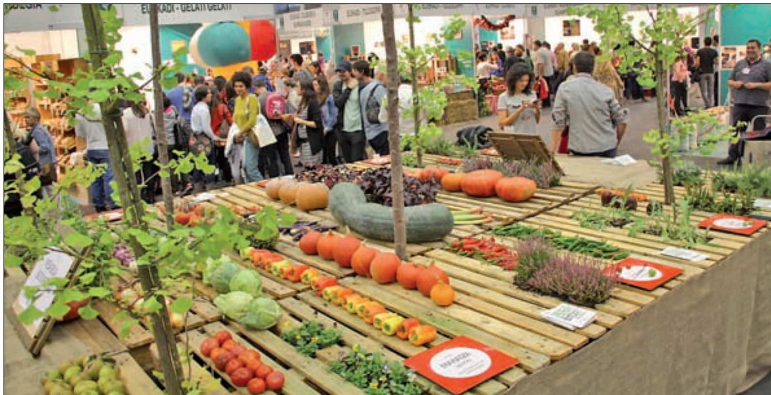
BioCultura Madrid celebrará su 32 edición