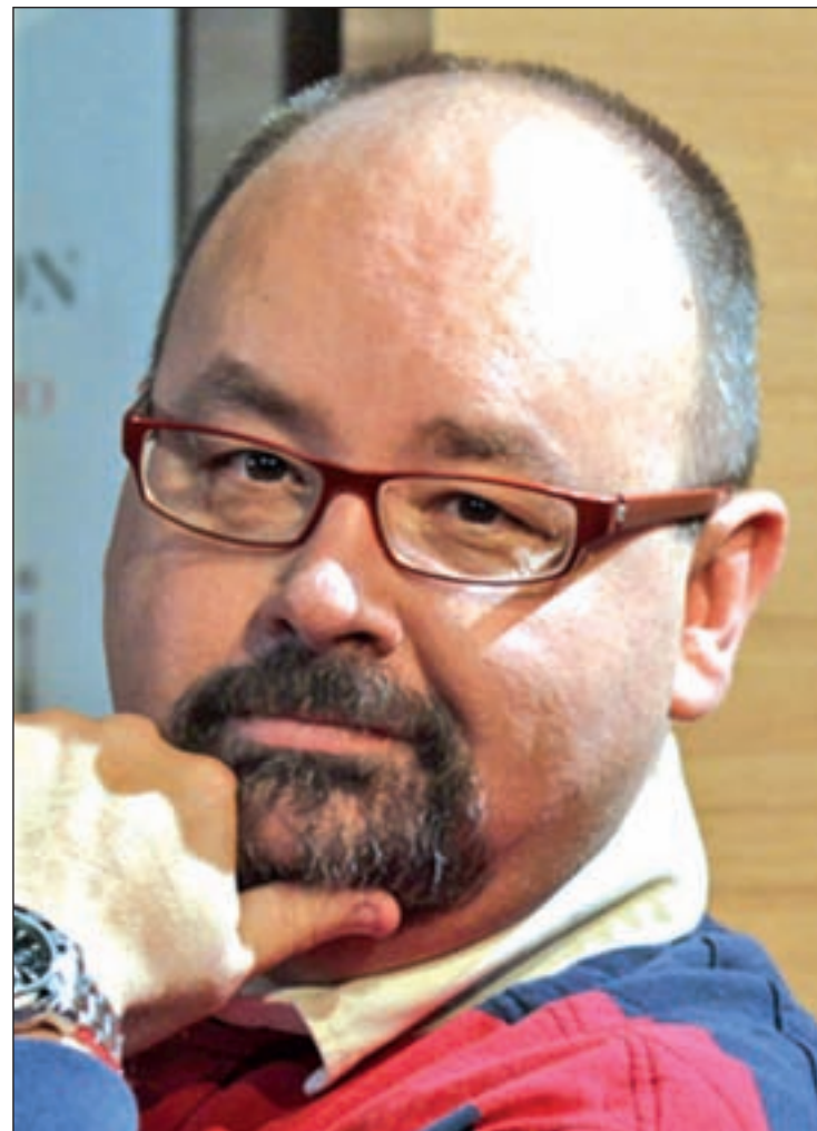
Carlos Ruiz Zafón estrena novela

Las novedades llegan con fuerza pensando en la inminente campaña navideña