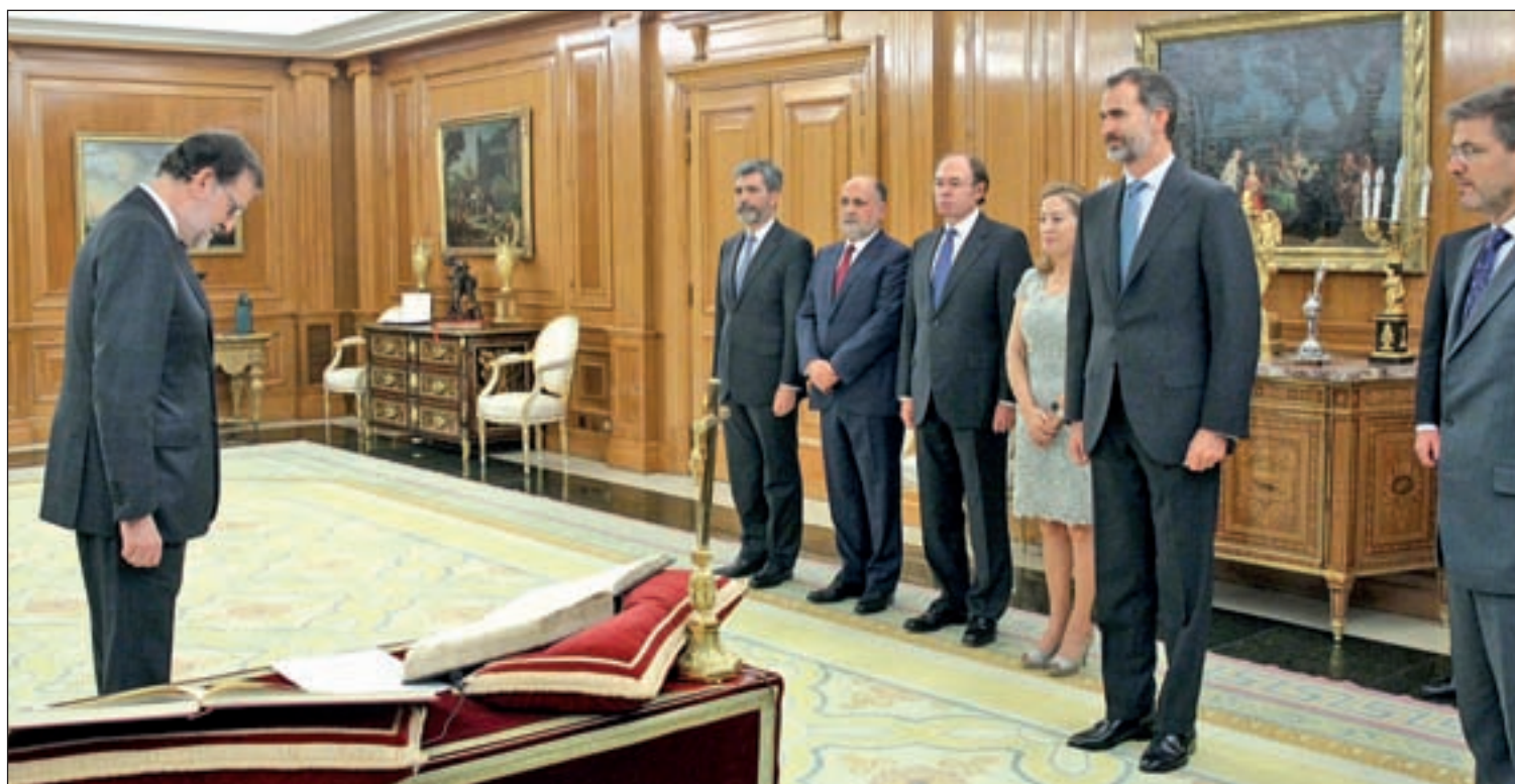
Mariano Rajoy, presidente del Gobierno, juró su cargo ante el Rey Felipe VI el pasado lunes