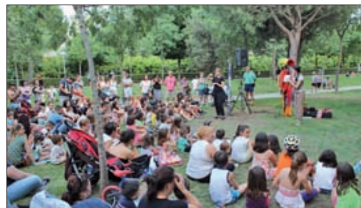
Actividades de 'Súbete a mi tren'

'Súbete a mi tren' es un programa que organiza el Ayuntamiento desde el año 2014. Entre las actividades que lleva a cabo se inclu-