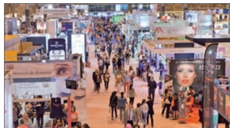
Se habilitarán los pabellones 3, 4, 5 y 14.1

Salón Look Madrid 2016 contará con 400 expositores, 1.200 marcas y un completo calendario de actividades paralelas.