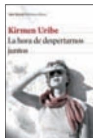
La hora de despertarnos juntos KIRMEN URIBE SEIX BARRAL

Este precioso libro es una declaración de profunda amistad entre dos criaturas fantásticas cuyos mensajes inmortales gustarán a todo aquel que haya sentido algo muy intenso por alguien alguna vez.