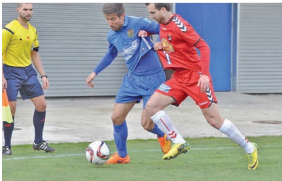
El Fuenla, durante un encuentro