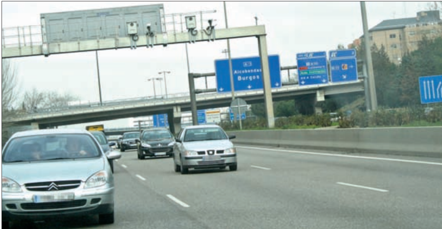
Radares de detección de velocidad en la M-30 GENTE