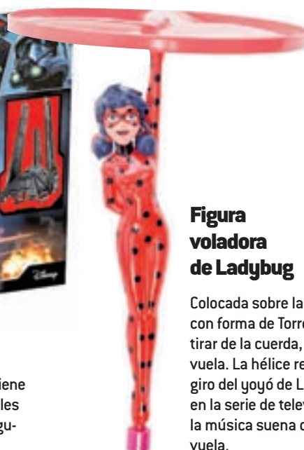
Figura voladora de Ladybug

La Lanzadera Imperial de Krennic de Lego viene equipada con enormes alas plegables, paneles delanteros, laterales abatibles, cinco minifiguras y un droide K-2SO.