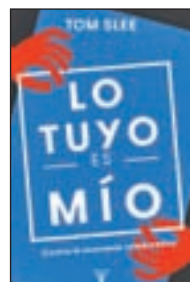
Lo tuyo es mío TOM SLEE TAURUS

Un rancho abandonado plagado de recuerdos. Una bandada de pájaros misteriosos que lo sobrevuelan. Dos hermanas tan distintas como el día y la noche. Y un amor imposible.