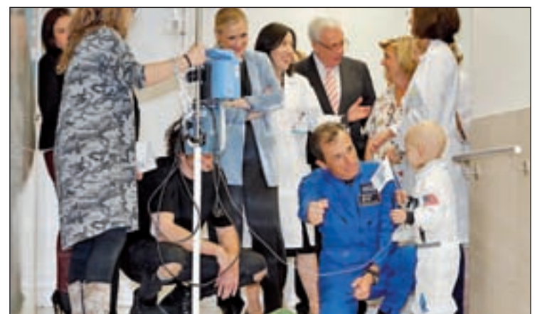
El astronauta Pedro Duque, junto a uno de los niños ingresados