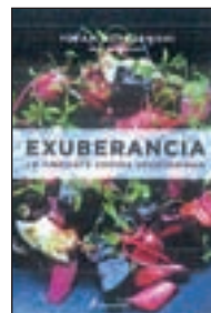
Exuberancia YOTAM OTTOLENGHI SALAMANDRA

Tomasa, empleada de hogar sesentona, se encuentra un día a su señora dama de la alta sociedad madrileña, asesinada en el chalé donde lleva trabajando cuarenta años.