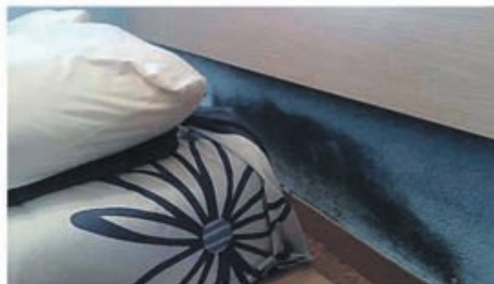
Problemas de humedad por capilaridad

Se han realizado estudios científicos sobre adolescentes que sufren afecciones respiratorias, dando como resultado un 83% de asma, bronquitis asmáticas y bronquitis crónicas y un 87% de rinitis crónicas, que alcanzan a jóvenes que viven en habitaciones demasiado húmedas. De un 20 a un 30% de nosotros sufrimos alergias respiratorias, ¡dos veces más que hace 20 años!. Edouard Drouhet,