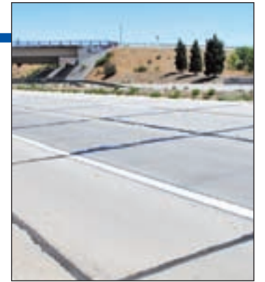
Estado de la Vía del Culebro

La Asamblea de Madrid pondrá en marcha un Plan de Mantenimiento de Infraestructuras