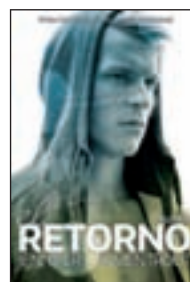
El Retorno JENNIFER L. ARMENTROUT EDICIONES KIWI

A Karmele Urresti la Guerra Civil le sorprende en su Ondarroa natal. Mientras la población huye al exilio, ella decide quedarse curando a los heridos y tratando de liberar a su padre, que ha sido encarcelado.