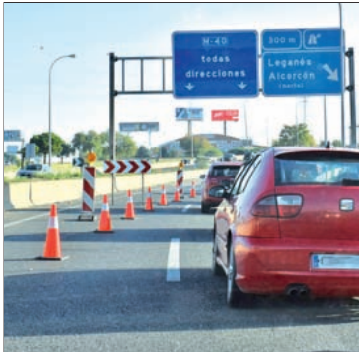
Carril cortado en el acceso de la A-5 a la M-40

La finalización de esta obra es fundamental para aliviar el intenso tráfico y los inacabables atascos que los conductores de la zo-