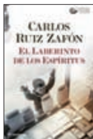
El laberinto de los espíritus CARLOS RUIZ ZAFÓN PLANETA

Jorge es un abogado brillante. Saca adelante su bufete, trabaja sin descanso en los casos más complicados, es extremadamente responsable y, cuando acaba el día, se pone al límite en el gimnasio.