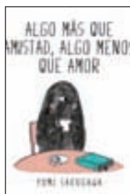
Algo más que amistad, algo menos que amor YUMI SAKUGAWA SAPRISTI

En el mundo sombrío de Drake, sus enemigos se aprovecharán de cualquier debilidad que él manifieste para poder controlar su voluntad. Segunda entrega de la trilogía erótica de Banks.