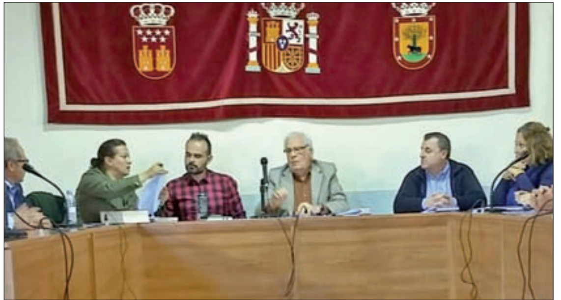
El pleno de Fresno de Torote del 18 de octubre donde salió adelante la moción de censura

Los denunciantes apuntan en el recurso, al que ha tenido acceso GENTE, que "en la tramitación, votación y toma de acuerdos, se ha vulnerado el principio de mayoría reforzada que exige" uno de los preceptos de la Ley Orgánica de Régimen Electoral General, "que se conforma en la obligación de que se aporte un voto más por cada concejal tránsfuga que proceda a la votación de la moción de censura presentada, faltando por tanto 4 votos más para que ésta fuere aprobada, al deber ser considerados los cuatro concejales del PP como tránsfugas, toda vez la oposición mani-