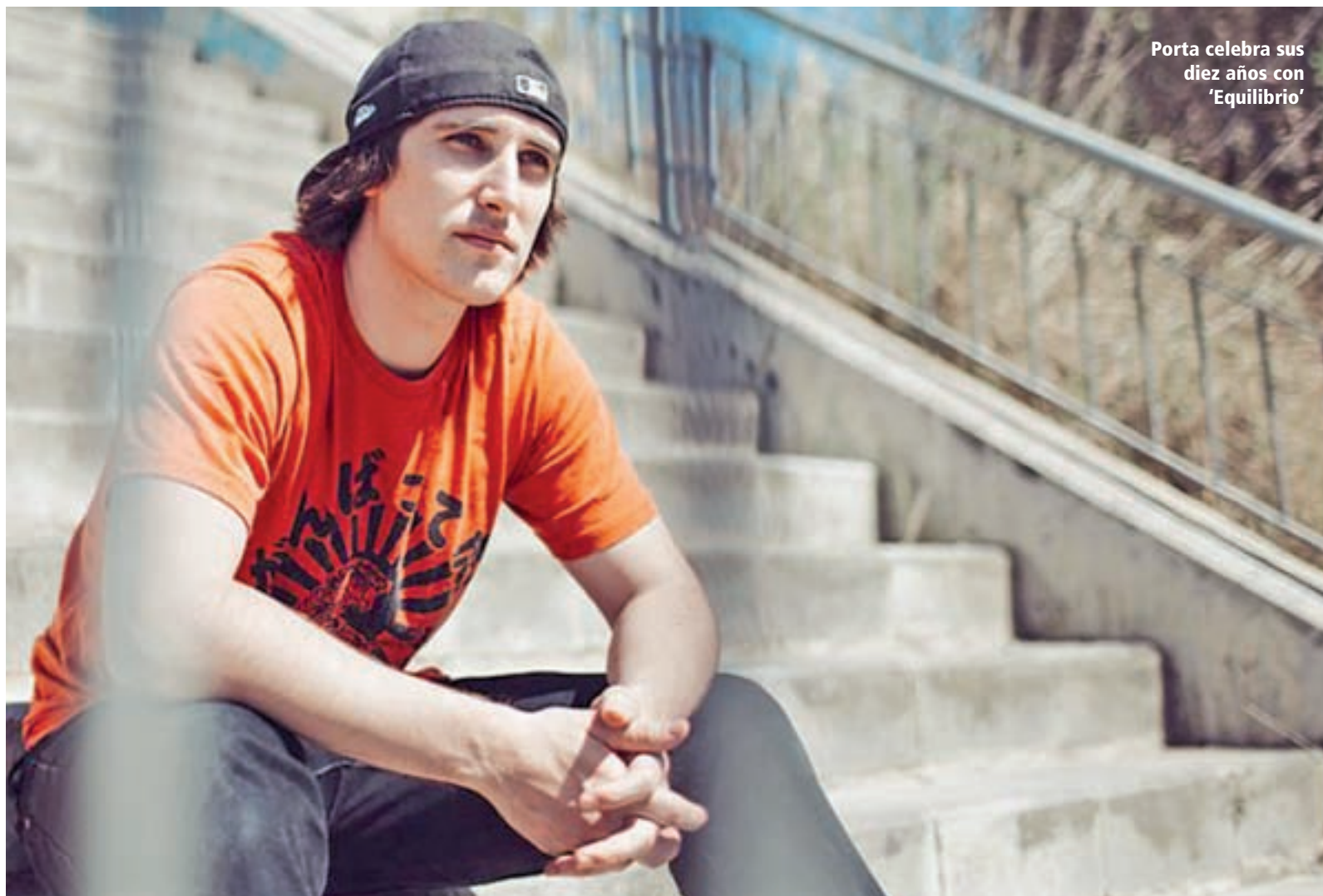
Porta celebra sus diez años con 'Equilibrio'