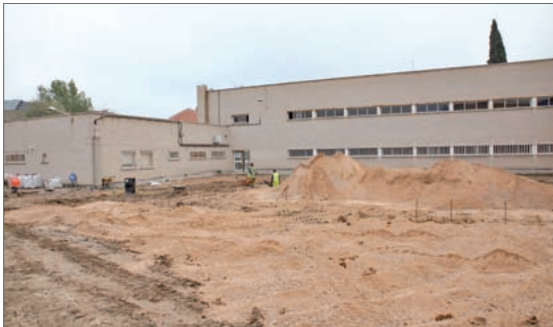
Actual estado de las obras