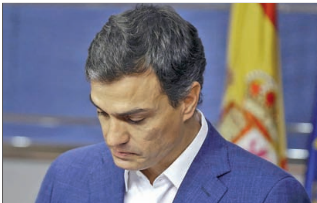
Pedro Sánchez, en rueda de prensa

de gobernar a base de decreto Ley si los populares abusan de esta forma jurídica. Todo esto con un horizonte claro, las cuentas para 2018, en las que los partidos quedarán dejar su impronta o aprovechar para forzar nuevas elecciones.