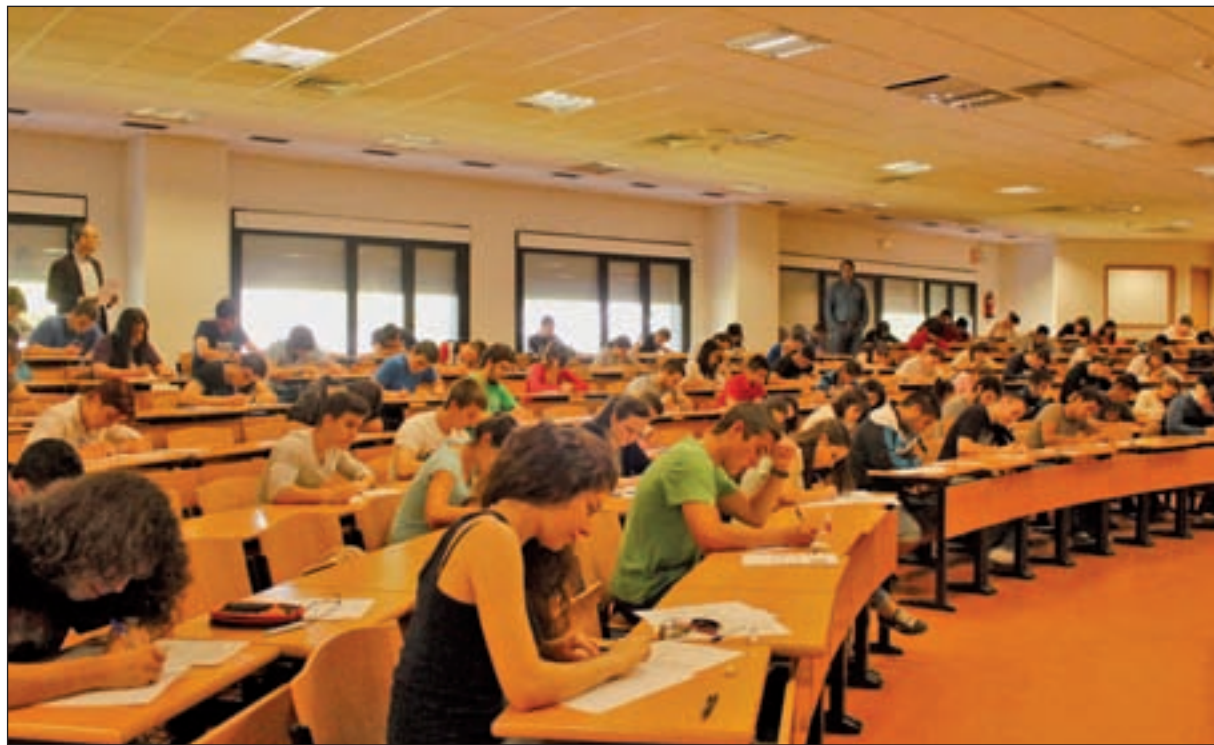
La implantación de la ley finaliza este curso

Como primeros pasos hacia ese posible pacto, siendo todavía ministro en funciones de Educación, Cultura y Deportes, Íñigo Méndez de Vigo, se reunió con las principales organizaciones de la comunidad educativa, como sindicatos, asociaciones de padres, de profesores, de alumnos y sindicatos de