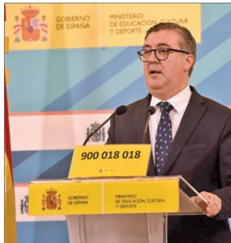
Un momento de la presentación del dispositivo el 20 de octubre

El personal lo pone la empresa adjudicataria AlacaláBC, que tiene un contrato con el Gobierno de un año de duración por un importe de 482.635 euros, si bien