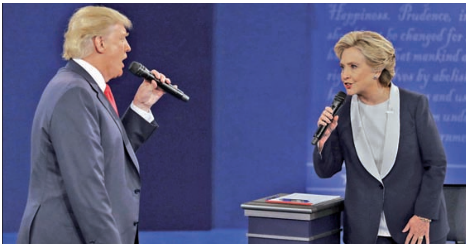
Donald Trump y Hillary Clinton, durante un debate electoral

Los norteamericanos que quieran votar deben inscribirse previa-