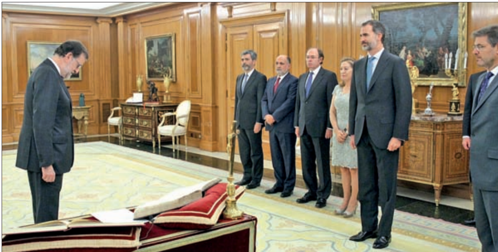
Mariano Rajoy, presidente del Gobierno, juró su cargo ante el Rey Felipe VI el pasado lunes

no pretende acceder a La Moncloa para realizar cualquier clase de política. “No estoy dispuesto a derribar lo construido”, enfatizó, para agregar que se puede “mejorar” pero él no está dispuesto a “aceptar” una “demolición”.