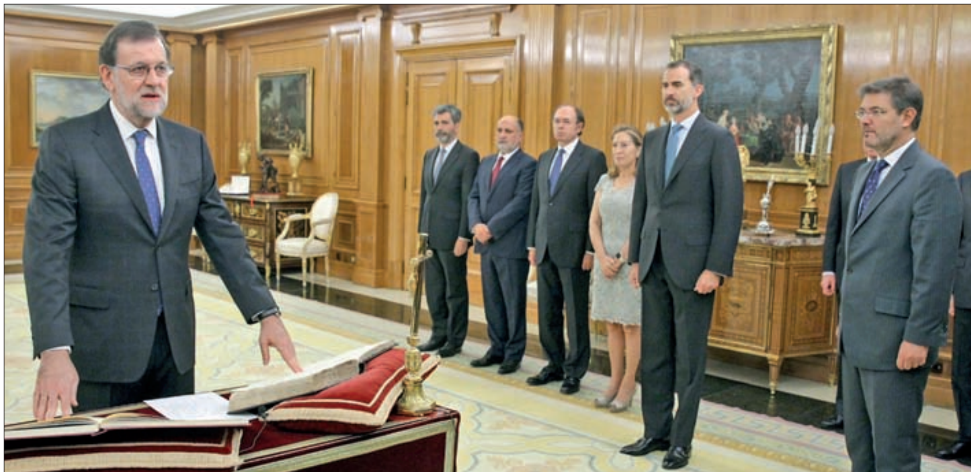
Mariano Rajoy jura su cargo como presidente del Gobierno en presencia del Rey Felipe VI

Mariano Rajoy fue investido presidente del Gobierno el pasado sábado gracias a la abstención de los socialistas. El presidente se muestra dispuesto a hablar con el resto de formaciones, pero no a derribar "todo lo construido" PÁGS. 2-3