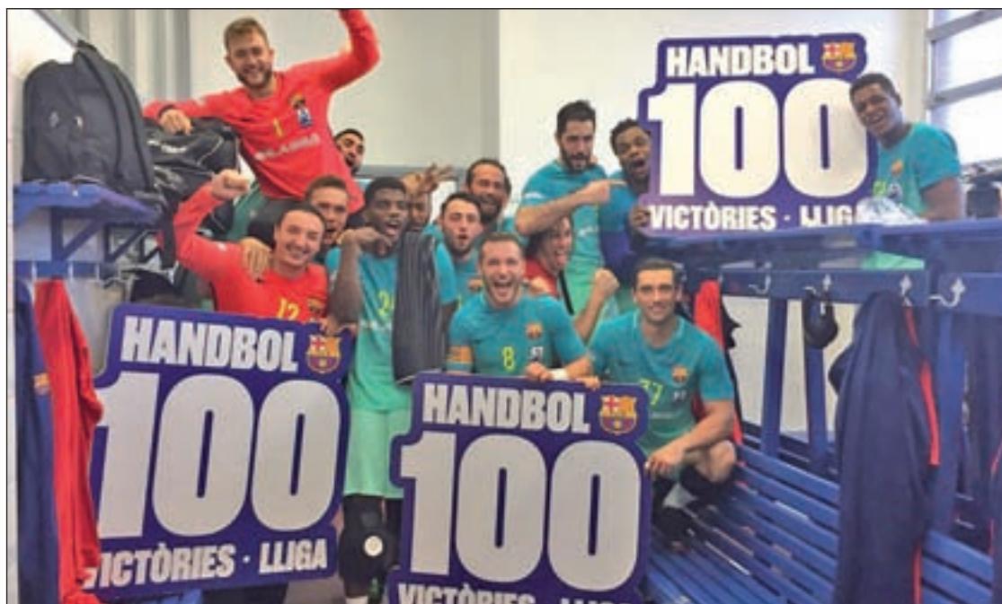
Los jugadores del Barcelona celebraron por todo lo alto este récord

Además, durante la pasada pretemporada, Rubio se vio envuelto en numerosos rumores sobre un posible traspaso. Precisamente, uno de sus hipotéticos destinos sería Sacramento Kings, equipo ante el que se lesionó.