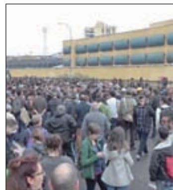
Concentración frente al CIE

Por su parte, desde el Ministerio del Interior recuerdan que el CIE de Aluche cuenta con cámaras de seguridad que grabaron los citados hechos y cuyas imágenes están a disposición de los jueces.