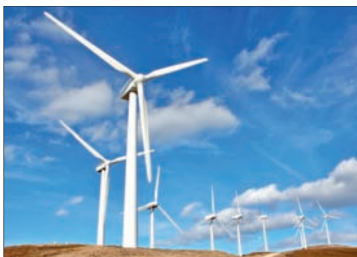
Uno de los parques eólicos españoles

EL CONSUMIDOR MEDIO PAGÓ CINCO EUROS MÁS AL MES