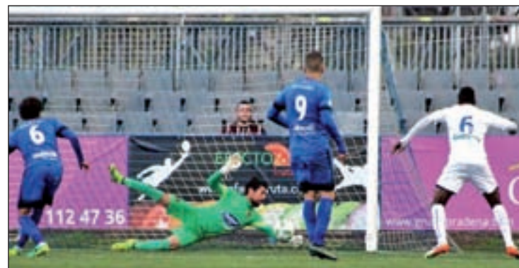
El Rayo perdió el pasado fin de semana en Fuenlabrada

que tenía como objetivo estar más cerca de sus rivales en lo alto de la tabla. El último en la clasificación intentará hacer valer el factor campo y su mejora en las últimas jornada que no le han servido para sumar puntos. La jornada duodécima en Tercera División se completa con el Unión Adarve-Mostoles URJC, el Trial Valderas-Villanueva, Alcobendas-Pozuelo Alarcón, Villaverde-Aravaca y finalizará a las 17:30 horas con el encuentro entre el Rayo B y el DAV Santa Ana.