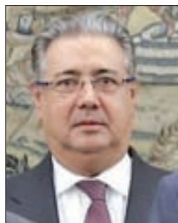
JUAN IGNACIO ZOIDO Interior