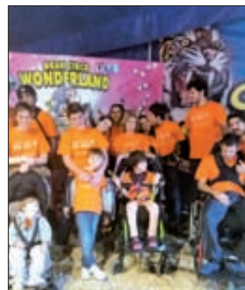
La FSW durante una actividad

En un principio, "la atención sanitaria y educativa es primordial para el buen pronóstico de los enfermos", y también, según la propia Fundación, es vital además "la estimulación sensorial en todos los órdenes de la vida". Una de las principales actividades de