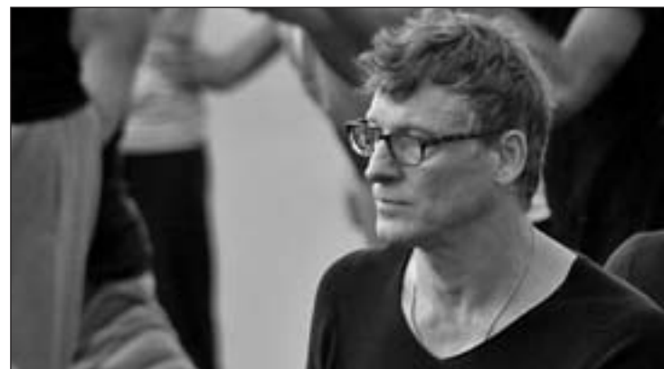
El coreógrafo Nacho Duato

reógrafa Aída Gómez, explica que “las nuevas generaciones no pueden olvidar a Duato”. Ha añadido que además, este año obtuvo el premio de la Comunidad de Madrid y “queríamos que aunque no baile pudiera estar presente con la selección de sus mejores coreografías, las que están por todo el mundo”, finaliza.