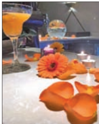
Diwali en Benares Madrid

Con motivo de Diwali, que da protagonismo a la luz para recibir el nuevo año, Benares Madrid nos traslada a la India a través de su iluminación, su decoración cuidada al detalle y su carta de coctelería y platos tradicionales que fu-