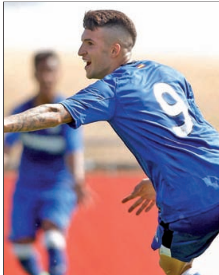
El Getafe B cayó derrotado en su duelo ante el Leganes B

El encuentro más interesante de la jornada lo disputará el RSD Alcalá, tercero, contra el Atlético de Madrid B, que lleva dos partidos sin sumar puntos pero que se encuentra en la cuarta posición. Otro de los duelos en la zona alta de la tabla lo disputará el sábado a las 17:30 horas el Atlético de Pinto que recibirá en casa al Alcobendas Sport para tratar de des congestionar la zona media alta de la clasificación. Una de las señas de identidad de la categoría esta temporada es las pocas dife-