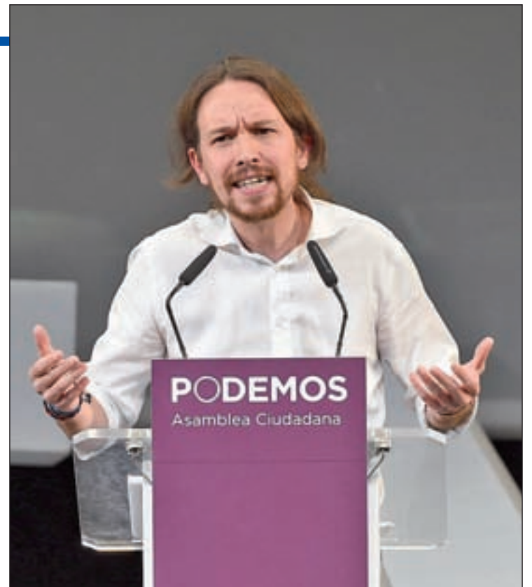
Podemos aventaja al PSOE, según la encuesta de este mes

Una abrumadora mayoría de los españoles, el 88,1%, percibe la situación política como "mala" o "muy mala". El paro se sitúa de nuevo en cabeza de la lista de las preocupaciones, con un 71,3%, seguido de la corrupción y el fraude (37,6%), de los políticos, los partidos y la política (29,5%) y de los problemas económicos (24,2%). A una percepción pesimista de los ciudadanos sobre la vida política se suma también una visión negativa respecto al futuro, ya que el 28% declara que en un año irá a peor y el 58% piensa que en el último año se ha deteriora-