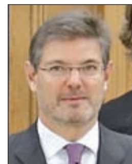
RAFAEL CATALÁ Justicia