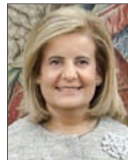
FÁTIMA BÁÑEZ Empleo y Seguridad Social