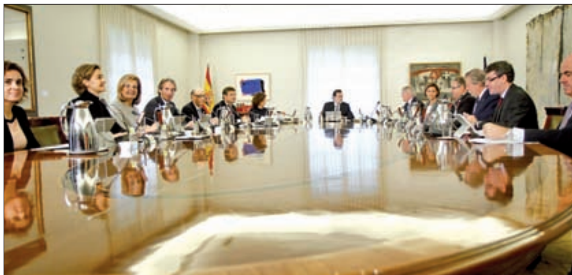
Mariano Rajoy preside el primer Consejo de Ministros de la nueva legislatura

Con este telón de fondo, el nuevo Gobierno echa a andar con una agenda repleta de tareas pendientes, empezando por la indispensable aprobación de los Presupuestos Generales del Estado. En este punto, la postura del PSOE será determinante, ya que, sin su apoyo o abstención, las cuentas