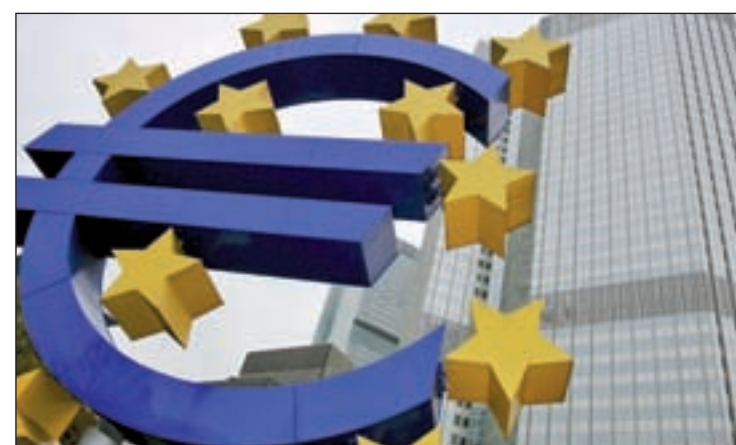
El incremento en 2018 será del 2,1%