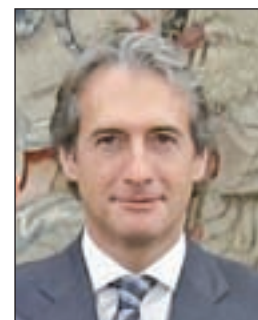
ÍÑIGO DE LA SERNA Fomento