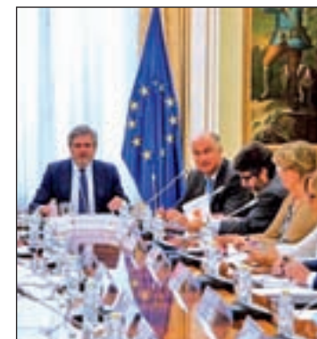
Méndez de Vigo

Además, a las autonomías gobernadas por el PSOE les pareció una "irresponsabilidad" que el Gobierno quiera poner en práctica las reválidas a estas alturas del curso.