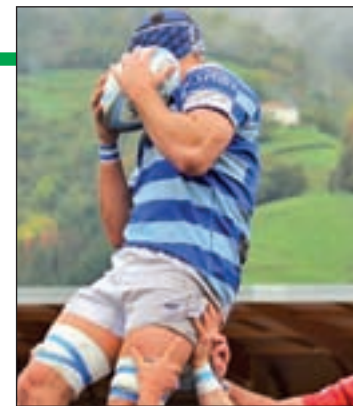
Partido del Cisneros