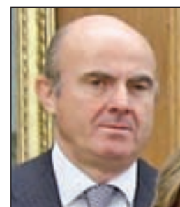
LUIS DE GUINDOS Economía, Industria y Competitividad