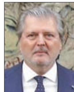
ÍÑIGO MÉNDEZ DE VIGO Educación, Cultura y Deporte. Portavoz del Gobierno