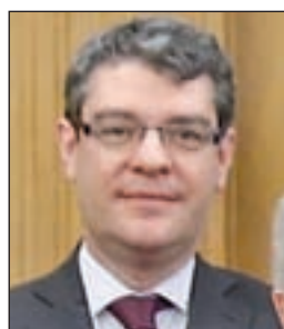
ÁLVARO NADAL Energía, Turismo y Agenda Digital