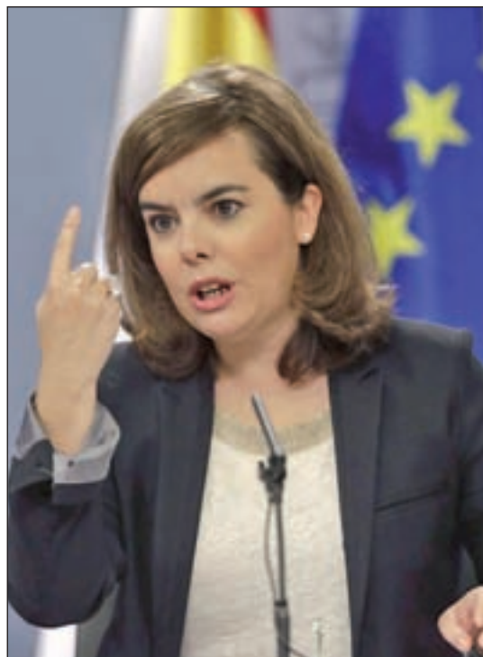
SORAYA SÁENZ DE SANTAMARÍA Vicepresidenta, ministra de la Presidencia y para las Administraciones Territoriales