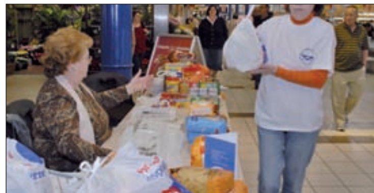
Voluntarios trabajando para el Banco de Alimentos GENTE

cado que necesitan latas de conserva de carne y pescado, aceite, alimentos infantiles, pasta, arroz y legumbres. De esta manera, la organización ha invitado a particulares, familias y grupos a participar en el evento. Los que deseen participar deberán apuntarse en la página web del Banco.