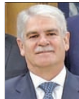
ALFONSO DASTIS Asuntos Exteriores y Cooperación