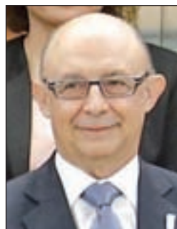
CRISTÓBAL MONTORO Hacienda y Función Pública