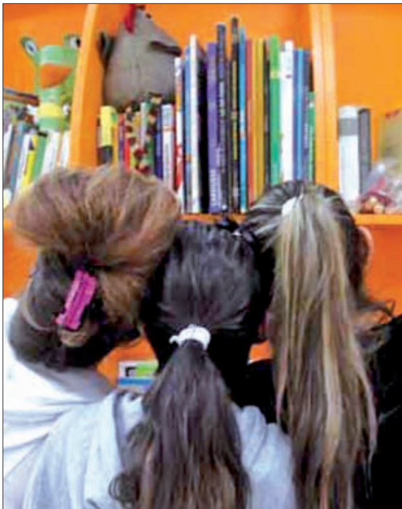
Cartel del Proyecto Amaró

El Proyecto Amaró surgió del Programa contra el Absentismo Escolar que el propio Ayuntamiento desarrolla en la ciudad desde el año 2000. Dependiente del Área de Infancia y Adolescencia, con ellos colaboran los Servicios Sociales, así como el CRIA (Centro de Recursos para la Infancia y la Adolescencia), gestionado por la ONG Save the Children. Juntos se encargan de localizar a los menores e incidir mediante entrevistas con las familias