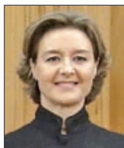
ISABEL GARCÍA TEJERINA Agricultura y Pesca, Alimentación y Medio Ambiente