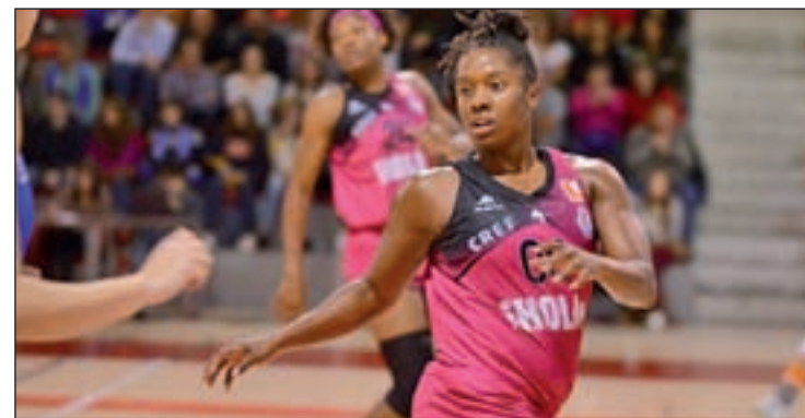
El CREF venció en la última jornada al Embutidos Pajariel (61-67)

A este respecto, hay que destacar el complicado arranque liguero que el club de la capital madrileña ha protagonizado, ya que en las primeras cinco jornadas cayó derrotado hasta en cuatro ocasiones. Una dinámica negativa que cambió en la última jornada y que puede continuar este sábado.