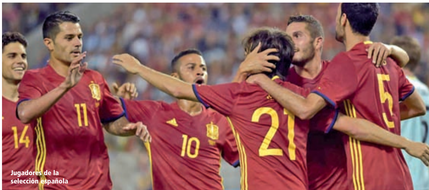
Jugadores de la selección española