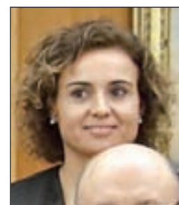
DOLORES MONTSERRAT Sanidad, Servicios Sociales e Igualdad