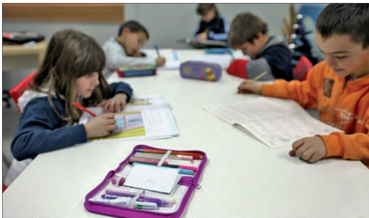
La carga de deberes depende de cada centro y de cada proyecto educativo

Según datos de este colectivo, de cada diez correos y llamadas de padres y madres que han recibido, seis se muestran a favor del ‘movimiento sin deberes’, tres se posicionan hacia la racionalización de las tareas, y una es contraria a todo ello porque apoya la existencia de las labores tal y como están ahora. Las peticiones para que se incrementen los mismos son