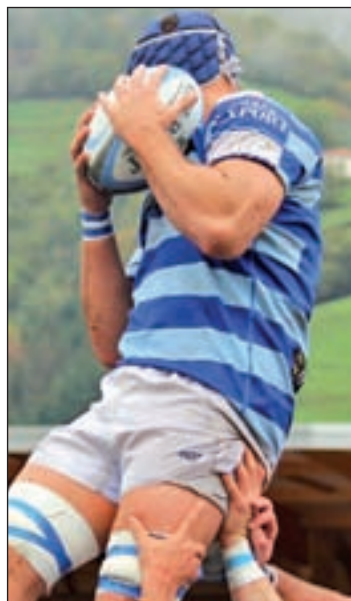
Partido del Cisneros

Duelo de altura en la División de Honor del rugby español. Las Terrazas acogerá este fin de semana un gran derbi entre el Sanitas Alcobendas Rugby y el Complutense Cisneros. Los dos conjuntos de la Madrid lucharán sobre el terreno de juego para ver qué conjunto se impone en la capital. Será este domingo 13 de noviembre a partir de las 12:30 horas. Los de Inchausti son los favoritos en el duelo, no sólo por jugar en casa, ya que, además, actualmente son líderes de la clasificación. Una posición que por el momento no corre peligro tras la derrota de su principal perseguidor, la Santoboiana, la pasada semana. Un re-