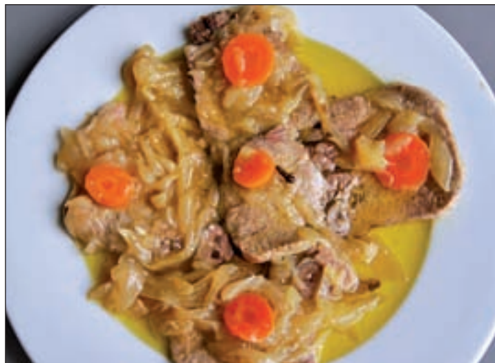
Habr  muchas recetas nuevas