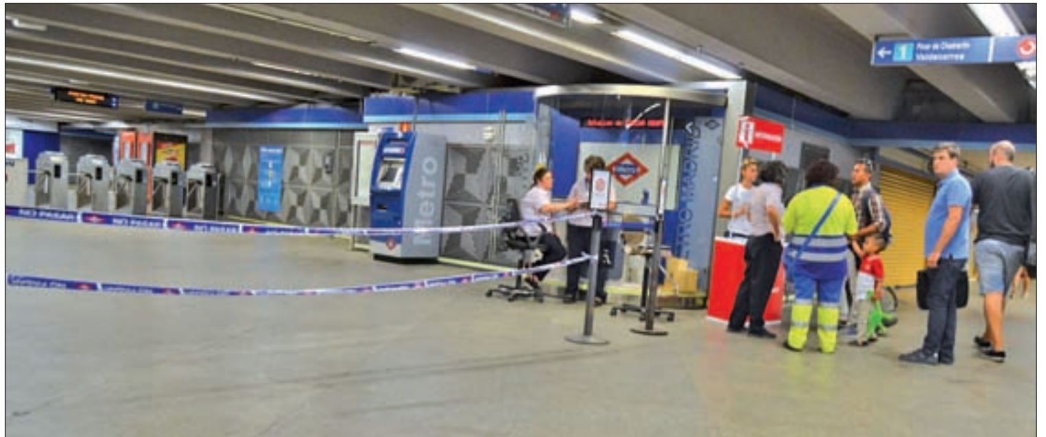
Estación de Atocha Renfe cerrada por las obras

En cuanto a la fecha del congreso del PP de Madrid, Cifuentes señaló que lo primero es el Nacional porque es la nueva Ejecutiva que salga de ese congreso quien convocará los congresos regionales, y tras ellos, los provinciales. Lo que la presidenta regional hará será pedir que el madrileño se celebre lo antes posible porque "es bueno que más allá de una gestora haya una ejecutiva elegida directamente por los militantes".