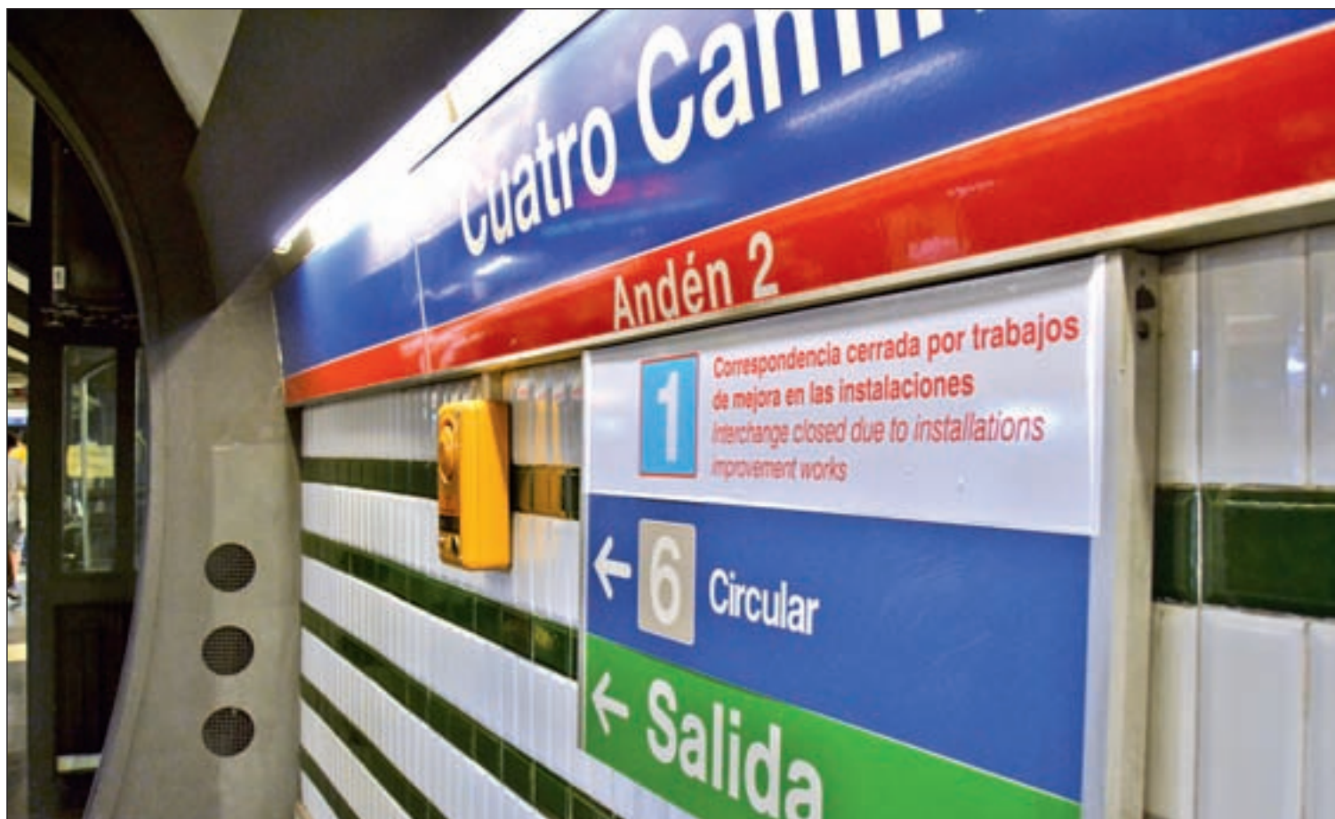
La Línea 1 ha estado cerrada cuatro meses