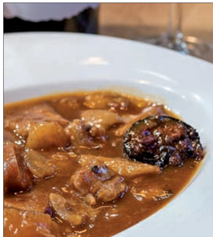
Los callos son uno de los platos estrella de la casquer a

En Chamart n, Ferreiro Restaurante tendr  en su carta un guiso de callos y morro al estilo