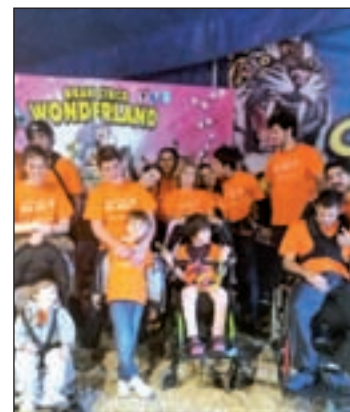
La FSW durante una actividad

En un principio, "la atención sanitaria y educativa es primordial para el buen pronóstico de los enfermos", y también, según la propia Fundación, es vital además "la estimulación sensorial en todos los órdenes de la vida". Una de las principales actividades de