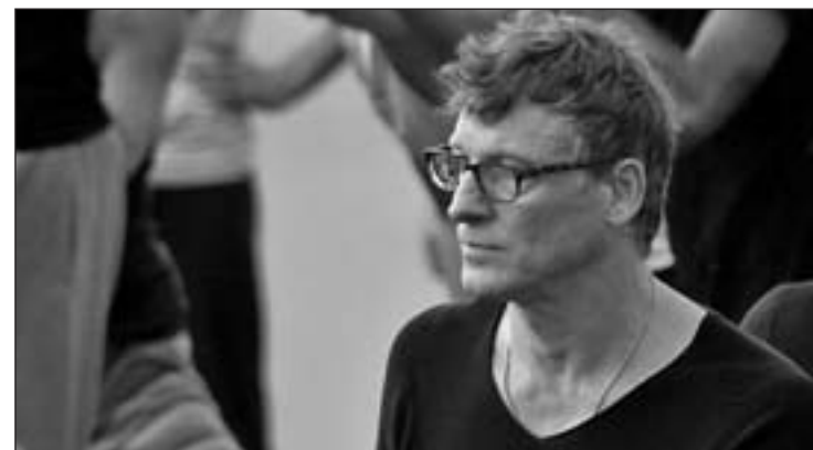
El coreógrafo Nacho Duato

reógrafa Aída Gómez, explica que “las nuevas generaciones no pueden olvidar a Duato”. Ha añadido que además, este año obtuvo el premio de la Comunidad de Madrid y “queríamos que aunque no baile pudiera estar presente con la selección de sus mejores coreografías, las que están por todo el mundo”, finaliza.