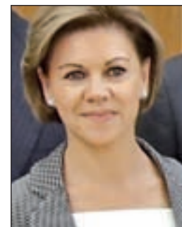
DOLORES DE COSPEDAL Defensa