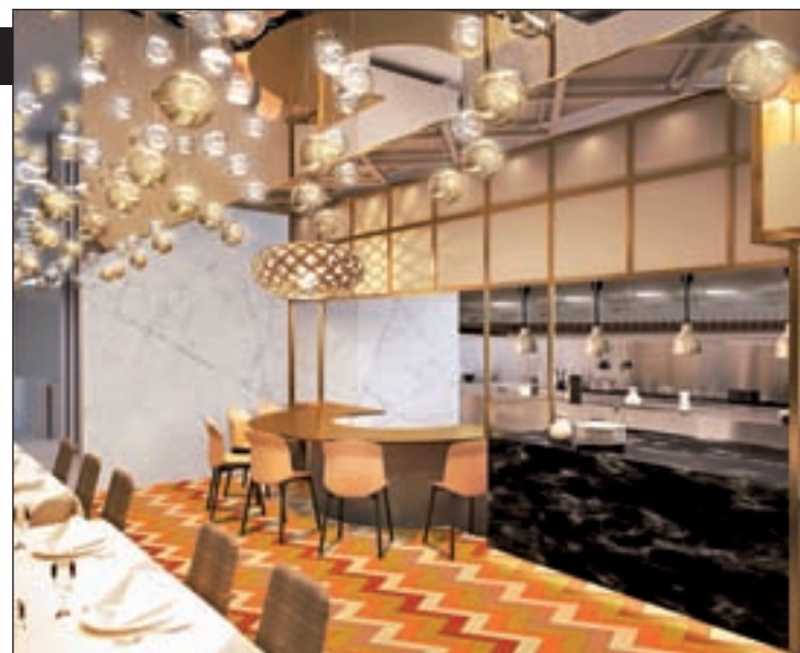
LA FIESTA DE LA LUZ es el a o nuevo indio. Gana el bien sobre el mal en esta festividad del fuego y de las flores, la uni3n de la familia y la suerte para el resto del a o. El componente gastron3mico dulce es esencial.

Toda la informaci3n en la web Benaresmadrid.es .