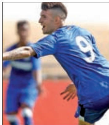
El Getafe B sigue como líder