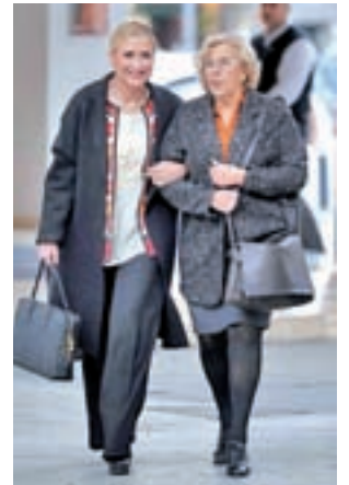
Cifuentes y Carmena

Uno de los aspectos en los que se mostraron de acuerdo fue en el de colaborar de manera conjunta de cara a la estrategia para atraer empresas asentadas en el Reino Unido tras el Brexit. "Hay una necesidad absoluta de actuar conjuntamente para defender los intereses de Madrid y los madrileños. Uniendo fuerzas vamos a conseguir tener