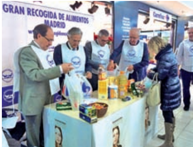
Recogida del año pasado

El objetivo de esta Campaña 2016, cuyo lema es 'Pequeños gestos que dan vida', es mantener o incluso superar los 22 millones de kilos de alimentos no perecederos obtenidos en la pasada edi-