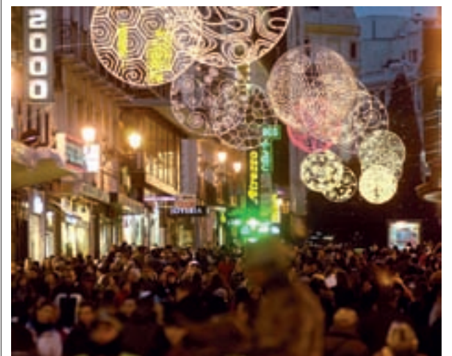
Calle del centro de Madrid en Navidad