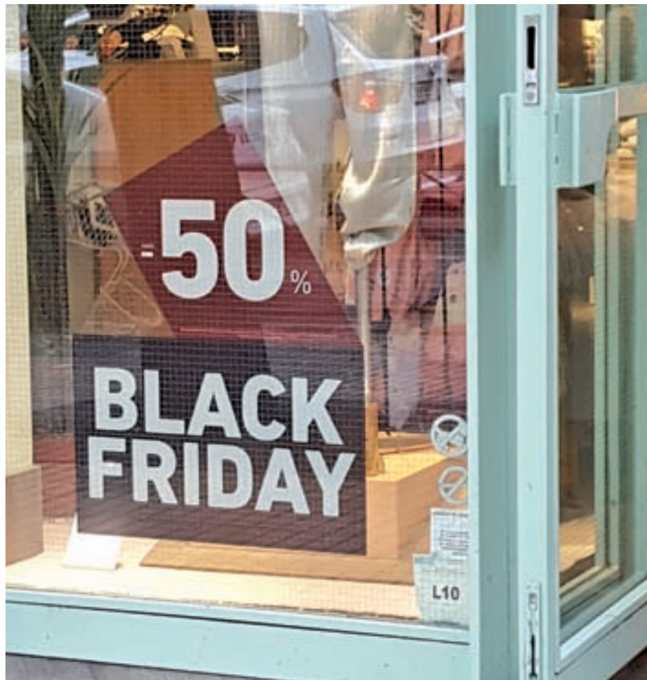
Los descuentos pueden ser del 50, 60 y hasta el 70%

viembre, aterrizó en España hace unos años dispuesta a quedarse, y así ha sido, consiguiendo cada año más adeptos tanto entre los clientes como entre los establecimientos que abren con este 'Viernes negro' la temporada de navideña con rebajas y ofertas que pueden llegar hasta el 60 y el 70%. En esto, sin duda alguna, mucho ha tenido que ver las facilidades que han dado las redes sociales y la gran apuesta que han hecho por esta campaña prenavideña los