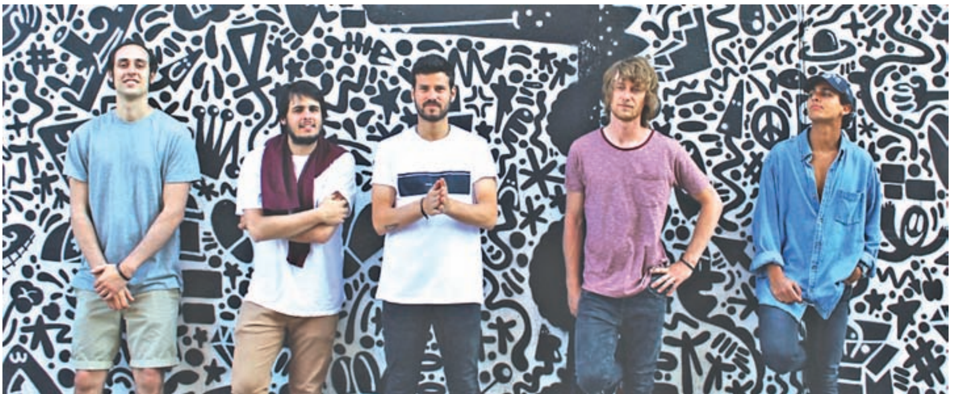
Guillermo Bárcenas y su grupo, Taburete