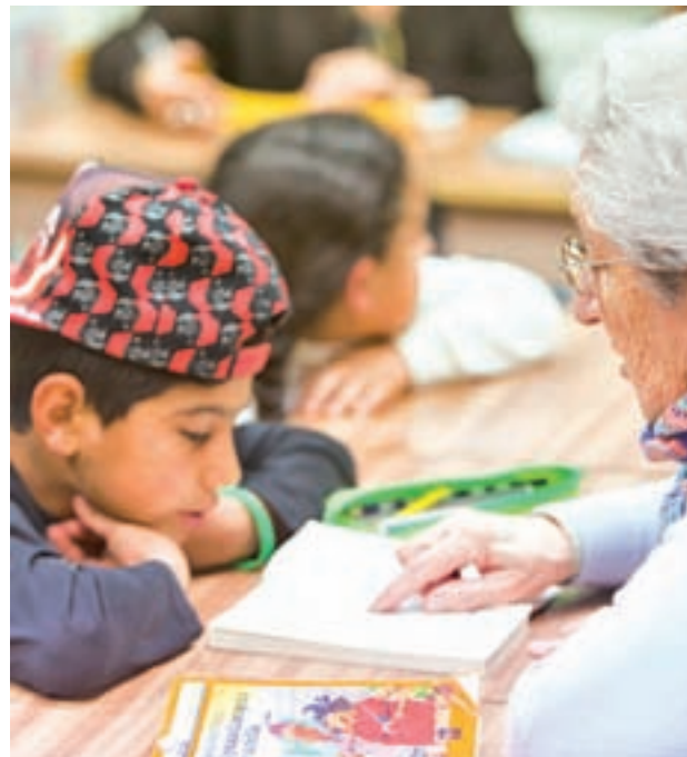
Una de las iniciativas que se llevan a cabo en la Cañada Real

El segundo programa, llamado Incorpora, trata de ayudar a encontrar un empleo a colectivos con especiales difi-