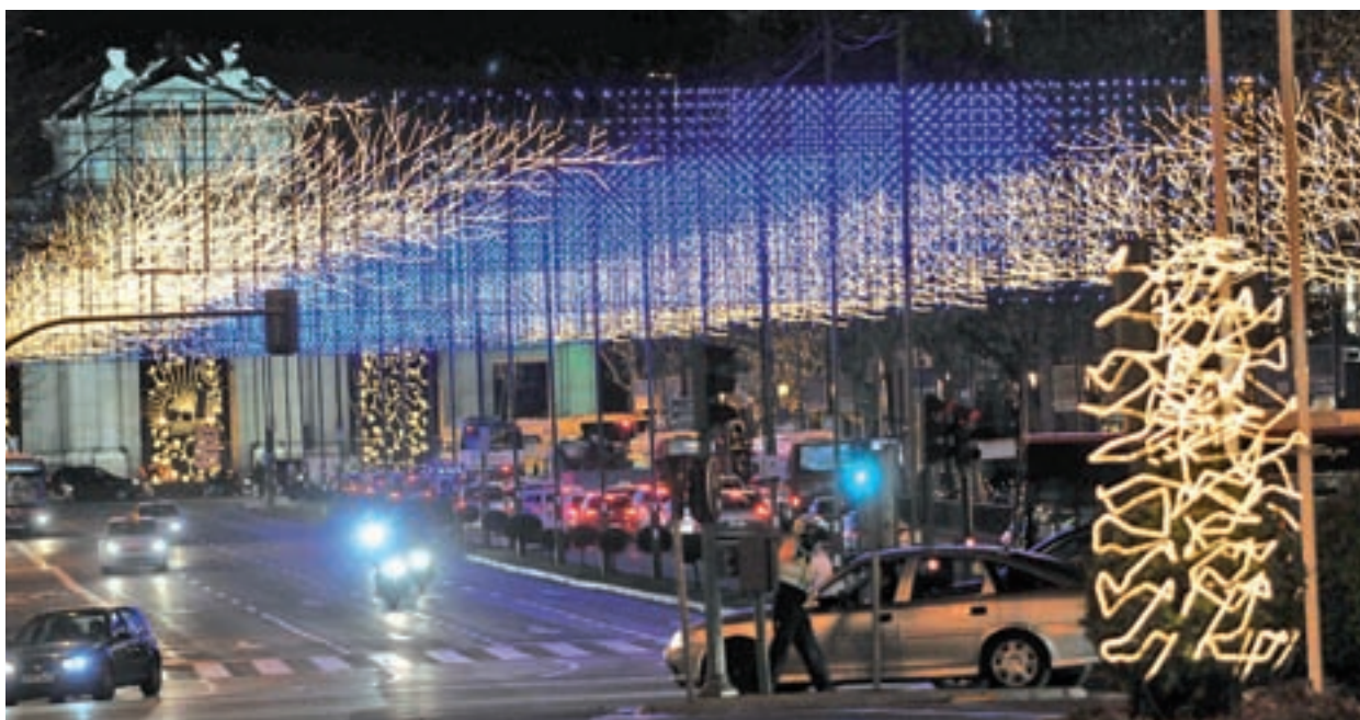
Alumbrado de la calle Alcalá AYUNTAMIENTO DE MADRID