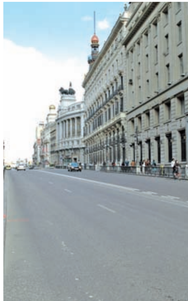
Tramo de la calle Alcalá

principales se traducirá en la redacción de algunos de estos proyectos en 2017. Igualmente se ampliará la red ciclista y se revisarán los criterios del