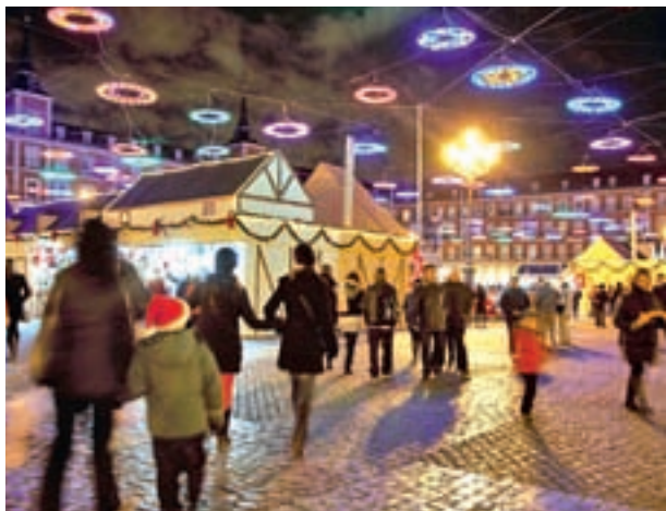
Las casetas de la Plaza Mayor se renuevan: El Mercado de Navidad de la Plaza Mayor abre el sábado 26 con la renovación de sus 104 casetas. Belenes, artículos navideños, de broma y animación volverán a ser el reclamo.

Madrileños y visitantes podrán disfrutar además, desde el 1 de diciembre al 6 de enero, del Bus de la Navidad 'Naviluz'. El horario será todos los días de 18 a 22 horas, coincidiendo con el funcionamiento del alumbrado navideño, y tendrá una única parada de subida y bajada de viajeros en la Plaza de Colón.