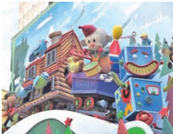
Cortylandia, fiel a su cita: La Navidad de Madrid no sería lo mismo sin Cortylandia, que este año estrena su espectáculo 'Cosser y Cantar' con proyecciones audiovisuales que acompañan a unos simpáticos ratoncitos.