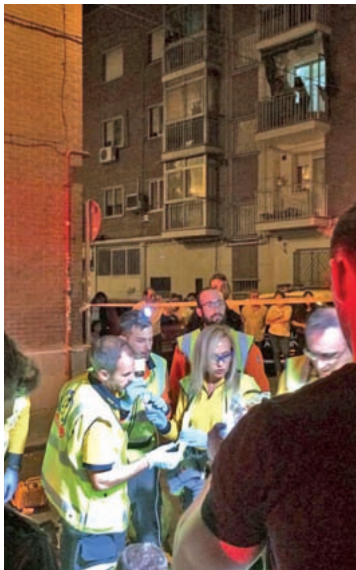
Los servicios médicos atienden a un herido por arma blanca