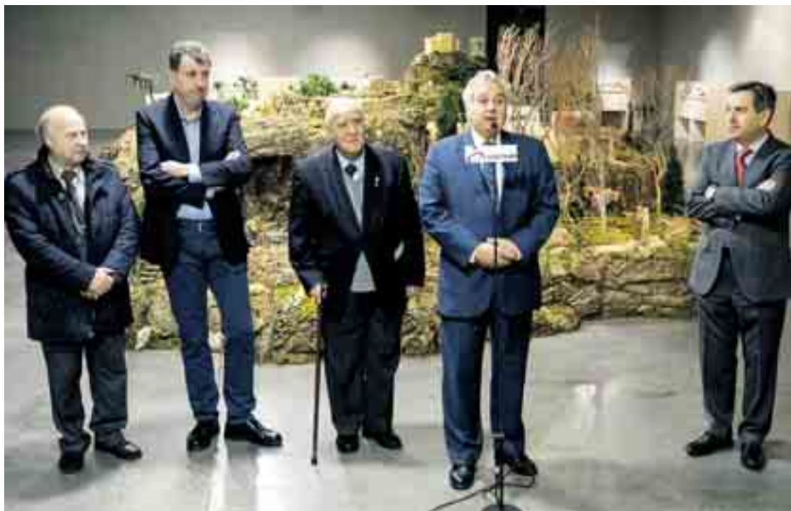
La obra del artista burgalés Francisco Guerrero está compuesta por más de 200 piezas, entre figuras y animales.

Puede visitarse en la Sala de Exposiciones Círculo Central (Plaza de España, 3) hasta el 8 de enero. El horario es de 12.00 h. a 14.00 h. y de 18.00 h. a 21.00 h., mientras que el 24 y 31 de diciembre y el 5 de enero solo abrirá por la mañana y el 25 de diciembre y