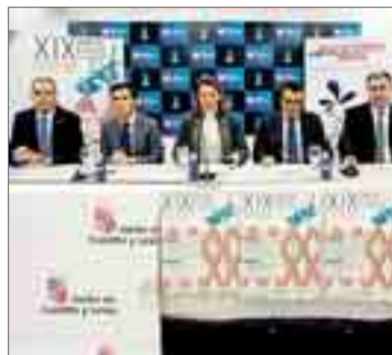
Acto de presentación de la XIX Copa del Mundo sub 20 de espada femenina.

Las eliminatorias individuales, que contarán este año con un total de 151 participantes de 24 países de todo el mundo, se disputarán el sábado 17 en el polideportivo El Plantío. Las semifinales y la final, como principal novedad en esta edición, serán en el Fórum Evolución a partir de las 19.00 horas. El domingo 18 se disputará la 3ª Copa del Mundo 'Ciudad de Burgos' por equipos, donde 17 de