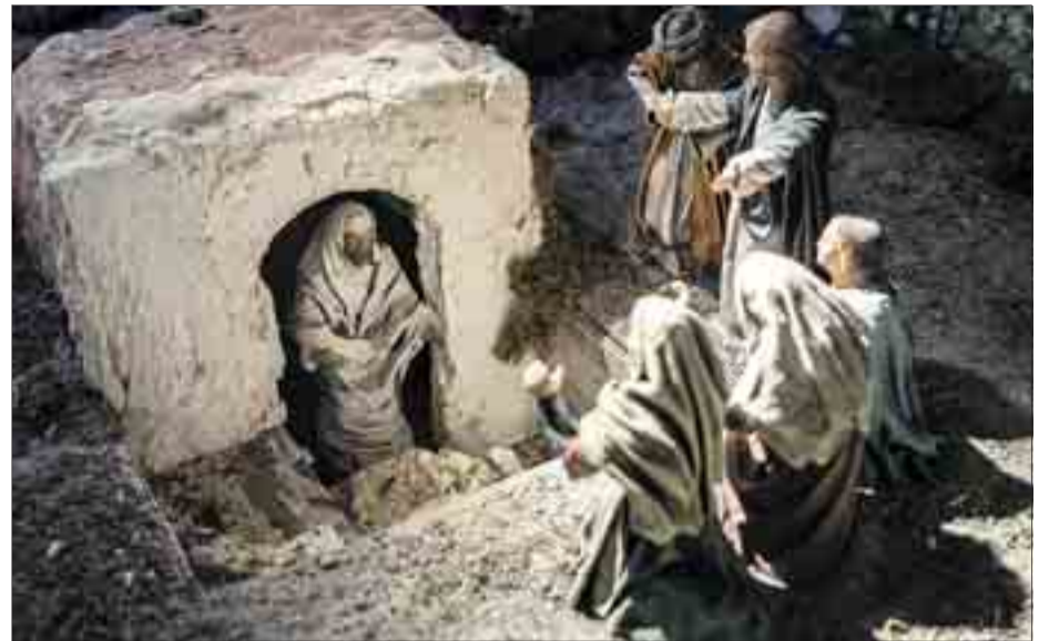
De las más de 1.700 figuras que componen la obra, 50 están dotadas de movimiento.