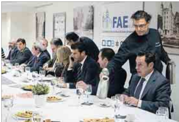
FAE presentó sus objetivos para 2017 e hizo balance del presente año el jueves 15.

La agenda de 2017 también estará marcada por la "reclamación de las infraestructuras de comunicación, industriales y tecnológi-