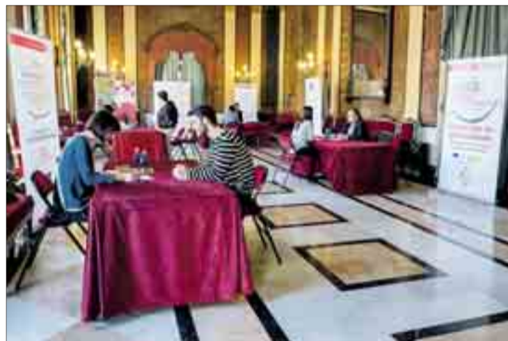
Cruz Roja contacta empresas de selección de personal con demandantes de empleo para entrevistas simuladas de trabajo, como las realizadas el día 13 en el Salón Rojo del Teatro Principal.

las empresas -25 en estos cinco cursos- "su apoyo en la realización de las prácticas".