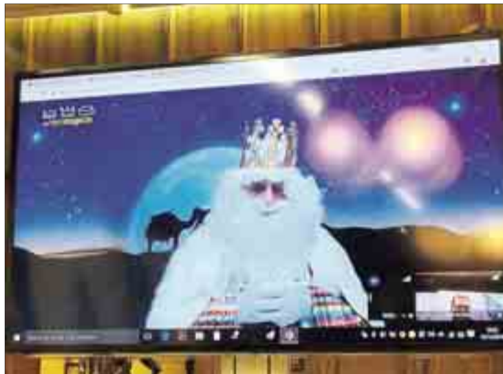
La presentación de la iniciativa navideña se llevó a cabo el martes 13.

El nacimiento de la idea vino de la mano de la Asociación Cultural LP, cuyo ámbito de actuación es internet, tal como señaló su presi-