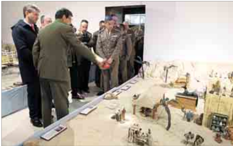
Las 105 escenas que componen el Nacimiento fueron visitadas por las autoridades.