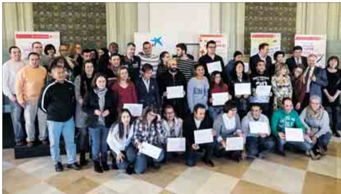
La entrega de diplomas a los alumnos de los cursos de capacitación de Cruz Roja se desarrolló en la Sala Polifónica del Teatro Principal.