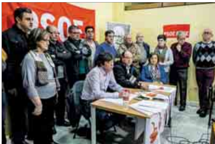
La presentación oficial de la plataforma se llevó a cabo el jueves 15.

Asimismo, quiso destacar que en la provincia de Burgos "no hay apenas discrepancia" respecto a la necesidad de convocar Primarias y Congreso. "El Comité Provin-