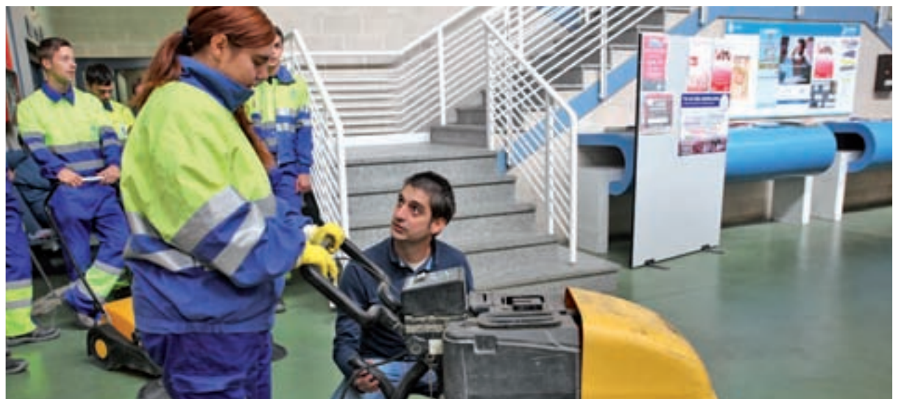
Jóvenes en uno de los cursos de Garantía Juvenil GENTE