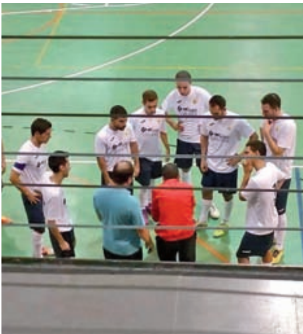
El Fuenlabrada A94, durante la pasada temporada

En su último encuentro cayó por 5-4 ante el FS El Álamo. Este sábado se mide al Futsal Pinto, que también necesita victorias para superar la décima posición.