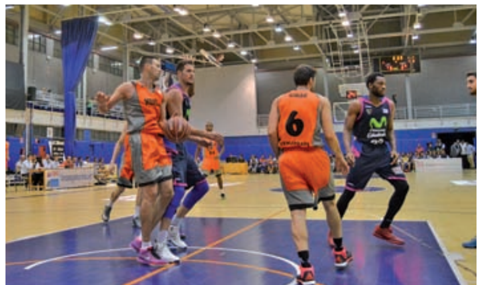
El Montakit, la pasada temporada

Este fin de semana se reanudan las diferentes competiciones deportivas de la ciudad. El sábado 14 de enero vuelven a las pistas los equipos de tenis y de juegos deportivos municipales.