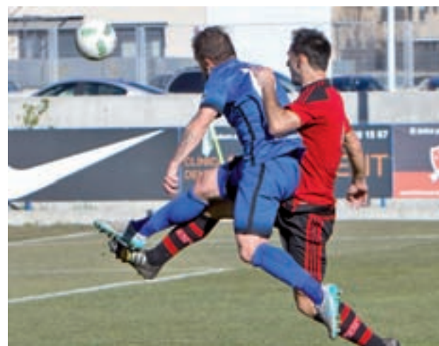
El Fuenlabrada, ante el Arenas de Getxo

Los objetivos que la directiva se marcó a principios de temporada y que comenzaron con la llegada de Josip Visnjic al banquillo, están más cerca. Sin embargo, la solución no pareció ser esa y el serbio abandonó el cargo de