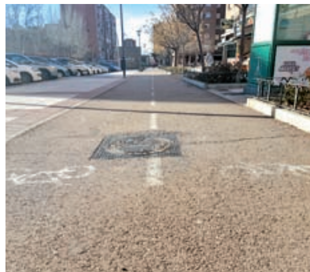
Carril bici de la calle Grecia

Por otro lado, en 2017 se comenzará a trabajar en la ampliación del carril bici de la ciudad. Según señaló Ayala, este proyecto es una