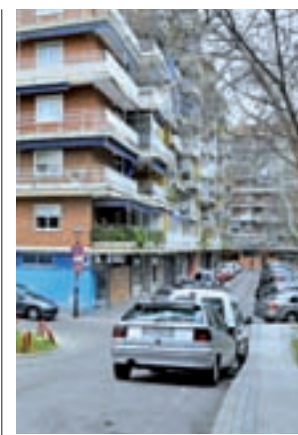
Calle afectada en Móstoles

Se trata de una zona de más de 250.000 metros cuadrados. “Hace ocho meses recibimos la aproba-