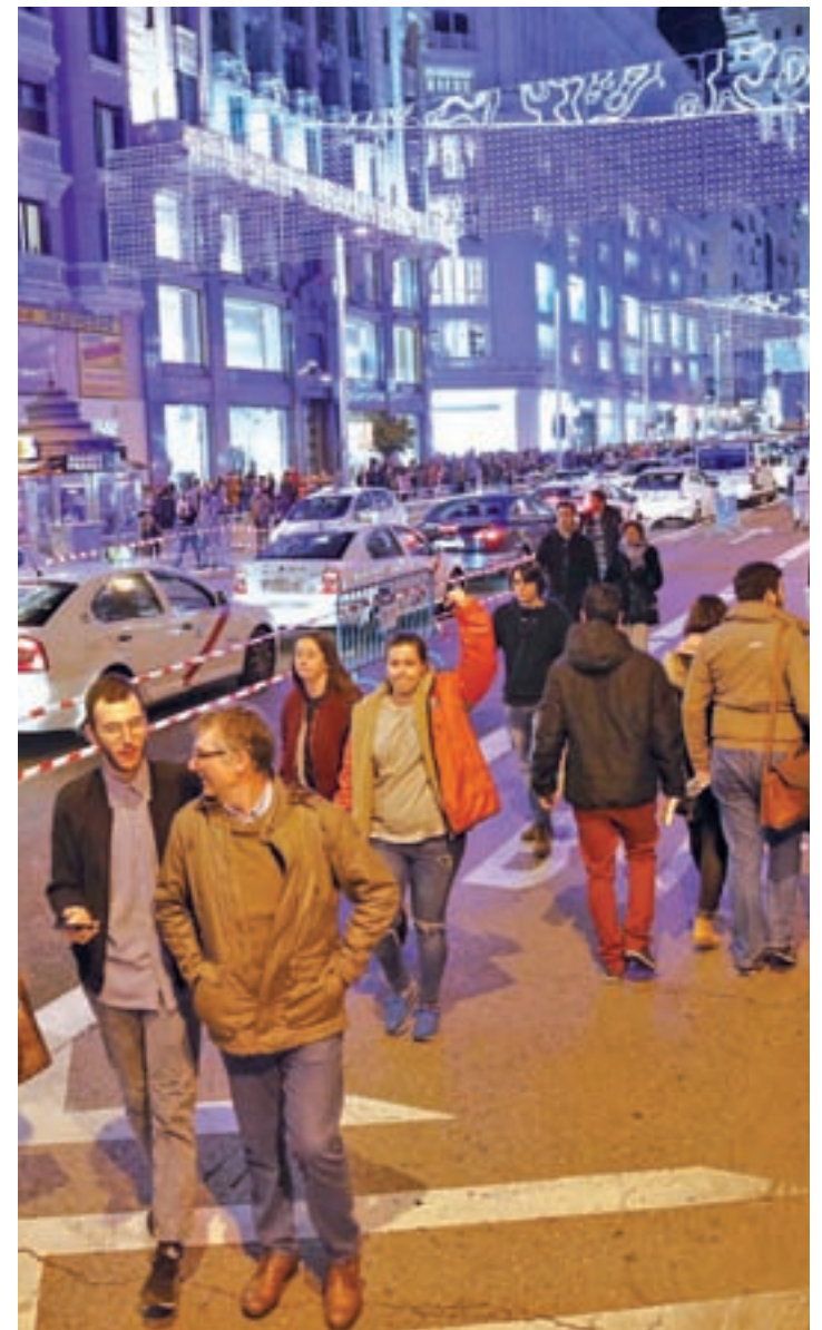
La Gran Vía estuvo cerrada al tráfico privado en Navidad

El debate del papel de la Gran Vía en la movilidad de Madrid se intensificó estas navidades tras su cierre al tráfico, que el Ayuntamiento valoró como "muy positivo", al haberse constatado una disminución de los coches del 43% en esta calle, del 20% en la