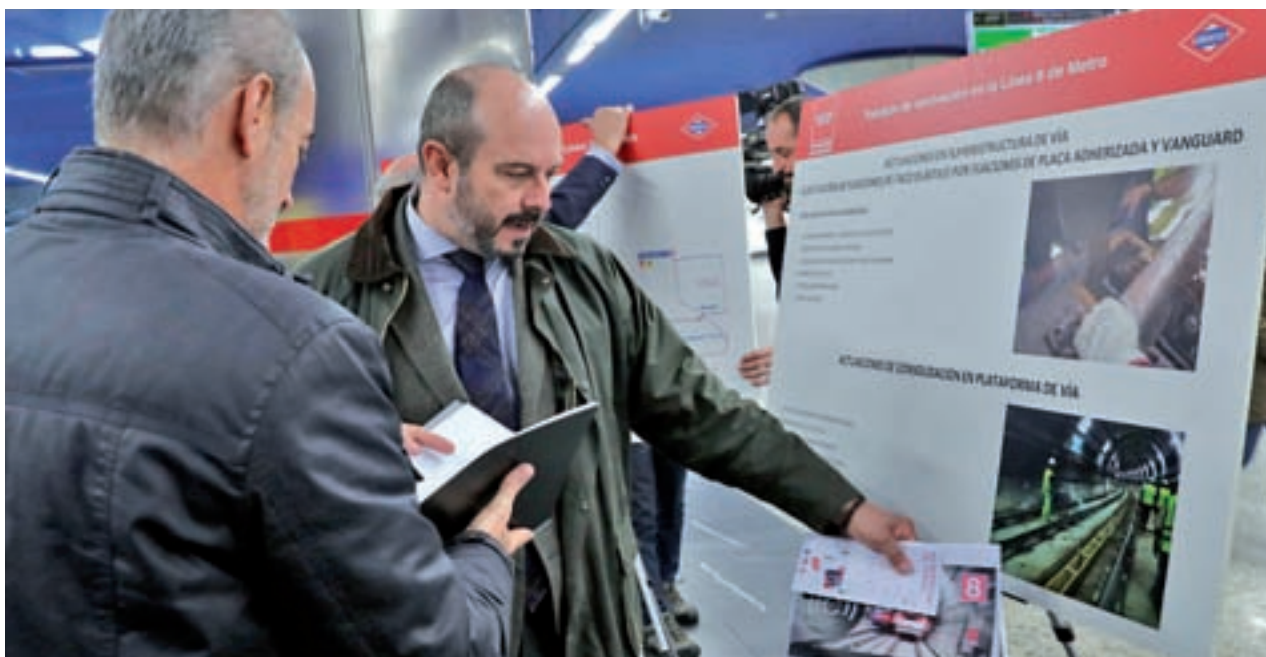
Rollán presentó las obras en la estación de Nuevos Ministerios