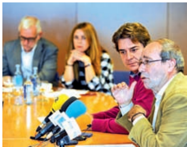
Acceso al nuevo cementerio: Las obras en las inmediaciones de La Aldehuela suponen una demanda histórica del Ayuntamiento, que prevé finalizar la rotonda de acceso en los primeros meses de 2017 y llevar una lanzadera antes de que finalice el año.

Para este cometido, el Consistorio destinó un total de 500.000 euros. Por el momento ha finalizado la adaptación de la primera planta, así como el patio y los aparcamientos de la zona. La segunda fase incluirá la remodelación del segundo piso del edificio en el que se acogerá a diferentes asociaciones, según