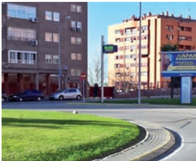
Medidor de ozono en Fuenlabrada

Como medidas complementarias, la localidad establece también recomendaciones sobre la maquinaria pesada, un “planteamiento razonable, pero de difícil implantación”, según Ayala. Y es que el Plan regional sopesa la posibilidad de limitar las obras que generen contaminación. Además, el Ayuntamiento se encuentra en proceso de adquisición de “vehículos híbridos”.