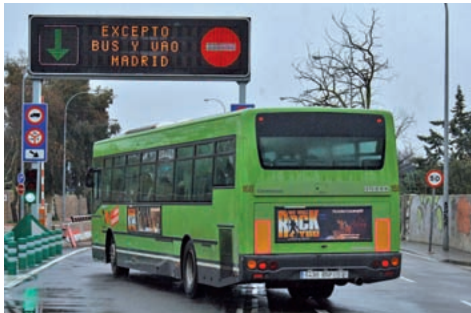
Carril Bus-VAO en la autovía A-6

Los planes de la Comunidad no contemplan la posibilidad de realizar una gran inversión. "Somos conscientes de que las condiciones económicas no permiten toda-