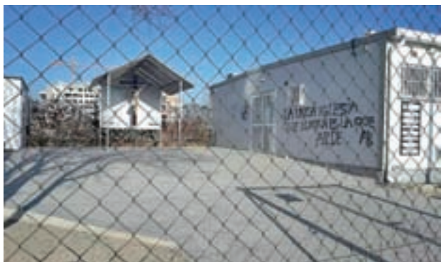
El templo, tras la agresión de la semana pasada

gestión municipal en los distritos" y que sean ellos los que puedan "reparar los baches, limpiar las calles y mantener los parques y jardines". Y puso en relieve que la planta de Valdemingómez cuenta con una inversión de 28 millones de euros este año para corregir los procedimientos productivos que tiene en el actualidad y que provocan malos olores.