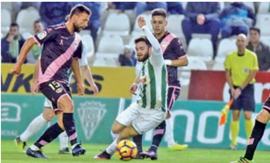
El Rayo arañó un punto en su visita al campo del Córdoba