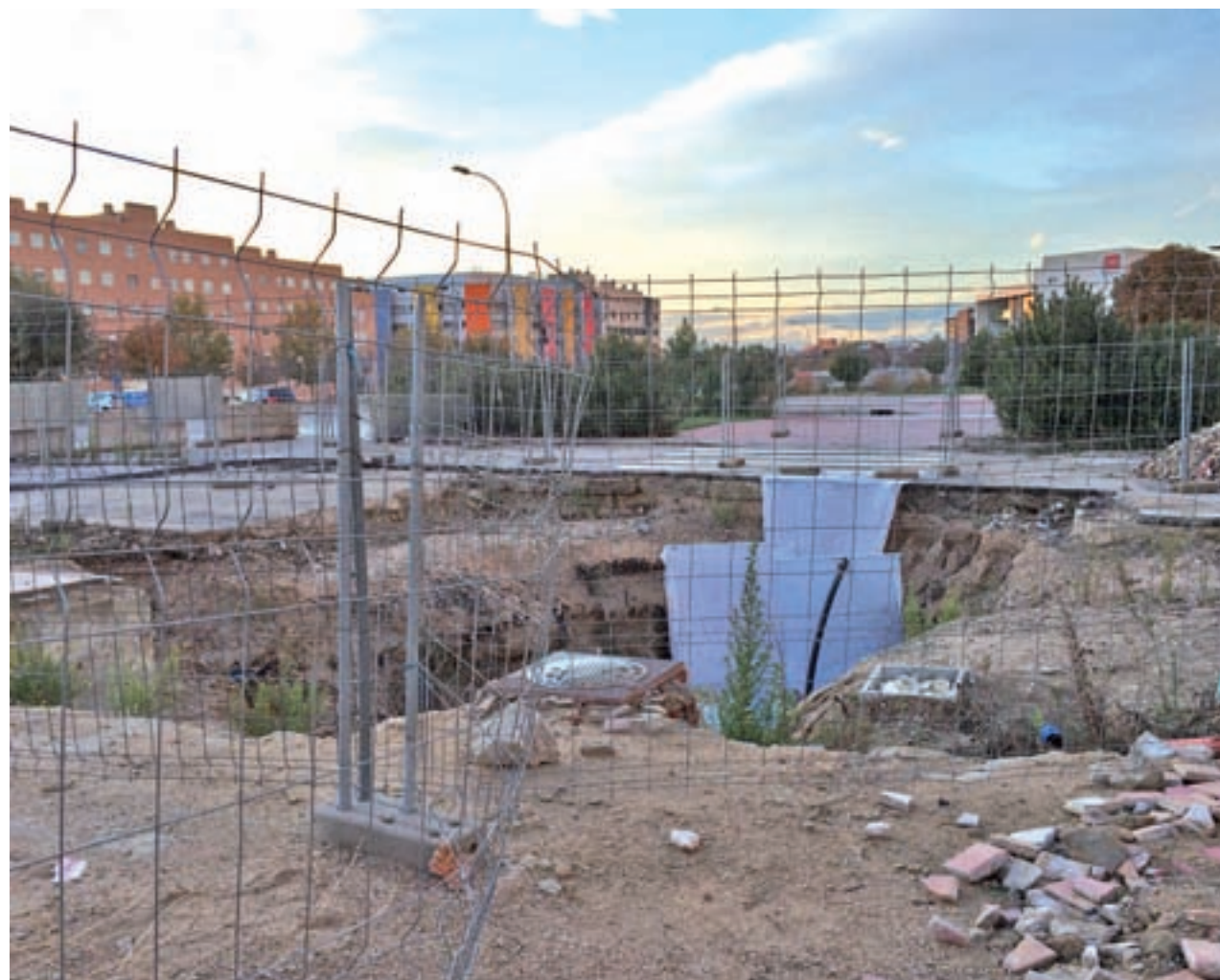
LUCA JIMÉNEZ/ GENTE