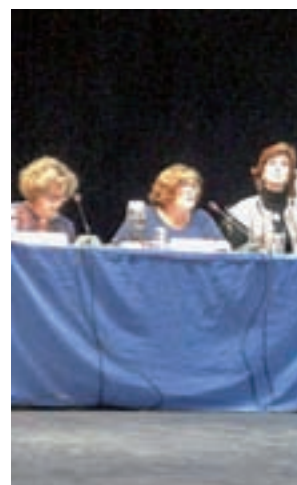
Un momento del Pleno

Entre los puntos negros, C's mencionó los cruces de Arturo Soria con José del Hierro, Juan Pérez Zúñiga, López de Hoyos, Caleruega, el entorno del centro comercial y los alrededores de la Jefatura Provincial de Tráfico.