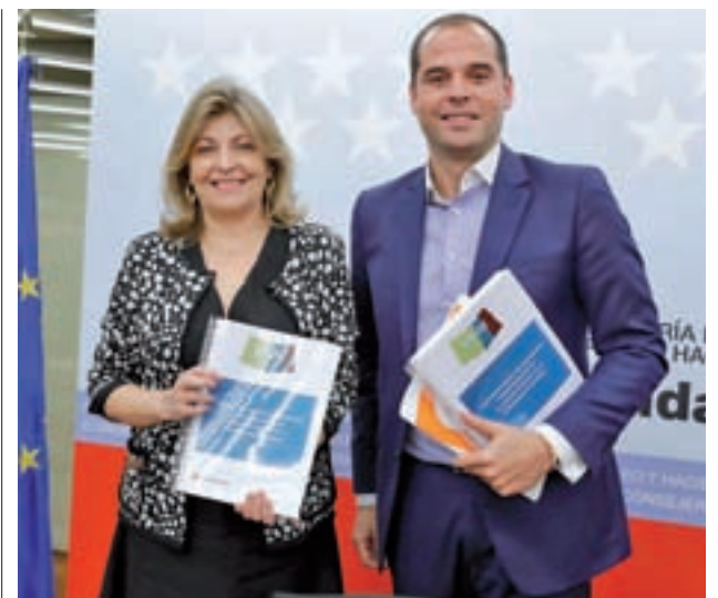
Engracia Hidalgo e Ignacio Aguado

El segundo contiene 111 iniciativas para mejorar y modernizar las políticas regionales, especialmente aquellas relacionadas con los servicios esenciales prestados a los madrileños como son la Educación, Sanidad o los Servicios Sociales. El tercero y último contempla 23 propuestas para garantizar la estabilidad presupuestaria y la sostenibilidad financiera de los servicios sociales.