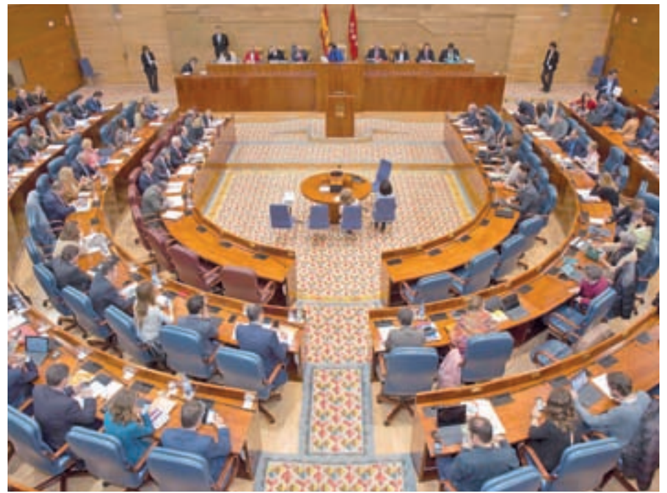
Los cambios orgánicos podrían llegar a la Asamblea

El proyecto para reorganizar la zona Norte de la capital depende del acuerdo al que pretenden llegar en los próximos meses todas las partes implicadas: el Ministerio de Fo-