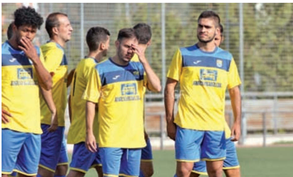
El Santa Ana se asienta en la zona media de la clasificación AD ALCOBENDAS