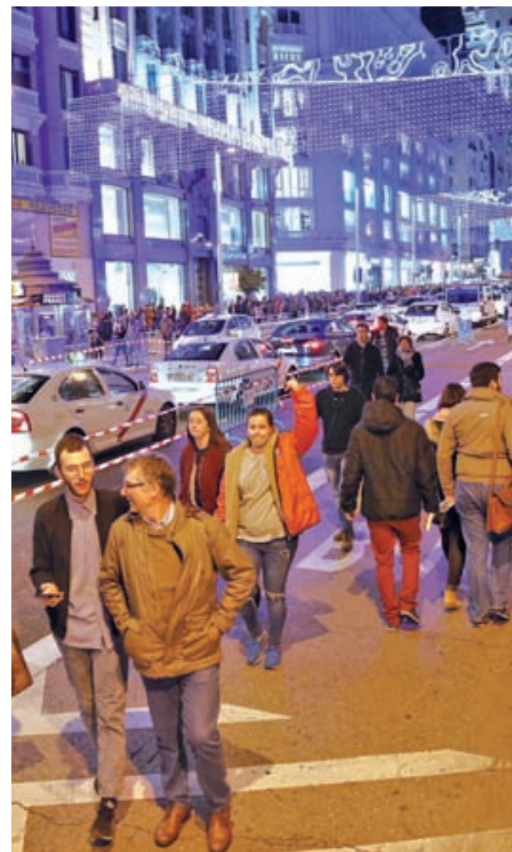
La Gran Vía estuvo cerrada al tráfico privado en Navidad

El debate del papel de la Gran Vía en la movilidad de Madrid se intensificó estas navidades tras su cierre al tráfico, que el Ayuntamiento valoró como "muy positivo", al haberse constatado una disminución de los coches del 43% en esta calle, del 20% en la