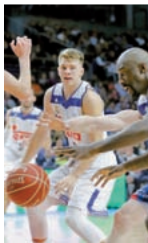
El Madrid sigue primero

campeonato dará por finalizada la primera vuelta de la fase regular o, lo que es lo mismo, se conocerá qué ocho equipos disputarán la Copa