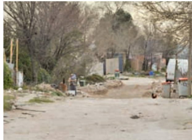
Cañada Real Galiana C. M. / GENTE

mento, la Comunidad de Madrid, el Ayuntamiento de la capital y los promotores privados. Las negociaciones se prevén tensas y complicadas.