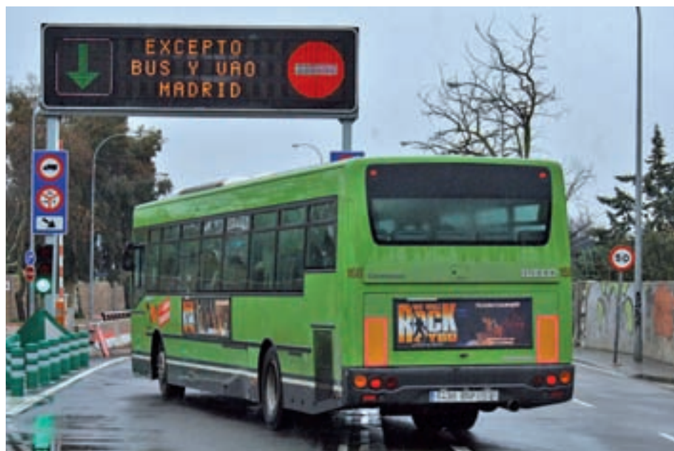
Carril Bus-VAO en la autovía A-6

Los planes de la Comunidad no contemplan la posibilidad de realizar una gran inversión. "Somos conscientes de que las condiciones económicas no permiten toda-