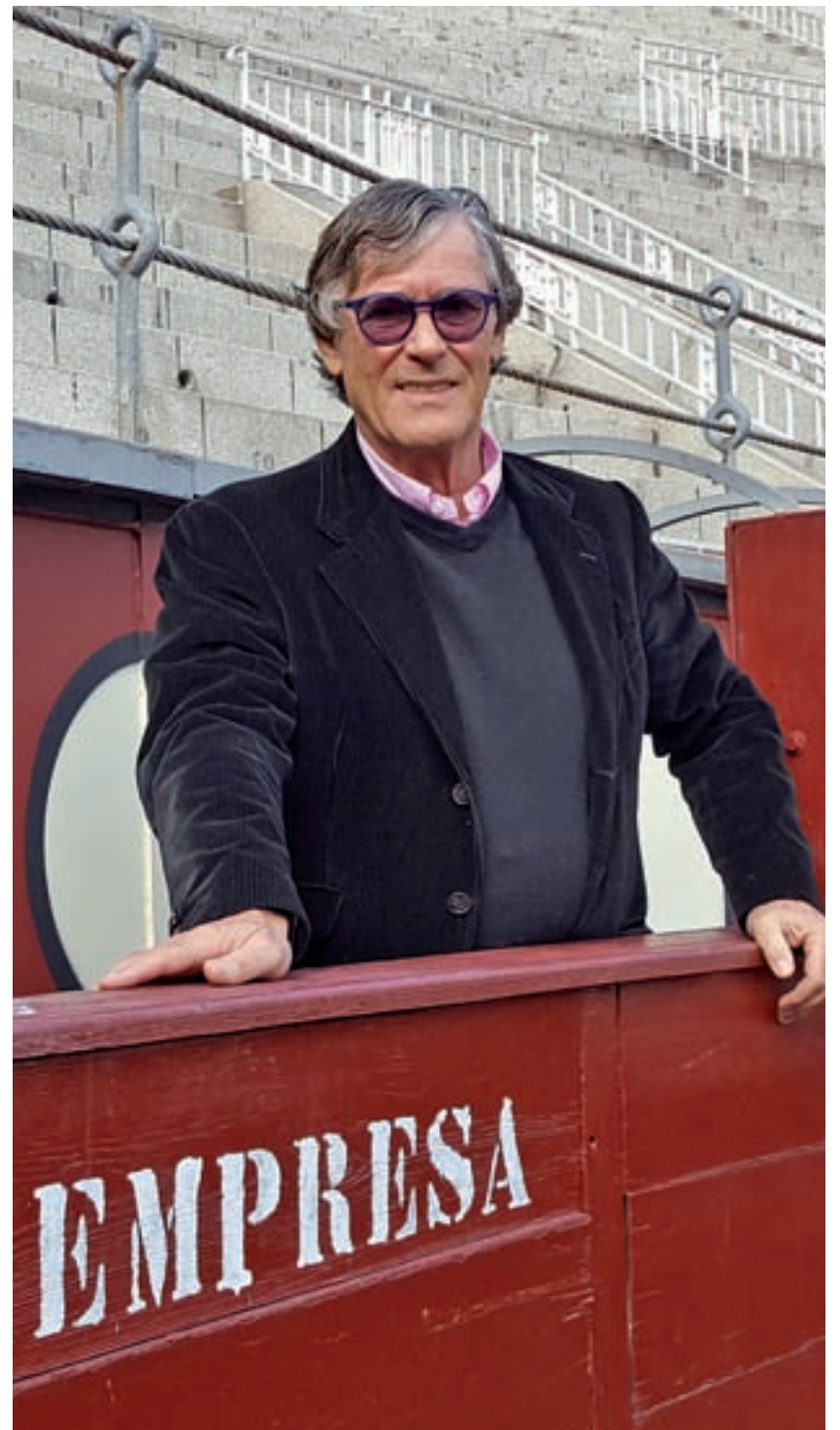
A.E. / GENTE

No me preocupan, porque se equivocan ellos, pero hay que tomarlos en cuenta. Acepto el intercambio de opinión, y cuando de verdad se analiza la tauromaquia como arte y cultura, le cuesta trabajo a un antitaurino atacarla.