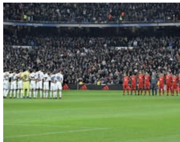
Tercer Sevilla-Real Madrid en los últimos diez días

drileño-sevillano tendrá otro capítulo en el Vicente Calderón este sábado 14 (18:30 horas), con motivo de la visita que realizará el Real Betis al Atlético de Madrid.