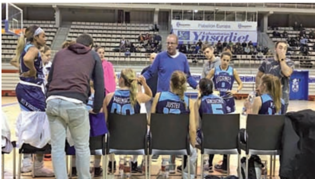
El Laboratorios Ynsadiet Leganés y el Atlético de Madrid, líderes en sus respectivas categorías