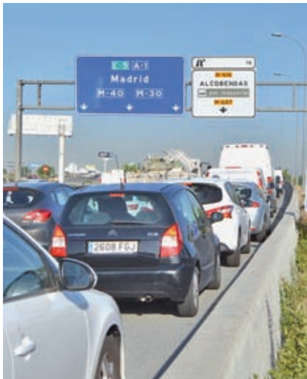
Atascos en la autovía A-1

La gran obra en materia de movilidad a la que se enfrentará la región en esta legislatura debería empezar a consolidarse en este año. Para primavera está prevista la licitación del proyecto, momento en el que se conocerá el trayecto elegido por el Ministerio de Fomento para la vía que debe descargar de tráfico y paliar los interminables