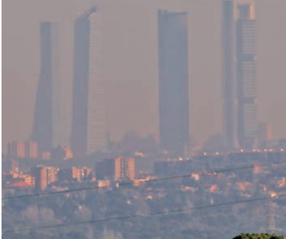
Madrid ha vuelto a superar los límites legales de contaminación

El Gobierno municipal tiene que enfrentarse este año a los retos que quedaron pendientes en 2016 ● En la agenda política no faltarán la contaminación, la memoria histórica o la aprobación de los presupuestos