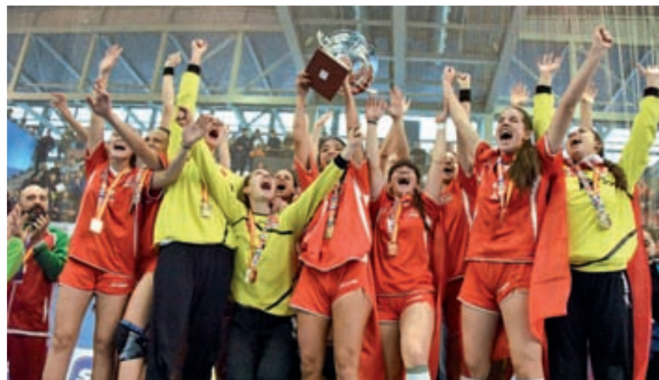
El Juvenil Femenino se proclamó campeón

a comienzos de enero en Cataluña. En total han sido cuatro las selecciones madrileñas que han subido al podio, lo que, en palabras del nuevo presidente regional, José Javier Hombrados, supone “unos resultados