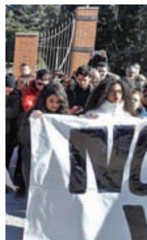
La protesta ciudadana