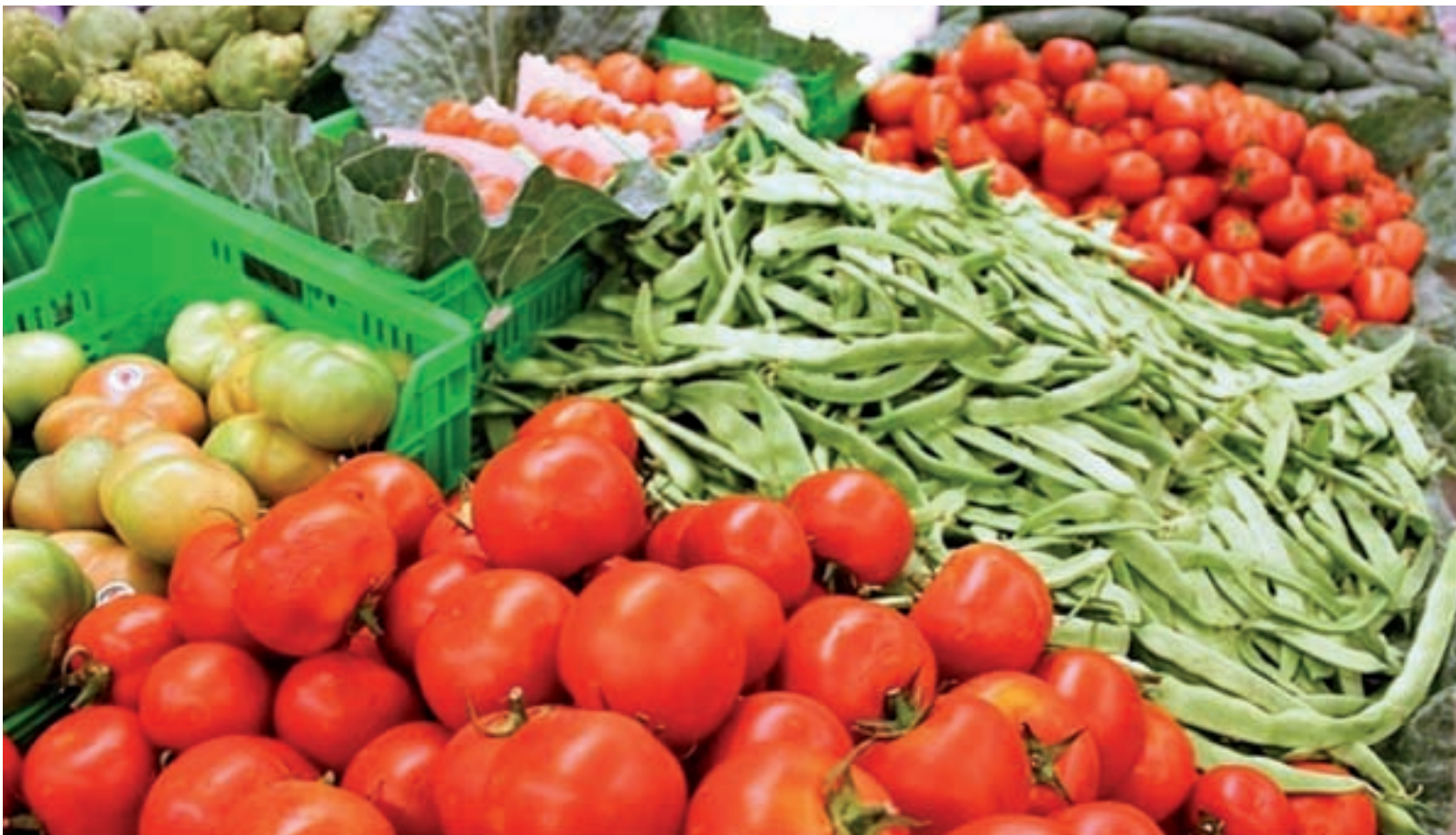
Es bueno empezar el año con un aumento en el consumo de verduras y hortalizas

NUTRICIÓN | CUIDA TU ORGANISMO TRAS LOS EXCESOS