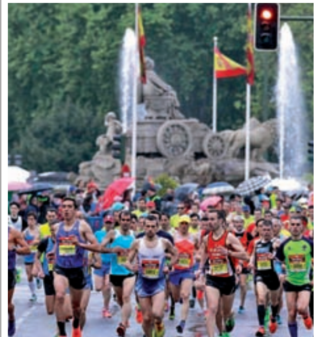
No faltará la cita con el Rock 'N' Roll Madrid Maratón

Hay que destacar que el mes con más actividad será octubre, cuando se disputarán un total de 23 carreras, de las cuales 4 se celebrarán en sábado y una de ellas el jueves 12 con motivo de las Fiestas del barrio del Pilar. El resto, en domingo.