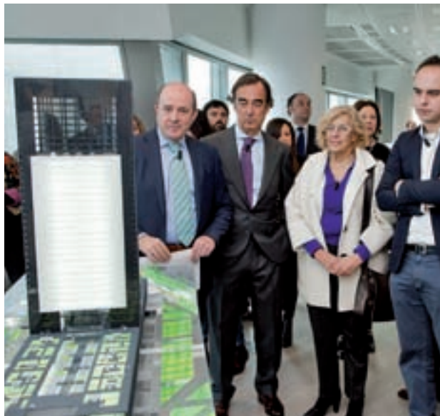
Un momento de la presentación del proyecto

El 'skyline' madrileño cambiará a finales de 2019 cuando previsiblemente acaben las obras de Caleido, la Quinta Torre. Con 36 plantas, 181 metros de altura y una inversión de 300 millones de euros, este nuevo edificio viene a cerrar una de las heridas urbanísticas de la capital y sustituye al fracasado proyecto de un Centro Internacional de Convenciones propuesto en época de Alberto Ruiz-Gallardón.