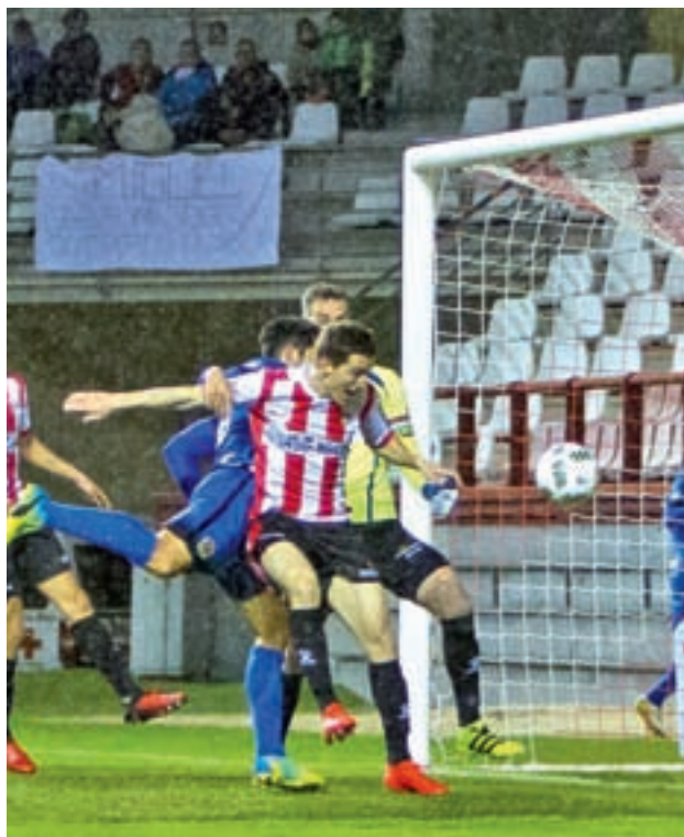
El CF Fuenlabrada, la pasada jornada CF FUENLABRADA

En cuanto a su rival, los de Alfredo Santaelena ocupan una posición delicada. Dos derrotas y un empate en las últimas tres jornadas los han colocado en decimosex-