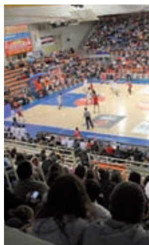
Pabellón Fernando Martín

Desde el Ayuntamiento han asegurado ya existe este