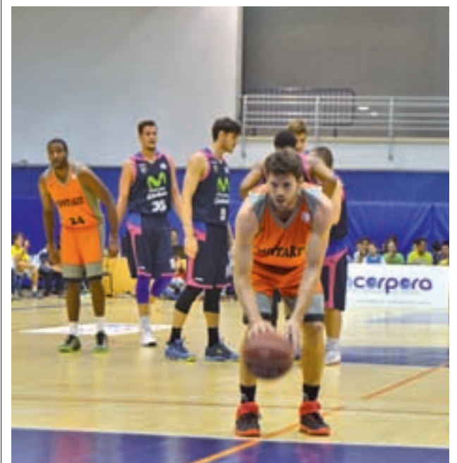
El Montakit, durante un encuentro

El CD Rayo Lorea II se encuentra en una situación complicada. Es colista con 0 puntos. Este sábado 21 de enero se mide al Institución La Salle a domicilio, a partir de las 17 horas.