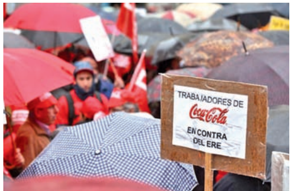
Trabajadores de Fuenlabrada protestando por el ERE GENTE

El alto tribunal confirma el resto de pronunciamientos de la sentencia de octubre de 2015 de la Audiencia Nacional salvo en lo relativo a la inadecuación del procedimiento de ejecución colecti-