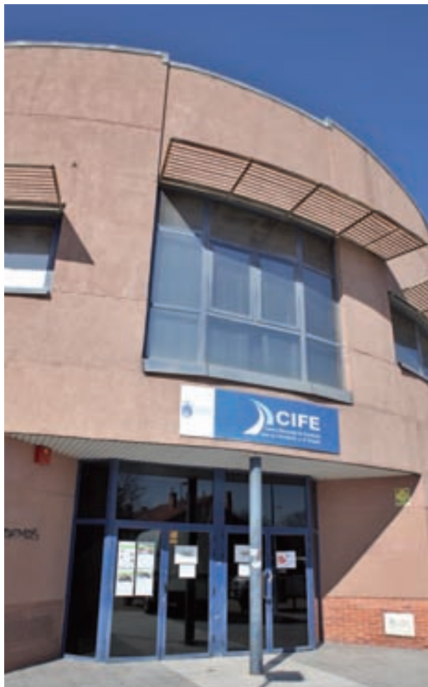
Fachada del CIFE GENTE

María la Real y Barclays, así como por el propio Consistorio, se desarrollará en la sede del CIFE. Según han destacado, no se busca un perfil formativo concreto, sino que podrán participar personas con diferentes niveles de estudios, formación, experiencia y sectores profesionales. "Precisamente buscamos que el equipo sea lo más diverso posible para que los participantes no establezcan una competencia directa entre ellos, sino que colaboren, compartan conocimientos y experiencias para realizar una búsqueda colectiva y solida-