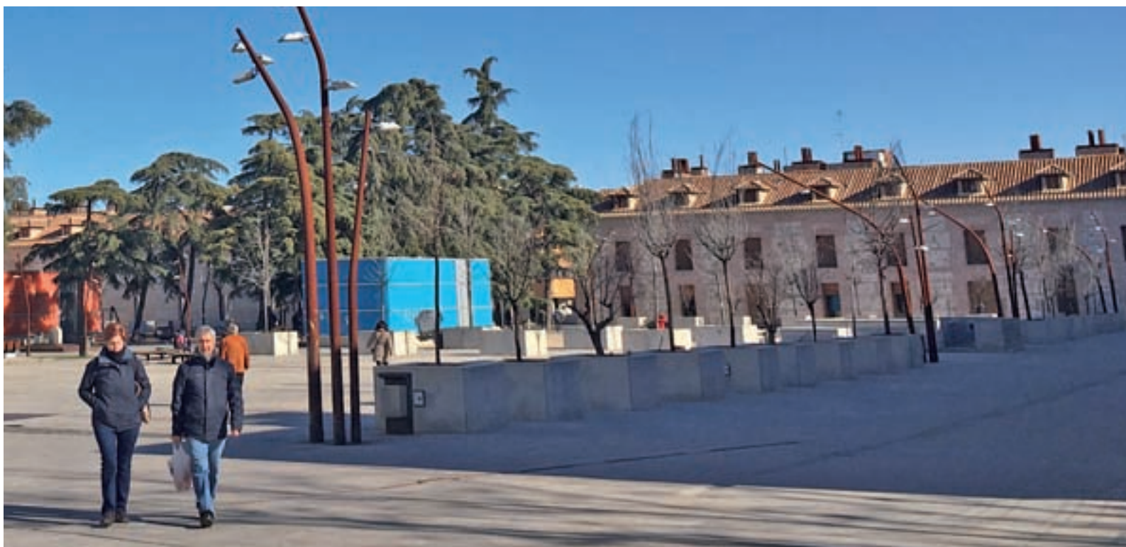
Plaza de España en San Fernando de Henares N.S.