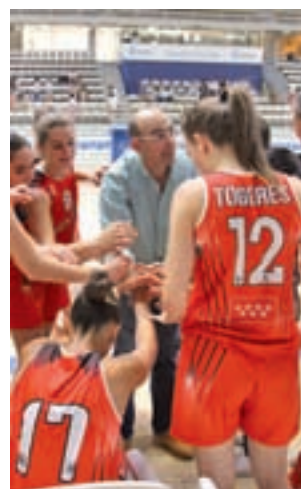
Las chicas del Rivas Ecópolis

ante el Picken Claret por 65-54. Importante victoria en un disputado encuentro, que sirve a las chicas para recuperar sensaciones y les anima a