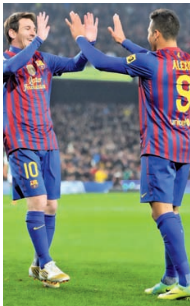
Messi y Alexis, en un partido del curso 2011-2012

gularidades extradeportivas es Alexis Sánchez. El delantero brilla actualmente en el Arsenal londinense, pero antes de iniciar su aventura en la Premier League inglesa, el chileno defendió los colores del Barcelona durante tres temporadas, las comprendidas entre 2011 y 2014. Tres años después de esa etapa, Sánchez ha comparecido por videoconferencia ante un juez esta semana para acabar reconociendo que defraudó casi un millón de euros a Hacienda, aunque esa cifra ya ha sido devuelta a la Agencia Tributaria en un intento del jugador chileno por llegar a un pacto con la Fiscalía que le evite el mal trago de ser juz-