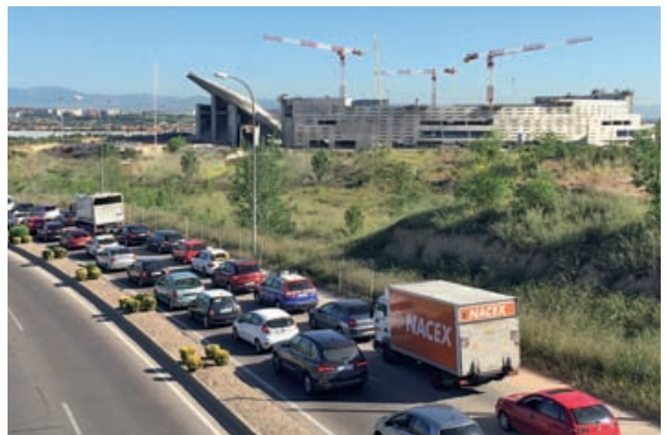
Obras en el nuevo estadio del Atlético de Madrid