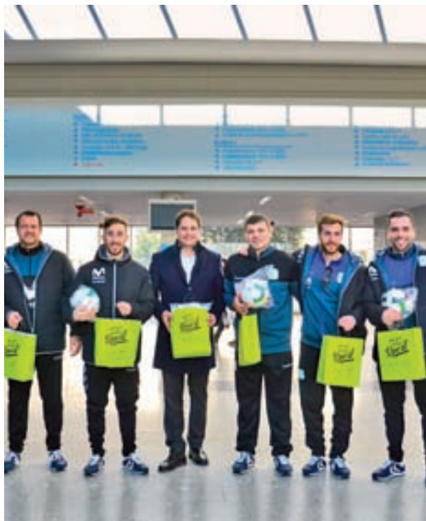
La plantilla en su visita al hospital

Aun así, el Barça sigue un punto por delante en la tabla tras haber ganado al Peñíscola RehabMedic en su último enfrentamiento. Con sólo un punto de diferencia en la clasificación, ambos equipos siguen disputándose el primer puesto, y para ello no