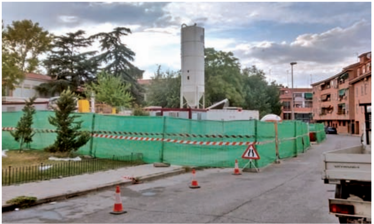
Algunas de las viviendas que han sido dañadas por las obras del Metro

Los principales daños a reparar corresponden a grietas y fisuras que se han producido en fachadas, paredes, techos y suelos, así como otros arreglos en los elementos de carpintería, las ventanas, el alicatados, desajustes de