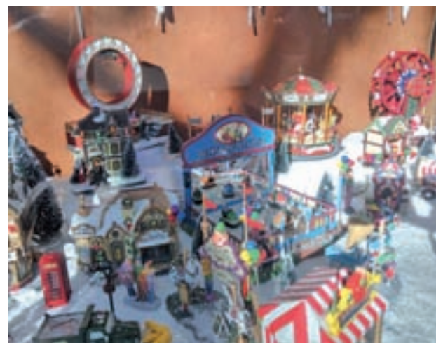
El escaparate ganador

Los requisitos que se han tenido en cuenta a la hora de elegir a los ganadores han sido el atractivo comercial del conjunto del establecimiento, (incluyendo la decoración exterior e interior), la presentación del producto y el diseño e iluminación. El jurado estaba compuesto por representantes de las Asociaciones de vecinos y del Ayuntamiento de San Fernando.