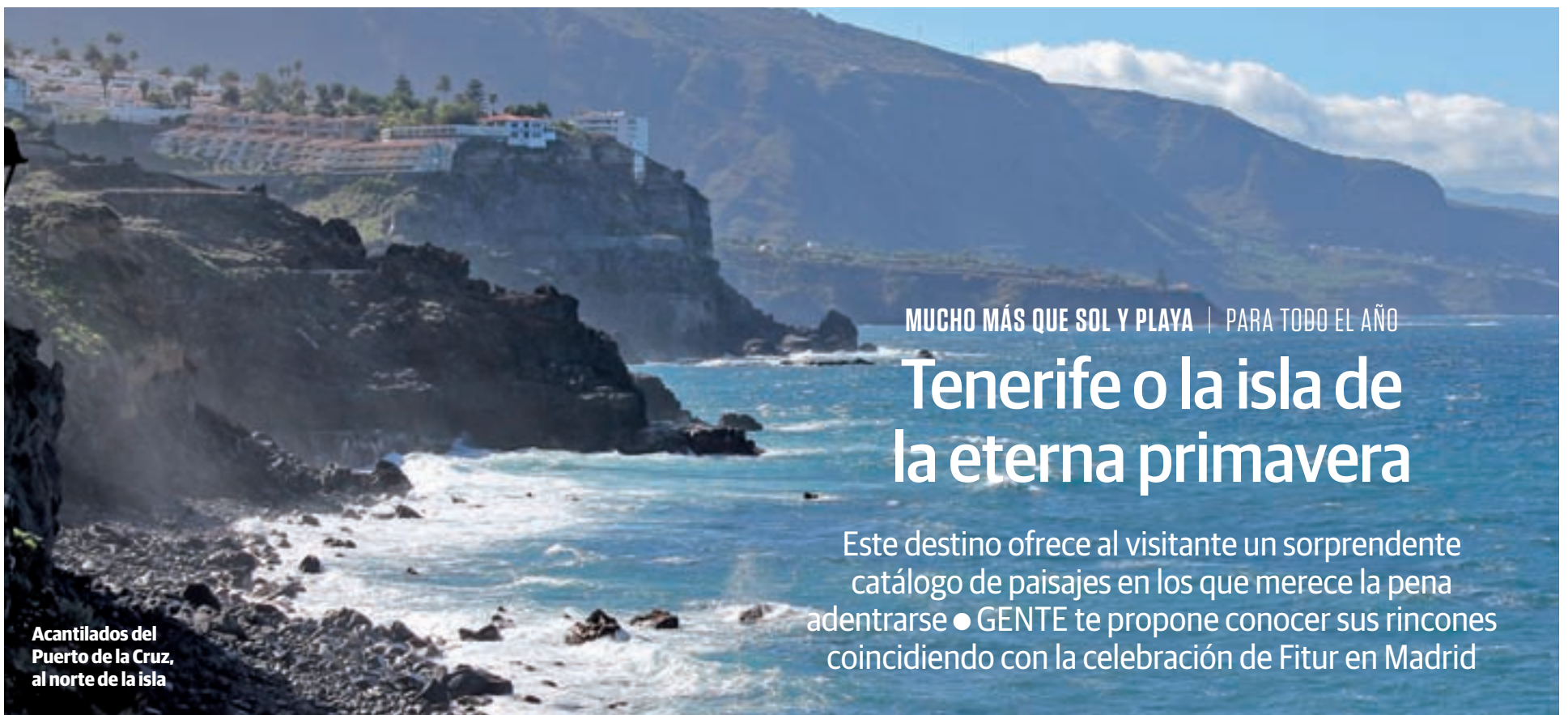
Acantilados del Puerto de la Cruz, al norte de la isla

MUCHO MÁS QUE SOL Y PLAYA | PARA TODO EL AÑO